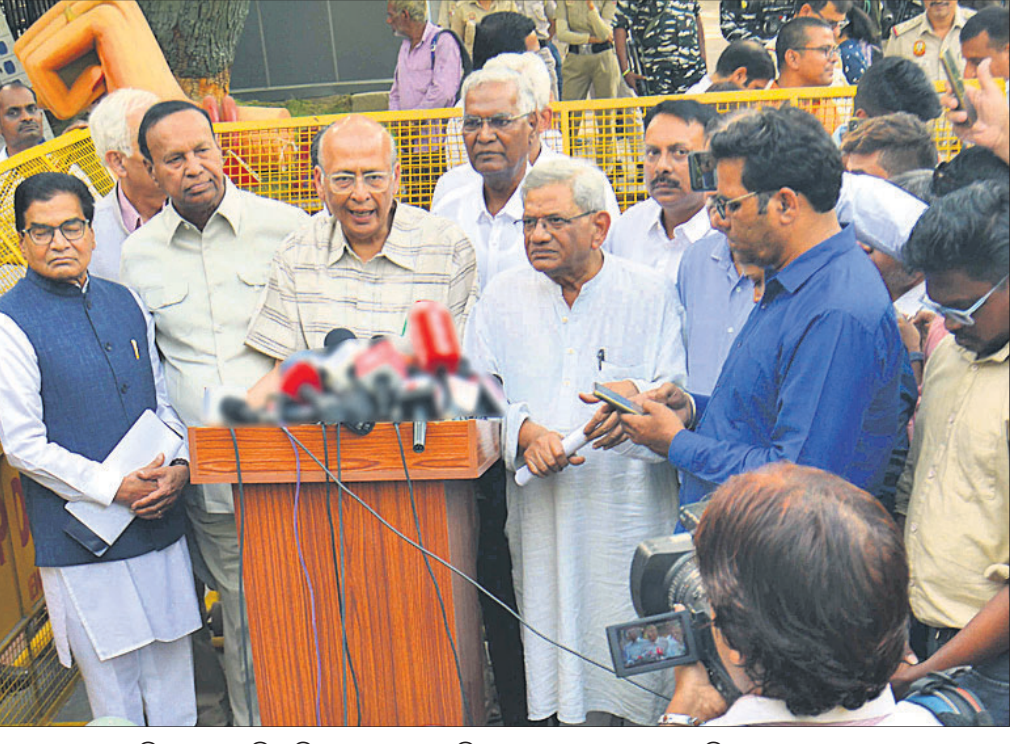
ବରିଷ୍ଠ କଂଗ୍ରେସ ନେତା ଅଭିଷେକ ମନ୍ତୁ ସିଂଘଭିକ୍ ନେତୃତ୍ୱରେ ଇଣ୍ଡିଆ ମେଣ୍ଟର ନେତାମାନେ ରବିବାର ନିର୍ବାଚନ କମିଶନ (ଇସି)କୁ ଭେଟିବା ପରେ ଗଣମାଧ୍ୟମକୁ ସୂଚନା ଦେଇଛନ୍ତି।

ଲୋକ ସଭା ନିର୍ବାଚନ ଭୋଟଗଣତି ପୂର୍ବରୁ ବିରୋଧୀ ବରିଷ୍ଠ କଂଗ୍ରେସ ନେତା ଅଭିଷେକ ମନ୍ତୁ ସିଂଘଭିକ୍ ନେତୃତ୍ୱରେ ଇଣ୍ଡିଆ ମେଣ୍ଟର ନେତାମାନେ ରବିବାର ନିର୍ବାଚନ କମିଶନ (ଇସି)କୁ ଭେଟିଛନ୍ତି।