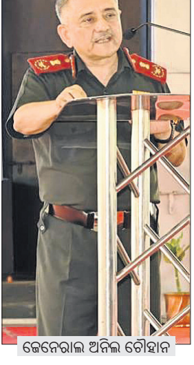
ଜେନେରାଲ ଅନିଲ ଚୌହାନ

ଭାରତର ପ୍ରତିରକ୍ଷା ବିଭାଗ ମୁଖ୍ୟ ଜେନେରାଲ ଅନିଲ ଚୌହାନ ଶନିବାର ଅଗ୍ନିବୀରଙ୍କ ନିମନ୍ତେ ପ୍ରାରମ୍ଭିକ ପ୍ରଶିକ୍ଷଣ କେନ୍ଦ୍ର ପିଆଇଏନ୍ଏସ୍ ଚିଲିକା ପରିଦର୍ଶନ କରିଛନ୍ତି।