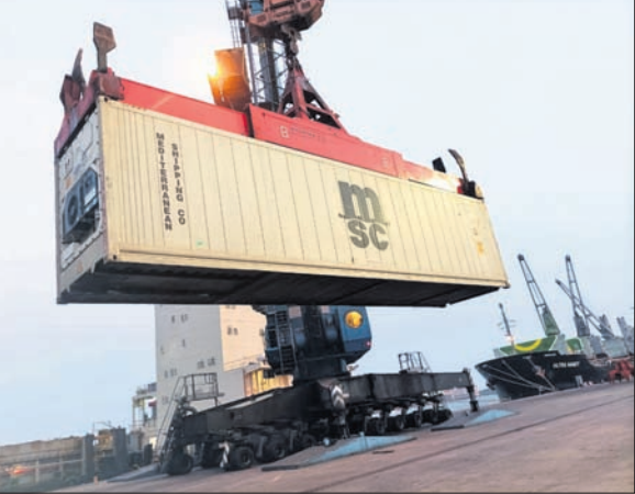
ପାରାଦୀପ ବନ୍ଦର ପିଆଇସିଟି ବର୍ଷରେ ରେଫର କଲେଜର ଖଲାସ କରାଯାଇଛି।

ପାରାଦୀପ ବନ୍ଦର ଉପକୂଳରେ ୨ଟି ସହକର୍ମୀ ସାମଗ୍ରୀ ଚଳିତ ଆର୍ଥିକ ବର୍ଷ ପ୍ରଥମ ଡ୍ରେମାସିକ କାରବାର (ଏପ୍ରିଲ ୧ ରୁ ଜୁନ ୧)ରେ ୨୫ ଏମ୍.ଏମ୍.ଟି (ମିଲିୟନ ମେଟ୍ରିକ୍ ଟନ୍) ପର୍ଯ୍ୟନ୍ତ କାରବାର କରାଯାଇଛି।