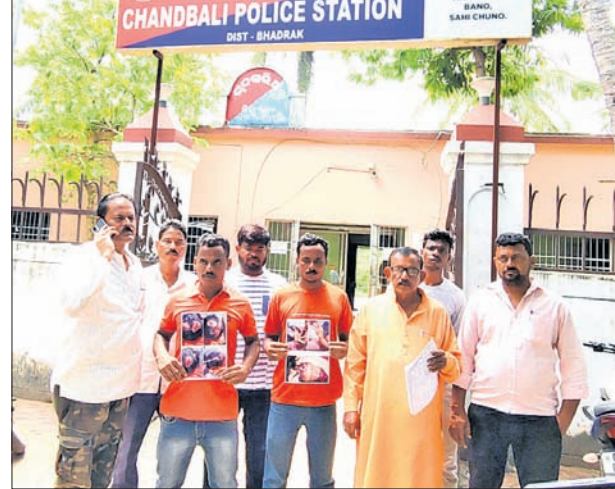
ଚାନ୍ଦବାଲି ଥାନା ସମ୍ମୁଖରେ ଭାଜପା କର୍ମୀମାନେ ।