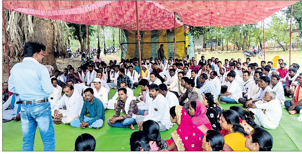
କବିର ଜୟନ୍ତୀ ପାଳନ ନିମନ୍ତେ ପ୍ରସ୍ତୁତି ବୈଠକରେ ଉପସ୍ଥିତ କର୍ମକର୍ତ୍ତା ।