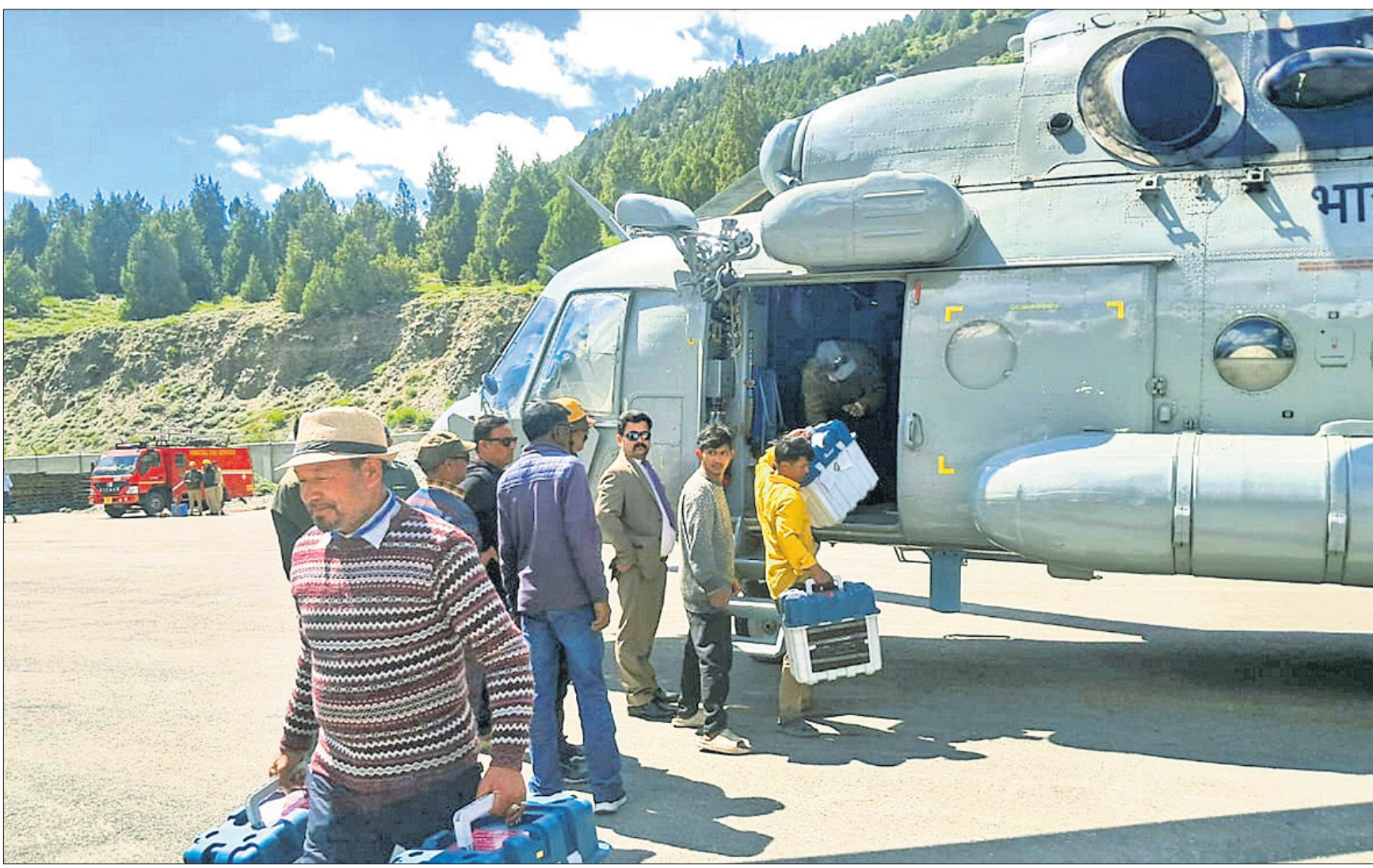
ହିମାଚଳ ପ୍ରଦେଶର ଲାହୋର ଓ ସିତିରେ ମଙ୍ଗଳବାର ହେବାକୁ ଥିବା ଭୋଟ ଗଣତି ପୂର୍ବରୁ ନିର୍ବାଚନ ଅଧିକାରୀମାନେ ଇଭିଏମ୍ ଏବଂ ଅନ୍ୟ ସାମଗ୍ରୀ ଧରି ଯାଉଛନ୍ତି।

ଛତିଶଗଡ଼ ମୁକ୍ତମା ଜିଲ୍ଲା କୋଟା ଅଞ୍ଚଳରେ କେତେକ ଲୋକ ଜଣେ ମହିଳାଙ୍କୁ ଧରି ଚିକିତ୍ସା ପାଇଁ କାଲିମେଳା ସ୍ୱାସ୍ଥ୍ୟକେନ୍ଦ୍ରକୁ ଆଣୁଥିବା ବେଳେ ରାସ୍ତାରେ ତାଙ୍କର ମୃତ୍ୟୁ ହୋଇଯାଇଥିଲା। ତାନ୍ତ୍ରର ଶାନାରେ ପହଞ୍ଚିବା ପରେ ତାନ୍ତ୍ର ତାଙ୍କୁ ମୃତ ଘୋଷଣା କରିବା ସହ କାଲିମେଳା ଥାନାକୁ ଘଟଣା ସମ୍ପର୍କରେ ଜଣାଇଥିଲେ। ପୋଲିସ୍ ଘଟଣାସ୍ଥଳରେ ପହଞ୍ଚି ମୃତଦେହ ବ୍ୟବଚ୍ଛେଦ କରିବା ପାଇଁ କହିବାକୁ ଏହାକୁ କେନ୍ଦ୍ରକରି ତାନ୍ତ୍ରଙ୍କ ସହ ସମ୍ପୃକ୍ତ ମହିଳାଙ୍କୁ ଆଣିଥିବା ଲୋକମାନଙ୍କର ପାଟିଚୁଣ୍ଡ ହୋଇଥିଲା। ଉଭୟଙ୍କ ମଧ୍ୟରେ କିଛି ସମସ୍ୟା ବସତା ହୋଇଥିଲା। ପରେ ତାନ୍ତ୍ର ମୃତଦେହ ବ୍ୟବଚ୍ଛେଦ କରି ସେମାନଙ୍କୁ ହସ୍ତାନ୍ତର କରିଥିଲେ। ପୃଷ୍ଠା-୨