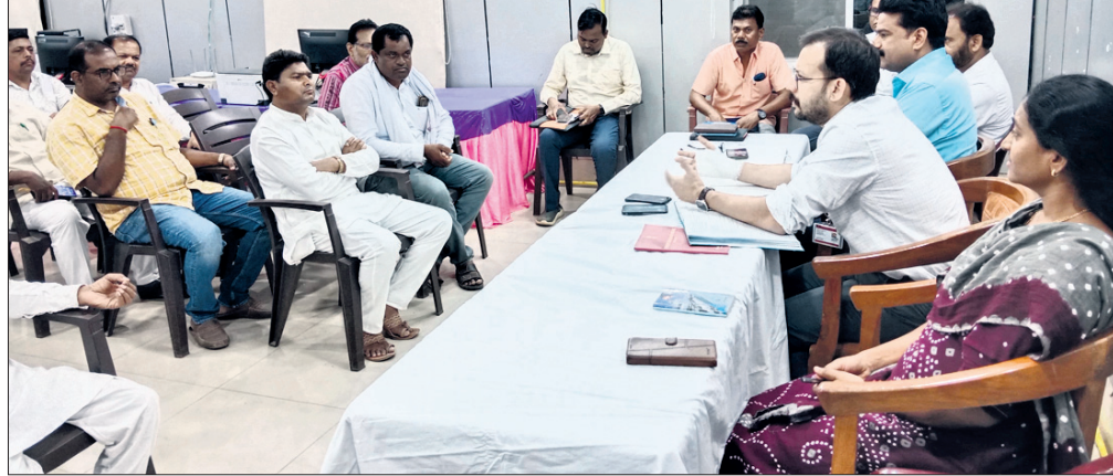
ବୈଠକରେ ଜିଲ୍ଲାପାଳ ଓ ଅନ୍ୟ ଅଧିକାରୀମାନେ ଭୋଟ ଗଣତି ସମ୍ପର୍କରେ ସୂଚନା ଦେଉଛନ୍ତି ।