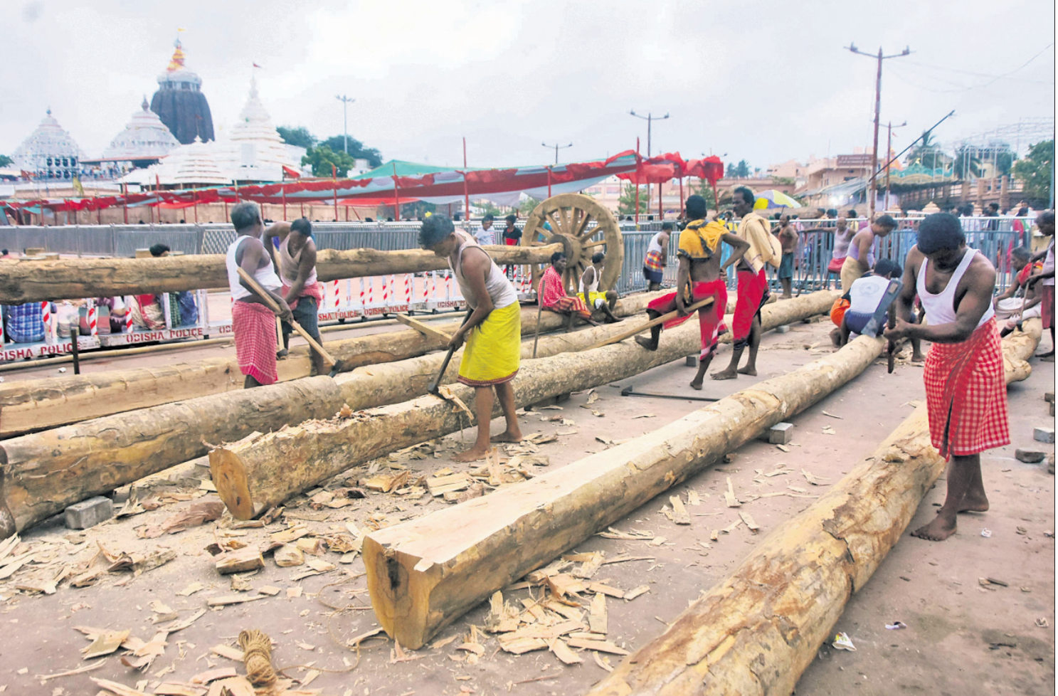
ପୁରୀ ବଡ଼ବାଣ ରଥଖଣ୍ଡରେ ରଥର ଅଞ୍ଚଳ ନିର୍ମାଣ ପାଇଁ କାଠଗୁଡ଼ିକୁ ମହାଉଣା ସେବକମାନେ ଚରପଟ କରୁଛନ୍ତି ।