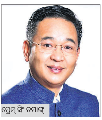
ପ୍ରେମ୍ ସିଂ ତମାଙ୍ଗ

ସିକିମ୍ ନିର୍ବାଚନରେ ଶାସକ ସିକିମ୍ କ୍ରାନ୍ତିକାରୀ ମୋର୍ଚ୍ଚା (ଏସ୍କେଏମ୍) ଏକତରଫା ବିଜୟ ଲାଭ କରିଛି। ରାଜ୍ୟ ବିଧାନସଭାରେ ୩୨ ଆସନ ମଧ୍ୟରୁ ଏସ୍କେଏମ୍ ୩୧ଟି ଦଖଲ କରି ଇତିହାସ ରଚିଛି।