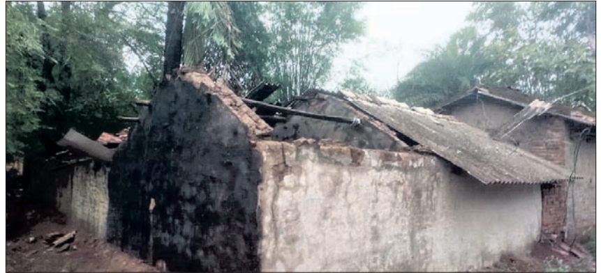
କୋଡ଼ିଜା, ୨୧ (ସମରେନ୍ଦ୍ର ପଟ୍ଟନାୟକ)

ନବରଙ୍ଗପୁର ଜିଲ୍ଲା କୋଷାଗ୍ରମୁତା ବ୍ଲକ ବିଏମ୍ ସେମିଲୀ ପଞ୍ଚାୟତ ଅନ୍ତର୍ଗତ ବାକଟିଗୁଡ଼ାରେ ରବିବାର କାଳବୈଶାଖୀ ପ୍ରଭାବରେ ବ୍ୟାପକ କ୍ଷୟକ୍ଷତି ଘଟିଥିବା ସୂଚନା ମିଳିଛି । ରବିବାର ଅପରାହ୍ନରେ ହଠାତ ଜୋରରେ ପବନ ବହିବା ସହ ଘଡ଼ଘଡ଼ି ସହ ବର୍ଷା ହୋଇଥିଲା । ପ୍ରବଳ ବେଗରେ ପବନ ବହିବା ଯୋଗୁ ଗ୍ରାମର ପ୍ରାୟ ୨୫ରୁ ୩୫ ଲୋକଙ୍କ ଘରର ଛପର ଉଡିଯାଇଥିବା ଦେଖିବାକୁ ମିଳିଛି। ସେହିପରି ୫୦ରୁ ୬୦ରୁ ଗଛ ଉପୁଡି ରାସ୍ତା ଅବରୋଧ ହେବା ସହ ସୂଚନା ମିଳିଛି। ଏଥିସହ କୁଆପଥର ମାଡ଼ ଯୋଗୁ ମକା ଫସଲ, ପନିପରିବା ଗଣ ନଷ୍ଟ ହୋଇଯାଇଥିବା ସୂଚନା ମିଳିଛି । କାଳବୈଶାଖୀ ଯୋଗୁ ୨୫ ଗରିବ ପରିବାର ବହୁ ଖୋଜାଖୋଜି ପରେ ମଧ୍ୟ ମାନସଙ୍କ କୌଣସି ସନ୍ଦାନ ମିଳିନାହିଁ। ଏନେଇ ସନାତନ ଦିଗପହଣ୍ଡି ଥାନାରେ ଏତଲା ଦେବାପରେ ପୋଲିସ୍ ନଂ. ୨୩୨/୨୪ରେ ମାମଲା ରୁଜୁ କରି ତଦନ୍ତ ଚଳାଇଛି।