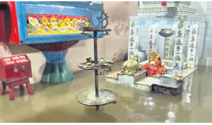
କଟକ ଚଣ୍ଡୀମନ୍ଦିର ପରିସରରେ ବର୍ଷାଜଳ।