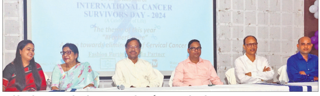
ଏସ୍‌ସିବି ମେଡିକାଲ ପୁରୁଣା ଅତିଗୋରିୟମଠାରେ ଆୟୋଜିତ କାର୍ଯ୍ୟକ୍ରମରେ ଉପସ୍ଥିତ ଅତିଥିବୃନ୍ଦ।