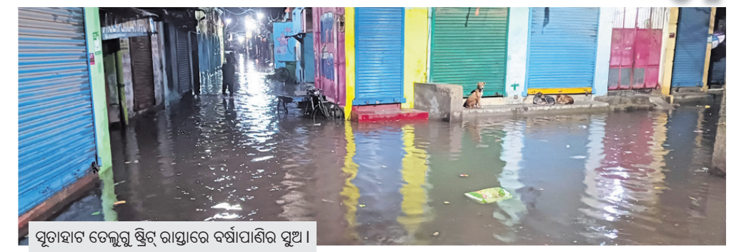
ପୁରୀହାଟ ଟେଲୁଗୁ ଷ୍ଟ୍ରିଟ୍ ରାସ୍ତାରେ ବର୍ଷାପାଣିର ସୁଅ।

ଚାଲୁଥିବା ଦେଖିବାକୁ ମିଳିଛି। ସେହିପରି କଟକ ଚଣ୍ଡୀମନ୍ଦିର ପରିସର ଜଳମଗ୍ନ ହୋଇଥିବାବେଳେ ମା'ଙ୍କ ଗର୍ଭଗୃହ ପର୍ଯ୍ୟନ୍ତ ପାଣି ଯାଇଥିବା ଦେଖିବାକୁ ମିଳିଛି। ରିପୋର୍ଟ ଲେଖାଯିବାବେଳକୁ ବିଭିନ୍ନ ସ୍ଥାନରେ ଜଳ ନିଷ୍କାସନ ପାଇଁ ସିଏମ୍‌ସି ପକ୍ଷରୁ ପକ୍ଷ ବ୍ୟବସ୍ଥା କରାଯାଇ ନ ଥିବା ଜଣାପଡ଼ିଛି। ସେହିପରି ବର୍ଷା ଯୋଗୁ ସହରର ବିଭିନ୍ନ ସ୍ଥାନରେ ବିଦ୍ୟୁତ୍ ନ ଥିବାରୁ ଲୋକମାନେ ଅଧୀରରେ ରହିଥିଲେ।