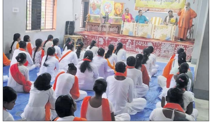
ପ୍ରଶିକ୍ଷଣ ଶିବିରରେ ଯୋଗଦେଇଥିବା ଦୁର୍ଗାବାହିନୀର ସଦସ୍ୟା ଓ ଅନ୍ୟମାନେ।

ବାହାରେ ପୋଲିସ୍ ରହିବେ। ସେହିପରି ଭୋଟ ଗଣତି ହଲ୍ ଭିତର ଓ ଇଭିଏମ୍ ନେବା ଆଣିବା ସମୟରେ କେନ୍ଦ୍ରୀୟ ଫୋର୍ସ୍ ରହିବେ।