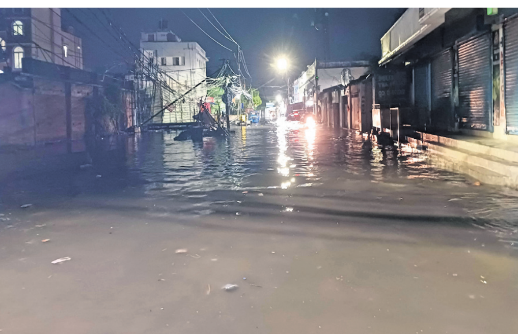
ମେରିଆ ବଜାର ଅଞ୍ଚଳ ରାସ୍ତାରେ ବର୍ଷାପାଣିର ସୁଅ।