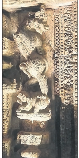
କୋଣାର୍କରେ ନିର୍ମିତ ଆଡ଼ିବିଂହ (ପ୍ରତ୍ୟେକ କୋଟିରାଜ ମହାତ୍ମ)

ନାହିଁ। ବାର ବରଷର ବାଳୁତ ପିଲା... ଜନଶ୍ରୁତି ଏକ କୁହେଲିକା। ସେ ପୁଣି ମାରିବା ଘଟଣାର ଚିକିତ୍ସା ବର୍ଣ୍ଣନା ଆମେ ପୂର୍ବ ଆଲୋଚନା କରିଥିଲୁ। ସେଥିପାଇଁ ଅନେକ ପ୍ରମାଣ ମଧ୍ୟ 'ବାୟାବଦ୍' ଯୋଡ଼ି ସାଧାରଣରେ ଉପସ୍ଥାପନ କରିଥିଲୁ। ଧର୍ମପଦଙ୍କ 'ବୋଉ' ମନ୍ଦିର ଉପରେ ନାକଟଣା କଳସ ବସିବା ବେଳେ କୋଣାର୍କକୁ ଆସିଥିଲେ ଓ ସମ୍ପାନର ସହିତ ହାତରେ ବସି ଗାଁକୁ ଫେରିଯାଇଥିଲେ। ପୋଥି ଆଧାରରେ ଏକଥା ଉପସ୍ଥାପନ କରିବାର ଅର୍ଥ- ଧର୍ମପଦଙ୍କର ହରିପ୍ରସି ହୋଇଥିଲେ ବୋଉ ଚାଳର ପୁଣିମରା ପରେ କଳସ ବସିବା ବେଳକୁ ଦେଖିବାକୁ ଆସିଥାନ୍ତେ କି? ଗତ ସଂଖ୍ୟାରେ ଲେଖିଥିଲୁ- ମହା ଭାସ୍କରଙ୍କର ଏକ ବସିବା ବିଗ୍ରହ ଶିବେଇ ସାନ୍ତରା ଶିବିରରେ ନିର୍ମାଣ ଚାଲିଥିଲା। ନିଜେ ଶିବେଇ ତାହାର ଦାୟିତ୍ୱରେ ଥିଲେ। ଗଜପତି ସାମ୍ରାଜ୍ୟରୁ ସିଧା ଆସି କୋଣାର୍କରେ ପହଞ୍ଚି ମହାଭାସ୍କରଙ୍କ ବିଗ୍ରହ ଦେଖିବାକୁ ଯାଇ ଶ୍ରୀଫଳତ୍ୟ ଭାଙ୍ଗିଥିଲେ ମଙ୍ଗଳ କାମନା କରି। ସେତେବେଳେ ଶିବେଇ ସାନ୍ତରା ଶିବିରରେ ଧର୍ମପଦ ଥିଲେ। ଏହି ବର୍ଣ୍ଣନା ଯୋଡ଼ିରେ ଅଛି। ପୋଥିର ବିବରଣୀ ଲେଖା ଚାଲିଥିବାବେଳେ କ୍ରମାଗତ ଭାବରେ ତାହାର ଏକ ନକଲ ହୋଇଥିଲା। ସେ ନକଲକୁ ଗୋଟିଏ ଗୋଟିଏ ପରିଚ୍ଛେଦ ଭଳି କରି ଗଜପତିଙ୍କ ନିକଟକୁ କ୍ରମାଗତ ଭାବରେ ପଠାଯାଉଥିଲା। ଗଜପତି ବିଦ୍ୟାନାଥୀ ନଅରରେ ଥିବାବେଳେ ଅଧିକାରୀ ନକଲ ଯାଇଛି। ସେ ପଢ଼ିଛନ୍ତି।