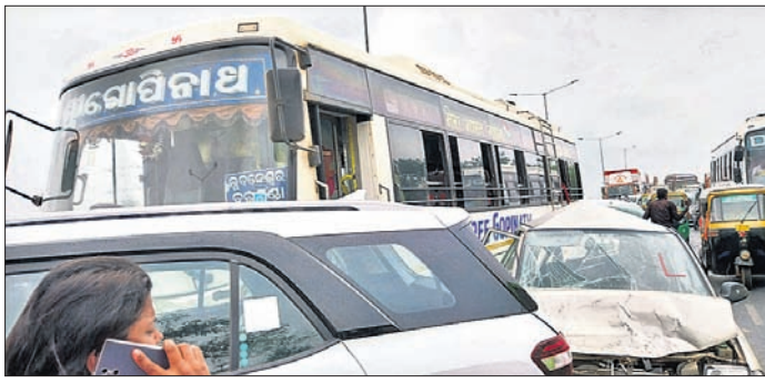
ସିରିଜ୍ ଦୁର୍ଘଟଣାରେ କ୍ଷତିଗ୍ରସ୍ତ ଦୁଇ କାର। ଦୁର୍ଘଟଣା ଘଟାଇଥିବା ବସ।