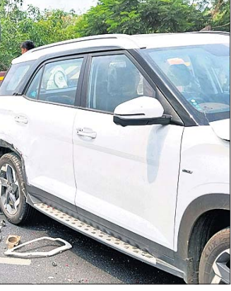
ସିରିକ୍ ଦୁର୍ଘଟଣାରେ କ୍ଷତିଗ୍ରସ୍ତ ହୋଇଥିବା କାର୍।