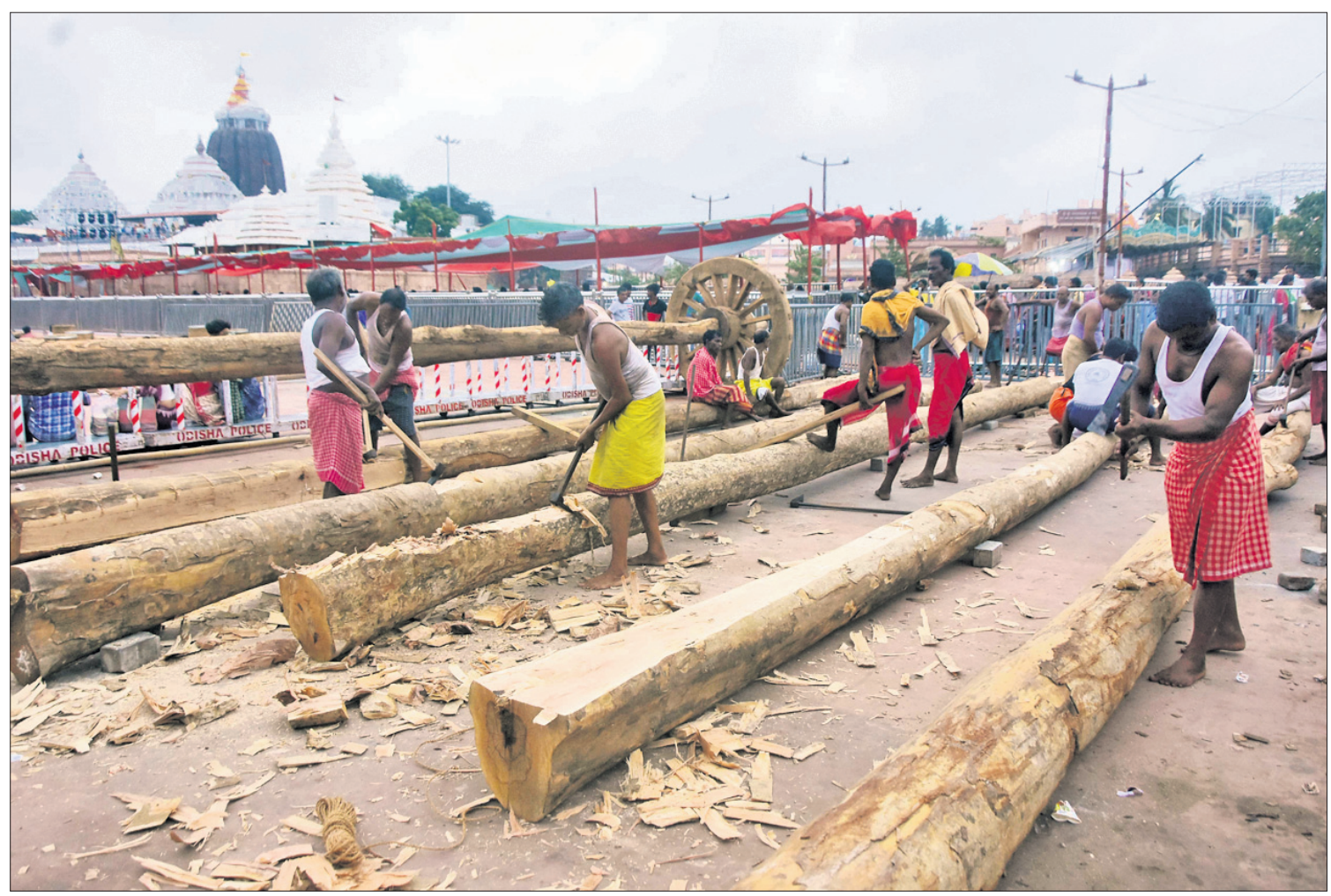
ପୁରୀ ବଡ଼ଦାଣ୍ଡ ରଥଖଳାରେ ରଥର ଅଣ ନିର୍ମାଣ ପାଇଁ କାଠଗୁଡ଼ିକୁ ମହାରଣା ସେବକମାନେ ଚଉପଟ କରୁଛନ୍ତି। (ଫଟୋ: ଯଜ୍ଞେଶ୍ୱର ମହାନ୍ତି)