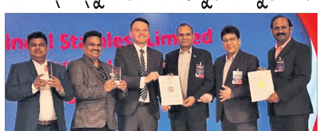
ଭୁବନେଶ୍ୱର, ୨୬ (ଅଭୟ ଦାଶ)

ଜିଏଲ୍ ସ୍ପେନଲେସ୍ ଲିମିଟେଡ୍ (ଜେଏସ୍ଏଲ୍)କୁ ନିକଟରେ ଆଉ ଏକ ଅନ୍ତର୍ଜାତୀୟ ସୁରକ୍ଷା ପୁରସ୍କାର ଦିଆଯାଇଛି। ଉଲ୍ଲେଖଯୋଗ୍ୟ, ବ୍ରିଟିଶ୍ ସେପ୍ଟି କାଉନସିଲ୍ ପକ୍ଷରୁ ଜେଏସ୍ଏଲ୍କୁ କ୍ରମାଗତ ୫ମ ବର୍ଷ ପାଇଁ 'ମେରିଟ୍' ବର୍ଷରେ ଏହି ପୁରସ୍କାର ପ୍ରଦାନ କରାଯାଇଛି। ବିଶେଷ କରି କମ୍ପାନୀର ସୁରକ୍ଷା ଓ ସୁରକ୍ଷା ପୁରସ୍କାର (ପ୍ଲସ୍)