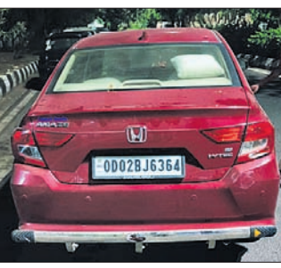
ପୋଲିସ୍ ଜବତ କରିଥିବା ଦୁଇ କାର।