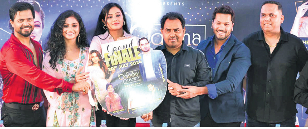
ଓଡ଼ିଶା ଜୁଲନ୍ଦର ଚତୁର୍ଥ ସଂସ୍କରଣ ସମ୍ପର୍କରେ ସୂଚନା ଦିଆଯାଇଛି।

ଆର୍ ଆର୍ ଇଭେଣ୍ଟ୍ସ ପକ୍ଷରୁ ଓଡ଼ିଶା ଜୁଲନ୍ଦର ଚତୁର୍ଥ ସଂସ୍କରଣ ଆସନ୍ତା ଜୁଲାଇ ୨୦ରେ ଅନୁଷ୍ଠିତ ହେବ। ଏଥରର ପୁଷ୍ପ ଆକର୍ଷଣ ରହିଛି ବିଲିଭ୍ ଅଭିନେତ୍ରୀ ମାଲିକା ଆରୋରା। ଏହା ପୂର୍ବରୁ ଓଡ଼ିଶାର ବିଭିନ୍ନ ଅଞ୍ଚଳରେ ପ୍ରତିଯୋଗୀଙ୍କ ପାଇଁ ଅଭିନେତ୍ରୀ ଅନୁଷ୍ଠିତ ହେବ। ବ୍ରହ୍ମପୁରରେ ଜୁନ ୧୯, ବାଲେଶ୍ୱରରେ ଜୁନ ୨୨, ରାଉରକେଲାରେ ଜୁନ ୨୮, ସମ୍ବଲପୁରରେ ଜୁନ ୩୦ରେ, କଟକରେ ଜୁଲାଇ ୩ ଏବଂ ଭୁବନେଶ୍ୱରରେ ଜୁଲାଇ ୫ ଦିନ ଅଭିନେତ୍ରୀ ହେବ। ୧୮ ରୁ ୨୮ ବର୍ଷ ପର୍ଯ୍ୟନ୍ତ ଔପାନେ ଏହି ପ୍ରତିଯୋଗିତାରେ ଅଂଶ ଗ୍ରହଣ କରିପାରିବେ। ବିଭିନ୍ନ ପର୍ଯ୍ୟାୟରେ ପ୍ରତିଯୋଗିତା ହେବା ପରେ ସର୍ବଶ୍ରେଷ୍ଠ ୨୦ଜଣ ପ୍ରତିଯୋଗିନୀ ପାଇଲାଇ ମଞ୍ଚରେ ପ୍ରଦେଶ କରିବେ। ଶ୍ରେଷ୍ଠ ପ୍ରତିଯୋଗିନୀ