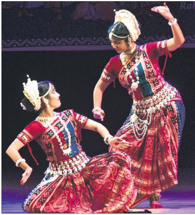
ନୃତ୍ୟାଞ୍ଜଳି ୩୨ତମ ମହୋତ୍ସବ ଓ ସମ୍ବର୍ଦ୍ଧନା ପର୍ବର ଉଦ୍‌ଯାପନା ଅବସରରେ ରବିବାର ରାତ୍ରୀମୁଖ୍ୟପରେ ଅନୁଷ୍ଠାନର ଶିଳ୍ପୀମାନେ ନୃତ୍ୟ ପରିବେଷଣ କରୁଛନ୍ତି।