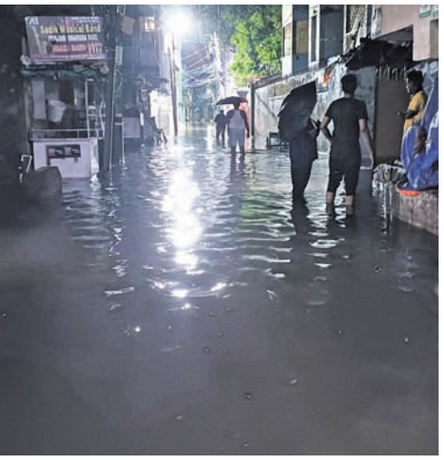
ମକରବାଗ ସାହି ରାସ୍ତାରେ ବର୍ଷାପାଣି।