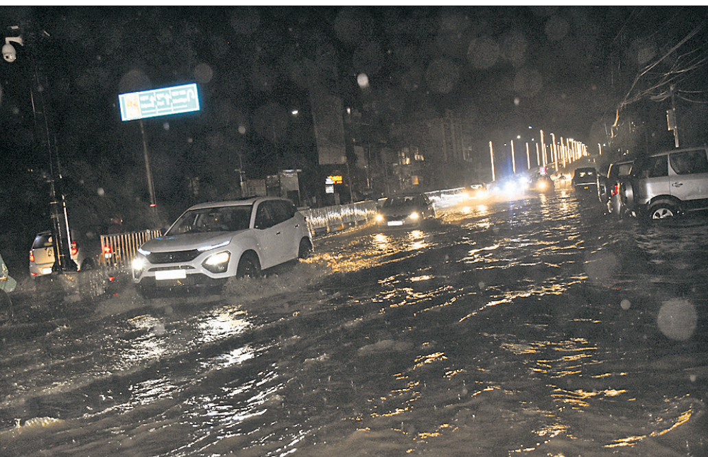
ଏସ୍‌ପ୍ଲାନେଡ୍ ମଲ୍ ସମ୍ମୁଖ ରସୁଲଗଡ଼-ବିମିଆଲ ରାସ୍ତାରେ ଆଶୁ୍ୟ ଉଚ୍ଚର ବର୍ଷା ପାଣିର ସୁଅ।