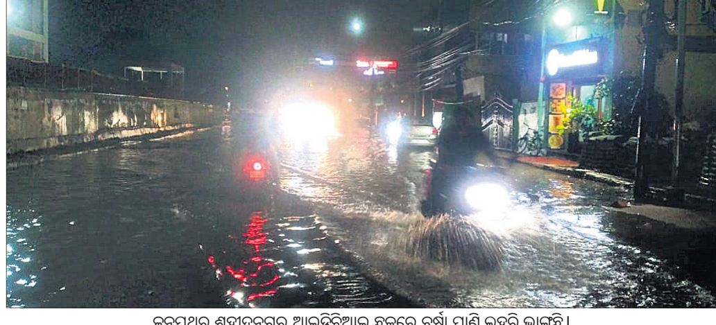
ଜନପଥର ଶହାଦନଗର ଆଇଡିଆଲ ଛକରେ ବର୍ଷା ପାଣି ଲହରୀ ଭାଙ୍ଗିଛି।

ପବନରେ ବିଭିନ୍ନ ସ୍ଥାନରେ ଗଛ ଢାଳ ଭାଙ୍ଗିପଡ଼ିଥିଲା। ପବନ ମାତରେ ଆମ ଓ ପଶ୍ୟ ଗଦା ହୋଇଥିବା ଦେଖିବାକୁ ମିଳିଥିଲା। ଏହି କାଳବୈଶାଖୀ ପାଇଁ ଘଡ଼ଘଡ଼ି ପ୍ରଭାବରେ ଲୋକଙ୍କ ଘରବାହୁ ଅଧିକାଂଶ ବର୍ଷା ପଡ଼ିଥିବାବେଳେ ବର୍ଷା ଅନ୍ଧାର ହୋଇପଡ଼ିଥିଲା। ଘର ଭିତରେ ଗୁଲୁଗୁଲିରେ ଲୋକମାନେ ଅତିଷ୍ଟ ହୋଇପଡ଼ିଥିଲେ। ପ୍ରାୟ ୨ ଘଣ୍ଟାକୁ ଅଧିକ ସମୟ ଧରି ଲଗାତାର ବର୍ଷା ହେବା ଫଳରେ ବିଭିନ୍ନ ସ୍ଥାନ ଜଳମଗ୍ନ ହୋଇଥିବା ଦେଖିବାକୁ ମିଳିଥିଲା। ଚନ୍ଦ୍ରଶେଖରପୁର, ରସୁଲଗଡ଼, ଜିଲିପି କଲୋନୀ ସମେତ ବିଭିନ୍ନ ସ୍ଥାନରେ ଆଶୁ୍ୟ ଉଚ୍ଚର ପାଣିପୁଅ ଛୁଟିଥିଲା।