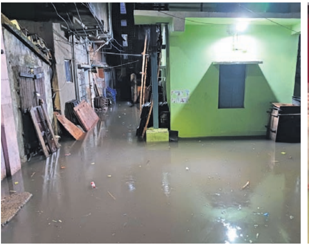
ପଟାପୋଲ ଅଞ୍ଚଳରେ ଜମି ରହିଥିବା ବର୍ଷାପାଣି।

ସାମ୍ରାଜ୍ୟବାଦୀ ଇସ୍ରାଏଲର ପାଲେଷ୍ଟାଇନରେ ଗଣହତ୍ୟା ବନ୍ଦ, ଦୀର୍ଘ ସ୍ଥାୟୀ ଶାନ୍ତି ପ୍ରତିଷ୍ଠା, ପାଲେଷ୍ଟାଇନକୁ ରାଷ୍ଟ୍ର ମାନ୍ୟତା ଦାବିରେ ରବିବାର ଭାରତରେ ଗଣ ପ୍ରତିବାଦ କରାଯାଇଛି। ଏହି କ୍ରମରେ ଭୁବନେଶ୍ୱରରେ ବାମପନ୍ଥୀ ଧର୍ମନିରପେକ୍ଷ ଦଳଗୁଡ଼ିକ ପକ୍ଷରୁ ଧାରଣା ଦିଆଯାଇ ଗଣପ୍ରତିବାଦ କରାଯାଇଥିଲା। ଏହି ପ୍ରତିବାଦ ସଭାରେ ଭାରତ ସରକାର ତୁରନ୍ତ ଜାତିସଂଘ ସାଧାରଣ ପରିଷଦରେ ପାଲେଷ୍ଟାଇନକୁ ସାର୍ବଭୌମ ରାଷ୍ଟ୍ର ମାନ୍ୟତା ପ୍ରଦାନ, ସ୍ଥାୟୀ ଶାନ୍ତି ପ୍ରତିଷ୍ଠା ନିମନ୍ତେ ସହମତି ପ୍ରକାଶ ପାଇଁ ଦାବି କରାଯାଇଥିଲା। ସିପିଆଇ, ସିପିଆଇ(ଏମ୍), ସିପିଆଇ(ଏମ୍‌ଏଲ) ଲିବରେଶନ, ପରାସ୍ପର୍ତ୍ତ ଦଳ, ସମାଜବାଦୀ ପାର୍ଟିର ବିଶିଷ୍ଟ ନେତୃତ୍ୱ ସହି ଗଣଧାରଣାରେ ସାମିଲ ହୋଇଥିଲେ।