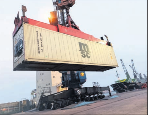
ପାରାଦୀପ ବନ୍ଦର ପିଆଇସିଟି ବର୍ଷରେ ରେଫରର କଣ୍ଠେନର ଖଲାସ କରାଯାଇଛି।

ପାରାଦୀପ ବନ୍ଦର ରବିବାର ୨ଟି ସଫଳତା ହାସଲ କରିଛି। ଚଳିତ ଆର୍ଥିକ ବର୍ଷର ପ୍ରଥମ ଡ୍ରେମାସିକ କାରବାର(ଏପ୍ରିଲ ୧ ରୁ ଜୁନ ୧)ରେ ୨୫ ଏମ୍‌ଏସ୍‌ଟି (ମିଲିୟନ ମେଟ୍ରିକ୍ ଟନ୍)ପର୍ଯ୍ୟନ୍ତ କାରବାର କରିଛି। ପକ୍ଷରେ ପୂର୍ବବର୍ଷ ସୁଲଭାରେ ଏହି କାରବାରରେ ୫.୫୧% ଅଭିବୃଦ୍ଧି ଘଟିଛି ବୋଲି ବନ୍ଦର ପ୍ରଶାସନ ପକ୍ଷରୁ ଜଣାଯାଇଛି। ଏହି ସଫଳତା ଦେଖି ବୃହତ୍ ବନ୍ଦରକୁଳ ମଧ୍ୟରେ ସର୍ବାଧିକ। ଏପରି ସଫଳତା ପାଇଁ ବନ୍ଦର ଅଧ୍ୟକ୍ଷ ପି.ଏଲ.ସାହାୟ