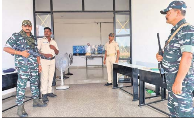
ରେଭେନ୍‌ସା ବିଶ୍ୱବିଦ୍ୟାଳୟ ମହାନଦୀ କ୍ୟାମ୍ପସରେ ହୋଇଥିବା ସୁରକ୍ଷା ପୋଲିସ୍ କରି ରହିଛି।