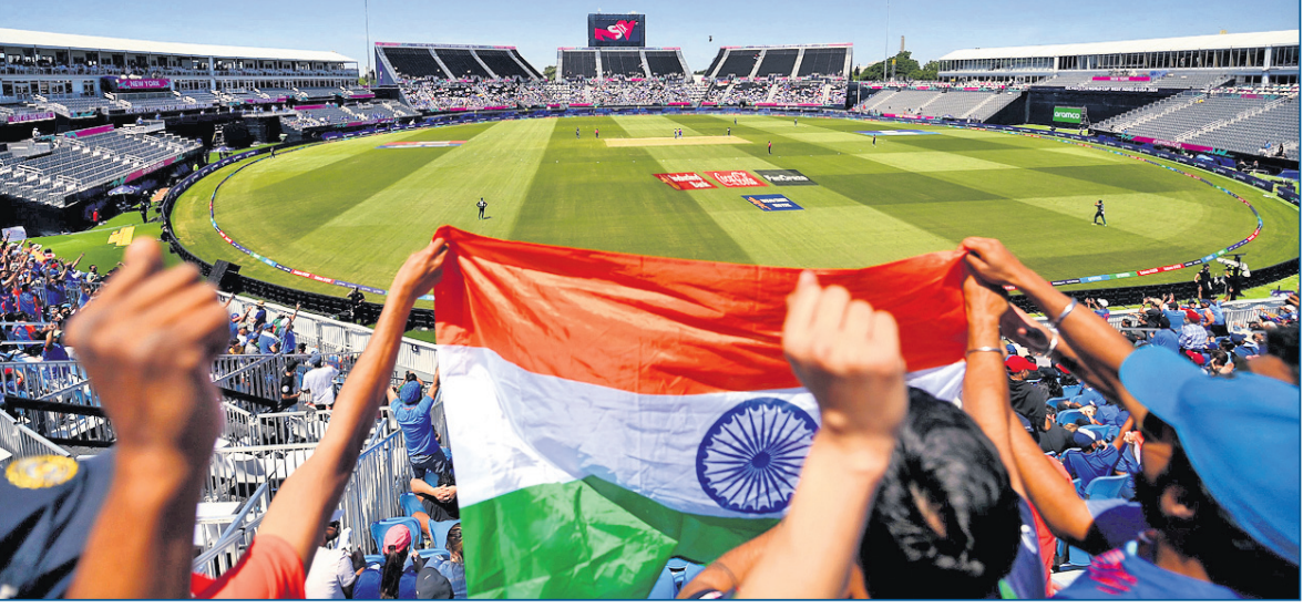
ଭାରତ-ଆୟର୍ଲାଣ୍ଡ ମ୍ୟାଚ ପାଇଁ ପ୍ରସ୍ତୁତ ଲ୍ୟୁକ୍ସରୀ ନାସାଉ କାଉଣ୍ଡି ଗ୍ରାଉଣ୍ଡ।

ଲ୍ୟୁକ୍ସରୀ, ୪୧୭ ଚଳିତ ଚମ୍ପ ଇଣ୍ଡିଆର ଅଭିଯାନ ଗୁଡ଼ିକର ଆରମ୍ଭ ହେବ। ଚମ୍ପ ଇଣ୍ଡିଆର ପ୍ରଥମ ପ୍ରତିଦ୍ୱନ୍ଦ୍ୱ ହେଉଛି ଆୟର୍ଲାଣ୍ଡ। ଚମ୍ପ କମିନେଶନ ସଭାଦ୍ୱାରା ଭାରତର ପ୍ରଥମ ଲକ୍ଷ୍ୟ ହେବ। ବିରାଟ କୋହଲି ଓ ରୋହିତ ଶର୍ମାଙ୍କ ପରି ଖେଳାଳି ବିଶ୍ୱକପ ଚମ୍ପ ଧରି ସାରିଛନ୍ତି। ଯଶପ୍ରୀତ୍ କୁମ୍ଭାରା ଓ ରବୀନ୍ଦ୍ର ଜାଡେଜାଙ୍କ ସମେତ ଅନ୍ୟ ସମସ୍ତ ଖେଳାଳି ଏଥପାଇଁ ବ୍ୟଗ୍ର ଅଛନ୍ତି। ଭାରତୀୟ କ୍ରିକେଟ ଦଳ ୧୯୮୨ ଓ ୮୬ ଫିଫା ବିଶ୍ୱକପରେ ବ୍ରାଜିଲ ଦଳ ଭଳି ଦଶା ଭୋଗିବାକୁ କେବେ ଚାହେଁ ନାହିଁ। ସେତେବେଳେ ସୋନାମୋୟା, ଜିକୋ, କାରୋକା, ଫାଲକାଓ ଓ ଆଲେମେକ ପରି ତାରକା ଖେଳାଳି