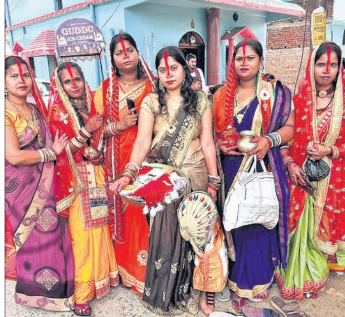
ରାଜରକେଲା, ୬୬(ବିନେଶ ମିଶ୍ର)

ରାଜରକେଲା ସହରରେ ସାବିତ୍ରୀ ବ୍ରତ ପାଳନ ପରିସରରେ ଥିବା ବରଗଛ ପୂଜାକୁ ନେଇ ବିଭିନ୍ନ ମନ୍ଦିରରେ ଭିତ ଦେଖିବାକୁ ମିଳିଛି। ସାବିତ୍ରୀ ଅମାବାସ୍ୟା ଓ ସ୍ୱାମୀଙ୍କ ଦୀର୍ଘାୟୁ କାମନା କରି ବହୁ ବହୁ ଗ୍ଲାନରେ ମହିଳାମାନେ ଏକତ୍ର ବ୍ରତଧାରୀ ମହିଳାମାନେ ରାଜରକେଲା ସହରର ବାସନ୍ତୀ କଲୋନୀ ସ୍ଥିତ ବରଗଛ ପୂଜା ମନ୍ଦିର, ରେଲୱେ କଲୋନୀ କାଳିମନ୍ଦିର, ହନୁମାନ ବାଟିକା ଭଳି ଏକାଧିକ ମନ୍ଦିର ପୂଜାର୍ଚ୍ଚନା କରିଥିଲେ। ସହରର ଦେଓଗାଁ