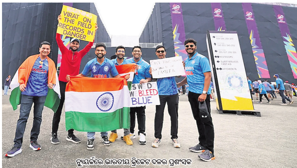
ସୁନ୍ଦରଭାଇ ଭାରତୀୟ କ୍ରିକେଟ ଦଳର ପ୍ରଶଂସକ