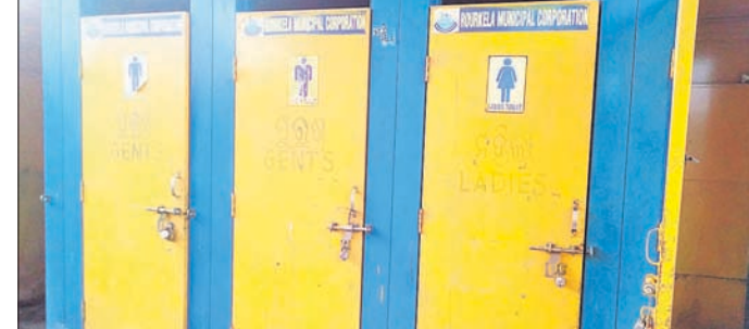
ଭେଣ୍ଟୁରୋ ମାକେଟ୍ରେ ଥିବା ଶୈତାଳୟ।

ରାଜରକେଲା ସହରର ବିଭିନ୍ନ ମାକେଟ୍ ଅଞ୍ଚଳରେ ଆର୍କିଏକ୍ସ ପକ୍ଷରୁ ଶୈତାଳୟ ନିର୍ମାଣ କରାଯାଇଛି। ମାତ୍ର ଅନେକ ମାକେଟ୍ ଅଞ୍ଚଳରେ ଥିବା ଶୈତାଳୟ କଥା ନ କହିବା ଭଲ। କେଉଁଠି ଚାହିଁ ପଡ଼ିଛି ତ, ଆଉ କେଉଁଠି ଗ୍ଲାନାୟ ମନ୍ଦିର ଅନୁଷ୍ଠାନ କର୍ତ୍ତାରେ ରହିଥିବା ଅଭିଯୋଗ ହୋଇଛି। ଏହିଭଳି ଦୃଶ୍ୟ ବାସନ୍ତୀ କଲୋନୀ ସ୍ଥିତ ଆର୍କିଏକ୍ସ ଭେଣ୍ଟୁରୋ ମାକେଟ୍ ପରିସରରେ ଦେଖିବାକୁ ମିଳିଛି। ଏହି ମାକେଟ୍ କମ୍ପ୍ଲେକ୍ସ ଭିତରେ ୧୦୦ରୁ ଊର୍ଦ୍ଧ୍ୱଦୋକାନ ରହିଛି। ବାସନ୍ତୀ କଲୋନୀର ଏହା ପ୍ରମୁଖ ମାକେଟ୍ ହୋଇଥିବାବେଳେ