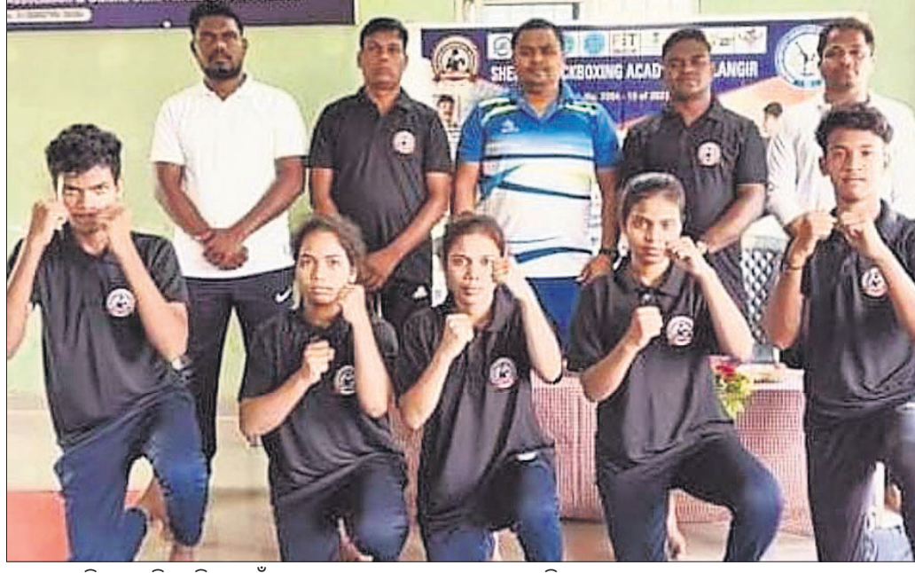
କାଟାୟ ଜୁନିୟର ଚାମ୍ପିୟନଶିପ ପାଇଁ ମନୋନୀତ ବଲାଙ୍ଗୀରର ୫ ଜଣ ଖେଳାଳି ।

ବଲାଙ୍ଗୀର, ୬/୬ (ବାରେଇ ଜୁମାର ଝଙ୍କର) ଶେଖର କିକ୍ ବକ୍ସିଂ ଏକାଡେମୀ ବଲାଙ୍ଗୀରରୁ ୫ ଜଣ ଖେଳାଳୀଙ୍କୁ କାଟାୟ ଜୁନିୟର ଚାମ୍ପିୟନଶିପରେ ମନୋନୀତ କରାଯାଇଛି । ଶେଖର କିକ୍ ବକ୍ସିଂ ଏକାଡେମୀ ସଭାପତି ସୁଦୟ ଶବର, ସମ୍ପାଦକ ପ୍ରଶାନ୍ତ ଚନ୍ଦ୍ର ଶେଖର ସେଠ ଓ ପ୍ରଶିକ୍ଷକ କାଲିଆ