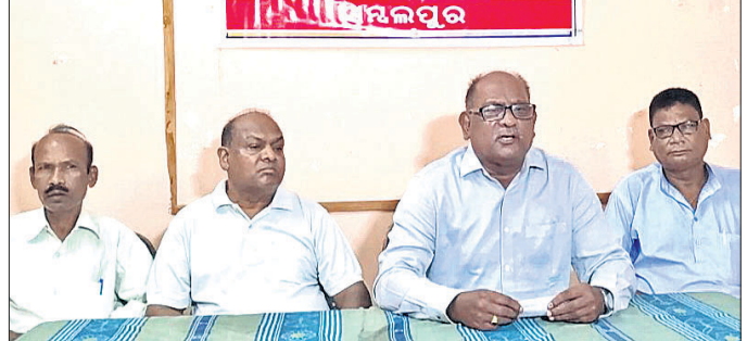
ଖବରଦାତା ସମ୍ମିଳନୀରେ ଓଡ଼ିସି ମଞ୍ଚ କର୍ମକର୍ତ୍ତା । ଓଡ଼ିସିମାନେ ଭାଜପାକୁ ସମର୍ଥନ କରିଛନ୍ତି । ପରିବର୍ତ୍ତନ ଦେଖାଦେଇ ଭାଜପା ସରକାର ବୋଲି ମଞ୍ଚ ଦାବି କରିଛି । ଏଥର ରାଜ୍ୟରେ ଗଠନ କରିବାକୁ ଯାଚିଛି । ଓଡ଼ିଶାରେ