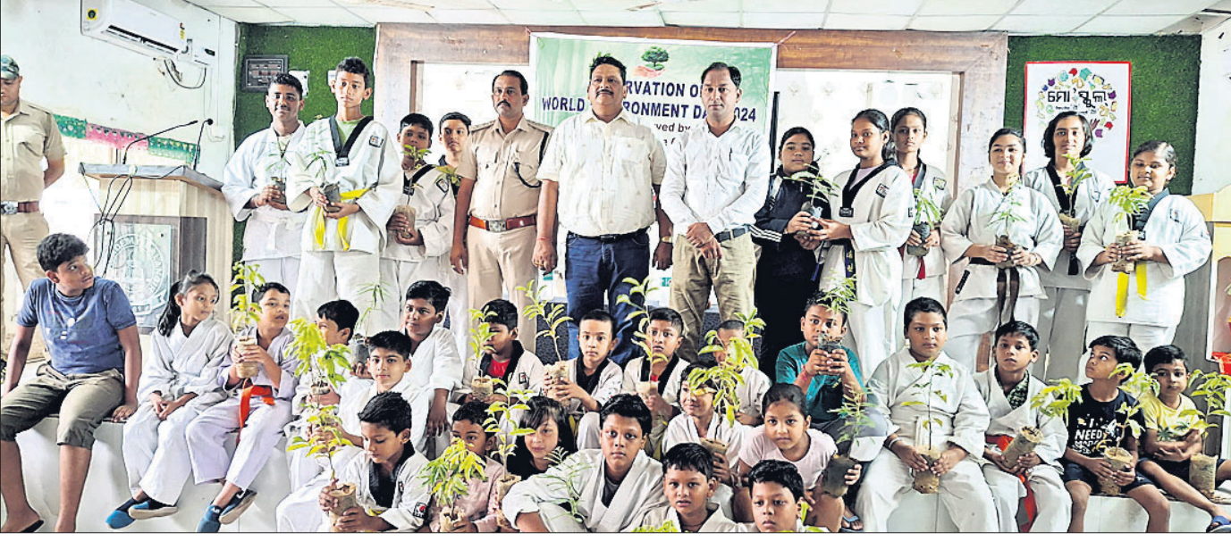
ବଲାଙ୍ଗୀର ଜିଲ୍ଲା କରାଚେ ଅର୍ଗାନାଇଜେସନ ଓ ନେହେରୁ ଯୁବ କେନ୍ଦ୍ରର ମିଳିତ ଆନୁକୁଲ୍ୟରେ ବିଶ୍ୱ ପରିବେଶ ଦିବସ ଉପଲକ୍ଷେ ଆୟୋଜିତ ସଭାରେ ଉପସ୍ଥିତ ସଦସ୍ୟ, ଅତିଥି ।