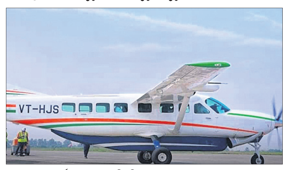
ଉଡ଼କେଲା ଏୟାରପୋର୍ଟରେ ଏୟାର ଖାନ ଇଣ୍ଡିଆ ବିମାନ।