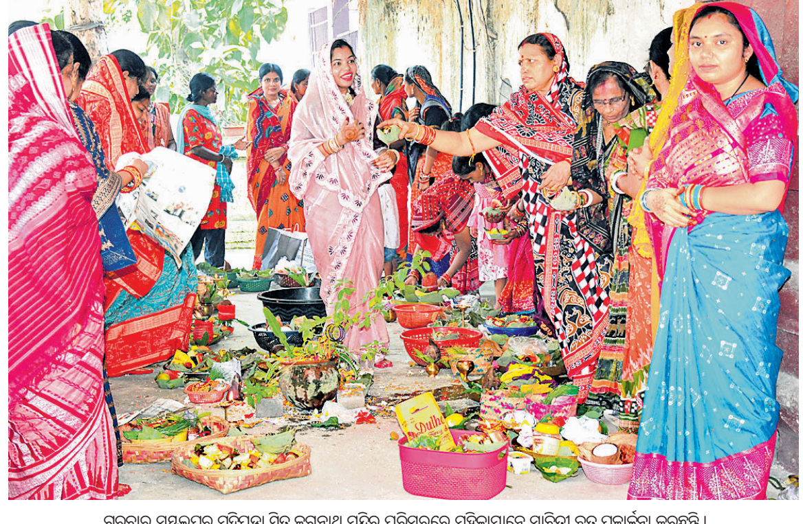
ଗୁରୁବାର ସମ୍ବଲପୁର ମୁଦିପଡ଼ା ସ୍ଥିତ ଜଗନ୍ନାଥ ମନ୍ଦିର ପରିସରରେ ମହିଳାମାନେ ସାବିତ୍ରୀ ବ୍ରତ ପୂଜାର୍ଚ୍ଚନା କରୁଛନ୍ତି ।