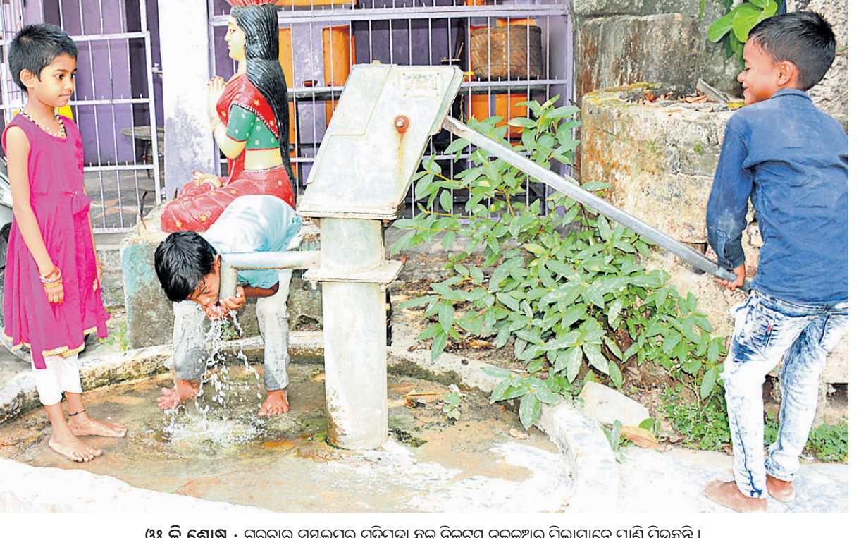
ଓ୪ କି ଶୋଷ : ଗୁରୁବାର ସମ୍ବଲପୁର ମୁଦିପଡ଼ା ଛକ ନିକଟସ୍ଥ ନଳକୂଅରୁ ପିଲାମାନେ ପାଣି ପିଇଛନ୍ତି ।