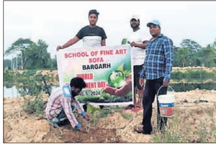
ବିଶ୍ୱ ପରିବେଶ ଦିବସରେ ବୃକ୍ଷରା ରୋପଣ କରାଯାଇଛି। ବିଶ୍ୱ ପରିବେଶ ଦିବସ ପାଳନ କାର୍ଯ୍ୟକ୍ରମରେ ମଞ୍ଚାସୀନ ଅତିଥିଙ୍କୁ।