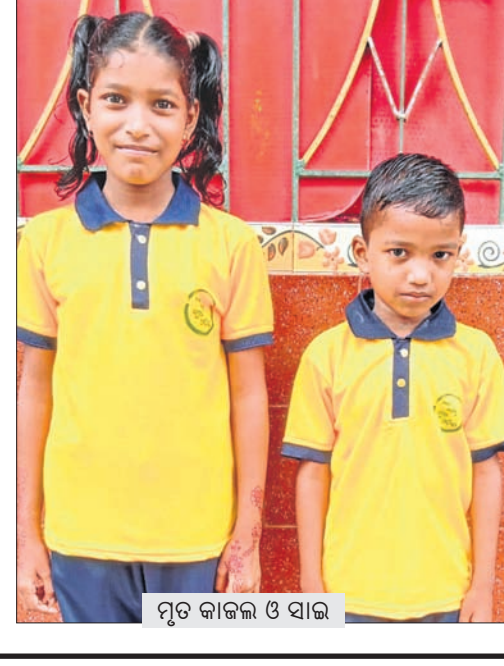
ମୃତ କାଜଳ ଓ ସାଜ