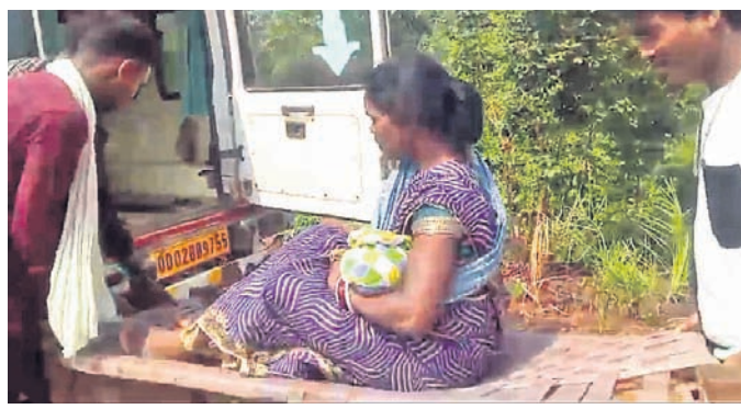
ଖଟିଆରେ ଅଣାଯାଇଥିବା ମା'ଶିଶୁଙ୍କୁ ଆସୁଲାଣିରେ ସାମ୍ବ୍ୟକେନ୍ଦ୍ର ନିଆଯାଉଛି।

କଳାହାଣ୍ଡି ଜିଲ୍ଲା ଧୂଆମୂଳ ରାମପୁର ବ୍ଲକ୍ରେ ଜନନୀ ଯନ୍ତ୍ରଣାର ଚିତ୍ର ସାମନାକୁ ଆସିଛି। ରାସ୍ତା ସମସ୍ୟା ଯୋଗୁ ଜଣେ ଗର୍ଭବତୀଙ୍କୁ ଖଟିଆରେ ବୋହି ଆସୁଲାଣି ପର୍ଯ୍ୟନ୍ତ ନିଆଯାଇଛି। ଦୁର୍ଗମ ଅଞ୍ଚଳରେ ରାସ୍ତାଘାଟ ସମସ୍ୟା ଯୋଗୁ ଗ୍ରାମବାସୀଙ୍କୁ ମିଳିପାଡୁନି ମୌଳିକ ସୁବିଧା। ଏହି ସମସ୍ୟା ନେଇ ଗ୍ରାମବାସୀ ଭୋଟ ବର୍ଜନ ଚେତାବନୀ ଦେଇଥିଲେ। ପରେ ବ୍ଲକ୍ ପ୍ରଶାସନ ପହଞ୍ଚି ଲୋକଙ୍କୁ ବୁଝାଖୁଣା କରି ରାସ୍ତା ନିର୍ମାଣ ପାଇଁ ପ୍ରତିଶ୍ରୁତି ମଧ୍ୟ ଦେଇଥିଲେ। ହେଲେ ସାଧାରଣ ନିର୍ବାଚନ ପରେ ନୂଆ ସରକାର ଗଠନ ପୂର୍ବରୁ ଏଭଳି ଏକ ଅଭାବନୀୟ ଘଟଣା ଧୂଆମୂଳ