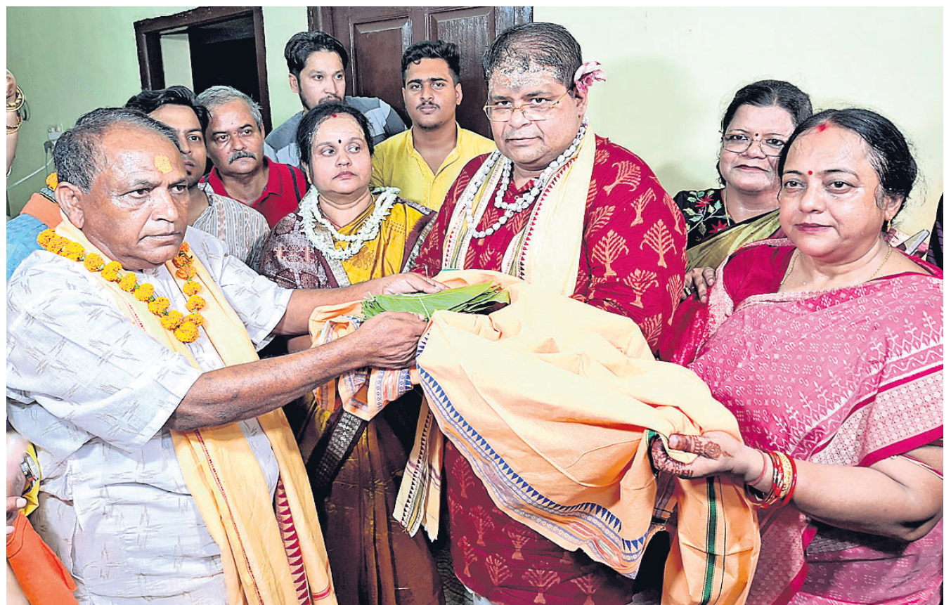
ଗୁରୁବାର ରାତିରେ ନନ୍ଦପଡ଼ା ବାଲୁକେଶ୍ୱର ବାବାଙ୍କ ପତରପେଟି: ସମ୍ବଲପୁର ଚାରଭାଟିସ୍ଥିତ କନ୍ୟା ମାତାପିତା ବରପିତାଙ୍କଠାରୁ ଶାଳପତ୍ର ଗ୍ରହଣ କରି କନ୍ୟାବାନ ପାଇଁ ସଙ୍କଳ୍ପ କରୁଛନ୍ତି ।