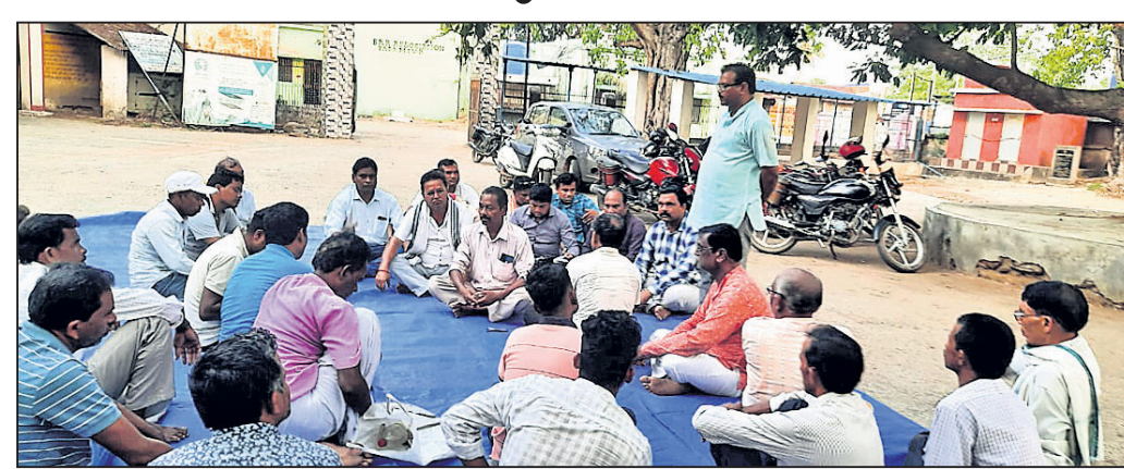
ପଦ୍ମପୁରଠାରେ ରାଜବୋତାସମ୍ବର କୃଷକ ସଙ୍ଗଠନର ବୈଠକରେ ଆଲୋଚନା କରାଯାଇଛି।