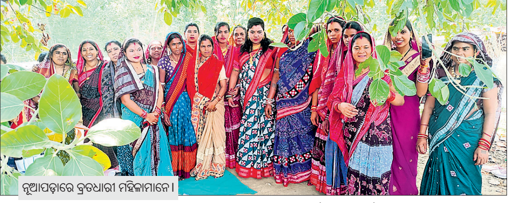
ନୂଆପଡ଼ାରେ ବ୍ରତଧାରୀ ମହିଳାମାନେ ।

ନୂଆପଡ଼ା/ଖଡ଼ିଆଳ, ୬/୬ (ମକାବୁ ବେମାଲ/ସୁଜିତ କୁମାର ପ୍ରଧାନ) ନୂଆପଡ଼ା ଜିଲ୍ଲାର ସଦର ଓ ଗ୍ରାମାଞ୍ଚଳ ସମେତ ଖଡ଼ିଆଳର ବିଭିନ୍ନ ସ୍ଥାନରେ ଗୁରୁବାର ସାବିତ୍ରୀ ବ୍ରତ ପାଳିତ ହୋଇଯାଇଛି । ସାମାଜିକ ଦୀର୍ଘାୟୁ କାମନା କରି ମହିଳାମାନେ ବ୍ରତ ପାଳନ କରିଛନ୍ତି । ବ୍ରତଧାରୀ ନୂତନ ବସ୍ତ୍ର ପରିଧାନ କରି ପୂଜା ସାମଗ୍ରୀ ସହ ବ୍ରାହ୍ମଣ ତକାଳ ଗାଁଦାଣ୍ଡ, ଯଜ୍ଞବେଦୀ, ଦେବଦେବୀ ମନ୍ଦିର, ବଟବୃକ୍ଷ ମୂଳରେ