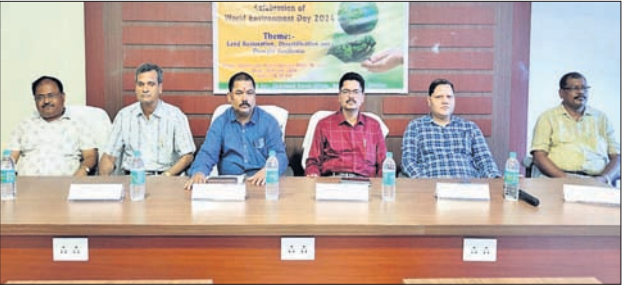
ପରିବେଶ ଦିବସ ପାଳନ କାର୍ଯ୍ୟକ୍ରମରେ ମଞ୍ଚାସୀନ ଅତିଥିଙ୍କୁ।