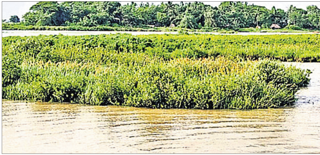
ମହାକାଳପଡ଼ା ଆଖଡ଼ାଖାଳୀରେ ପ୍ରସ୍ତାବିତ ନଦୀଭିତ୍ତିକ ବନ୍ଦର ସ୍ଥାନ।

କେନ୍ଦ୍ରାପଡ଼ା ଜିଲ୍ଲା ମହାକାଳପଡ଼ା ବ୍ଲକ ଆଖଡ଼ାଖାଳୀ ଗ୍ରାମ ନିକଟ ମହାନଦୀରେ ରାଜ୍ୟର ପ୍ରଥମ ନଦୀଭିତ୍ତିକ ବନ୍ଦର ହେବ । ପିପି ମୋଡରେ ପାରାଦୀପ ପୋର୍ଟ ଏହାର ଉନ୍ନତକରଣ କରିବ । ୨୦୨୦ ଡିସେମ୍ବରରେ ଏହି ସ୍ଥାନକୁ ପୂର୍ବତନ ୫-ଟି ସ୍ୱତନ୍ତ୍ର କାର୍ଯ୍ୟକ୍ରମ ପାଇଁ ଗଠ୍ୟ ଓ ଏମ୍ପ୍ଲୟ ପାଇଁ ରାଜ୍ୟ ସରକାରଙ୍କ ସହିତ ସେହି ବର୍ଷ ମାର୍ଚ୍ଚରେ ଆର୍ଦ୍ଧକାଳୀନ ମିଳନ ସହିତ କଥାବାର୍ତ୍ତା ଜିଲ୍ଲାସ୍ତରୀୟ କ୍ଷେତ୍ରରେ ଶିଳ୍ପ ପ୍ରତିଷ୍ଠା ପାଇଁ ଆଶା ସୂଚୀ କରାଯାଇଥିଲା । ତେବେ ପରିବର୍ତ୍ତିତ ଓ ସମ୍ଭାବ୍ୟ ରାଜ୍ୟନୀତି ଯୋଗୁ ରାଜ୍ୟର ଏହି ପ୍ରଥମ ନଦୀଭିତ୍ତିକ ବନ୍ଦର ଏବେ ପ୍ରଶ୍ନବାଚୀରେ ରହି କରୁଛି । ଇତିମଧ୍ୟରେ ୫ ବର୍ଷ ବିତିଥିଲେ ମଧ୍ୟ କୌଣସି ଆହୁତ୍ୱାପା ପଦକ୍ଷେପ ନିଆଯାଇନାହିଁ । ଏବେ ବିକଳ ପରିବର୍ତ୍ତେ ଭାଙ୍ଗିପା ସରକାର ଗଠନ ହେବାକୁ ଯାଉଥିବା ବେଳେ ବନ୍ଦରର ଭାଗ୍ୟ ପଥର କିମ୍ବା ପଥର ଚଳେ ରହିବ ଆଗକୁ ଦେଖିବାକୁ ବାକି ରହିଛି ବୋଲି କେନ୍ଦ୍ରାପଡ଼ା ଜିଲ୍ଲାର ବହୁ ବୁଦ୍ଧିଜୀବୀ ମତ ରଖିଛନ୍ତି ।