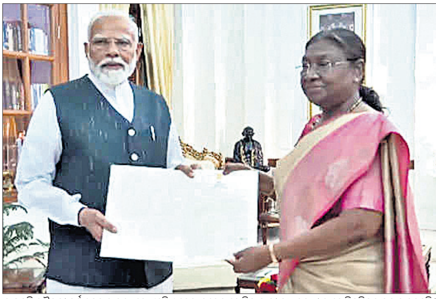
ରାଷ୍ଟ୍ରପତି ଡ୍ରୌପଦୀ ମୁର୍ମୁ ଶୁକ୍ରବାର ସନ୍ଧ୍ୟାରେ ଏନ୍‌ଡିଏ ନେତା ନରେନ୍ଦ୍ର ମୋଦିଙ୍କୁ ଭାବୀ ପ୍ରଧାନମନ୍ତ୍ରୀ ଭାବେ ନିଯୁକ୍ତିପତ୍ର ପ୍ରଦାନ କରୁଛନ୍ତି।