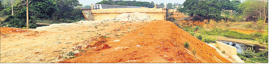
ନୟାଗଡ଼, ୭।୬ (ଲୋକନାଥ ମିଶ୍ର)

ନୟାଗଡ଼ ଜିଲ୍ଲା ବଳାଙ୍ଗୀର-ଖୋର୍ଦ୍ଧା ୫୭ ନଂ. ଜାତୀୟ ରାଜପଥର ନୂଆ ପଶୁସର ପୋଲ ନିର୍ମାଣ ହୋଇ ପ୍ରାୟ ୧ ବର୍ଷ ହେଲା ପଡି ରହିଛି । ପ୍ରାୟ ୫୦୦ ମିଟର ସଂଯୋଗ ରାସ୍ତା ନିର୍ମାଣ ନ ହେବାରୁ ସଂଯୋଗ କାର୍ଯ୍ୟକ୍ଷମ ହୋଇପାରୁନାହିଁ ।