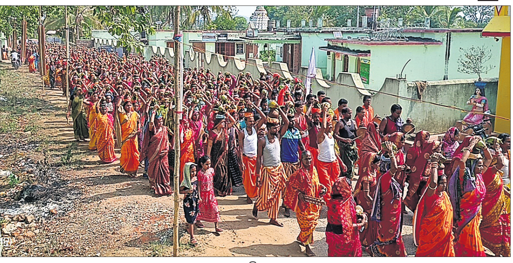
କଳସ ଯାତ୍ରାରେ ମହିଳା ଓ ପୁରୁଷମାନେ ।

ଦଶପଲ୍ଲୀ, ୭।୬ (ପ୍ରକାଶ କୁମାର ପାଣି) ଏହି ଉପଲକ୍ଷେ ସ୍ଥାନୀୟ କୁଆଁରିଆ ନଦୀ ତଟରୁ କଳସରେ ଜଳ ଭରି ମହିଳାପୁରୁଷ ଏକ ଶୋଭାଯାତ୍ରାରେ ବାହାରି ମନ୍ଦିର ପର୍ଯ୍ୟନ୍ତ ଯାଇଥିଲେ । ମନ୍ଦିରଠାରେ କଳସ ଘାପନ କରିଥିଲେ । ଏଥି ନିମନ୍ତେ ମନ୍ଦିର ପରିସରରେ ହୋମ ଯଜ୍ଞ, ନାମ ସଂକୀର୍ତ୍ତନ ପ୍ରଭୃତି ଅନୁଷ୍ଠିତ ହୋଇଥିଲା ।