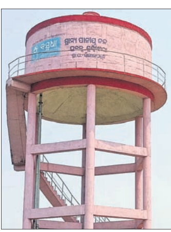
ପଞ୍ଚାୟତ ଗତେଇବନ୍ଧ ଗ୍ରାମ ସମେତ ଅନେକ ଗାଁରେ ପାନୀୟ ଜଳ ସମସ୍ୟାକୁ ନେଇ ରାସ୍ତାଚୋରୋ କରାଯାଇଥିଲା ।