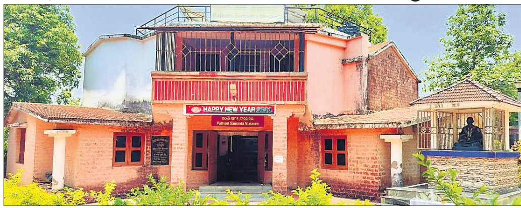
ପଠାଣି ସାମନ୍ତ ସଂଗ୍ରହାଳୟ

ନୟାଗଡ଼ ଜିଲ୍ଲା ଖଣ୍ଡପଡ଼ାଠାରେ ଅବସ୍ଥିତ ପଠାଣି ସାମନ୍ତ ସଂଗ୍ରହାଳୟଟି ବିଭିନ୍ନ ସମସ୍ୟା ମଧ୍ୟ ଦେଇ ଗତି କରୁଛି । ସମୟାନୁକ୍ରମେ ରକ୍ଷଣାବେକ୍ଷଣ ଅଭାବରୁ ବର୍ଷାଦିନେ ଛାତରୁ ପାଣି ଗଲୁଛି । ଫଳରେ ସଂଗ୍ରହାଳୟ ମଧ୍ୟରେ ସ୍ଥାନ ପାଇଥିବା ସାମଗ୍ରୀଗୁଡ଼ିକ ନଷ୍ଟ ହେବାରେ ଲାଗିଛି । ଘରର ଝରକା କବାଟ ସବୁକିଛି ଏବେ ନଷ୍ଟ ହେବାକୁ ବସ୍ତୁଛି । ପ୍ରକାଶ ଆଡ଼କି ବିଶ୍ୱ ବିଖ୍ୟାତ କ୍ୟୋର୍ଟିବିଫ୍ ତଥା ସିନ୍ଧୁକ ଦର୍ଶନର ରଚୟିତା ପଠାଣି ସାମନ୍ତଙ୍କ କୁଟୁମ୍ବର ଉଦ୍ଦେଶ୍ୟରେ ଜନ୍ମମାଟି ଖଣ୍ଡପଡ଼ାଠାରେ ଏହି ସଂଗ୍ରହାଳୟଟି ପ୍ରତିଷ୍ଠା ହେବା ପରେ ଏହା ଗତ ୮ ବର୍ଷ ଧରି କାର୍ଯ୍ୟକ୍ଷମ ହୋଇଛି ।