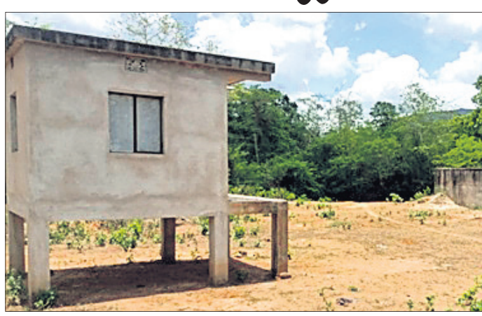
ଜିପାମାଳ ଗ୍ରାମରେ ଅଧାପଡ଼ିଥିବା ପ୍ରକଳ୍ପ। ଶୁଷ୍କଝୋଲାରେ ପ୍ରକଳ୍ପ ନିର୍ମାଣ ସରିଥିଲେ ମଧ୍ୟ କାର୍ଯ୍ୟକ୍ଷମ ହେଉନାହିଁ ।

ନୟାଗଡ଼/ନୂଆଗାଁ, ୭।୬ (ଲୋକନାଥ ମିଶ୍ର/ଧନେଶ୍ୱର ସାହୁ)