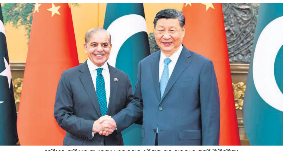
ବେଜିଂରେ ପାକିସ୍ତାନ ପ୍ରଧାନମନ୍ତ୍ରୀ ଶୋହବାଜ୍ ଶରିଫଙ୍କ ସହ ଚାଇନା ରାଷ୍ଟ୍ରପତି ଶି ଜିନ୍‌ପିଙ୍ଗ!