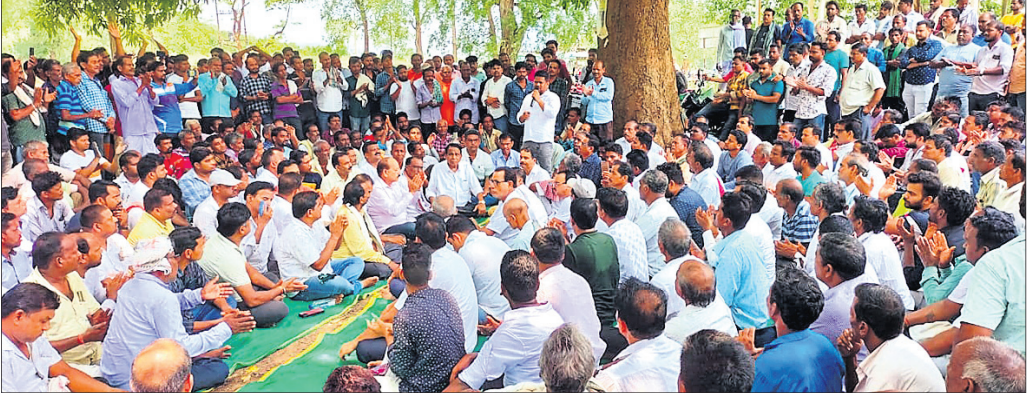
ବିଜେଡିର ସମୀକ୍ଷା ବୈଠକରେ ଯୋଗଦେଇଥିବା ନେତା ଓ କର୍ମୀମାନେ ।

ଖଣ୍ଡପଡ଼ା, ୭।୬ (ଅଜୟ କୁମାର ମହାରଣା) ୨୦୨୪ ସାଧାରଣ ନିର୍ବାଚନରେ ବିଜେଡିର ପରାଜୟ ପରେ ଖଣ୍ଡପଡ଼ା ନିର୍ବାଚନପଡ଼ଳୀ ବିଜେଡି ପକ୍ଷରୁ ନିର୍ବାଚନ ପରାଜୟର ସମୀକ୍ଷା ବୈଠକ ଆରମ୍ଭ ହୋଇଛି । ଏହା ପରେ ବିଜେଡିର ସମୀକ୍ଷା ବୈଠକ ଆରମ୍ଭ ହୋଇଛି । ଏହା ପରେ ବିଜେଡିର ସମୀକ୍ଷା ବୈଠକ ଆରମ୍ଭ ହୋଇଛି ।