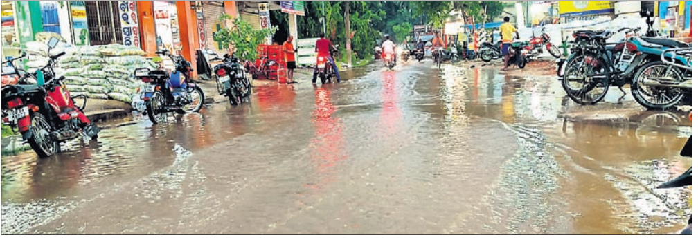
କାଏମା ବଜାରରେ ଜମିରହିଥିବା ବର୍ଷା ପାଣି ।