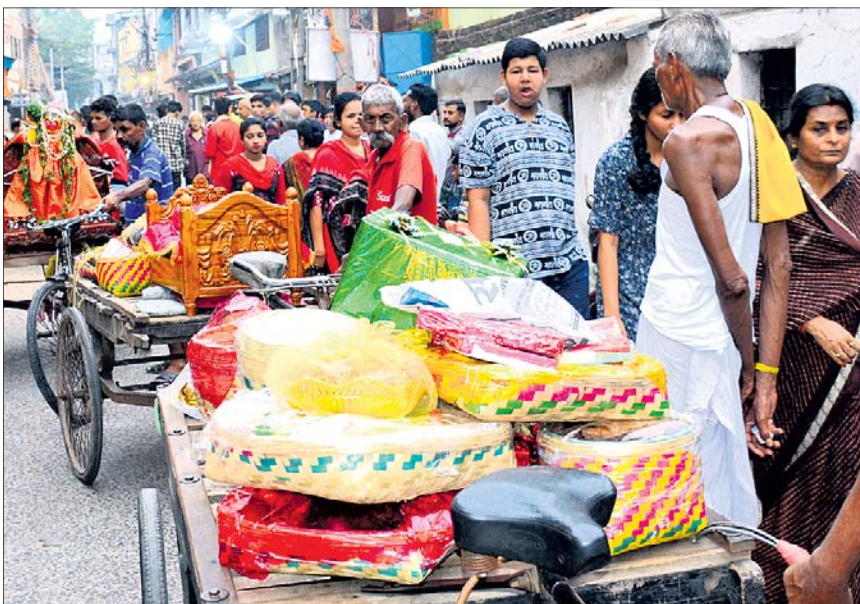
ଶିବ ବିବାହ ପରେ କନ୍ୟା ମାତାପିତାଙ୍କ ପକ୍ଷରୁ ଦିଆଯାଇଥିବା ଉପହାର ।