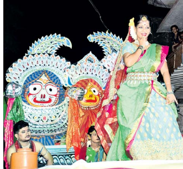
ନଗର ପରିକ୍ରମା ଶୋଭାଯାତ୍ରାରେ ଭକ୍ତି ସଙ୍ଗୀତରେ କଳାକାରଙ୍କ ନୃତ୍ୟ ।