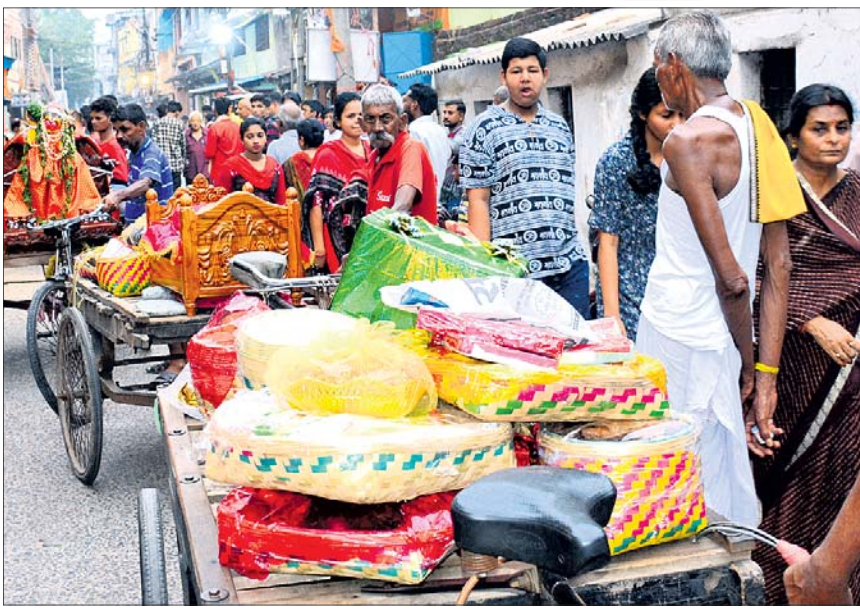
ଶିବ ବିବାହ ପରେ କନ୍ୟା ମାତାପିତାଙ୍କ ପକ୍ଷରୁ ଦିଆଯାଇଥିବା ଉପହାର ।