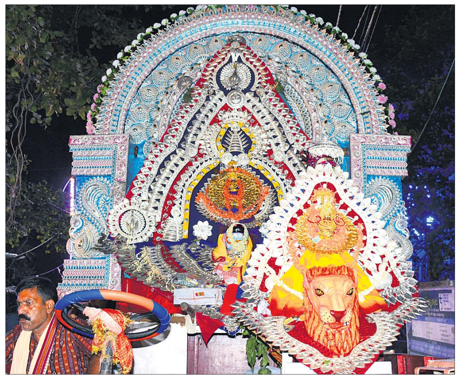
ଝାଡୁଆପଡ଼ା ଲୋକନାଥ ବାବା ଓ ମାତା ପାର୍ବତୀ ଗୌପ୍ୟ ବିମାନରେ ଉପବିଷ୍ଣୁ ହୋଇ ନଗର ପରିକ୍ରମାରେ ବାହାରିଛନ୍ତି ।