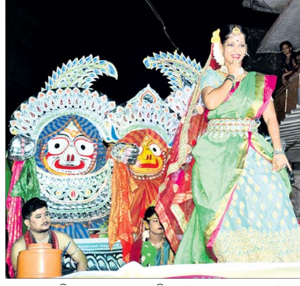
ନଗର ପରିକ୍ରମା ଶୋଭାଯାତ୍ରାରେ ଭକ୍ତି ସଙ୍ଗୀତରେ କଳାକାରଙ୍କ ନୃତ୍ୟ ।