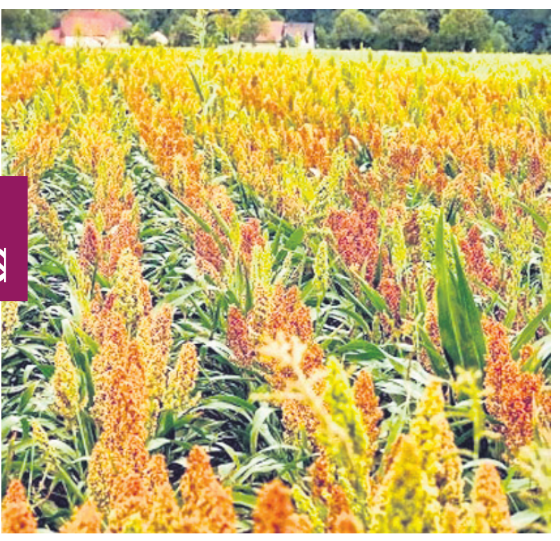
ଅଣଧାନ ଫସଲ ଚାଷ

ଆମ ଚାଷକର୍ମୀମାନଙ୍କୁ ଆମର ମୁଖ୍ୟ ଉଦ୍ଦେଶ୍ୟ ହେଉଛି ଉତ୍ପାଦନ ବୃଦ୍ଧି । ଉତ୍ପାଦନ ବୃଦ୍ଧି ପାଇଁ ଆମେ ଉତ୍ତମ ଉପାଦାନ ବ୍ୟବହାର କରିବା ।