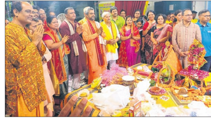
ନୂଆଦିଲ୍ଲୀ ତ୍ୟାଗରାଜ ନଗରସ୍ଥିତ ଶିବ ମନ୍ଦିରରେ ଶୀତଳଷଷ୍ଠୀ ଉତ୍ସବ ।