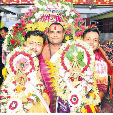
ପ୍ରଭୁ ଶ୍ରୀଲିଙ୍ଗରାଜ ଓ ମା' ପାର୍ବତୀ ସ୍ୱମନ୍ଦିର ବିଜେ କରୁଛନ୍ତି ।