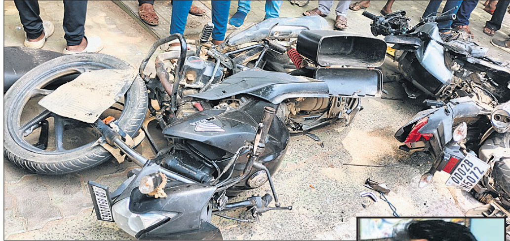
ଦୁର୍ଘଟଣାରେ ଭୁବନେଶ୍ୱର ହୋଇଯାଇଥିବା ବୁଲ ବାଇକ୍ ।