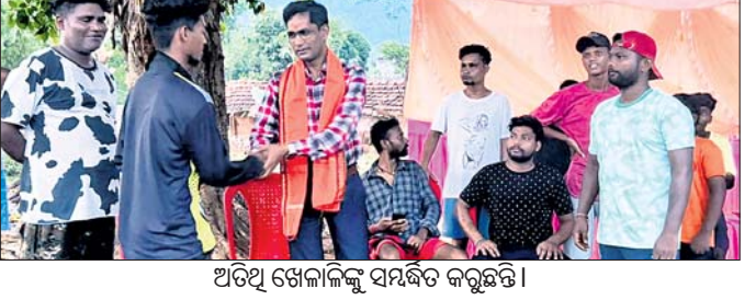
ଅତିଥି ଖେଳାଳିଙ୍କୁ ସମ୍ବର୍ଦ୍ଧନ କରୁଛନ୍ତି ।

ଦେବଗଡ଼, ୧୭।୬(ଶଶାଙ୍କ ଶେଖର ଝାଙ୍କର) ଦେବଗଡ଼ ପୌରାଞ୍ଚଳ ହାତୀଶାଳ ସାହିଖେଳ ପଡ଼ିଆଠାରେ ଶିବବାଲା କ୍ଲବ୍ ଆନୁକୁଲ୍ୟରେ ଏକ ଦିନିଆ କ୍ରିକେଟ ପ୍ରତିଯୋଗିତା ଅନୁଷ୍ଠିତ ହୋଇଯାଇଛି । ମୋଟ ୪ଟି ଦଳକୁ ନେଇ ଆୟୋଜିତ ଏହି ପ୍ରତିଯୋଗିତାର ଫାଇନାଲ ମ୍ୟାଚରେ ଶିବବାଲା କ୍ରିକେଟ ଟିମ୍ ପରାସ୍ତ କରି ସମଲେଶ୍ୱରୀ କ୍ରିକେଟ ଟିମ୍ ଚାମ୍ପିୟନ ହୋଇଛି । ଫାଇନାଲ ମ୍ୟାଚ ଅଧୀନରେ ଭାବେ ରଞ୍ଜିତ ପାତ୍ର ଓ ବିଶାଳ ପୁଞ୍ଜର ପରିଚାଳନା କରିଥିଲେ । ଶିବବାଲା