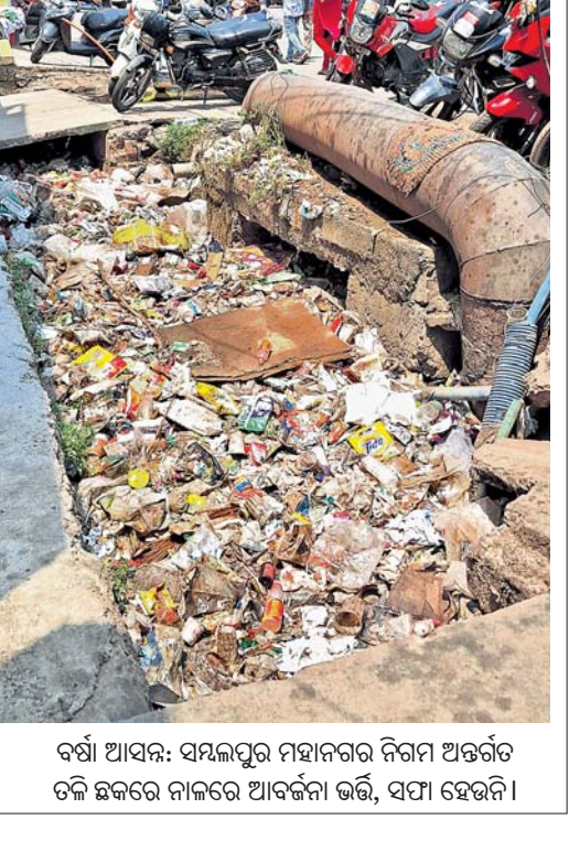
ବର୍ଷା ଆସିବା: ସମ୍ବଲପୁର ମହାନଗର ନିଗମ ଅନ୍ତର୍ଗତ ତଳି ଛକରେ ନାକରେ ଆବର୍ଜନା ଭର୍ତ୍ତି, ସଫା ହେଉନି ।