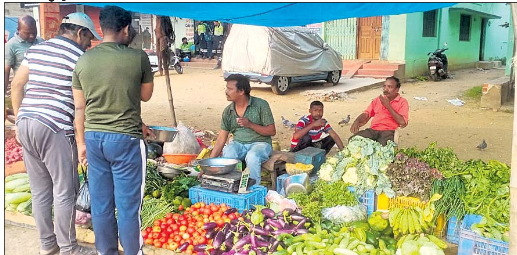
ଝାରସୁଗୁଡ଼ା ସହରର ଏକ ପରିବା ହାଟରେ ଲୋକେ କିଣାକିଣି କରୁଛନ୍ତି।

ଝାରସୁଗୁଡ଼ା, ୧୭।୬(ସଞ୍ଜୟ ମାଲି) ଝାରସୁଗୁଡ଼ା ସହର ସମେତ ଆଖପାଖ ଅଞ୍ଚଳରେ ଗତ କିଛିଦିନ ହେବ ଅତ୍ୟାବଶ୍ୟକ ସାମଗ୍ରୀ ଦର ବୃଦ୍ଧି ପାଇଛି। ଏଥିଯୋଗୁ ଅଞ୍ଚଳର ସାଧାରଣ ଲୋକେ ଜିନିଷ କିଣିବା ପାଇଁ ହସ୍ତତନ୍ତ ହେଉଥିବା ଅଭିଯୋଗ ହେଉଛି।