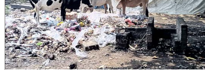
ଝାଡ଼ାଛାଡ଼ି ସମେତ ବାଟେଇ ନାହିଁ ନ ଥିବା ଅସୁବିଧାର ସମ୍ମୁଖୀନ ହେଉଛନ୍ତି।