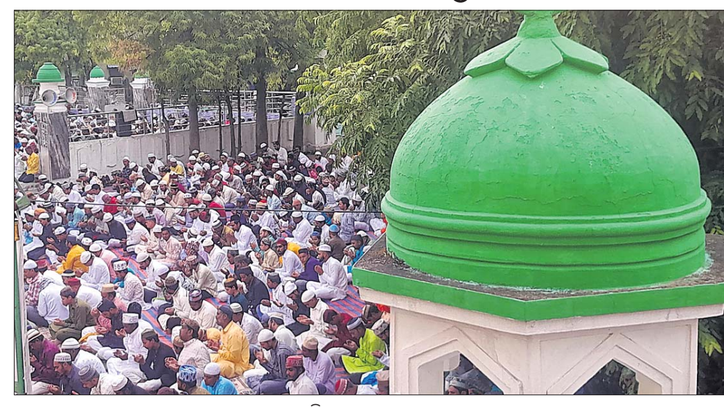
ସୋମବାର ସମ୍ବଲପୁର ଇଦ୍‌ଗାହଠାରେ ସାମୂହିକ ନମାଜପାଠ ଅବସରରେ ସମବେତ ମୁସଲମାନ ଭାଇମାନେ ।

ସମ୍ବଲପୁର, ୧୭।୬ (ଭବାନୀ ଶଙ୍କର ଭୋଇ) ସମ୍ବଲପୁର ସହରରେ ତ୍ୟାଗ ଓ ବଳିଦାନର ପର୍ବ ଇନ୍-ଉନ୍-ଜୁହା ସୋମବାର ମୁସଲମାନମାନଙ୍କ ଦ୍ୱାରା ପାଳିତ ହୋଇଯାଇଛି । ସହରର ବିଭିନ୍ନ ମସଜିଦ୍‌ରେ ସମୂହ ନମାଜ ପାଠ କରିବା ସହ ସେମାନେ ପରସ୍ପରକୁ ଇଦ୍ ପୁରାବଳି ଜଣାଇଛନ୍ତି । କୁର୍ବାନି ବା ସମର୍ପଣର ଏହି ପର୍ବ ଯାହାକୁ ବକ୍ତି- ଇଦ୍ ମଧ୍ୟ କୁହାଯାଏ । ଏଥିରେ ମୁସଲମାନମାନେ ଆଲ୍ଲାଙ୍କ ନିକଟରେ କୁର୍ବାନୀ ପ୍ରଦାନ କରିଛନ୍ତି । ସମ୍ବଲପୁରର ସାକ୍ଷୀପଡ଼ା ସ୍ଥିତ ଇଦ୍‌ଗାହଠାରେ ସାମୂହିକ ନମାଜ ପାଠରେ ସହରର ବହୁ ମୁସଲମାନ ସାମିଲ ହୋଇଥିଲେ । ଇଦ୍‌ଗାହରେ ନମାଜ ପାଠ ପରେ ସହରର ପଲଟନ ମସଜିଦ୍, କାମା ମସଜିଦ୍, ଦଲାଲପଡ଼ା ସଦର ମସଜିଦ୍, ଗୁରା ମସଜିଦ୍‌ରେ ମଧ୍ୟ ନମାଜ ପାଠ କରାଯାଇଥିଲା । ଇଦ୍‌ର ନମାଜ ପରେ ମୁସଲମାନ ଭାଇମାନେ ପରସ୍ପରକୁ ଆଲିଙ୍ଗନ କରି ଶୁଭେଚ୍ଛା ଜଣାଇଥିଲେ । ପିତରା ଓ ଜବାତ ଦେଇ