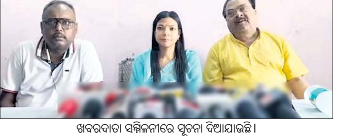
ଖବରଦାତା ସମ୍ମିଳନୀରେ ସୂଚନା ଦିଆଯାଇଛି।

ଦେବଗଡ଼, ୧୭।୬ (ଶଶାଙ୍କ ଶେଖର ଝାଙ୍କର) ଦେବଗଡ଼ ଜିଲା ତିଲେଇବଣି ବ୍ଲକ୍ ବଡ଼ସାପଲ ଗ୍ରାମପଞ୍ଚାୟତ ଅନ୍ତର୍ଗତ ଏମ୍.ଏସ.ଏମ. (ମାକରପୁଣ୍ଡା, କୁରୁରାପୋଣ୍ଡି, ସୁବର୍ଣ୍ଣପାଲି) ଅଧୀନ ପ୍ରଗତି ଷୋର୍ଟ୍ କ୍ଲବ୍, ଗାନ୍ଧୀନୀ ଆନୁକୁଲ୍ୟରେ ଗତ ୧୩ ତାରିଖରେ ଆରମ୍ଭ ହୋଇଥିବା ଶିବୁ ସ୍ମାରକୀ କ୍ରିକେଟ ପ୍ରତିଯୋଗିତା ଉଦ୍‌ଯାପିତ ହୋଇଯାଇଛି।