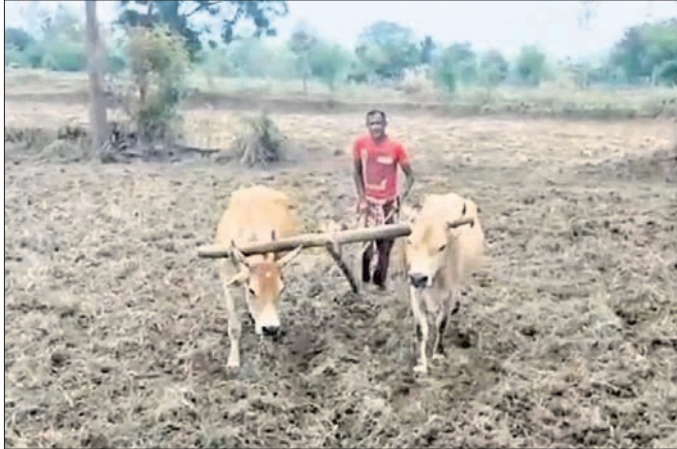
ଜଣେ ଚାଷୀ ନିଜ ଜମିରେ ହଳ କରୁଛନ୍ତି।

ଓଡ଼ିଆ ପଞ୍ଚି ପୂର୍ବରୁ ଏବେ ରଜ ସଂକ୍ରାନ୍ତି ଶେଷ ହୋଇ ମିଥୁନ ଲାଗିଛି। ଆଉ ମିଥୁନରେ ମୁଖ୍ୟ ଧାରାରେ ବର୍ଷା ହେବା କଥା। କିନ୍ତୁ ଆକାଶରେ କଳାହାଣ୍ଡିଆ ମେଘ ଦେଖାଯାଉଥିଲେ ବି ବର୍ଷା ଦେଖାନାହିଁ।