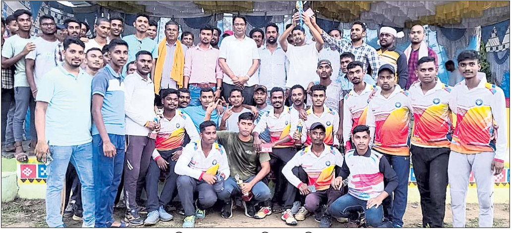
ଅତିଥିକ ଗହଣରେ ଉପସ୍ଥିତ ଖେଳାଳିମାନେ।

ଦେବଗଡ଼, ୧୭।୬ (ଶଶାଙ୍କ ଶେଖର ଝାଙ୍କର) ଦେବଗଡ଼ ଜିଲା ତିଲେଇବଣି ବ୍ଲକ୍ ବଡ଼ସାପଲ ଗ୍ରାମପଞ୍ଚାୟତ ଅନ୍ତର୍ଗତ ଏମ୍.ଏସ.ଏମ. (ମାକରପୁଣ୍ଡା, କୁରୁରାପୋଣ୍ଡି, ସୁବର୍ଣ୍ଣପାଲି) ଅଧୀନ ପ୍ରଗତି ଷୋର୍ଟ୍ କ୍ଲବ୍, ଗାନ୍ଧୀନୀ ଆନୁକୁଲ୍ୟରେ ଗତ ୧୩ ତାରିଖରେ ଆରମ୍ଭ ହୋଇଥିବା ଶିବୁ ସ୍ମାରକୀ କ୍ରିକେଟ ପ୍ରତିଯୋଗିତା ଉଦ୍‌ଯାପିତ ହୋଇଯାଇଛି।