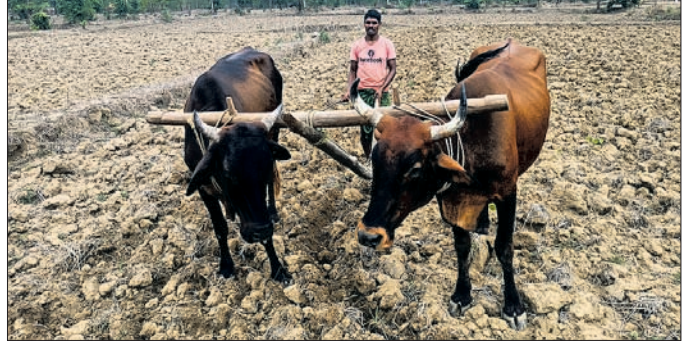
ଚାଷୀ ହଳକରି ଜମି ପ୍ରସ୍ତୁତ କରୁଛନ୍ତି।

କରୁଛନ୍ତି। ବର୍ଷା ନ ହେଲେ ଗଜା ହେବ ନାହିଁ। ବିତାୟ ଧର ରୁଣିଲେ ଅଧିକ ଖର୍ଚ୍ଚ ପ୍ରସ୍ତୁତ କରି ଜଳ ପ୍ରଥମ ସମ୍ପାଦରେ ଧାନ, ଧାନ ଚାଷ କରି ଆଟ ବା ଠିପ ଜମିରେ ତଳିପକା ବର୍ଷା କାଳବୈଶାଖୀ ବର୍ଷାରେ ଜମିକୁ ଚଷମ ପ୍ରସ୍ତୁତ କରି ରଖିଥିଲେ ମକା ଚାଷ ମଧ୍ୟ ବିଳମ୍ବ ହେବାରେ ଲାଗିଛି। କପା ଓ ମକା ଜଳ ପ୍ରଥମ ସମ୍ପାଦରେ ତଳିପକା କରି ଶେଷ ସମ୍ପାଦ ବେଳକୁ