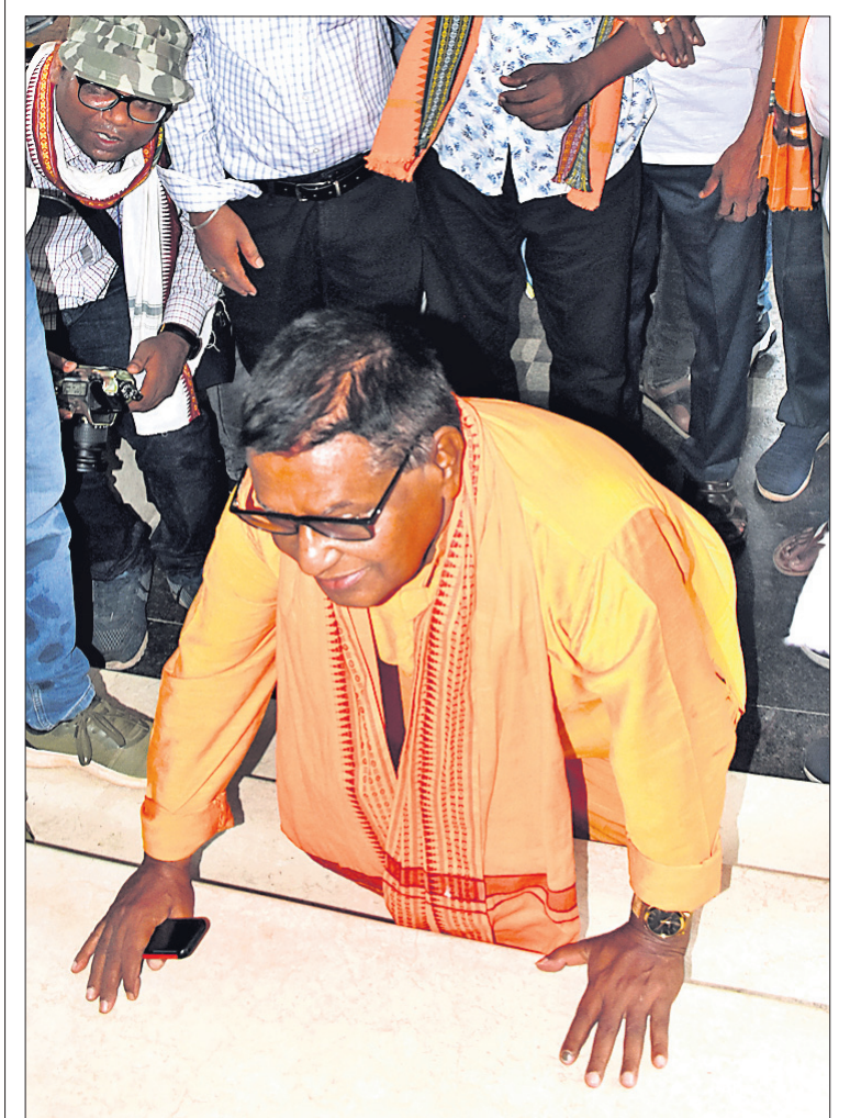
ସମୂହୀଆ ବିଧାୟକ ପଦ୍ମଲୋଚନ ପଣ୍ଡା ବିଧାନସଭାକୁ ପ୍ରବେଶ ପୂର୍ବରୁ ପୁଣିଥା ମାରୁଛନ୍ତି।