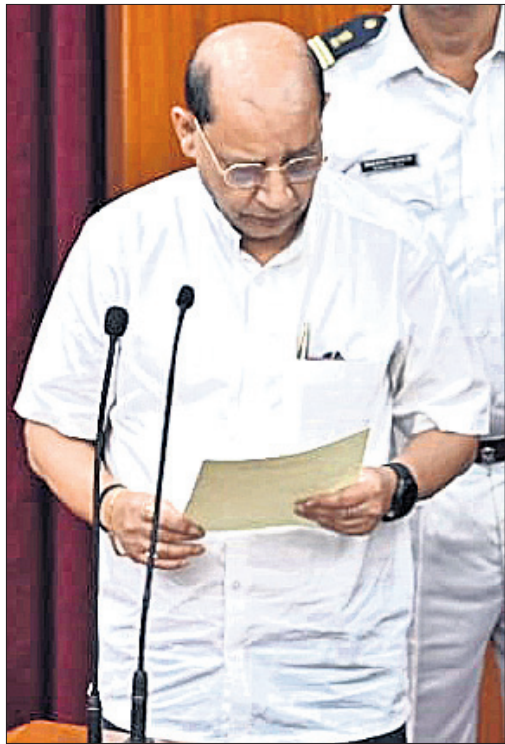
ରେଡ଼ାଖୋଳ ବିଧାୟକ ପ୍ରସନ୍ନ ଆଚାର୍ଯ୍ୟ