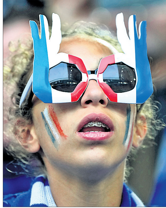
କର୍ନାମାରେ ଚାଲିଥିବା ଯୁରୋ କପ୍ ଫୁଟବଲ ଟୁର୍ନାମେଣ୍ଟ ଅବସରରେ ପ୍ରାନ୍ତ ଓ କର୍ଡିଆ ପ୍ରଶଂସକ।