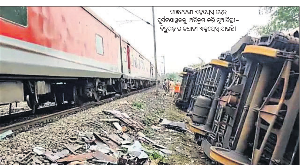
କାଞ୍ଚନକଳା ଏକ୍ସପ୍ରେସ୍ ଟ୍ରେନ୍ ଦୁର୍ଘଟଣାସ୍ଥଳକୁ ଅତିକ୍ରମ କରି ନୂଆଦିଲ୍ଲୀ-ଦିବ୍ରୁଗଡ଼ ରାଜଧାନୀ ଏକ୍ସପ୍ରେସ୍ ଯାଉଛି।