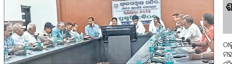
ରଥଯାତ୍ରା ପରିଚାଳନା ସମ୍ପର୍କରେ ଅଧିକାରୀମାନେ ଆଲୋଚନା କରୁଛନ୍ତି।