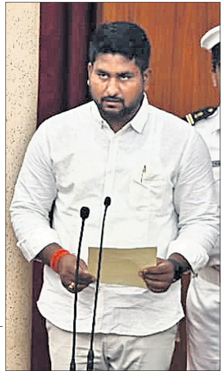
ଉଚ୍ଚଶିକ୍ଷାମନ୍ତ୍ରୀ ସୂର୍ଯ୍ୟବଂଶୀ ସୁରଜ