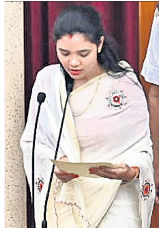
ପଦ୍ମପୁର ବିଧାୟିକା ବର୍ଷା ସିଂ ବରିହା