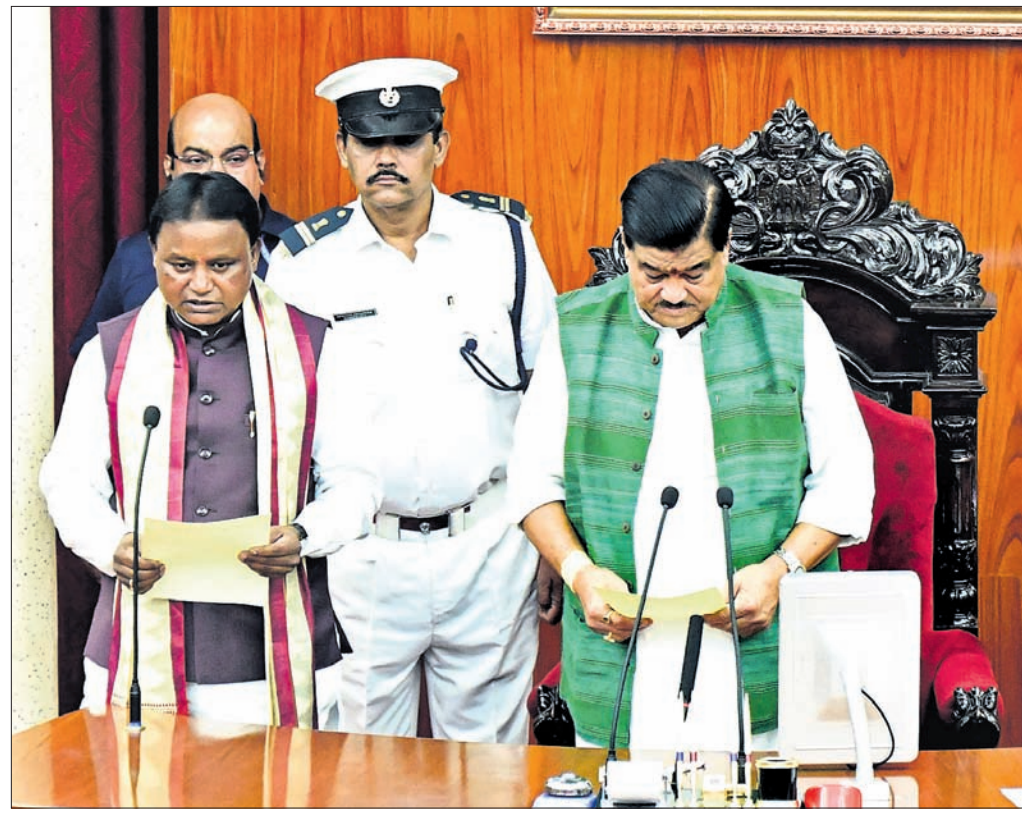
ମୁଖ୍ୟମନ୍ତ୍ରୀ ମୋହନ ଚରଣ ମାଝୀଙ୍କୁ ଶପଥ ପାଠ କରାଇଛନ୍ତି କାମଚଳା ବାଟସ୍ମୃତି ରଶେନ୍ଦ୍ର ପ୍ରତାପ ସ୍ୱାଇଁ।