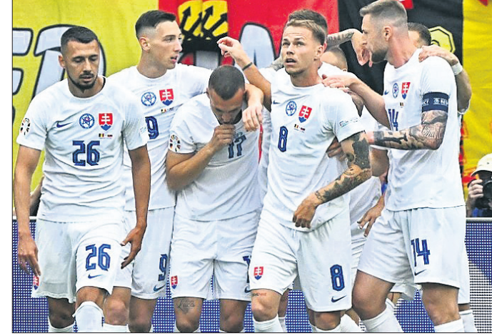
ବିଜୟ ହାସଲ ପରେ ଉଲ୍ଲସିତ ସ୍ଲୋଭାକିଆ ଖେଳାଳି।

କର୍ନାମାରେ ଅନୁଷ୍ଠିତ ଯୁରୋ କପ୍ ଫୁଟବଲ ୨୦୨୪ରେ ପ୍ରାନ୍ତ ଓ ସ୍ଲୋଭାକିଆ ବିଜୟୀ ହୋଇଛନ୍ତି। ମାକ୍ସିମିଆନ୍ ଓବରଙ୍କ ଆତ୍ମଘାତୀ ଗୋଲ୍ ବଳରେ ପ୍ରାନ୍ତ ୧-୦ରେ ଅଷ୍ଟ୍ରିଆକୁ ପରାସ୍ତ କରି ଏହାର ଅଭିଯାନ ଆରମ୍ଭ କରିଛନ୍ତି। ଅନ୍ୟପକ୍ଷରେ ଶକ୍ତିଶାଳୀ ବେଲଜିୟମକୁ ସମାନ ବ୍ୟବଧାନରେ ହରାଇ ସ୍ଲୋଭାକିଆ।