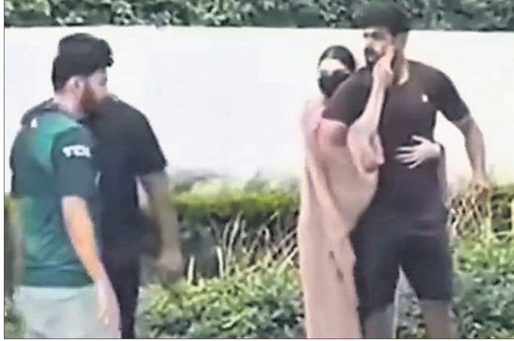
ପ୍ରଶଂସକଙ୍କ ସହ ମୁହାଁମୁହିଁ ଅବସରରେ ପାକିସ୍ତାନ କ୍ରିକେଟର ହାରିସ୍ ରୌଫ୍।

ବୋଲି କହିଥିଲେ। ପରେ ପ୍ରଶଂସକ ନିଜ ଏକ୍ସ ଆକାଉଣ୍ଟରୁ ଏକ ସନ୍ଦେଶ ଉପରେ ପ୍ରଶଂସକମାନଙ୍କୁ ସମାଲୋଚନା କରିବାର ଅଧିକାର ରହିଛି। ମାତ୍ର ପରିବାର ଲୋକଙ୍କୁ ନେଇ କିଛି କହିବା ଗ୍ରହଣୀୟ ନୁହେଁ ବୋଲି କହିଛନ୍ତି ରୌଫ୍। କ୍ରିକେଟରଙ୍କ ପ୍ରତି ଏଭଳି ବ୍ୟବହାରକୁ ଅନେକ ପୂର୍ବତନ କ୍ରିକେଟର ନାପସନ୍ଦ କରିଛନ୍ତି।