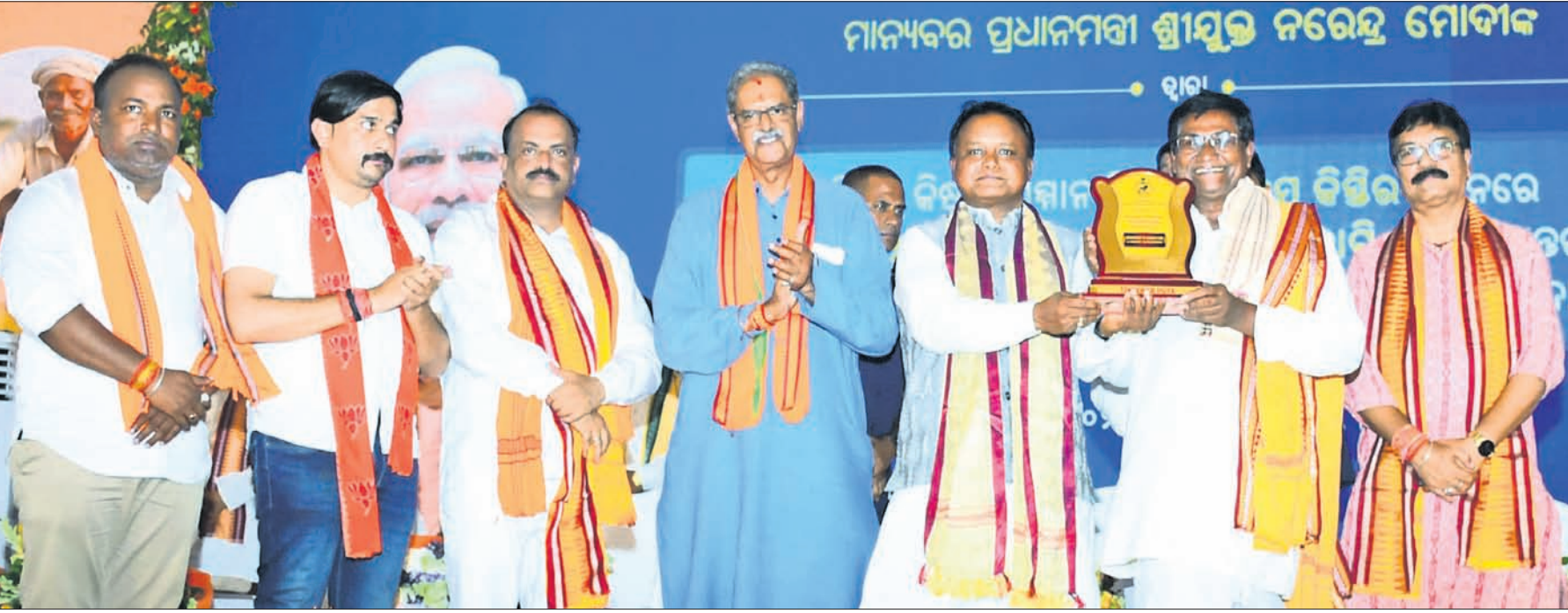
ପିଏମ୍ କିଶାନ ସମ୍ମାନ ନିଧି ଯୋଜନାର ୧୭ତମ କିଛି ପ୍ରଦାନ କାର୍ଯ୍ୟକ୍ରମରେ ପୁଖ୍ୟମନ୍ତ୍ରୀ ମୋହନ ଚରଣ ମାଝୀ ବରଗଡ଼ର ଅଗ୍ରଣୀ ଚାଷୀ କୃଷକଙ୍କୁ ସମର୍ଥନ କରୁଛନ୍ତି।