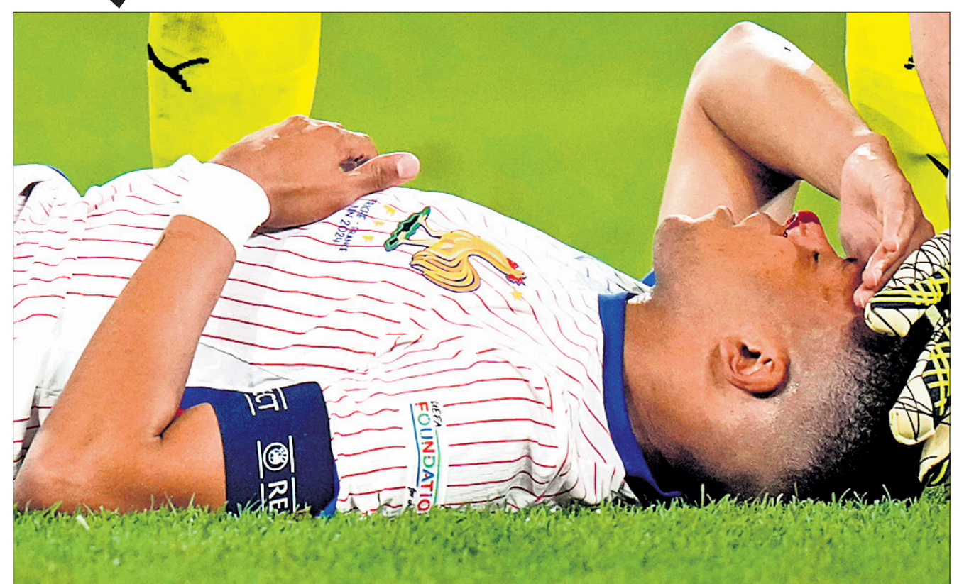
ଅଷ୍ଟ୍ରିଆ ବିପକ୍ଷ ଯୁରୋ କପ୍ ମ୍ୟାଚରେ ଆହତ ହୋଇଛନ୍ତି ପ୍ରାନ୍ତର କିଲିଆନ୍ ଏମ୍‌ବାପେ। କେଭିନ୍ ଡାନ୍‌ସୋଙ୍କ କାନ୍ଧରେ ଡାକ୍ ମୁହଁ ମାଡ ହୋଇଥିବା ବେଳେ ନାକ ଫାଟି ରକ୍ତ ବାହାରିଥିଲା। ପଡ଼ିଆରେ ମୁହଁ ମାଡ ପଡି ରହିବା ପରେ ଡାକ୍ତ୍ର ପ୍ରାଥମିକ ଚିକିତ୍ସା ପ୍ରଦାନ କରାଯାଇଥିଲା। ନାକ ହାତ ଭାଙ୍ଗିଥିଲେ ମଧ୍ୟ ଅପୋପତାର କରାଯିବ ନାହିଁ ବୋଲି ପ୍ରାନ୍ତ ଫୁଟବଲ ଫେଡେରେଶନ ପକ୍ଷରୁ କୁହାଯାଇଛି। ଅନ୍ୟପକ୍ଷରେ ଏମ୍‌ବାପେଙ୍କ ଚିକିତ୍ସା କାରି ରହିଥିବା ବେଳେ ଡାକ୍ ପାଇଁ ଏକ ସ୍ୱତନ୍ତ୍ର ମାଧ୍ୟ ପ୍ରସ୍ତୁତ କରାଯାଇଛି। ଏମ୍‌ବାପେ ବାନ୍ ପଡିଲେ ଏହା ପ୍ରାନ୍ତ ପାଇଁ ବଡ଼ ସତ୍ ହେବ ବୋଲି କହିଛନ୍ତି ମ୍ୟାନେଜର ଡିଡିଏର୍ ଡେ‌ସୋପା।