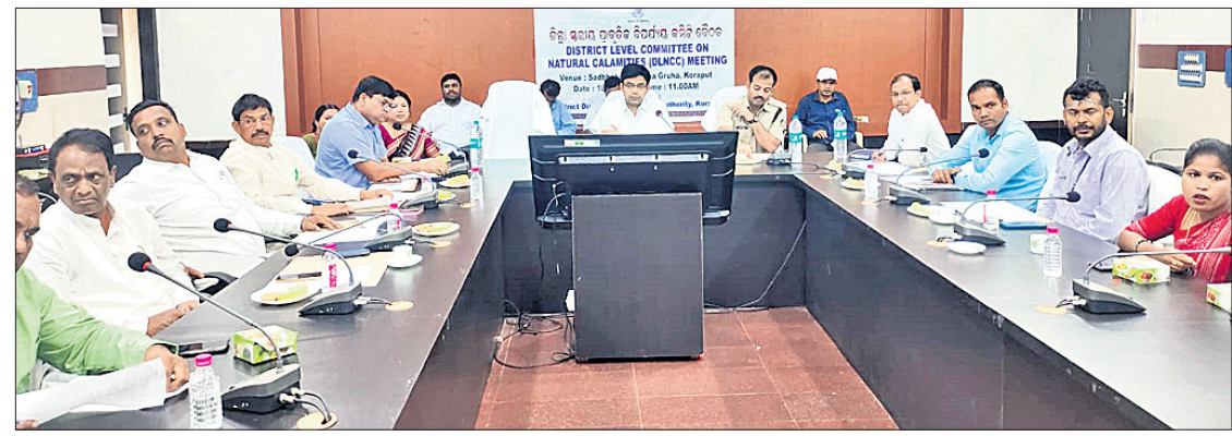
ବୈଠକରେ ଅଧିକାରୀମାନେ ଆଲୋଚନା କରୁଛନ୍ତି।