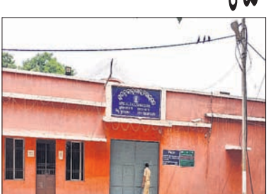
ବଣାଇ, ୧୮.୬ (ପ୍ରକାଶ ଡିପାଠୀ)

■ ହତ୍ୟା ଉଦ୍ୟମ ନେଇ କାରାଗୃହରେ ସଜା ■ ପାଞ୍ଚ ବର୍ଷରୁ ୪ ବର୍ଷ ସଜା ସରିଛି