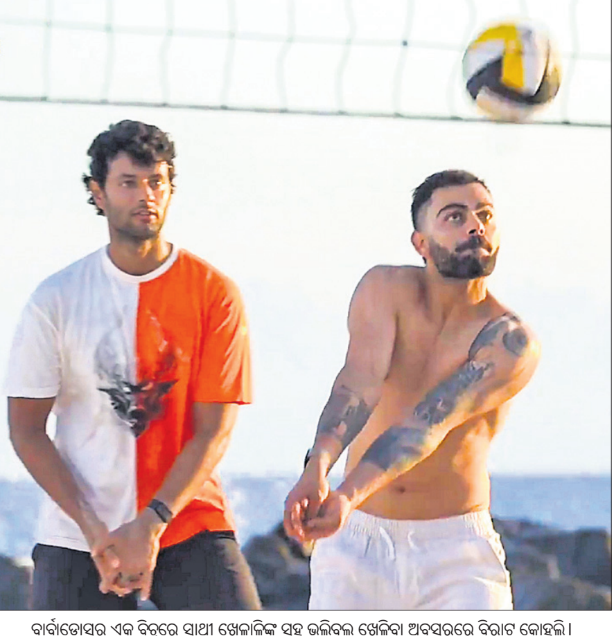
ବାର୍ଗଡୋସର ଏକ ବିଟ୍‌ରେ ସାଥୀ ଖେଳାଳିଙ୍କ ସହ ଭଲିବଲ୍ ଖେଳିବା ଅବସରରେ ବିରାଟ କୋହଲି।

ଅଲ୍ ଇଣ୍ଡିଆ ପୋଲିସ୍ (ଏଆଇପି) ଜୁଡୋ କ୍ଲବ୍‌ର ଚାମ୍ପିୟନଶିପ୍ ଚଳିତମାସ ୨୪ରୁ ୩୦ ପର୍ଯ୍ୟନ୍ତ ଆସାମର ଗୁଆହାଟୀରେ ଅନୁଷ୍ଠିତ ହେବ। ଜୁଡୋ ଫେଡେରେଶନ୍ ଅଫ୍ ଇଣ୍ଡିଆ ପକ୍ଷରୁ ଓଡ଼ିଶାର କନ୍ଦନ ମୁର୍ମୁଙ୍କୁ ଏହି ପ୍ରତିଯୋଗିତା ପାଇଁ ଚୁନିତାବେ ନିଯୁକ୍ତ କରାଯାଇଛି। ପୂର୍ବରୁ ଅନେକ ଜାତୀୟ ଓ ଅନ୍ତର୍ଜାତୀୟ ପ୍ରତିଯୋଗିତାରେ ଅଫିସିଆଲଭାବେ ସଫଳତାର ସହ ଦାୟିତ୍ୱ ନିର୍ବାହ କରିଥିବା କନ୍ଦନ ଅଲ୍ ଇଣ୍ଡିଆ ପୋଲିସ୍ ଜୁଡୋ କ୍ଲବ୍‌ର ଚାମ୍ପିୟନଶିପ୍ ପାଇଁ ଚୁନିତାବେ ନିଯୁକ୍ତ ପାଠ୍ୟପୁସ୍ତକ ଶୁଦ୍ଧିକାରୀ ଭାବେ ନିଯୁକ୍ତ ହେବେ।