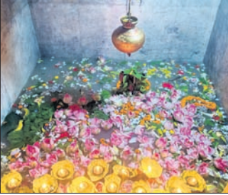
ଭାମସେନ ଏକାଦଶୀ ଗାୟତ୍ରୀ ଜପତୀ ଅବସରରେ ସିଦ୍ଧେଶ୍ୱର ମହାଦେବଙ୍କ ଜଳାଭିଷେକ ଅନୁଷ୍ଠିତ ହୋଇଯାଇଛି। ସିଦ୍ଧେଶ୍ୱର ବେଣ୍ଟିସ୍ଥିତ ସିଦ୍ଧେଶ୍ୱର ମହାଦେବ ମନ୍ଦିର ପ୍ରସ୍ତୁତ ହୋଇଥିବା ସମ୍ବଲପୁର ମହାନଗର କାର୍ଯ୍ୟାଳୟରେ ପ୍ରସ୍ତୁତ ହୋଇଥିବା ସିଦ୍ଧେଶ୍ୱର ମହାଦେବଙ୍କ ଜଳାଭିଷେକ କରିଥିଲେ। ବିଧିପୂର୍ବକ ପୂଜାର୍ଚ୍ଚନା କରାଯାଇ ମଙ୍ଗଳଆରତୀ ହୋଇଥିଲା। ଉଲ୍ଲେଖଯୋଗ୍ୟ ଯେ, ସମ୍ବଲପୁରର ଶେଷ ରାଜା ନାରାୟଣ ବିଂକ ପାଟିରାଣୀ ୧୮୪୦ ମସିହାରେ ଏଠାରେ ସିଦ୍ଧେଶ୍ୱର ମହାଦେବଙ୍କ ମନ୍ଦିର ନିର୍ମାଣ କରିଥିଲେ। ଏହାସହ ମନ୍ଦିର ରକ୍ଷଣାବେକ୍ଷଣ ପାଇଁ ସିଦ୍ଧେଶ୍ୱର ବେଣ୍ଟି ଗ୍ରାମ ପ୍ରତିଷ୍ଠା କରିଥିଲେ।