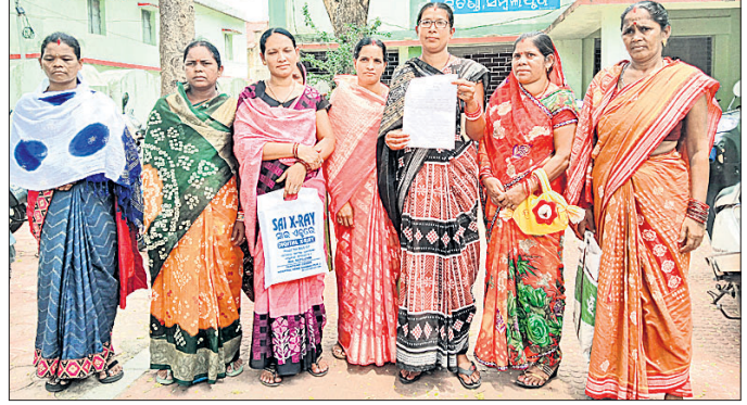
ଦାବିପତ୍ର ଦେବାକୁ ଆସିଥିବା ପତ୍ରାପାଲି ଗ୍ରାମର ମହିଳାମାନେ।

ଦାବି ସତ୍ତ୍ୱେ ବିଭାଗୀୟ କର୍ତ୍ତୃପକ୍ଷ ରାସ୍ତା ମରାମତି ପାଇଁ ଚେଷ୍ଟର ହୋଇଥିବା କହି ସମୟ ଗତାଳ ଚାଲିଥିଲେ। ସାଧାରଣ ନିର୍ବାଚନ ପୂର୍ବରୁ ଅଞ୍ଚଳବାସୀ ଏନେଇ ଆନ୍ଦୋଳନ ସହ ଭୋଟ ବର୍ଜନ ପାଇଁ ଚେତାବନୀ ଦେଇଥିଲେ। ନିର୍ବାଚନ ଆଚରଣବିଧି ହଟିବା ପରେ ଗ୍ରାମୀୟ ଉତ୍ତର ବିଭାଗ କର୍ତ୍ତୃପକ୍ଷ କୁଆଡ଼େ କାର୍ଯ୍ୟ ଆରମ୍ଭ କରିବାକୁ ପ୍ରତିଶ୍ରୁତି ପ୍ରାପ୍ତ ଶକ୍ତି ଆରତି ରାସ୍ତା ଖାଲଖାଲ ଉପଜିଲ୍ଲାପାଳ ଭୋଇ କହିଛନ୍ତି। କୁଚିଣ୍ଡାରୁ ସମ୍ବଲପୁର ଭାୟା ସାତଜମା ରାସ୍ତା