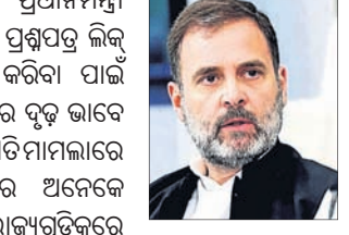
-ରାହୁଲ୍ ଗାନ୍ଧୀ, କଂଗ୍ରେସ୍ ନେତା

ନରେନ୍ଦ୍ର ମୋଦି କାହିଁକି ନୀରବ ରହିଛନ୍ତି। ପ୍ରଶ୍ନପତ୍ର ଲିକ୍ ବିରୋଧରେ କଠୋର ନୀତି ସୁନିଶ୍ଚିତ କରିବା ପାଇଁ ମୁଖ୍ୟମନ୍ତ୍ରୀଙ୍କ ସ୍ୱରୁ କଂଗ୍ରେସ୍ ପାର୍ଲିମେଣ୍ଟରେ ଦୃଢ଼ ଭାବେ ଉଠାଇବା ସହ ରାସ୍ତାକୁ ଓହ୍ଲାଇବ। ଏହି ଦୁର୍ଘଟଣା ମାମଲାର ବିଚାର, ଗୁଜରାଟ୍ ଏବଂ ହରିୟାଣାରେ ଅନେକ ଗିରଫ ହୋଇଛି। ଭାଜପା ଶାସିତ ରାଜ୍ୟଗୁଡ଼ିକରେ ଯୋଜନାବଦ୍ଧ ଭାବେ ଏନ୍‌ଇଇଟିରେ ଦୁର୍ଘଟଣା କରାଯାଇଥିବା ଏଥିରୁ ସ୍ପଷ୍ଟ ହୋଇଛି।