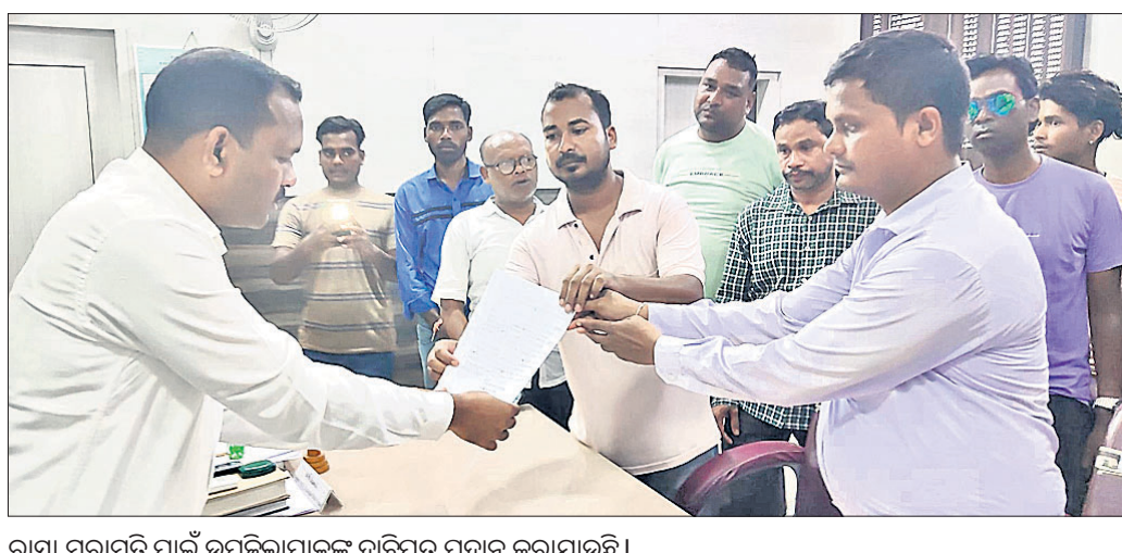
ରାସ୍ତା ମରାମତି ପାଇଁ ଉପଜିଲ୍ଲାପାଳଙ୍କୁ ଦାବିପତ୍ର ପ୍ରଦାନ କରାଯାଇଛି।

କୁଚିଣ୍ଡାରୁ ସମ୍ବଲପୁର ଜିଲ୍ଲା ପୁଞ୍ଜ୍ୟାଳୟକୁ ସଂଯୋଗ କରୁଥିବା ସାତଜମା ଗ୍ରାମ ଉତ୍ତରରେ ରାସ୍ତା ଶୋଚନୀୟ ହୋଇଛି। ବାରମ୍ବାର ଦାବି ସତ୍ତ୍ୱେ ଏହି ରାସ୍ତା ମରାମତି କରାଯାଇନାହିଁ। ଏହାର ପ୍ରତିବାଦ କରି ଆକ୍ଷୁଭ ମୋଡ଼କୁ ଆସିଛନ୍ତି ଅଞ୍ଚଳବାସୀ। ବୁଦ୍ଧିନି ମଧ୍ୟରେ ରାସ୍ତା ମରାମତି କାମ ଆରମ୍ଭ ନହେଲେ ଆୟୋଜନକୁ ଓହ୍ଲାଇଦେ ବୋଲି କୁଚିଣ୍ଡା ଉପଜିଲ୍ଲାପାଳଙ୍କୁ ମଙ୍ଗଳବାର ଦିଆଯାଇଥିବା ଦାବିପତ୍ରରେ ସେମାନେ ଦେବଦାନା ଦେଇଛନ୍ତି। ଏହି ରାସ୍ତା