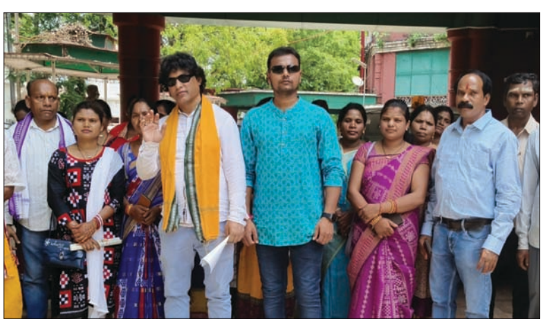
ଅଭିଭାବକ ପ୍ରତିନିଧି ଦଳ ପୁଖ୍ୟମନ୍ତ୍ରୀଙ୍କ ଉଦ୍ଦେଶ୍ୟରେ ଜିଲାପାଳଙ୍କୁ ଦାବିପତ୍ର ଦେବାକୁ ଯାଇଛନ୍ତି।