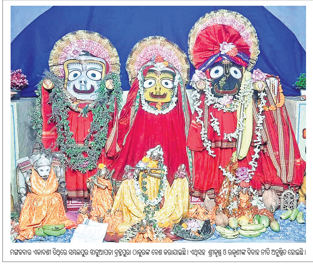
ମଙ୍ଗଳବାର ଏକାଦଶୀ ଦିନେ ସମ୍ବଲପୁର ଝାଡୁଆପଡା ବ୍ରହ୍ମପୁରା ଠାକୁରଙ୍କ ବେଶ କରାଯାଇଛି। ଏଥିସହ ଶ୍ରୀକୃଷ୍ଣ ଓ ରାଜକୃଷ୍ଣ ବିବାହ ନାଚ ଅନୁଷ୍ଠିତ ହୋଇଛି।

ସମ୍ବଲପୁର ମୋତିଝରଣରେ ବନ୍ଧା ହୋଇ ରହିଥିବା ୬ଟି ଗାଈ ଓ ୩ଟି ବାଛୁରୀକୁ ଉଦ୍ଧାର କରି ପୋଲିସ୍ ସମ୍ବଲପୁର ଚାଲଣା ଉଦ୍ଦେଶ୍ୟରେ ଗୋରୁଗୁଡ଼ିକୁ ବାନ୍ଧି ରଖାଯାଇଥିଲା। ତେବେ କିଏ ଓ କାହିଁକି ବାନ୍ଧି ରଖାଯାଇଛି ତାହା ଜଣା ପଡ଼ିନାହିଁ। ସ୍ଥାନୀୟ ଲୋକଙ୍କଠାରୁ ସୂଚନା ପାଇ ଧରୁପାଲି ଓ ସଦର ଥାନା ପୋଲିସ୍ ଚଢ଼ାଉ କରିଥିଲା। ପୋଲିସ୍ ଗୋରୁକୁ ଉଦ୍ଧାର କରି ଗୋଶାଳାକୁ ସ୍ଥାନାନ୍ତର କରିଛି। ତେବେ ଗୋରୁଙ୍କ ଦାବିଦାର କେହି ସାମନାକୁ ନ ଆସିବାରୁ କୌଣସି ମନ୍ଦ ଉଦ୍ଦେଶ୍ୟରେ ସେମାନଙ୍କୁ ଏଠାରେ ବାନ୍ଧି ରଖାଯାଇଥିବା ସନ୍ଦେହ କରାଯାଇଛି। ଏହାକୁ ନେଇ ତଦନ୍ତ କରାଯାଉଥିବା ପୋଲିସ୍ କହିଛି।