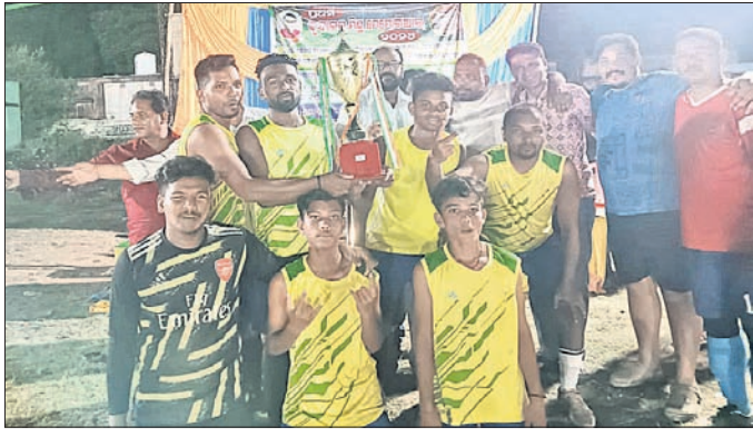
ଚୁପି ସହ ଚାମ୍ପିୟନ ତରଭା ମର୍ଦ୍ଦି କ୍ଲବର ଖେଳାଳିମାନେ ।

ସୁବର୍ଣ୍ଣପୁର ଜିଲ୍ଲା ତରଭା ଖେଳ ପଡ଼ିଆରେ ଚାଲିଥିବା ଦୁଇଦିନିଆ ଚୁକାବନ ମେମୋରିଆଲ ଫୁଟ୍‌ବାଲ ଟୁର୍ଣ୍ଣାମେଣ୍ଟ ସୋମବାର ରାତିରେ ଉଦ୍‌ଘାଟିତ ହୋଇଯାଇଛି । ପ୍ରଥମ ସହାୟରେ ଲିଗ ମ୍ୟାଚରୁ ଚିତ୍ତାଗଡ଼, କମସରା, ତରଭା ମର୍ଦ୍ଦିକ୍ଲବ୍, ତରଭା ପାଟନେଶ୍ୱରୀ ସେମିଫାଇନାଲ ପର୍ଯ୍ୟାୟରେ ପହଞ୍ଚିଥିଲେ । ସୋମବାର ପାଇନାଲ ଖେଳ ତରଭା ମର୍ଦ୍ଦି କ୍ଲବ୍ ଓ ତରଭା ପାଟନେଶ୍ୱରୀ କ୍ଲବ୍ ମଧ୍ୟରେ ଅନୁଷ୍ଠିତ ହୋଇଥିଲା । ଏଥିରେ ୩-୨ଗୋଲରେ ତରଭା ମର୍ଦ୍ଦି କ୍ଲବ୍ ଚାମ୍ପିୟନ ହୋଇଥିଲା । ଏହି ଉପଲକ୍ଷେ ଆୟୋଜିତ ପୁରସ୍କାର ବିତରଣ ସଭାରେ ମୁଖ୍ୟ ଅତିଥିଭାବେ ପୂର୍ବତନ କାଉଁଶସିଲର