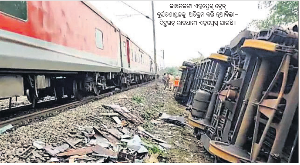
କାଞ୍ଚନଜଙ୍ଗ ଏକ୍ସପ୍ରେସ୍ ଟ୍ରେନ୍ ଦୁର୍ଘଟଣାସ୍ଥଳକୁ ଅତିକ୍ରମ କରି ନୂଆଦିଲ୍ଲୀ-ଦିବ୍ରୁଗଡ଼ ରାଜଧାନୀ ଏକ୍ସପ୍ରେସ୍ ଯାଉଛି।