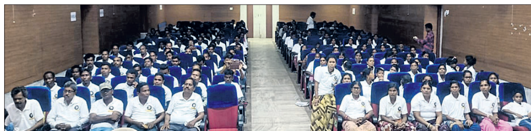
ଆର୍ଟ ଅଫ୍ ଗିଫ୍ କାର୍ଯ୍ୟକ୍ରମରେ ଉପସ୍ଥିତ ଜନତା ।

ବରଗଡ଼, ୧୮୬(ପ୍ରେମାନନ୍ଦ ଖମାରୀ) ବରଗଡ଼ରେ ଆର୍ଟ ଅଫ୍ ଗିଫ୍ କାର୍ଯ୍ୟକ୍ରମ ଅନୁଷ୍ଠିତ ହୋଇଯାଇଛି । ତ. ଅଧିକାରୀଙ୍କ ପରିଚାଳନାରେ ଦୀର୍ଘ ୧୧ ବର୍ଷ ଧରି ପ୍ରତିବର୍ଷ ଚାଲିଥିବା ଏହି କାର୍ଯ୍ୟକ୍ରମ ସୋମବାର ବରଗଡ଼ ବିଜୁ ପଟ୍ଟନାୟକ ଗାଉଁଶ ହଲରେ ହୋଇଥିଲା । କାର୍ଯ୍ୟକ୍ରମରେ ଅବସରପ୍ରାପ୍ତ ପ୍ରଶାସିକା ତ. ଚପ୍ପିନୀ ରୁଢ଼ି, ଅବସରପ୍ରାପ୍ତ ପ୍ରାଧ୍ୟାପକ