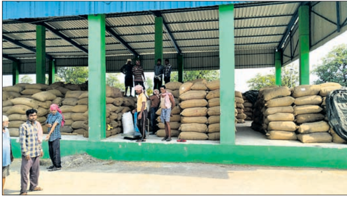
ବିନିକା ବ୍ଲକର ଏକ ମଣ୍ଡିରେ ଚାଷୀଙ୍କ ନିକଟରୁ ଧାନ କିଣାଯାଇଛି ।

ସୁବର୍ଣ୍ଣପୁର ଜିଲ୍ଲାରେ ମେ ୨୨ ତାରିଖରୁ ରବି ଧାନ ସଂଗ୍ରହ ପ୍ରକ୍ରିୟା ଆରମ୍ଭ ହୋଇଥିଲା । ଆଉ ୪ ଦିନ ପରେ ଧାନ ସଂଗ୍ରହ ପ୍ରକ୍ରିୟାକୁ ଏକ ମାସ ପୂରିବ । ମଣ୍ଡିରେ ଧାନ ଥିଲେ ନିୟମ ଅନୁଯାୟୀ ଜୁନ ୩୦ ପର୍ଯ୍ୟନ୍ତ ସରକାର ଚାଷୀଙ୍କ ନିକଟରୁ ଧାନ କିଣିବେ । ତେବେ ଜିଲ୍ଲାରେ ଆଉ ଅଗ ଭଳି ମଣ୍ଡି ଧାନ ଆସୁନି । ମୌସୁମୀ ସୂକ୍ଷ୍ମ ହେବା ପୂର୍ବରୁ ମଣ୍ଡି ଗୁଡ଼ିକ ଖାଁଖାଁ ଲାଗୁଛି । ଜଳସେଚିତ ବିନିକା ଓ ବୁଢ଼ିପାଲି ବ୍ଲକର ମାତ୍ର ୪ରୁ ୫ଟି ମଣ୍ଡିରେ ଏବେ ଧାନ ଅଛି । ସେହିପରି ତରଭା, ସୋନପୁର, ଭଲୁଣ୍ଡା ଓ ବୀରମହାରାଜପୁର ବ୍ଲକରେ ବିଳମ୍ବରେ ଧାନ କିଣା ଆରମ୍ଭ ହୋଇଥିଲା ବେଳେ ଆଉ ୩ ରୁ ୪ଦିନ ନିୟମ ଅନୁଯାୟୀ ସରକାରୀ ସାହାଯ୍ୟ ଯୋଗାଇ ଦିଆଯିବ ବୋଲି କହିଛନ୍ତି ।