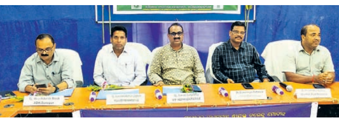
କୃଷି ବିଜ୍ଞାନ କେନ୍ଦ୍ରରେ ଆୟୋଜିତ କାର୍ଯ୍ୟକ୍ରମରେ ଅତିଥି ବୃନ୍ଦ ।

ଯୋଗାଣ ନିଗମ ଜିଲାର ପଞ୍ଜୀକୃତ ଚାଷୀଙ୍କ ନିକଟରୁ ବଳକା ଧାନ କିଣିଛି । ସରକାର ଜିଲ୍ଲାକୁ ପ୍ରଥମ ପର୍ଯ୍ୟାୟରେ ୨୨ଲକ୍ଷ ୯୯ହଜାର ୭୯୫କୃଲଖିଲ ଧାନ କିଣିବା ପାଇଁ ଚାର୍ଗେଟ୍ ଦେଇଛନ୍ତି । ସେହି ଚାର୍ଗେଟ୍ ଏ ପର୍ଯ୍ୟନ୍ତ ପୁରଣ ହେଉନାହିଁ । ମଣ୍ଡିକୁ କମ ପରିମାଣରେ ଧାନ ଆସୁଛି । ମଙ୍ଗଳବାର ପୁଣି ଜିଲାର ୨୨ହଜାର ୮୨ଚାଷୀଙ୍କ ନିକଟରୁ ଧାନ କିଣାଯାଇଛି । ଗତ ରବି ରବୁରେ ଏହି ଜିଲ୍ଲାରୁ ସରକାର ୨୨ଲକ୍ଷ ୯୯ହଜାର ୮୨୯କୃଲଖିଲ ଧାନ କିଣିଥିଲେ । ପୂର୍ବ ବର୍ଷ ମାନଙ୍କରେ ଜିଲାର ଚାଷୀଙ୍କ ନିକଟରୁ ୨୩ଲକ୍ଷ କୃଲଖିଲରୁ ଊର୍ଦ୍ଧ୍ୱ ଧାନ ସଂଗ୍ରହ ହେଉଥିଲା । ତେବେ ଧାନ ଅମଳ ହ୍ରାସ ପାଇଛି କିମ୍ବା ଆସକା ଖରିଫରେ ଅଧିକ ଦରରେ ବିକ୍ରି କରିବା ପାଇଁ ବଡ଼ ବ୍ୟବସାୟୀ ମାନେ ଧାନକୁ ଗଢ଼ିତ କରି ରଖୁଛନ୍ତି ତାହା ତଦନୁସାରେ ସ୍ପଷ୍ଟ ହେବ ବୋଲି ଆଲୋଚନା ହେଉଛି ।