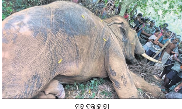
ମୃତ ଦକ୍ଷାହାତୀର ଛବି।