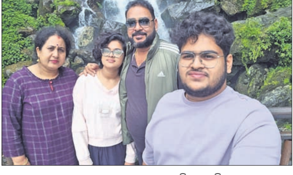
ଉଦ୍ଧାର ହୋଇଥିବା ଓଡ଼ିଆ ପର୍ଯ୍ୟଟକ ସମେତ ସେନାଧିକାରୀଙ୍କ ଛବି।

ଉଦ୍ଧାର ପରେ ସିଲିଗୁଡ଼ିରେ ପହଞ୍ଚିଲେ ଓଡ଼ିଆ ପର୍ଯ୍ୟଟକ ଯୋଗୁ ଫସି ରହିଥିଲେ। ସେନାଧିକାରୀଙ୍କୁ କୃତଜ୍ଞତା ଜଣାଇ ସମସ୍ତଙ୍କୁ ଉଦ୍ଧାର କରାଯାଇଛି।