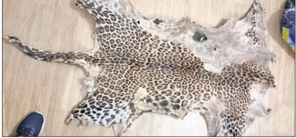
ଜବତ ହୋଇଥିବା ବାଘଛାଇର ଛବି।