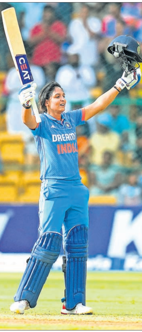
ଶତକ ହାସଲ ପରେ ଭାରତର ହରମନ୍‌ପ୍ରାତ କୌର ଓ ସ୍ଟୁଟ ମାନ୍ସାନା।