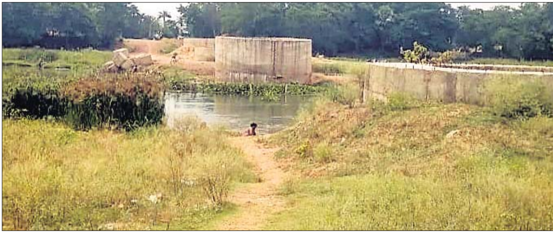
ବିରୁଦ୍ଧ ନଦୀରେ ସେତୁ ନିର୍ମାଣ କାର୍ଯ୍ୟ ଅଧାପଡ଼ିଆ ଅବସ୍ଥାରେ ପଡ଼ିଛି।

ଯାଜପୁର ଜିଲ୍ଲା ବିରୁଦ୍ଧ-ବାଲିଚନ୍ଦ୍ରପୁର ପୂର୍ବ ବିଭାଗ ରାସ୍ତାର ଗୁଳିଚିପାଟଣାରେ ବିରୁଦ୍ଧ ନଦୀ ଉପରେ ନିର୍ମାଣ ହେଉଥିବା ସେତୁ କାର୍ଯ୍ୟ ଅଧାରୁ ବନ୍ଦ ହୋଇଛି। ନିର୍ମାଣକାରୀ ଠିକା ସଂସ୍ଥା ୨ ବର୍ଷ ହେବ କାମ ଛାଡ଼ି ପକାଇଛି।