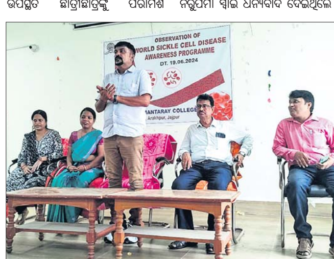
ସଚେତନତା କାର୍ଯ୍ୟକ୍ରମରେ ଯୋଗଦେଇଥିବା ଅତିଥିମାନେ।

ରଘୁଜୟ, ୧୯/୬ (ରଞ୍ଜିତ ରାଉତ): ଗ୍ରାମର ନିରାକାର ପ୍ରଧାନ(୪୩)। ସେ ରୁଧିର ଅପଚାୟ ପ୍ରାୟ ୪୮୧୦୦ର ଜୀବନ ଠାକୁରାଣୀ ଯାଉଥିବା ସମୟରେ ଉପରାହସ୍ୟରୁ ବାଳେଶ୍ୱର ଅଭିମୁଖେ ଯାଉଥିବା ବେଳେ ବସ୍ ଧଙ୍କାରେ ଯାଉଥିବା ସମୟରେ ମୃତ୍ୟୁ ବରଣ ହେଲା।