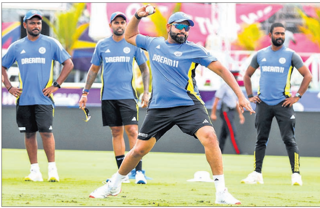
ବାର୍ବାଡୋସ୍ରେ ରୁଧିର ଅଭ୍ୟାସ ଅବସରରେ ଭାରତୀୟ ଦଳର ଅଧିନାୟକ ରୋହିତ ଶର୍ମା ଓ ଅନ୍ୟ ଖେଳାଳିମାନେ।

ଚିତ୍ର ୯୦ ବିଶ୍ୱକପର ସୁପର-୮ରେ ଗ୍ରୃହ ଏବଂ ଭାରତ ଏହାର ପ୍ରଥମ ମ୍ୟାଚରେ ରୁଧିର ଆଫଗାନିସ୍ତାନକୁ ଭେଟିବ।