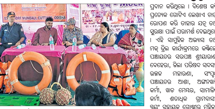
ବିପର୍ଯ୍ୟୟ ମୁକାବିଲା ବୈଠକରେ ଯୋଗଦେଇଥିବା ଅତିଥି ।