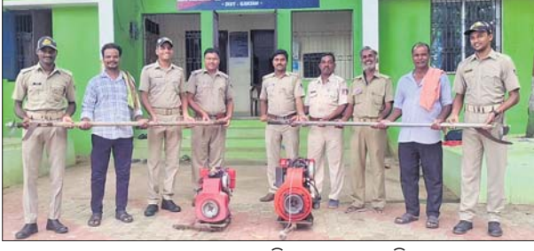
ଜବତ ମୋଟରକୁ ପୋଲିସ୍ ହସ୍ତାନ୍ତର କରୁଛି।

ଖଲିକୋଟ, ୧୯.୬ (ପ୍ରଶାନ୍ତ କୁମାର ମିଶ୍ର) ଗତ ୧୭ ତାରିଖରେ ପୋଲିସ୍ ଜବତ କରିଥିବା ଦୁଇଟି ଡଙ୍ଗାରେ ବ୍ୟବହୃତ ମୋଟରକୁ ବୁଧବାର ଡଙ୍ଗା ମାଲିକଙ୍କୁ ହସ୍ତାନ୍ତର କରାଗଲା।