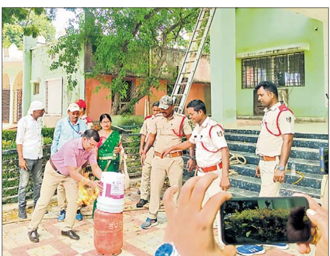
ଯାଜପୁର ମିଶନ ଶକ୍ତି ଭବନରେ ଗ୍ୟାସ୍ ବିଲିଭର ଦୁର୍ଯ୍ୟତଣା ଉପରେ ସଚେତନତା କରାଯାଇଛି।

ବଡ଼ତଣା କଳ ଅନ୍ତର୍ଗତ ନୁଆହାବସ୍ଥିତ ବିଷୁ ସାମୁଦ୍ରିକ ମହାବିଦ୍ୟାଳୟ ପରିସରରେ ବିଶ୍ୱ ସିକଲସେଲ ରୋଗ ସଚେତନତା କାର୍ଯ୍ୟକ୍ରମ ଅନୁଷ୍ଠିତ ହୋଇଯାଇଛି।