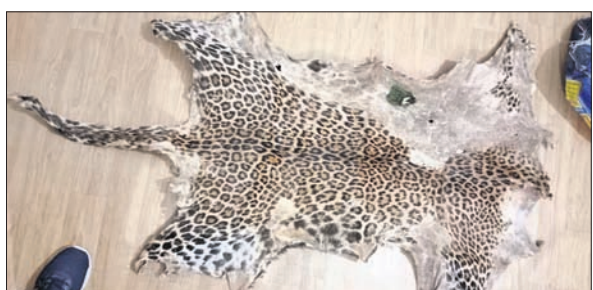
ଜବତ ହୋଇଥିବା କଳରାପତରିଆ ବାଘଛାଇ