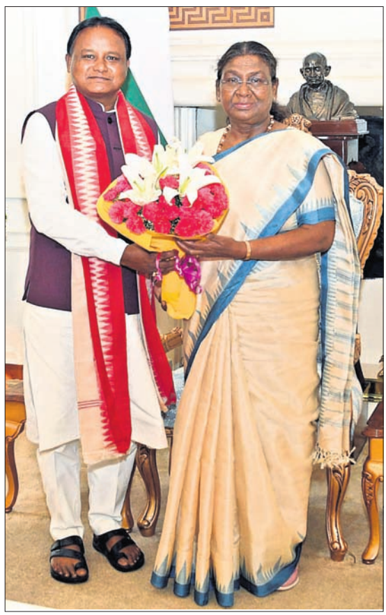
ନୂଆଦିଲ୍ଲୀରୁ ରାଷ୍ଟ୍ରପତି ଭବନରେ ରୁରୁବାର ରାଷ୍ଟ୍ରପତି ଦ୍ରୌପଦୀ ମୁର୍ମୁଙ୍କୁ ସାକ୍ଷାତ କରୁଥିବା ମୁଖ୍ୟମନ୍ତ୍ରୀ ମୋହନ ଚରଣ ମାଝୀ।