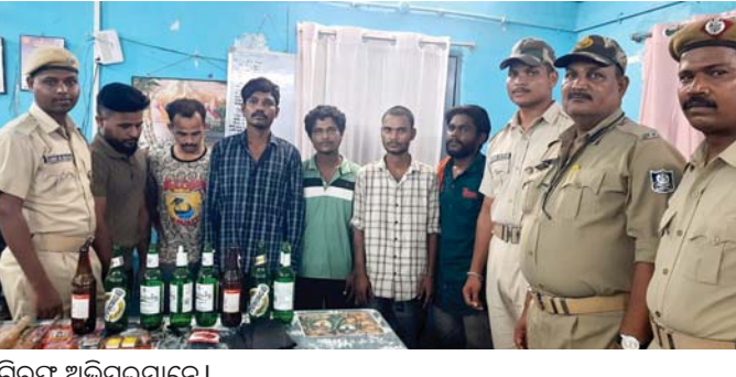
ଗିରଫ ଅଭିଯୁକ୍ତମାନେ ।

ଟଙ୍କା ଜବତ କରିଛି । ରାତିରେ ବ୍ରହ୍ମପୁର ରେଳଷ୍ଟେଶନ ଦେଇ ଯାଉଥିବା ଟ୍ରେନ୍‌ରେ ସେମାନେ ଯାତ୍ରୀଙ୍କୁ ଚାର୍ଜେଜ୍ କରୁଥିବା ପୋଲିସ୍ ଜେରା ବେଳେ କାଣିବାକୁ ପାଇଛି । ଗୁରୁବାର ନଂ. ୫୩/୨୪ରେ ସମଗ୍ର କୋର୍ଟ ଚାର୍ଜା ପରେ ବିଚାର ବିଭାଗର ହାଜତକୁ ପଠାଇ ଦିଆଯାଇଛି ।