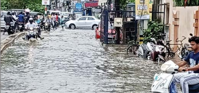
ଗାନ୍ଧୀନଗର ମୁଖ୍ୟ ରାସ୍ତାରେ ନର୍ଦ୍ଦମା ପାଣି ଭାସୁଛି ।

ବ୍ରହ୍ମପୁର, ୨୭/୬ (ସୁତ ରଞ୍ଜନ ମହାଲିକ) ବର୍ଷା ପ୍ରବାହରେ ସହରର ମୁଖ୍ୟ ରାସ୍ତାରେ ଯାତାୟତ ବାଧାପ୍ରାପ୍ତ ହୋଇଛି । ଗୁରୁବାର ସକାଳ ୧୧ଟାରେ ହଠାତ ବର୍ଷା ହେବା ଫଳରେ ଗାନ୍ଧୀ ନଗର ମୁଖ୍ୟ ରାସ୍ତାରେ ପାଣିର ସୁଅ ବୁଡ଼ିଥିଲା । ରାସ୍ତା ପାର୍ଶ୍ୱରେ ନର୍ଦ୍ଦମା ପାଣିର ସୁଅ ଖେଳିଥିଲା । ଫଳରେ ଯାନବାହନ ଯାତାୟତ ସମୟରେ ପାଣିରେ ବୁଡ଼ି ଯାଇଥିଲା । ଉକ୍ତ ରାସ୍ତାରେ ଦୀର୍ଘ ସମୟ ଧରି ଯାତାୟତ ବାଧାପ୍ରାପ୍ତ ହୋଇଥିଲା । ସ୍କୁଲ ଓ କଲେଜ ବସ ରୁଟିକ ବସ ମଧ୍ୟ ଯାତାୟତରେ ବାଧା ସୃଷ୍ଟି ହୋଇଥିଲା । ଫଳରେ ରାସ୍ତାରେ ଟ୍ରାଫିକ୍ ଜାମ ହୋଇଥିଲା । ଏହାପରେ ସ୍ଥାନୀୟ କର୍ମଚାରୀଙ୍କ ପକ୍ଷରୁ ପିପିଆର ସଫେଇ କର୍ମରେ ଯତ୍ନ ନେଇ ପାଣି ହଟିଥିଲା । ଏକେଡ୍ରିକୁ ଅବଗତ କରାଗଲା ।