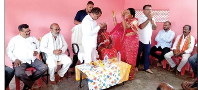
ମନ୍ତ୍ରୀ ଲୋକଙ୍କ ସହ ଆଲୋଚନା କରୁଛନ୍ତି ।