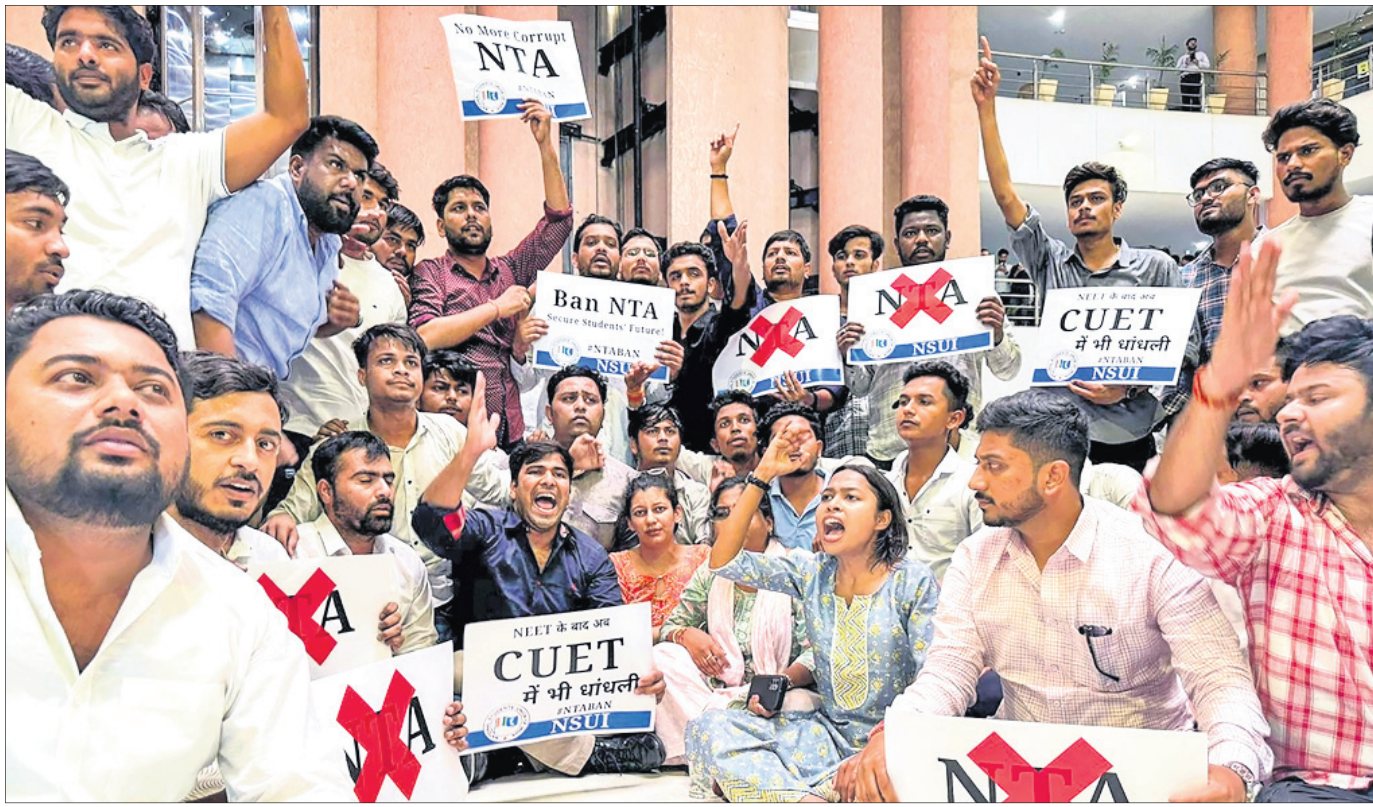
ନୂଆଦିଲ୍ଲୀରୁ ଏନ୍‌ଟିଏ କାର୍ଯ୍ୟକ୍ରମରେ ଗୁରୁବାର କଂଗ୍ରେସ ଛାତ୍ରଶାଖା ଏନ୍‌ଏସ୍‌ୟୁଆଇ କର୍ମକର୍ମୀ ପ୍ରବେଶ କରି ବିକ୍ଷୋଭ ପ୍ରଦର୍ଶନ କରୁଛନ୍ତି।

ଏନ୍‌ଇଇଟି-ୟୁଜି ପରୀକ୍ଷା ଆୟୋଜକ ସଂସ୍ଥାକୁ ସୁପ୍ରିମକୋର୍ଟ, ହାଇକୋର୍ଟଙ୍କ ନୋଟିସ