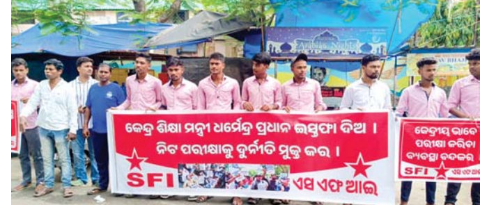
ଏସ୍.ଏମ୍.ଆଇ. ପକ୍ଷରୁ ବିକ୍ରୋଧ ପ୍ରଦର୍ଶନ କରାଯାଇଛି ।

ଗୁଡ଼ିକରେ ଅଭିଜ୍ଞତା ଓ ପାରଦର୍ଶିତା ପରିବର୍ତ୍ତେ ଦକାୟ ନେତାମାନଙ୍କୁ ନିୟୁତ୍ରି ଦିଆଯାଉଛି । ଫଳରେ ଧାରାବାହିକ ଦେଇ ତାଙ୍କୁ ତ୍ରୁଟି କିଣା ହେଉଥିବାରୁ ଛାତ୍ରଛାତ୍ରୀ ହତାଶ ହୋଇପଡ଼ିଛନ୍ତି । ନ୍ୟାୟ ପାଇଁ ଦେଶ ବ୍ୟାପୀ ଛାତ୍ରଛାତ୍ରୀ ଆନ୍ଦୋଳନ କରୁଛନ୍ତି । କେନ୍ଦ୍ର ଶିକ୍ଷା ମନ୍ତ୍ରୀ ନିରାହ ଛାତ୍ରଙ୍କୁ ନ୍ୟାୟ ଦେବା ପରିବର୍ତ୍ତେ ଦୁର୍ନୀତିର ଗଣାଘର ପାଲଟିଥିବା ଏବଂ ଏହାର ଅର୍ଥସରଳ ସଂଘ ଘୋଡ଼ାଉବା ପାଇଁ ଯୋଜନା କରୁଛନ୍ତି । ଗୁରୁତ୍ୱପୂର୍ଣ୍ଣ ଶିକ୍ଷାନୁଷ୍ଠାନ