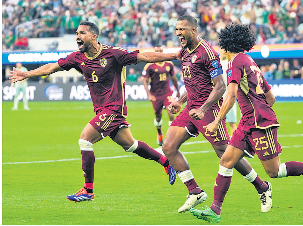
ମ୍ୟାଚ ଜିତିବା ପରେ ଭେନେଜୁଏଲା ଖେଳାଳିଙ୍କ ଆନନ୍ଦ ଭରାସା।

ମିନିଟରେ ଗୋଟିଏ ଲେଖାଏ ଗୋଲ ଦେଇଥିଲେ। ଟେକ୍ ରିପବ୍ଲିକ ପକ୍ଷରୁ ଟୋମାସ ସୌସେକ(୬୬) ମିନିଟରେ ଏକମାତ୍ର ଗୋଲ ଦେଇଥିଲେ। ଟେକ୍ ରିପବ୍ଲିକ ପକ୍ଷରୁ ଆଣ୍ଡ୍ରେସ୍ ବାରାକ ମ୍ୟାଚ୍ରେ ୨୦ ତମ ମିନିଟରେ ୯୦+୮ ମିନିଟରେ ଟୋମାସ ଟୋରିକୁ ରେଡ୍ କାର୍ଡ ମିଳିଥିଲା। ଫାଇନାଲ କାରଣରୁ ୨୦ ତମ ମିନିଟରେ ଆଣ୍ଡ୍ରେସ୍ ବାରାକକୁ ରେଡ୍ କାର୍ଡ ମିଳିବା ପରେ ମ୍ୟାଚ୍ରେ ଅବଶିଷ୍ଟ ସମୟ ହଲ ୧୦ ଜଣ ଖେଳାଳିରେ ଖେଳିଥିଲା। ପ୍ରଥମାର୍ଦ୍ଧ ଗୋଲ ଶୂନ୍ୟ ରହିବା ପରେ ଦ୍ୱିତୀୟାର୍ଦ୍ଧରେ ଟୁର୍ଣ୍ଣାମେଣ୍ଟରୁ ହକାନ୍ ଟାଲୋନଗୋଲ ୫୧ ତମ ମିନିଟରେ ପ୍ରଥମ ଗୋଲ ଦେଇଥିଲେ। ଏହାର ୧୫ ମିନିଟ ମଧ୍ୟରେ ଟୋମାସ ସୌସେକ ଏହି ଗୋଲ ପରିଶୋଧ କରିଥିଲେ। ମ୍ୟାଚ୍ ସୁପେର୍ ଟାଇମକୁ ଯାଇଥିବା ବେଳେ ସେକ୍ ଟୋସୁର୍ ନିର୍ଣ୍ଣାୟକ ଗୋଲ ଦେଇ ଦଳକୁ ବିଜୟୀ କରିଥିଲେ। ଅନ୍ତିମ ସେକେଣ୍ଡରେ ଟେକ୍ ରିପବ୍ଲିକ ଟୋମାସ ଟୋରିକୁ ମ୍ୟାଚ୍ରେ ଦ୍ୱିତୀୟ ରେଡ୍ କାର୍ଡ ମିଳିଥିଲା। ଗୁପ୍ତ ଏଫ୍ରେ ପ୍ରଥମ ଘ୍ନାନରେ ରହିଥିବା ଟୁର୍ଣ୍ଣାମେଣ୍ଟର ଅଫ୍ ୧୬ରେ ପ୍ରବେଶ କରିଛି। ଦ୍ୱିତୀୟ ମ୍ୟାଚ୍ରେ ରୋମାନିଆ ଓ ସ୍ୱେଡେନ ମଧ୍ୟରେ ଡ୍ରରେ ଶେଷ ହୋଇଥିଲା। ରୋମାନିଆ ପକ୍ଷରୁ ରାଭର୍ତ୍ତାନ୍ ମାରିନ୍(୩୭) ଓ ସ୍ୱେଡେନ ପକ୍ଷରୁ ଓଲ୍ଡେନ୍ ଟୁଡା(୨୪) ମିନିଟରେ ଗୋଟିଏ ଲେଖାଏ ଗୋଲ ଦେଇଥିଲେ। ଉଭୟ ଦଳ ସମାନ ୪ ପଏଣ୍ଟ ଲେଖାଏ ପାଇଥିବା ବେଳେ ପ୍ରଥମ ଓ ଦ୍ୱିତୀୟ ଘ୍ନାନରେ ରହି ରାଉଣ୍ଡ ଅଫ୍ ୧୬ରେ ପ୍ରବେଶ କରିଛନ୍ତି। ଏହି ଗୁପ୍ତରେ ଦ୍ୱିତୀୟ ଘ୍ନାନରେ ଥିବା ବେଳେ ଟୋମାସ ସୌସେକ(୫୧ ମିନିଟ) ଓ ସେକ୍ ଟୋସୁର୍ (୯୦+୪)