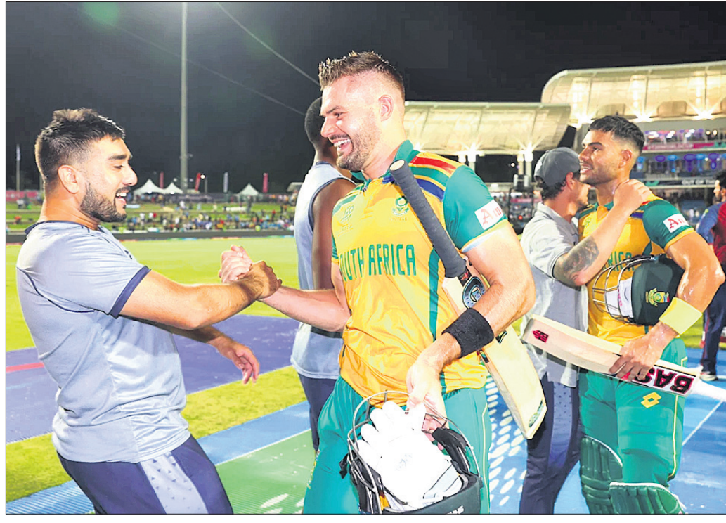
ମ୍ୟାଚ ପିନ୍ଧିଶୁଣିତ ଫେଟୁଥିବା ଅଧିନାୟକ ଏତେନ ମାରକ୍ରମକ ଚାଟ୍ରାଜକ୍ ଶାମ୍‌ସି ଅଭିନନ୍ଦନ ଜଣାଉଛନ୍ତି।

ଆଇସିସି କ୍ରିକେଟ ବିଶ୍ୱକପ୍‌ର ସେମିଫାଇନାଲରେ ପରାଜୟ ଧାରା ଭାଙ୍ଗିଛି ଦକ୍ଷିଣ ଆଫ୍ରିକା। ଘାତକ ବୋଲିଂ କରି ଏହି ଦଳ ଗୁରୁବାର ଅନୁଷ୍ଠିତ ଚିତ୍ର ୨୦ କ୍ରିକେଟ ବିଶ୍ୱକପ୍‌ର ସେମିଫାଇନାଲରେ ଆଫଗାନିସ୍ତାନକୁ ୯ ରଜକେଟରେ ପରାସ୍ତ କରିଛି। ଚମତ୍କାର ପ୍ରଦର୍ଶନ କରି ପ୍ରଥମଥର ପାଇଁ କୌଣସି ଆଇସିସି ବିଶ୍ୱକପ୍‌ର ଫାଇନାଲରେ ପ୍ରବେଶ କରିଛି ଏହି ଆଫ୍ରିକୀୟ ଦଳ। ପୂର୍ବରୁ ୬ ଥର ବିଭିନ୍ନ ବିଶ୍ୱକପ୍‌ର ସେମିଫାଇନାଲ ଖେଳିବା ସତ୍ତ୍ୱେ ନିରାଶ ହୋଇଥିବା ଦକ୍ଷିଣ ଆଫ୍ରିକା ଏଥର ୮ମ ଉଦ୍ୟମରେ ଫାଇନାଲରେ ପ୍ରବେଶ କରି ଇତିହାସ ରଚିଛି। ଏହି ଦଳ ୬ ଥର ସେମିଫାଇନାଲରେ ସିଧାସଳଖ ପରାଜିତ ହୋଇଥିଲା। ୧୯୯୯ ବିଶ୍ୱକପ୍‌ରେ ଅଷ୍ଟ୍ରେଲିଆ-ଦକ୍ଷିଣ ଆଫ୍ରିକା ସେମିଫାଇନାଲ ଟାଇ ହୋଇଥିଲେ ହେଁ ସୁପର-୬ର ଉଚ୍ଚତ ଦଳଭାବେ ଅଷ୍ଟ୍ରେଲିଆ ଫାଇନାଲରେ ପ୍ରବେଶ କରିଥିଲା। ଏଥର କିନ୍ତୁ ଏହି ଧାରାରେ ପରିବର୍ତ୍ତନ ଆଣିଛି ଏତେନ ମାରକ୍ରମକ ଦଳ। ସମ୍ପୂର୍ଣ୍ଣ ଏକପାଖିଆଭାବେ ଶେଷ ହୋଇଥିବା ମ୍ୟାଚରେ ଆଫଗାନିସ୍ତାନ ୧୧.୫ ଓଭରରେ ୫୬ ରନରେ ଅଲଆଉଟ ହୋଇଥିବାବେଳେ ଦକ୍ଷିଣ ଆଫ୍ରିକା ୮.୫ ଓଭରରେ ୧ ରଜକେଟ ହରାଇ ୬୦ ରନ ସଂଗ୍ରହ କରି ନେଇଥିଲା। ୩ଟି ରଜକେଟ ନେଇ ଆଫଗାନିସ୍ତାନର ବ୍ୟାଟିଂ ମେଡୁଲକୁ ଭାଙ୍ଗିଥିବା ଦକ୍ଷିଣ ଆଫ୍ରିକାର ମାର୍କୋ କାନସେନ ପ୍ଲେୟର ଅଫ୍ ଦି ମ୍ୟାଚ ବିବେଚିତ ହୋଇଥିଲେ।