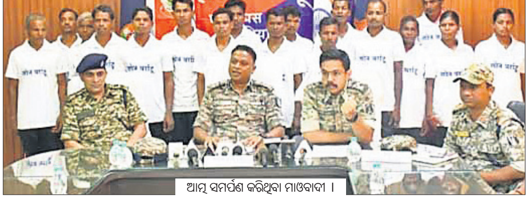
ଆତ୍ମ ସମର୍ପଣ କରିଥିବା ମାଓବାଦୀ ।