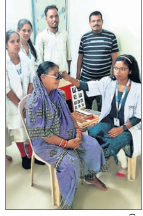
ରୋଗୀଙ୍କୁ ଚକ୍ଷୁ ପରୀକ୍ଷା କରାଯାଇଛି