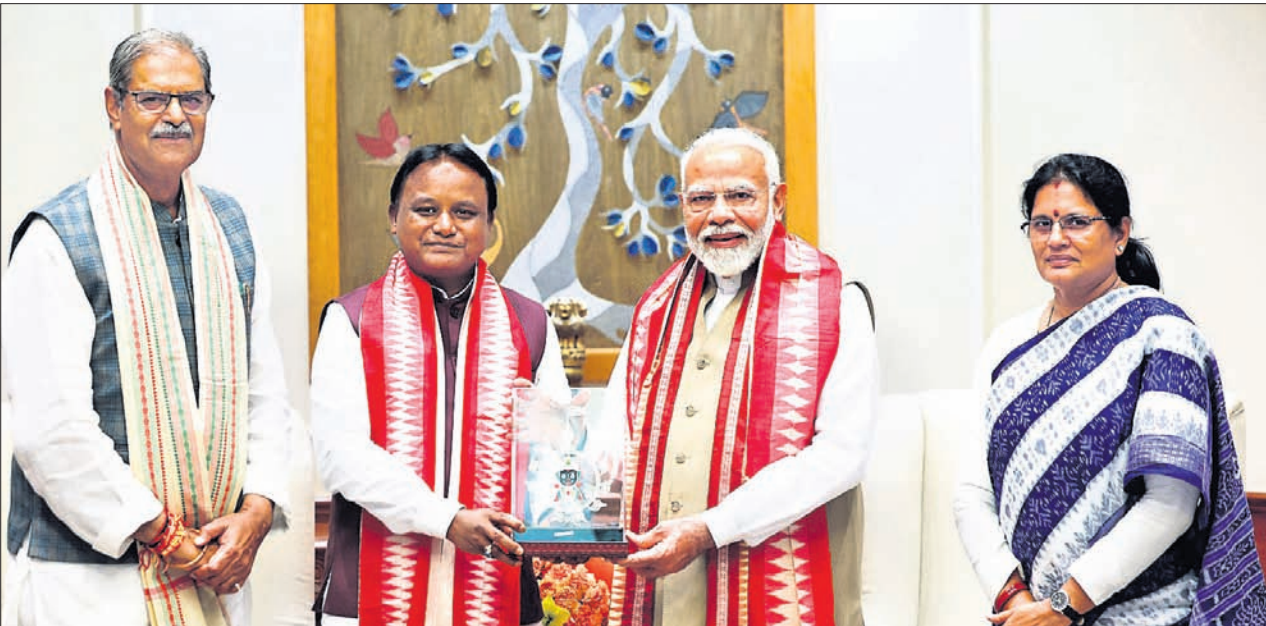
ନୂଆଦିଲ୍ଲୀରେ ପ୍ରଧାନମନ୍ତ୍ରୀ ନରେନ୍ଦ୍ର ମୋଦିଙ୍କୁ ଭେଟୁଛନ୍ତି ଓଡ଼ିଶା ମୁଖ୍ୟମନ୍ତ୍ରୀ ମୋହନ ଚରଣ ମାଝୀ, ଉପମୁଖ୍ୟମନ୍ତ୍ରୀ କନକବର୍ଦ୍ଧନ ସିଂଦେଓ ଏବଂ ପ୍ରଭାତୀ ପରିଡ଼ା ।