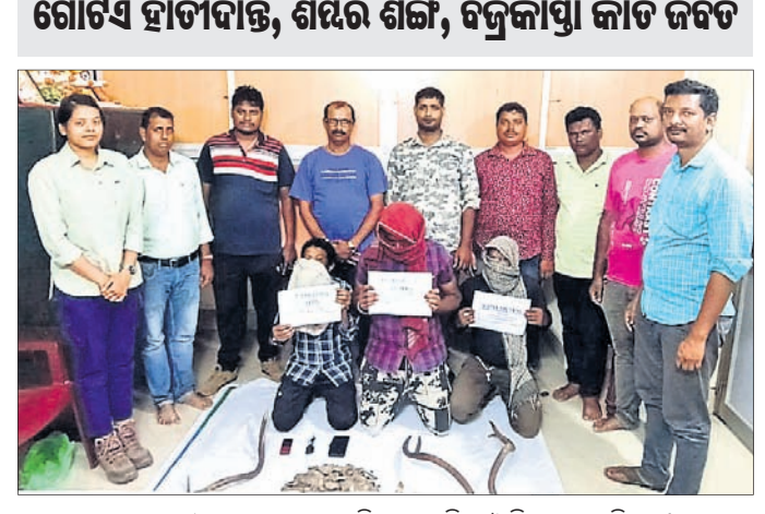
ଜବର ହାତୀବାଡ଼, ବଜ୍ରକାପ୍ତା କାଟି, ଶମ୍ଭର ଶିଳା ଓ ଗିରଫ ୩ ଅଭିଯୁକ୍ତ ।

ନାଳଗିରି, ୨୮.୬ (ପ୍ରଶାନ୍ତ କୁମାର ବିଶ୍ୱାଳ) ବେପାରୀଙ୍କ ପାଖରୁ ଗୋଟିଏ ଭଙ୍ଗା ହାତୀବାଡ଼, ବଜ୍ରକାପ୍ତା କାଟି ଓ ୩ଟି ବାଲେଶ୍ୱର ଜିଲ୍ଲା ୧୨୩୩ କାଟାୟରାଜପଥ ମୋଟର ସାଇକେଲ ଜବତ କରାଯିବାରୁ ଶୁକ୍ରବାର ଗୋଟିଏ ଭଙ୍ଗା ହାତୀବାଡ଼, ବଜ୍ରକାପ୍ତା କାଟି ଓ ୩ଟି ଶମ୍ଭର ଶିଳା ବଜ୍ର କାଟି ପାଇଁ ଟିଏ ଚାଲିଥିବା ବେଳେ କୁଳଡିଆ ବନବିଭାଗ ଓ ଜଳେଶ୍ୱର ବନବିଭାଗ ପକ୍ଷରୁ ଚଢ଼ାଉ କରାଯାଇଥିଲା । ୩ଜଣ