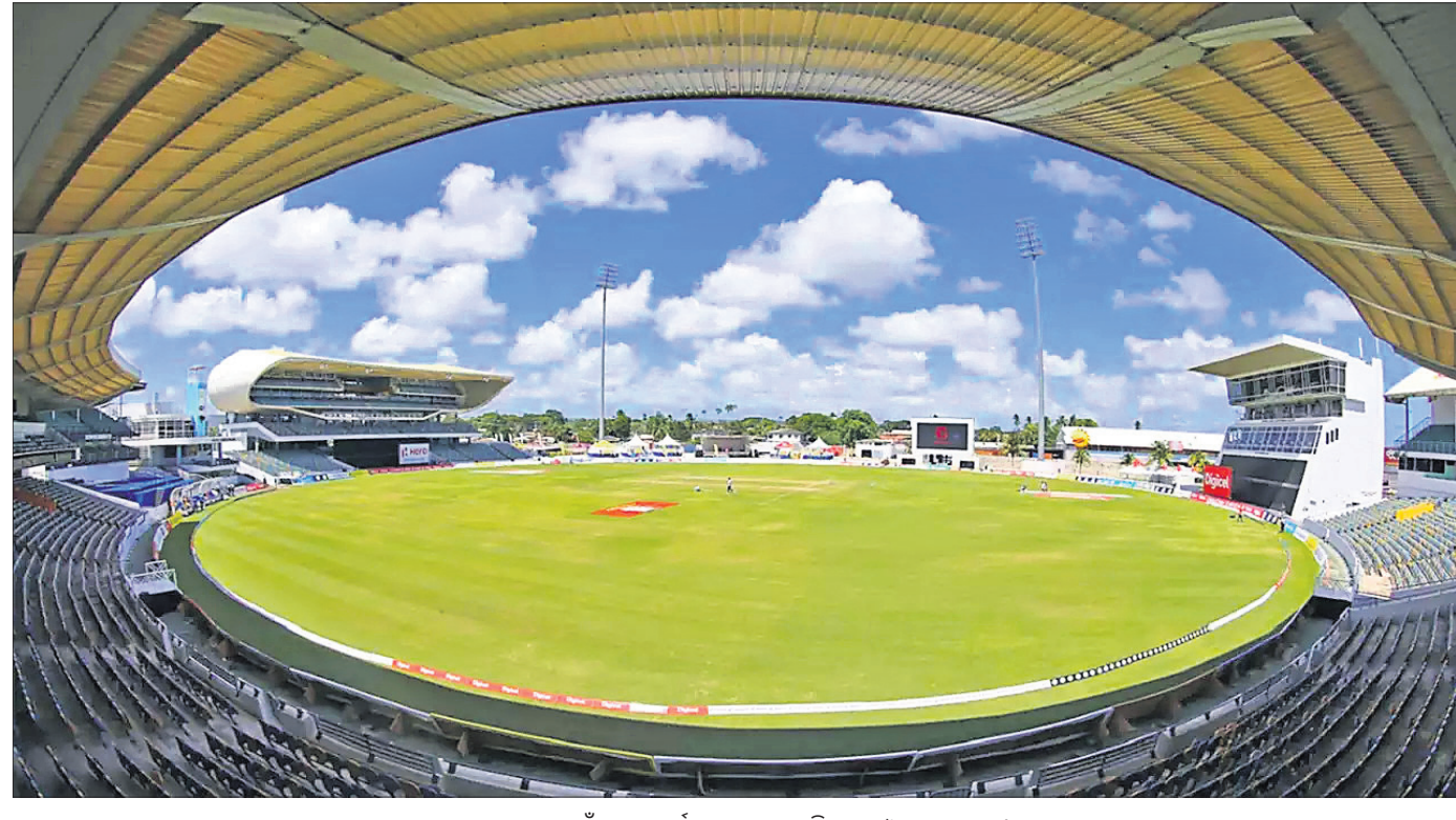
ଫାଇନାଲ ପାଇଁ ପ୍ରସ୍ତୁତ ବାର୍ତ୍ତାହୀନ କେନସିଙ୍ଗଟନ ଓଭାଲ ଗ୍ରାଉଣ୍ଡ।