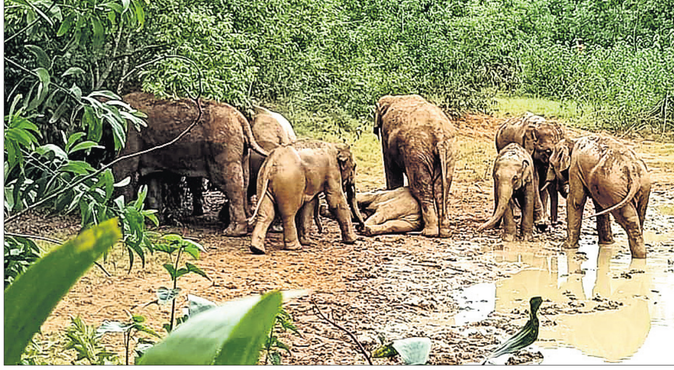
କେନ୍ଦୁଝର ଜିଲ୍ଲା ପାଟଣା ରେଞ୍ଜି ଏରେଞ୍ଜେଲ ବୈତରଣୀ ନଦୀକୂଳ ଘାଟକୁଦର ନିକଟ ଜଙ୍ଗଲରେ ହାତୀପଲ ଗରମକୁ ଉପଶମ ପାଇଁ କାହୁଅରେ ଗହୁଛନ୍ତି।

କାର୍ତ୍ତ ପାଇବାକୁ ବଞ୍ଚିତ ହୋଇଛନ୍ତି। ସେମାନଙ୍କୁ ସେହି କାର୍ତ୍ତୁକି ବଣ୍ଟନ କରାଯିବ ବୋଲି ମନ୍ତ୍ରୀ କହିଛନ୍ତି। ଏଠାରେ ଉଲ୍ଲେଖଯୋଗ୍ୟ, ଗତ କିଛି ବର୍ଷ ହେବ ରାଶି ନ କାର୍ତ୍ତ ବନ୍ଦ ରହିଛି। ଜାତୀୟ ଖାଦ୍ୟ ପୁରୁଣା ଯୋଜନା କିମ୍ବଦନ୍ତୀ ଖାଦ୍ୟ ପୁରୁଣା ଯୋଜନାରେ କୌଣସି ନୂତନ ହିତାଧିକାରୀଙ୍କୁ ରାଶି ନ କାର୍ତ୍ତ ବଣ୍ଟନ କରାଯାଇ ନାହିଁ। ନିର୍ବାଚନ ପରେ ରାଶି ନ କାର୍ତ୍ତ ଯୋଗାଣ ବେଳକୁ ତତ୍କାଳୀନ ସରକାର ଯୋଷଣା କରିଥିଲେ। ରାଜ୍ୟରେ ସରକାର ପରିବର୍ତ୍ତନ ହୋଇଥିଲେ ମଧ୍ୟ ନୂଆ ହିତାଧିକାରୀଙ୍କୁ କେବେ ରାଶି ନ କାର୍ତ୍ତ ବଣ୍ଟନ କରାଯିବ ସେ ନେଇ ଏ ପର୍ଯ୍ୟନ୍ତ ଅନେକ ଯୋଗ୍ୟ ହିତାଧିକାରୀ ରାଶି ନ