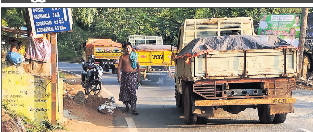
କୁଷ୍ମୁରି, ହଳ, ଶଗଡ଼ତଳା, ସିକୋ ଆଦି ପଞ୍ଚାୟତ ଅଞ୍ଚଳରେ ବେଆଇନ ଘୋରମ ଓ ମାକଡ଼ା ପଥର ଖଣି ଉପରେ

ଖୋର୍ଦ୍ଧା ଜିଲ୍ଲା ବେଗୁନିଆ ତହସିଲ ଅଞ୍ଚଳରେ ବେଆଇନ ଭାବେ ପାହାଡ଼ ଖନନ ସହ ମାକଡ଼ା ପଥର ଓ ଘୋରମ ଚାଲାଣ ବଢ଼ିଚାଲିଛି। ମାଟିଆମାନେ କମ୍ପ୍ରେସର ସାହାଯ୍ୟରେ ଆମୋନିୟମ ସାର, ବାଉଁଶ, ତିନାମାଲଟ ଓ ଲିକୋଟିନ୍ ବ୍ୟବହାର କରି ପାହାଡ଼ରେ ବ୍ଲାଷ୍ଟିଂ କରିବା ସହ ଖନନ କରୁଛନ୍ତି। ତେବେ ପ୍ରଶାସନିକ କଟକଣା ନ ଥିବାରୁ ସିକୋ, ଦେଉଳି, ପରିଛଳ, ରାଉତପଡ଼ା ଏବଂ କୁଷ୍ମୁରି ପଞ୍ଚାୟତ ଅଞ୍ଚଳରେ ଥିବା ଶହ ଶହ ଏକର ପାହାଡ଼ରେ ବ୍ଲାଷ୍ଟିଂ ବଢ଼ିଚାଲିଛି। ଅନ୍ୟପକ୍ଷରେ ଦେଉଳି ଏବଂ ସିକୋ ପଞ୍ଚାୟତ ଅଞ୍ଚଳରେ କ୍ରମେ ସଂଖ୍ୟା ମଧ୍ୟ ବଢ଼ିଚାଲିଛି। ସେହିପରି ଡିଙ୍ଗର, ରାଉତପଡ଼ା, ଦୁର୍ଗାପୁର, ଦେଉଳି, ପରିଛଳ,