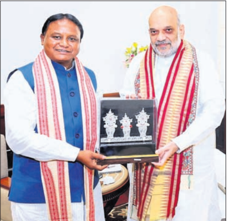
ମୁଖ୍ୟମନ୍ତ୍ରୀ ମୋହନ ଚରଣ ମାଝୀ ଶୁକ୍ରବାର ନୂଆଦିଲ୍ଲୀରେ ସ୍ୱାସ୍ଥ୍ୟ ମନ୍ତ୍ରୀ ଅମିତ ଶାହାଙ୍କୁ ଭେଟୁଛନ୍ତି ।