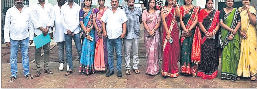
ଜିଲାପାଳଙ୍କୁ ଲିଖିତ ଅଭିଯୋଗ କରିବାକୁ ଆସିଥିବା କାର୍ଯ୍ୟକର୍ତ୍ତାମାନେ।

କଳାହାଣ୍ଡି ଜିଲ୍ଲା ଭବାନୀପାଟଣା ପୌରପାଳିକାରେ ଚାଲିଥିବା ଉତ୍ତମ କାର୍ଯ୍ୟରେ ଦୁର୍ଗତି, କାର୍ଯ୍ୟକର୍ତ୍ତାଙ୍କୁ ଉପେକ୍ଷା ଓ ମନକଲ୍ଲୀ କାର୍ଯ୍ୟ କରାଯାଉଥିବା ଅଭିଯୋଗ ଆଣି ପୌରାଧିକାର ବିରୋଧରେ ସେମାନେ ଅନାସ୍ଥା ପ୍ରସ୍ତାବ ଆଣିବା ପାଇଁ ମେଳି ବାସ୍ତୁଛନ୍ତି। ଉପାଧିକାର ବିଷୟ ପ୍ରଧାନଙ୍କ ଅଧିକାରରେ ଶୁକ୍ରବାର ସମସ୍ତ ୨୦ କାର୍ଯ୍ୟକର୍ତ୍ତା ଏ ନେଇ କଳାହାଣ୍ଡି ଜିଲାପାଳଙ୍କୁ ଲିଖିତ ଅଭିଯୋଗ ଦେଇଛନ୍ତି। ଖବର ଅନୁଯାୟୀ, ପୌରାଧିକାର କାର୍ଯ୍ୟକଳାପକୁ ନେଇ ଦୀର୍ଘଦିନ ହେଲା କାର୍ଯ୍ୟକର୍ତ୍ତାମାନେ ଅସନ୍ତୋଷ ଜାହିର କରିଆସୁଥିଲେ। ସରକାରୀ ନିୟମ ପୂର୍ତ୍ତାବକ ଅବେଳ ସୁଦ୍ଧା ପରେ ଅନାସ୍ଥାପ୍ରସ୍ତାବ ଗୃହୀତ ହୋଇପାରିବ। ଏବେ ଠିକ୍ ସମୟ ପହଞ୍ଚିବାରୁ କାର୍ଯ୍ୟକର୍ତ୍ତାମାନେ