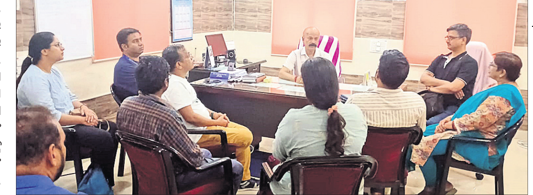
ରାୟଗଡ଼ା ଗସ୍ତରେ ଆସିଥିବା ଟିମ୍ ସିଡିଏମ୍‌ଏସ୍‌ଙ୍କ ସହ ଆଲୋଚନା କରୁଛନ୍ତି ।

ଭଦ୍ର ପରିଚାଳନା, ଟ୍ରେନ୍ ସୁଚନା ପ୍ରଣାଳୀ, ଅନୁସନ୍ଧାନ କାର୍ଯ୍ୟ, ଭିଡିଓ ଖାଲ ପ୍ରଦର୍ଶନ, ଅତିରିକ୍ତ ଚିକେଟ ବୁକ୍ସ କାର୍ଯ୍ୟ ଏବଂ ମୋବାଇଲ୍ ଚିକେଟ କାର୍ଯ୍ୟ, ୧୫ ହଜାର ଚାର୍ଯ୍ୟଯାତ୍ରା ବିଶ୍ୱାସ ନେବା ଭଳି ଅପେକ୍ଷାମୁକ୍ତ, ଶେଢ଼ ପାଇଁ ମଧ୍ୟ ପୂର୍ବତନ ରେଳପଥ ପଦକ୍ଷେପ ନେଇଛି । ଏହା ବ୍ୟତୀତ ସୁରକ୍ଷା ବ୍ୟବସ୍ଥା, କ୍ୟାଟର୍ ସେବା, ମେଡିକାଲ ସୁବିଧା ଏବଂ ଆୟୁର୍ବିଦ୍ୟ ଏବଂ ଯାତ୍ରା ବିଶେଷକରି ଚାର୍ଯ୍ୟଯାତ୍ରାଙ୍କ ସୁବିଧା ପାଇଁ ବିଦ୍ୟୁତ୍‌ଯୋଗାଣ, ଜଳଯୋଗାଣ, ପରିଷ୍କାର ପରିଚ୍ଛନ୍ନତା, ନିରାପଦ, ପାନୀୟ ଜଳ ଏବଂ ପର୍ଯ୍ୟାପ୍ତ ଶୈତାଳ୍ୟ ଯୋଗାଇବା ପାଇଁ ମଧ୍ୟ ବିଶେଷ ପଦକ୍ଷେପ ଗ୍ରହଣ କରାଯାଇଛି ।