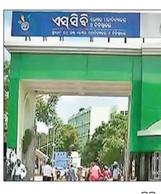
ଏସ୍‌ସିବି ମେଡିକାଲ କଲେଜ ଆଣ୍ଡ ହସ୍ପିଟାଲ

କଟକ ଶ୍ରୀରାମଚନ୍ଦ୍ର ଭଞ୍ଜ ମେଡିକାଲ କଲେଜ ଆଣ୍ଡ ହସ୍ପିଟାଲ (ଏସ୍‌ସିବି) ରକ୍ତ ଉତ୍ସାରରେ ରକ୍ତ ସଙ୍କଟ ଦେଖାଦେଇଛି। ରକ୍ତ ଉତ୍ସାରରେ ଆବଶ୍ୟକ ଅନୁଯାୟୀ ରକ୍ତ ନ ଥିବାରୁ ରୋଗୀମାନେ ବହୁ ସମସ୍ୟାର ସମ୍ମୁଖୀନ ହେଉଛନ୍ତି। ଏପରି କି ରୋଗୀଙ୍କ ସମ୍ପର୍କୀୟ ଜରୁରିକାଳୀନ ପରିସ୍ଥିତିରେ ରକ୍ତ ପାଇଁ ରକ୍ତ ଉତ୍ସାରକୁ ଯାଇ ଦଲାଲଙ୍କ ହାତୁଡ଼ରେ ପଡ଼ୁଛନ୍ତି। ମେଡିକାଲରୁ ମିଳିଥିବା ସୂଚନା ଅନୁଯାୟୀ, ଏସ୍‌ସିବି ରକ୍ତ ଉତ୍ସାରରେ ପ୍ରତିଦିନ ଦିନ ବଦଳରେ ୧୫୦ ଜଣଙ୍କୁ ରକ୍ତ ଦିଆଯାଉଛି। ସେମାନଙ୍କ ମଧ୍ୟରେ ୧୦୦ ଜଣ ଆଲୋସେମିଆ ରୋଗୀ ରହିଛନ୍ତି। ସେହିପରି ଅନ୍ୟ ୫୦ ଜଣଙ୍କ ମଧ୍ୟରେ କର୍ଜଟ, ବୋନ୍‌ମ୍ୟାଗୋ, ଭେଜି ଅସ୍ତ୍ରୋପଚାର ଓ ହୃଦ୍‌ପିଣ୍ଡାଗ୍ରସ୍ତ ରୋଗୀ ରହିଛନ୍ତି। ଏହାଛଡ଼ା ଅନ୍ୟ ରୋଗୀଙ୍କ ପାଇଁ ରକ୍ତଦାନୀତା ରକ୍ତ ଦେଇ ଅଥବା ରକ୍ତ ବଦଳ କରି ରକ୍ତ ନେବାର ବ୍ୟବସ୍ଥା ରହିଛି। ପ୍ରତିଦିନ ଏସ୍‌ସିବି ମେଡିକାଲକୁ ହଜାର ହଜାର ରୋଗୀ ଆସୁଥିବାବେଳେ ଏବେ ରକ୍ତ