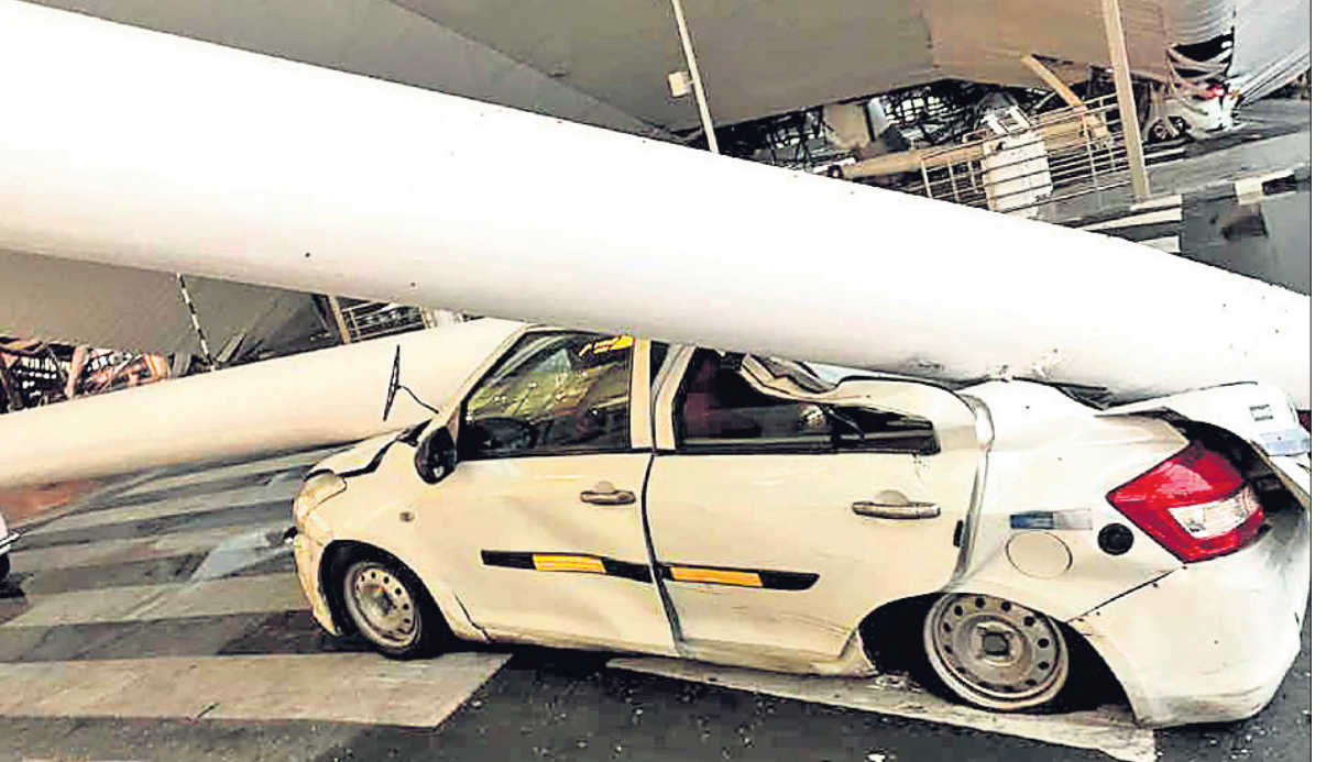
ପ୍ରକଳ ବର୍ଷା ଯୋଗୁ ଶୁକ୍ରବାର ସକାଳେ ଦିଲ୍ଲୀ ବିମାନବନ୍ଦରର ଚର୍ଚ୍ଚନାଳ-୧ରେ ଥିବା ଏକ ଶେଡ଼ର ଛାତ ଭୁଗୁଡ଼ିପଡ଼ିଲା।