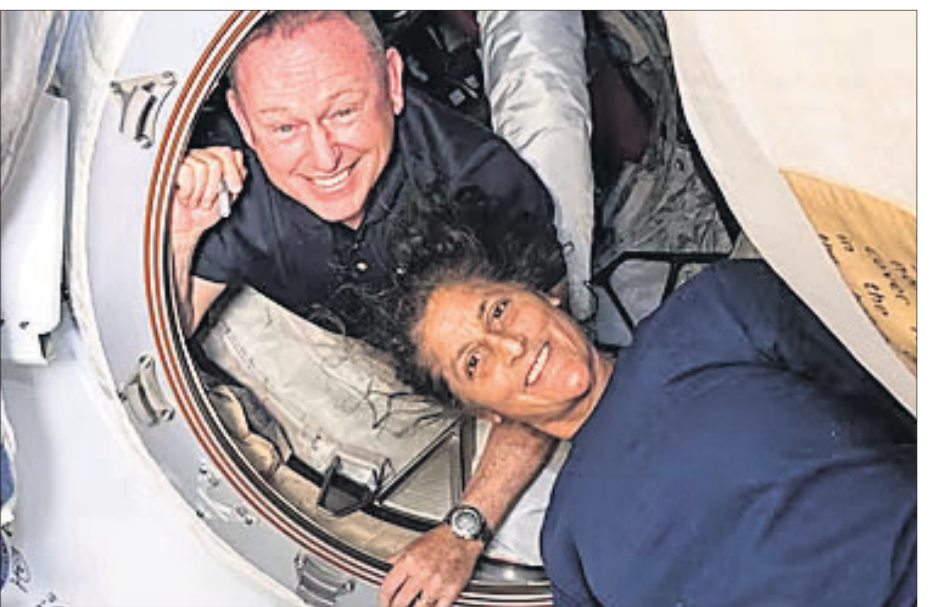
ଆଇଏସ୍‌ଏସ୍ ମାନ୍‌ନୋରି ମୋଡ୍ୟୁଲ୍ରେ ବୋଇଲ୍ କ୍ରିଉ ଫ୍ଲାଇଟ୍ ଟେଷ୍ଟ ମହାକାଶ ଯାତ୍ରୀ ସୁନୀତା ଓଲିୟମ୍ ଏବଂ ରୁବ୍ ଓଲିମୋରଙ୍କ ଏହି ଫଟୋକୁ ଜୁନ୍ ୧୩ରେ ନାସା ପକ୍ଷରୁ ଜାରି କରାଯାଇଥିଲା।