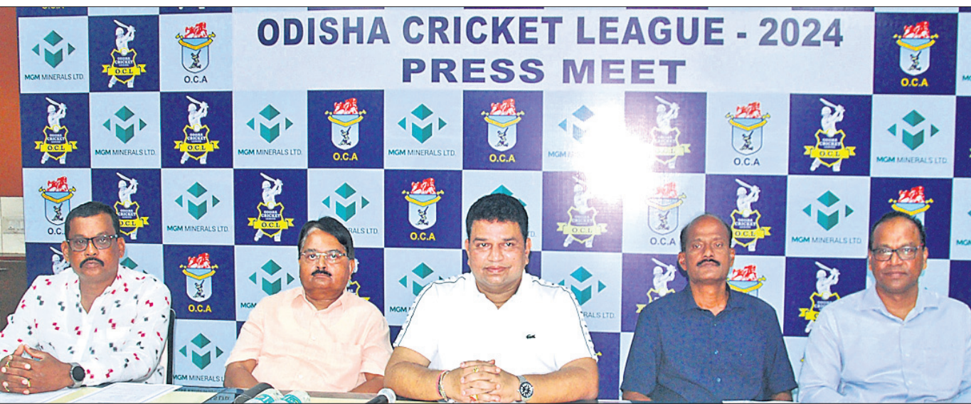
ଖବରଦାତା ସମ୍ମିଳନୀରେ ଶୁକ୍ରବାର ଓଡ଼ିଶା ଟି୨୦ କ୍ରିକେଟ ଲିଗ୍ ସମ୍ପର୍କରେ ଓସିଏ କର୍ମକର୍ତ୍ତାମାନେ ସୂଚନା ଦେଉଛନ୍ତି।

କୋପା ଆମେରିକା କରୁଥିଲା। ମ୍ୟାଚରେ ଟ୍ରେସ୍‌ହଲ୍ ବ୍ୟତୀତ ୮୮ତମ ମିନିଟରେ ପାନାମା ଦଳର ଆଡାଲବର୍ଗେ କାରାସ୍କିଲ୍‌କୁ ଫାଇଲ୍ ସାକ୍ସେ ଏକ ରେଡ୍‌କାର୍ଡ୍ ହୋଇଥିଲା। ଆମେରିକା ଏହାର ଓପନିଂ ମ୍ୟାଚରେ ବଳିଭିଆକୁ ୨-୦ ଗୋଲ୍‌ରେ ପରାସ୍ତ କରିଥିଲା। ଦଳ ସୋମବାର ମିଶୋରିର କାନରସ୍ ସିଟିରେ ୧୫ ଥର କୋପା ଆମେରିକା ଚାମ୍ପିୟନ ଉତ୍ତୁସ୍‌ସ୍‌କୁ ଭେଟିବେ।