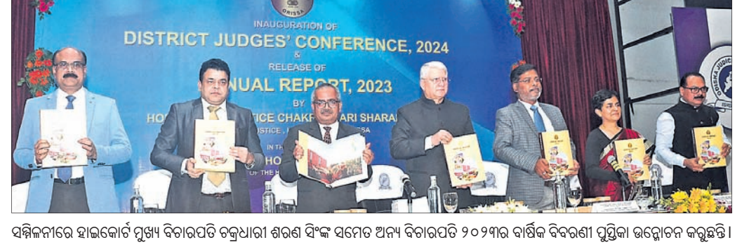
ସମ୍ମିଳନୀରେ ହାଇକୋର୍ଟ ପୁସ୍ତିକା ବିତରଣ କରୁଥିବା ବେଳେ ଅନ୍ୟ ବିଚାରପତି ୨୦୨୩ର ବାର୍ଷିକ ବିବରଣୀ ପୁସ୍ତିକା ଉନ୍ମୋଚନ କରୁଛନ୍ତି ।

ଜିଲ୍ଲାଜଜ୍ ସମ୍ମିଳନୀ ଉଦ୍‌ଘାଟିତ ଉଦ୍‌ଘାଟନରେ କହିଥିଲେ । ଏହି ଅବସରରେ ୨୦୨୩ର ବାର୍ଷିକ ବିବରଣୀ ପୁସ୍ତିକା ଉନ୍ମୋଚିତ ହୋଇଥିଲା । ଓଡ଼ିଶା ଜିଲ୍ଲାଜଜ୍ ସମ୍ମିଳନୀକୁ ଉଦ୍‌ଘାଟନ କରିଥିଲେ । ଭୃତ୍ତି ନ୍ୟାୟ ପ୍ରଦାନକୁ ବିଚାରପତିମାନେ ଗୁରୁତ୍ୱ ଦେବାକୁ ପୁସ୍ତିକା ବିଚାରପତି ଜିଲ୍ଲାଜଜ୍‌ମାନଙ୍କ