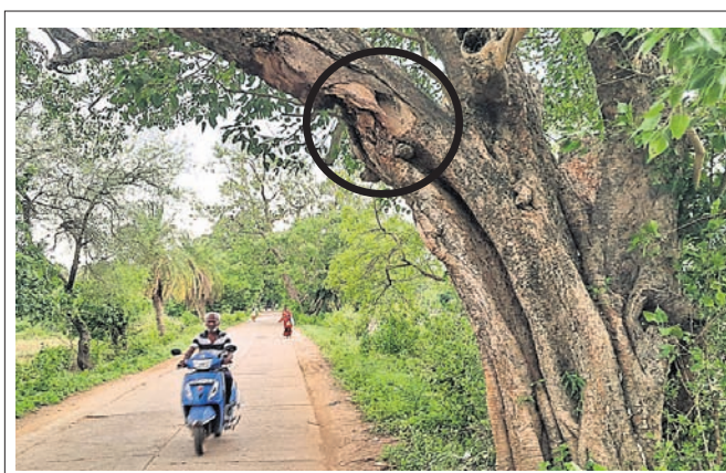
ଗଣରାମୁଣ୍ଡା ବଜାର ସମ୍ବନ୍ଧୀୟ ବିହାର ନିକଟ ରାସ୍ତାରେ ବରଗଛର ଡାଳ ବିପଦପୂର୍ଣ୍ଣ ଅବସ୍ଥାରେ ରହିଛି।

ହିରାଧାରୀ ଜଣକ ଗ୍ଲାମାୟ ଅଠରାଳ ଓ ବାଦବାରବାଟୀ ଗ୍ରାମର କେତେଜଣ