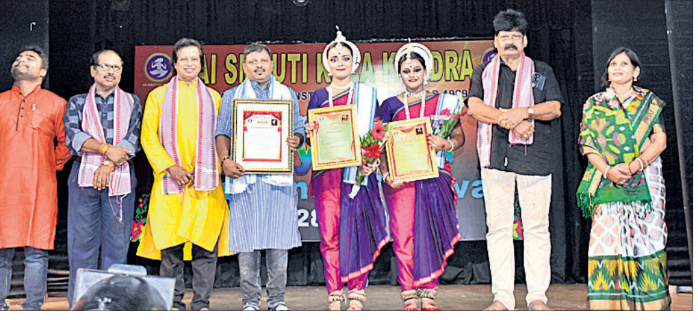
ସାଇସ୍ଟି କଳାକେନ୍ଦ୍ରର ବାର୍ଷିକ ଉତ୍ସବରେ ଅତିଥିଙ୍କ ରହଣରେ ସମ୍ମାନିତ ବ୍ୟକ୍ତି ଓ ପ୍ରତିଭାମାନେ।