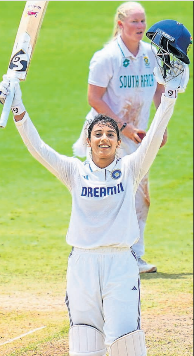
ଶତକ ହାସଲ ପରେ ଖୁସି ପୂର୍ଣ୍ଣରେ ଭାରତର ସୁଟି ମହାନା।