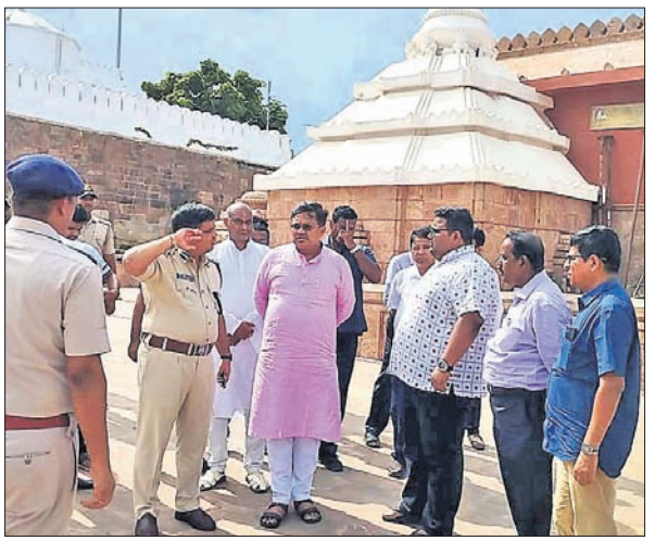
ଆଇନମନ୍ତ୍ରୀ ପୁରୀରୁ ଯାତ୍ରା କ୍ଷେତ୍ର ପରିଦର୍ଶନ ଅବସରରେ ପୁରୀ ଜିଲ୍ଲାପାଳ ଏବଂ ଏସପିଙ୍କ ସହ ଆଲୋଚନା କରୁଛନ୍ତି।

ଶ୍ରୀକ୍ଷେତ୍ରକୁ ଦେଶର ସର୍ବଶ୍ରେଷ୍ଠ ତୀର୍ଥକ୍ଷେତ୍ର ଭାବେ ପରିଗଣିତ କରାଯିବ ବୋଲି ଆଇନ, ପୂର୍ଣ୍ଣ ଓ ଅବକାରୀ ମନ୍ତ୍ରୀ ପୁରୀରୁ ଯାତ୍ରା କ୍ଷେତ୍ରର ଦର୍ଶନ କରିଛନ୍ତି।