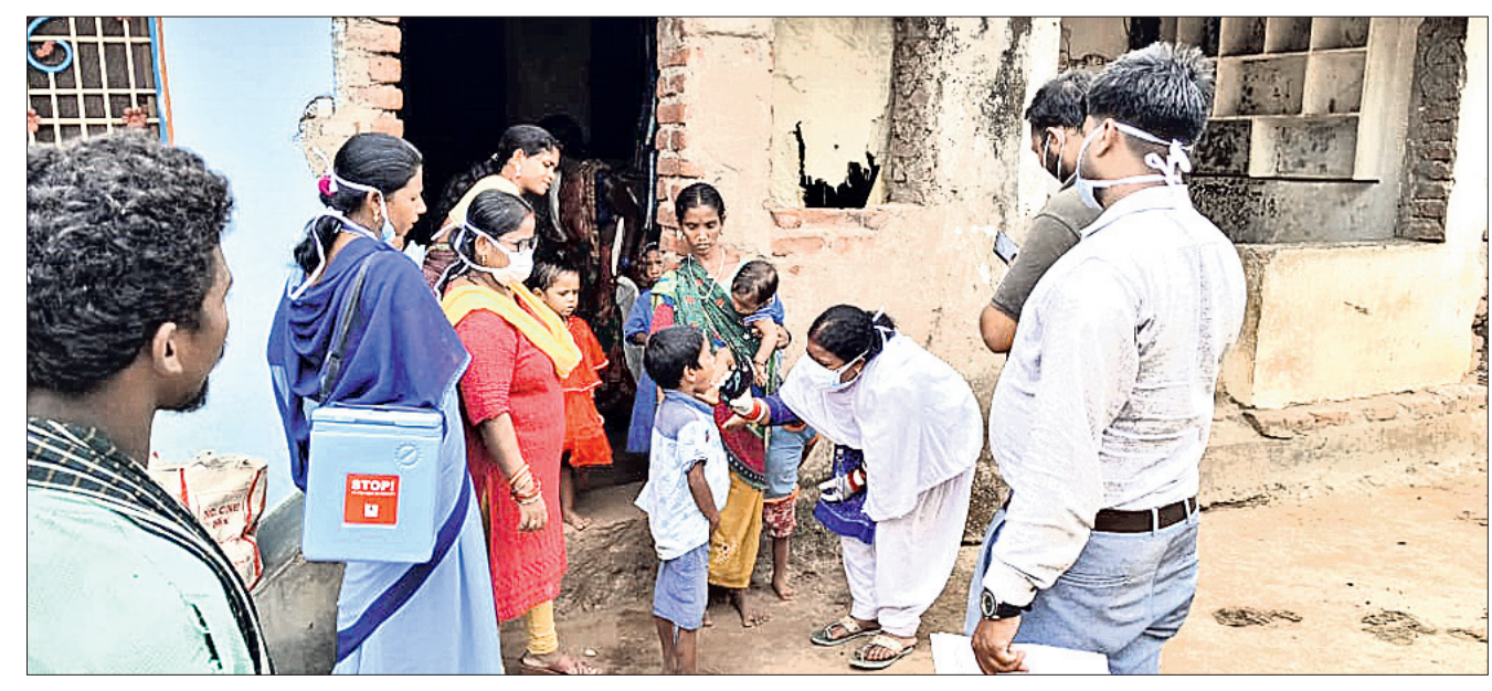
ଡାକ୍ତରୀ ଟିମ୍ ଶିଶୁଙ୍କ ସ୍ୱାସ୍ଥ୍ୟ ପରୀକ୍ଷା କରୁଛି।