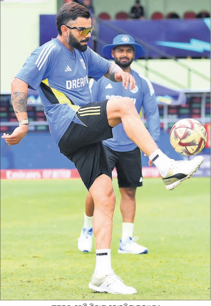
ପୁରବଳା ଖେଳ ବିରାଟ କୋହଲିଙ୍କ ଅଭ୍ୟାସ।