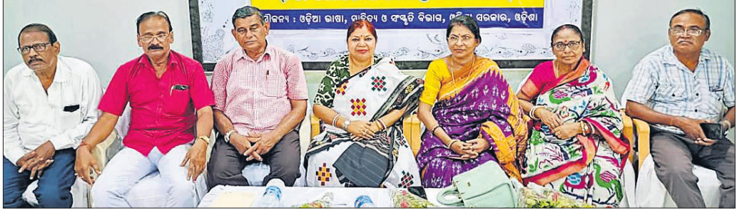
କାର୍ଯ୍ୟକ୍ରମରେ ମଞ୍ଚାସୀନ ଅତିଥିଗଣ।