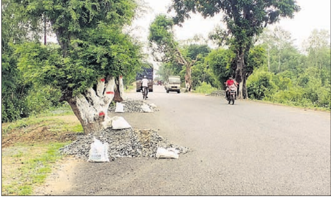
ରାସ୍ତା ଉପରେ ଥିବା ଗଛ।

ଉକ୍ତ ରାସ୍ତାର ପୋଡ଼ାଶୁଳଠାରୁ ଝରଣାପାଟି ପର୍ଯ୍ୟନ୍ତ ହାରା ହାର ୩୫ କି.ମି. (ଇଏସଏନଜେ) ବନ ବିଭାଗ ଦର୍ଶାଇବା ସହ ଏହା ଉପରେ କୌଣସି ନୂତନ କାର୍ଯ୍ୟ ପାଇଁ ଅନୁମତି ପ୍ରଦାନ କରିନାହିଁ। ପୋଡ଼ାଶୁଳଠାରୁ ସକନାଗଡ଼ ମଧ୍ୟରେ ଥିବା ୮୦ଟି ଗଛ ମଧ୍ୟରୁ ୬୪ଟି ଗଛ କଟା ଯାଇଥିଲା। ରାସ୍ତାର ବୁଲପାର୍ଶ୍ୱରେ ଥିବା ଆଉ ୧୬ଟି ଗଛ କାଟିବାକୁ ବନ ବିଭାଗ ଅନୁମତି ଦେଇନାହିଁ। ରାସ୍ତା ପ୍ରଶସ୍ତାପନ ପରେ ଏହି ଗଛଗୁଡ଼ିକ ପିଚୁ ରାସ୍ତା ମଧ୍ୟରେ ରହିଛି। ଫଳରେ ପ୍ରତିଦିନ ଦୁର୍ଘଟଣା ଘଟୁଛି। ରାସ୍ତା ସମ୍ପ୍ରଦାନ ଚଳୁଛି ସାରିବା ପାଇଁ ପଦକ୍ଷେପ ନିଆ ନ ଗଲେ ଅଞ୍ଚଳବାସୀ ରାସ୍ତାରୋଲୋ କରାଯିବ ବୋଲି ଚେତାବନୀ ଦେଇଛନ୍ତି।