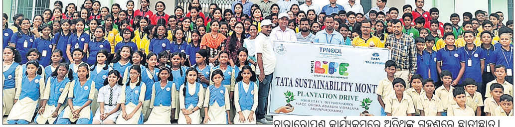
ଚାରାରୋପଣ କାର୍ଯ୍ୟକ୍ରମରେ ଅତିଥି ଗଣଗଣେ ଛାତ୍ରୀଛାତ୍ର।