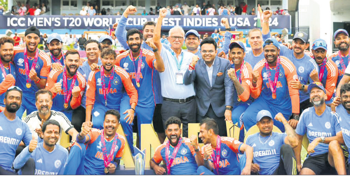
ବିସିଆଇର ସଭାପତି ରୋହିତ ବିରି ଓ ସମ୍ପାଦକ ଜୟ ଶାହାଙ୍କ ସହ ଭାରତୀୟ କ୍ରିକେଟ ଦଳ।