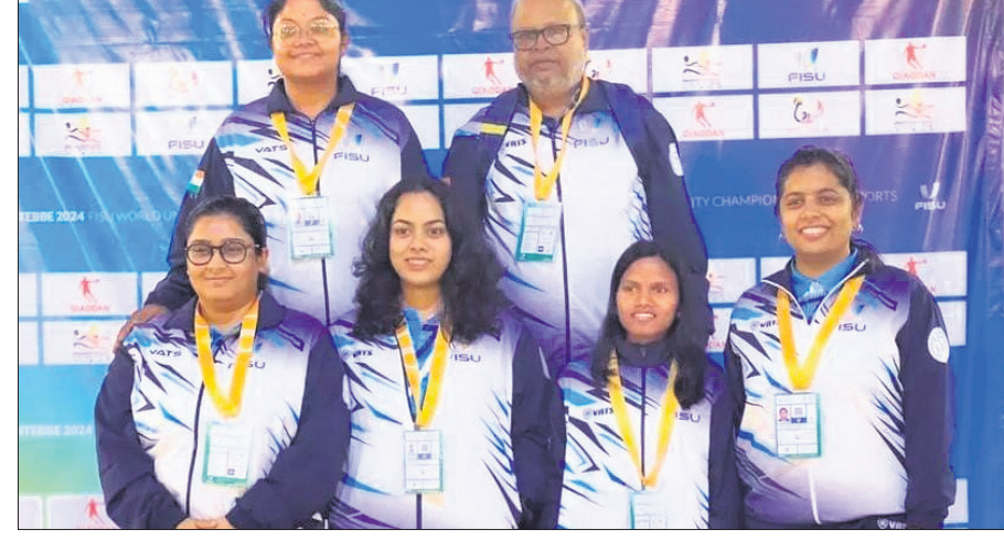
ଭାରତୀୟ ମହିଳା ଚେସ୍ ଦଳ।