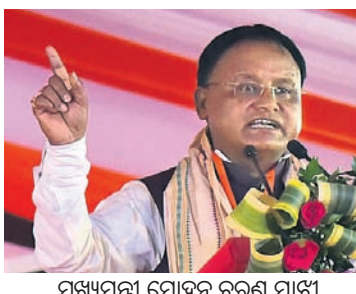
ମୁଖ୍ୟମନ୍ତ୍ରୀ ମୋହନ ଚରଣ ମାଝୀ

ଶ୍ରୀମନ୍ଦିର ରତ୍ନଭଣ୍ଡାର ଖୋଲାଯିବ ଏବଂ ଗଣତି ହେବ। ଯଦି କିଛି ଗତବର୍ଷ ହୋଇଥାଏ, ଦୋଷୀକୁ ଦଣ୍ଡ ଦିଆ ନ କରାଯିବ ବୋଲି ମୁଖ୍ୟମନ୍ତ୍ରୀ ମୋହନ ଚରଣ ମାଝୀ କହିଛନ୍ତି। ଭୁବନେଶ୍ୱର ପ୍ରଦର୍ଶନୀ ପଡ଼ିଆରେ ରବିବାର ଭାଙ୍ଗପାର ନୂତନ ବିଧାୟକ ଓ ଏମ୍‌ପିଙ୍କୁ ସମ୍ବର୍ଦ୍ଧନା କାର୍ଯ୍ୟକ୍ରମର ଆୟୋଜନ କରାଯାଇଥିଲା। ଏଥିରେ ଯୋଗଦେଇ