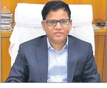
ଭୁବନେଶ୍ୱର, ୩୦.୭ (ଅସମାପିକା ସାହୁ)

ବରିଷ୍ଠ ପ୍ରଶାସକ ନିକ୍ଷୁଞ୍ଚି ବିହାରୀ ଧଳ ମୁଖ୍ୟମନ୍ତ୍ରୀଙ୍କ ଅତିରିକ୍ତ ମୁଖ୍ୟ ଶାସନ ସଚିବ ଭାବେ ନିଯୁକ୍ତି ପାଇଛନ୍ତି। ଏ ନେଇ ରବିବାର ମୁଖ୍ୟମନ୍ତ୍ରୀଙ୍କ କାର୍ଯ୍ୟାଳୟ ପକ୍ଷରୁ ପୂର୍ବନା