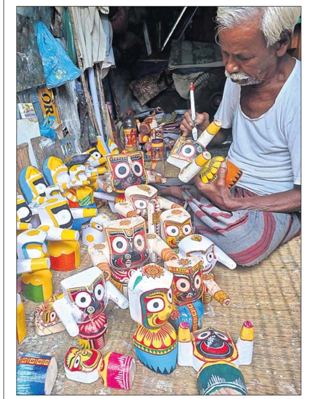
ନବଯୌବନ ଦର୍ଶନର ଅବ୍ୟବହୃତ ପୂର୍ବରୁ କଟକ ଦରଦାବଜାର ଚିତ୍ରକର ସାହି ଅଞ୍ଚଳରେ ଜଣେ ଚିତ୍ରଶିଳ୍ପୀ ଶ୍ରୀମାତଙ୍କ ପ୍ରତିମାକୁ ରଙ୍ଗଭୂଷାରେ ନୂତନ ରୂପ ଦେଉଛନ୍ତି।