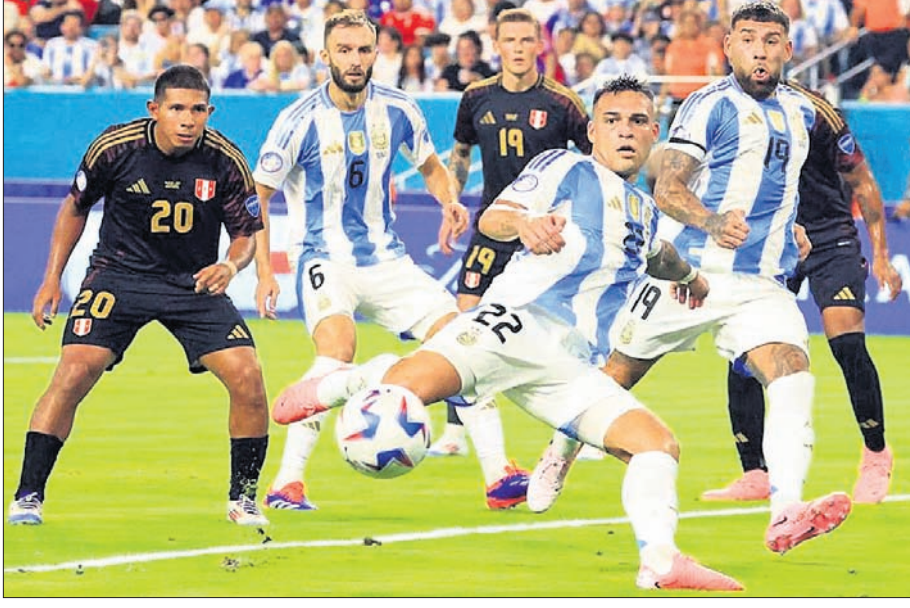
ଗୋଲ୍ କରିବାକୁ ପ୍ରୟାସ କରୁଛନ୍ତି ଆର୍ଜେଣ୍ଟିନାର କୋଚାଗୋ ମାର୍ଟିନେଜ।

ମାୟାମି ଗାଡ଼େସ୍, ୩୦୬ (ଏପି) କୋଚାଗୋ ମାର୍ଟିନେଜଙ୍କ ତତ୍ତ୍ୱାବଳୀରେ ଆର୍ଜେଣ୍ଟିନା ଚଳିତ କୋପା ଆମେରିକା ପୁରସ୍କାର ଟୁର୍ନାମେଣ୍ଟର ଏକ ଗ୍ରୁପ୍ ପର୍ଯ୍ୟାୟ ମ୍ୟାଚରେ ପେରୁକୁ ୨-୦ ଗୋଲ୍ରେ ପରାସ୍ତ କରିଛି। ଲୁକ୍ୱା ଯୋଗୁ ଏହି ମ୍ୟାଚରେ ଲିଓନେଲ ମେସି ଖେଳି ନ ଥିଲେ। ଆଞ୍ଚଳିକ ଡିମାରିଆଲ୍ ଓ ଏକ ସୁନ୍ଦର ପାସ୍ ପାଲ ଖେଳର ୪୬ତମ ମିନିଟ୍ରେ ମାର୍ଟିନେଜ ଡାକ୍ତର ପ୍ରଥମ ଗୋଲ୍ ଖୋର କରିଥିଲେ। ମାର୍ଟିନେଜ ଡାକ୍ତର ଦ୍ୱିତୀୟ ଗୋଲ୍ ଖେଳର ୮୬ତମ ମିନିଟ୍ରେ ଖୋର କରିଥିଲେ। ଏଥିସହ ସେ ବର୍ତ୍ତମାନ ବ୍ୟକ୍ତିଗତ ୪ ଗୋଲ୍ ସହ ଦଳର ଅଗ୍ରଣୀ ଷ୍ଟେରରେ ହୋଇପାରିଛନ୍ତି। ମଙ୍ଗଳବାର ତିନି ବିପକ୍ଷ ୧-୦ ଗୋଲ୍ ବିଜୟ ମ୍ୟାଚରେ ମେସି ଗୋଲ୍ ଖୋର ଆଗ୍ରାତ ଲାଗିଥିଲା। ଏହି ମ୍ୟାଚ ଛିଡ଼ି ଆର୍ଜେଣ୍ଟିନା କ୍ୱାର୍ଟରଫାଇନାଲରେ ସ୍ଥାନ ପକା କରିଥିଲା। ଟୁର୍କି ମ୍ୟାଚରୁ ସମ୍ପେଦେ ହୋଇଥିବା ଆର୍ଜେଣ୍ଟିନା କୋର୍ ଲିଓନେଲ ସ୍କୋଲାନି ମଧ୍ୟ ମ୍ୟାଚ ବେଳେ ଅନୁପସ୍ଥିତ ଥିଲେ। ତାଙ୍କ ସ୍ଥାନରେ ସହକାରୀ କୋର୍ ଖୁଲ୍ସର ସାମୁଏଲ୍ ଉପସ୍ଥିତ ଥିଲେ। ଆର୍ଜେଣ୍ଟିନା ଏହାର ଷ୍ଟର୍ଟ୍ ଲାଭନ୍ ଅପରେ ୯୫ ପରିବର୍ତ୍ତନ କରିଥିଲେ। ଦଳ ଏହାକୁ ମିଶାଇ କ୍ରମାଗତ ତୃତୀୟ ମ୍ୟାଚରେ ବଲ୍ଲୁ ଅଧିକାରୀ ସମୟ (୭୪%) ନିଜ ଅଧିକାରରେ ରଖିପାରିଥିଲା। ଏହାଛଡ଼ା କ୍ରମାଗତ ତୃତୀୟ ମ୍ୟାଚରେ ପ୍ରଥମାର୍ଦ୍ଧ ଖେଳରେ ଗୋଲ୍