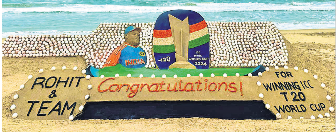
ଚଳିତ ବର୍ଷର ଆଇସିସି-୨୦ ବିଶ୍ୱକପ୍ ଜିତିବାର ଭାରତ ଚାମ୍ପିୟନ ହେବା ପରେ ଶୁଭେଚ୍ଛା ଜଣାଇ ରବିବାର ପୁରୀ ବେଳାଭୂମିରେ ପଦ୍ମଶ୍ରୀ ସୁବର୍ଣ୍ଣ ପଦକାୟକଙ୍କ ବାଲୁକା କଳା।

ପ୍ରଭୁ ଶ୍ରୀଅଲୀନାଥଙ୍କ ପୀଠରେ ଅନବସର ଦର୍ଶନ ରବିବାର ଅଷ୍ଟମ ଦିନରେ ପହଞ୍ଚିଛି। ରବିବାର ଭୁବନେଶ୍ୱର ଥିବା ପ୍ରଭୁ ଅଲୀନାଥଙ୍କ ଉପାସନା କ୍ଷେତ୍ରରେ ପହଞ୍ଚିଥିଲେ। ଦୀର୍ଘ ସମୟ ଧରି ବ୍ୟାରିକେଡ୍ ମଧ୍ୟରେ ଶ୍ରଦ୍ଧାଳୁମାନେ ଠାକୁରଙ୍କ ଦର୍ଶନ ପାଇଁ ଅପେକ୍ଷା କରିଥିଲେ। ଭିଡ଼ ଏଡ଼ାଇବାକୁ ପୋଲିସ୍ ଉଦ୍ୟମ କରୁଥିବାବେଳେ ଉପାସନା କ୍ଷେତ୍ରରେ ଉପାସନା କରୁଥିବା ବର୍ଷରୁ ଦୂର୍ବ୍ୟବହାର ଘଟଣାରେ ଅପେକ୍ଷା ପ୍ରକାଶ ପାଇଛି। ଭୁବନେଶ୍ୱରରୁ ଆସିଥିବା ଡିପାର୍ଟମେଣ୍ଟର ରାଜ୍ୟ ନାମକ ଭକ୍ତ ଉପାସନା କ୍ଷେତ୍ରରେ ଯାଇଥିଲେ। ସେଠାରେ ଜଣେ କାର୍ଯ୍ୟକର୍ତ୍ତା ପୋଲିସ୍ ଠାକୁ ଦୂର୍ବ୍ୟବହାର ପ୍ରଦର୍ଶନ କରିଥିଲେ। ଏ ନେଇ ଡିପାର୍ଟମେଣ୍ଟର ମିସି ନିକଟରୁ ଅଗ୍ରାଧୀ ପାଠିକରେ ଅଭିଯୋଗ କରିଛନ୍ତି। ଅନ୍ୟପକ୍ଷରେ ଶ୍ରଦ୍ଧାଳୁଙ୍କ ଦର୍ଶନ ପାଇଁ ସେବାୟତଙ୍କ ନିମନ୍ତେ ପାଠିକ ବ୍ୟବସ୍ଥା କରାଯାଇଛି। ଶନିବାର ସେବାୟତଙ୍କୁ ମାଡ଼ ଘଟଣା ପରେ ସ୍ଥାନୀୟ ପ୍ରଶାସନ ଓ ସେବାୟତମାନଙ୍କ ମଧ୍ୟରେ ଏକ ବୈଦିକ ଅନୁଷ୍ଠିତ ହୋଇଥିଲା। ସେବାୟତମାନେ ଠାକୁ ସମ୍ପର୍କାୟମାନଙ୍କୁ ଶ୍ରଦ୍ଧାଳୁଙ୍କ ଦର୍ଶନ କରାଇବା ନେଇ ପ୍ରଶାସନ ତରଫରୁ ପାଠିକ ବ୍ୟବସ୍ଥା କରାଯାଇଛି।