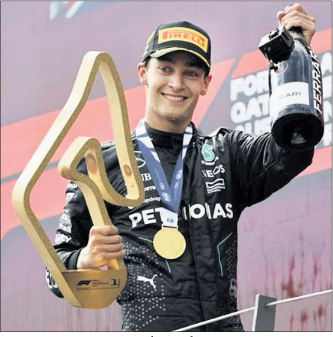
ଗ୍ରାଁ ପ୍ରି ସହ ମହିଳାଙ୍କର ଜର୍ଜ ରସେଲ।

ସିଲଭର୍ (ଅଷ୍ଟ୍ରିଆ), ୩୦୬ ମହିଳାଙ୍କର ଜର୍ଜ ରସେଲ ଅଷ୍ଟ୍ରିଆନ୍ ଫର୍ମୁଲା-୧ ଗ୍ରାଁ ପ୍ରି ମୋଟର ରେସିଂରେ ଅଗ୍ରଣୀ ଲାଭ କରିବା ଲାଗି ରେସିଂରେ ମାଲ୍ ଉର୍ଦ୍ଧ୍ୱପେନ ଓ ମାଲ୍ ଉର୍ଦ୍ଧ୍ୱପେନର ଲାଭେ ନୋରିସିଙ୍କ ମଧ୍ୟରେ ପ୍ରତିଯୋଗିତା ବେଳେ ସଂଘର୍ଷ ଘଟିବା ହେଉଛି ରେସିଂର ଏକ ପ୍ରମୁଖ ଘଟଣା। ଉର୍ଦ୍ଧ୍ୱପେନକୁ ନୋରିସି ଅତିକ୍ରମ କରିବାକୁ ଉଦ୍ୟମ କରୁଥିବା ବେଳେ ରେସିଂର ଡ୍ରାଇଭର ଜଣକ ତାଙ୍କ ଗାଡ଼ିକୁ ଧକ୍କା ଦେଇଥିଲେ। ନୋରିସି ରେସିଂ ଡ୍ରାଇଭର୍ ନେବାକୁ ବାଧ୍ୟ ହୋଇଥିଲେ। ଫଳରେ ଉର୍ଦ୍ଧ୍ୱପେନକୁ ୧୦ ସେକେଣ୍ଡ ପେନାଲ୍ଟି ହୋଇଥିଲା। ବନ୍ଧୁ ଲାପ୍ରେ ରେସିଂ ମଧ୍ୟରେ ଡ୍ରାମା ପ୍ରତିସ୍ପନ୍ଦିତ ହୋଇଥିଲା। ଏହାର ବିବାଦୀ ପରିସମାପ୍ତି ଘଟିଥିଲା। ବୁହର୍ ପରସ୍ତରକୁ ସୋସାଲୋପ କରିଥିଲେ। ୨୦୨୨ରେ ବ୍ରାଜିଲିଆନ୍ ଗ୍ରାଁ ପ୍ରି ପରେ ରସେଲ ମହିଳାଙ୍କ ପାଇଁ ପ୍ରଥମ ବିଜୟ ପାଇଁ ବେଇଜିଂ ଫାଇନାଲ ଲାପ୍ରେ ମାଲ୍ ଉର୍ଦ୍ଧ୍ୱପେନର ଓଷ୍ଠା ପିଆଣ୍ଡିକାଠାକୁ କଡ଼ା ବ୍ୟାଲେଞ୍ଜର ସମ୍ମୁଖୀନ ହୋଇଥିଲେ। ତେବେ ସେ ଅଗ୍ରଣୀ ବଜାୟ ରଖିବାରେ ସମର୍ଥ ହୋଇଥିଲେ। ଫୋରାରିର କାର୍ଲୋସ ସେଣ୍ଟା ମହିଳାଙ୍କର ଲୁଇସ ହାମିଲଟନଙ୍କଠାରୁ ଆଗରେ ଫାଇନାଲ ପୋଜିସନ ପୋଜିସନ ହାସଲ କରିଥିଲେ। ୫ ସେକେଣ୍ଡ ପେନାଲ୍ଟି ସହେ ଉଥର ଚାମ୍ପିୟନ ତାଙ୍କ ପ୍ରଥମ ଷ୍ଟୁପ ପାଇଁ ପିଟ୍ ଏକ୍ସିରେ ସ୍ଥାନ ଲାଭ ଅତିକ୍ରମ କରିପାରିଥିଲେ। ପେନାଲ୍ଟି ସହେ ଉର୍ଦ୍ଧ୍ୱପେନ ଲାଭ କ୍ରମ କରି ୫ମ ସ୍ଥାନରେ ରହିଥିଲେ, କାରଣର ହାସଲ ନିକୋ ହକେନବର୍ଗ ତାଙ୍କଠାରୁ ୧୨.୮ ସେକେଣ୍ଡ ପଛରେ ରହିଥିଲେ। ରବିବାର ଅନୁଷ୍ଠିତ ଏହି ରେସିଂରେ ସାଧାରଣ ଉପର ୧୦ ସ୍ଥାନ ରଖିଥିବା ଡ୍ରାଇଭରମାନେ ହେଲେ ସର୍ବିଓ ପରେଜ (ରେସିଂ), କେଜିନ ମାଗ୍ସେନ (ହାସି), ତାନିଏଲ୍ ଡିକାଡୋ (ଆର୍ବି), ପିଏରେ ଗାସ୍କି (ଅଲ୍ପାଲ୍)।