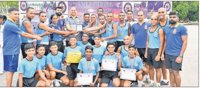
ଅତିଥିଙ୍କଠାରୁ ପ୍ରତିଯୋଗୀ ପୁରସ୍କାର ଗ୍ରହଣ କରୁଛନ୍ତି।

ଭାରତୀୟ ନୌସେନା ପ୍ରଶିକ୍ଷଣ କେନ୍ଦ୍ରରେ କ୍ରୀଡ଼ା-କଳ୍ପ ପ୍ରତିଯୋଗିତା