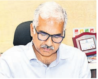
ଭୁବନେଶ୍ୱର, ୩୦।୭(ଅସମାପିତା ସାହୁ)

ଓଡ଼ିଶାର ମୁଖ୍ୟ ଶାସନ ସଚିବ ଭାବେ ବରିଷ୍ଠ ଆଇନଜୀବୀ ଅଧିକାରୀ ମନୋଜ ଆହୁଜା ଉତ୍ତରାଧିକାରୀ ଅପରାଧରେ ଦାୟିତ୍ୱ ଗ୍ରହଣ କରିଛନ୍ତି। ପୂର୍ବତନ ମୁଖ୍ୟ ଶାସନ ସଚିବ ପ୍ରଦୀପ କୁମାର ଜେନା ମଧ୍ୟ ସରକାରୀ କାର୍ଯ୍ୟରୁ ଅବସର ନେଇଛନ୍ତି।