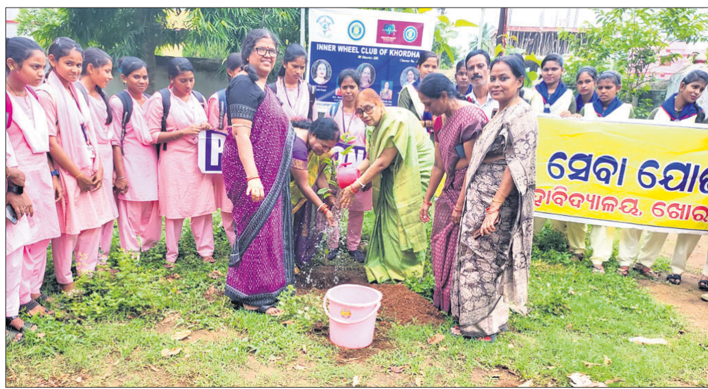
ଖୋର୍ଦ୍ଧା ମହିଳା ମହାବିଦ୍ୟାଳୟ ପରିସରରେ ରବିବାର ଅନୁଷ୍ଠିତ ଚାରାଚୋପଣ କାର୍ଯ୍ୟକ୍ରମରେ ଉପସ୍ଥିତ ଅତିଥି ଏବଂ ଛାତ୍ରୀମାନେ।