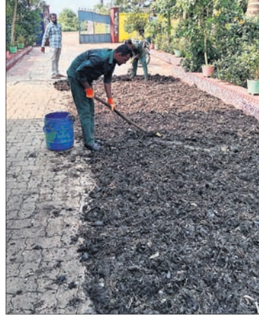
ମେଶିନ୍ ମାଧ୍ୟମରେ ମୋ ଖାତ ପ୍ରକ୍ରିୟାକରଣ ପୂର୍ବରୁ ଆବର୍ଜନାକୁ ପ୍ରସ୍ତୁତ କରାଯାଇଛି।

ସହରରୁ ସଂଗୃହୀତ ଓଦା ଆବର୍ଜନାକୁ ପ୍ରକ୍ରିୟାକରଣ କରାଯାଇ ସେଥିରୁ ଖତ ପ୍ରସ୍ତୁତ କରାଯିବ। ସେହି ଖତକୁ ବିକ୍ରି କରାଯିବ। ସହ ଏଥିରେ ନିୟୋଜିତ ଲୋକଙ୍କ ପାଇଁ ନୂଆ ରୋଜଗାର ସୃଷ୍ଟି କରିବାକୁ ଲକ୍ଷ୍ୟ ରଖିଥିଲେ ରାଜ୍ୟ ସରକାର। ଏଥିପାଇଁ ଭୁବନେଶ୍ୱର ମହାନଗର ନିଗମ (ବିଏମ୍‌ସି) ସମେତ ରାଜ୍ୟର ବିଭିନ୍ନ ମହାନଗର ନିଗମକୁ ନିର୍ଦ୍ଦେଶ ଦିଆଯାଇଥିଲା। ୨୦୨୧ରୁ ବିଏମ୍‌ସି ପକ୍ଷରୁ 'ଫ୍ରେଣ୍ଡ୍‌ସ୍ ଫ୍ରମ୍ ଫ୍ରେଣ୍ଡ୍‌ସ୍' ଯୋଜନା ଆରମ୍ଭ ହୋଇଥିଲା। ତେବେ ଖବର ଶୁଣି ଉପରେ ଏହି ଯୋଜନାର ଲକ୍ଷ୍ୟ ଏବେ ବିଫଳ ହୋଇଛି। ହାତୀଆଣ୍ଡୁଣୀଠାରେ ଥିବା ମୋ ଖାତ ରୋବାଟିକ୍ ପ୍ରାୟ ୧୫୫ ଟନ୍‌ରୁ ଉର୍ଦ୍ଧ୍ୱ ଖତ ଉତ୍ପାଦନ କରୁଥିବା ବେଳେ ଏଥିରେ ବିଭିନ୍ନ ପ୍ରକାରର ଖତ ଉତ୍ପାଦନ କରାଯାଇଛି। ୨୦୨୧ରୁ ବିଏମ୍‌ସି ପକ୍ଷରୁ 'ମୋ ଖାତ' ବିକ୍ରି ନ ହୋଇ ପଡ଼ିବାରୁ ଏପରିକି ଏହି ଯୋଜନାକୁ ଲୋକାଭିମୁଖୀ କରିବା ପାଇଁ ମୋ ଖାତ ଦରକୁ ଖସାଇ କିଲୋପିସା ୧୦ ଟଙ୍କା କରାଯାଇଥିଲେ ମଧ୍ୟ ଏହାକୁ କିଣିବାକୁ କେହି ରାଜି ହେଉନାହାନ୍ତି। ଫଳରେ ଏହେ ପରିଣାମରେ ମୋ ଖାତକୁ କିଭଳି ବିକ୍ରି କରାଯିବ ସେନେଇ ବିଏମ୍‌ସିର ପୂର୍ଣ୍ଣବିଜ୍ଞା ଆରମ୍ଭ ହୋଇଛି। ଭୁବନେଶ୍ୱରର ଡୋର୍ ଟୁ ଡୋର୍