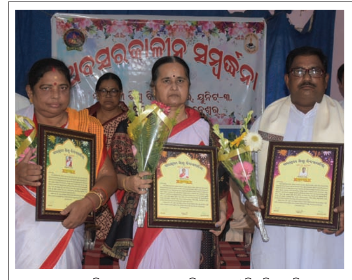
ଭୁବନେଶ୍ୱର ସୁନି-୩ ଖାରବେଳନଗରସ୍ଥିତ ସରସ୍ୱତୀ ଶିଶୁ ବିଦ୍ୟାଳୟରେ ରବିବାର ଏକ ସମ୍ବନ୍ଧୀୟ ସଭାର ଆୟୋଜନ କରାଯାଇଥିଲା । ଏହି ଅବସରରେ ବିଦ୍ୟାଳୟର ୩୬ଜଣ ଶିଶୁସ୍ତ୍ରୀଶିଶୁଙ୍କୁ ବିଦ୍ୟାଳୟର ସମ୍ବନ୍ଧୀୟ ବିଦ୍ୟାଳୟରୁ ଆର୍ତ୍ତନୂନା ପ୍ରଦାନ ଆଚାର୍ଯ୍ୟଙ୍କ ସହ ଅତିଥିମାନେ ବିଦ୍ୟାଳୟ ଶିଶୁସ୍ତ୍ରୀଶିଶୁଙ୍କ ଶିକ୍ଷାଦାନ ଓ ଗୁଣଗାନ କରି ସେମାନଙ୍କ ଦୀର୍ଘ କାଳୀନ କାମନା କରିଥିଲେ ।