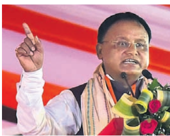
ମୁଖ୍ୟମନ୍ତ୍ରୀ ମୋହନ ଚରଣ ମାଝୀ

ଶ୍ରୀମନ୍ଦିର ରତ୍ନଭଣ୍ଡାର ଖୋଲାଯିବ ଏବଂ ଗଣତି ହେବ। ଯଦି କିଛି ଗତବର୍ଷ ହୋଇଥାଏ, ଦୋଷୀକୁ ଦଣ୍ଡ ଦିଆ ନକରାଯିବ ବୋଲି ମୁଖ୍ୟମନ୍ତ୍ରୀ ମୋହନ ଚରଣ ମାଝୀ କହିଛନ୍ତି। ଭୁବନେଶ୍ୱର ପ୍ରଦର୍ଶନୀ ପଡ଼ିଆରେ ରବିବାର ଭାଙ୍ଗପାର ନୂତନ ବିଧାୟକ ଓ ଏମ୍ପିଙ୍କୁ ସମ୍ବର୍ଦ୍ଧନା କାର୍ଯ୍ୟକ୍ରମର ଆୟୋଜନ କରାଯାଇଥିଲା। ଏଥିରେ ଯୋଗଦେଇ