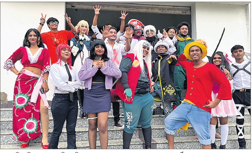
ରେଳ ଅତିଗୋରିୟାମ୍ବରେ ଆୟୋଜିତ ଆନିମେ ଇଭେଣ୍ଟରେ ଯୋଗଦେଇଥିବା ମୁବ ଭବ୍ୟଓଭର ଆର୍ଟିଷ୍ଟଙ୍କ ସହ ଅନ୍ୟମାନେ ।

ଭୁବନେଶ୍ୱର, ୩୦।୬ (ଶର୍ମିଷ୍ଠା ପାଣିଗ୍ରାହୀ) ଆନିମେ ପାଇଁ ମୁବପିଡିଙ୍କର ପ୍ରବଳ ଆଗ୍ରହ ଦେଖିବାକୁ ମିଳୁଛି । ଦିନ ଥିଲା ଆନିମେ କହିଲେ କେବଳ କାପାଳକୁ ବୁଝାଉଥିଲା । ମାତ୍ର ଏହା ଆଜି ବିଶ୍ୱପ୍ରସାରରେ ଲୋକପ୍ରିୟ ହେବାକୁ ଲାଗିଛି । କାପାଳ ପରେ ଭାରତରେ ଆନିମେଶନର ଏକ ନୂଆ ଧାରା ଜାରି ରହିଛି । ସ୍ୱାଭାବିକ ସ୍ଥିତିରେ, ମାକିମା, ମେନୁନି, ନେକ୍ଟୁରା, ମିକାସା, କାକାସି, ନାଗୁଟୋକ ଭଳି ଅନେକ ଆନିମେ ଚରିତ୍ର ଆଜି ମୁବପିଡିଙ୍କର