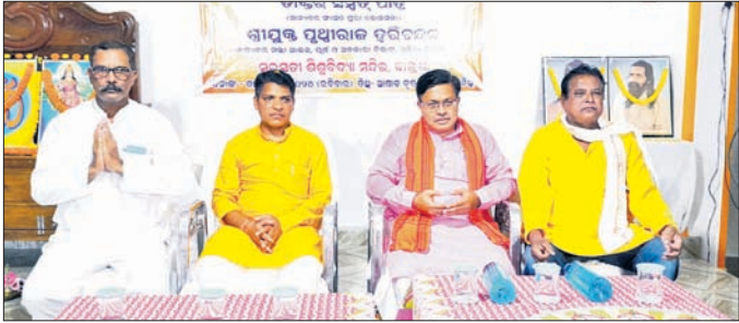
କାର୍ଯ୍ୟକ୍ରମରେ ମନ୍ତ୍ରୀ ପୁଅପାଲ ହରିଚନ୍ଦନ ଏବଂ ଅନ୍ୟମାନେ।