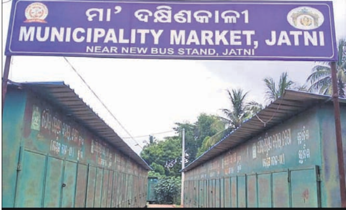
ଦୋକାନ ଘର କଳଙ୍କି ଲାଗିଗଲାଣି।

କଟଣା ପୌର ପରିଷଦ ପକ୍ଷରୁ ନିର୍ମିତ ମା' ଦକ୍ଷିଣକାଳୀ ଭେଣ୍ଟି ଜୋନ୍ ଲୋକଙ୍କ କାମରେ ଆସୁନାହିଁ। ସହରର ବିଭିନ୍ନ ସ୍ଥାନରେ ବ୍ୟବସାୟ କରୁଥିବା ବ୍ୟବସାୟୀଙ୍କୁ ଏକ ସ୍ଥାନରେ ଅଧିକାର କରିବା ପାଇଁ ୨୦୧୧-୧୨ ମସିହାରେ ପୌରାଧିକାରୀ ଡାକ୍ତରୀ ନିକଟରେ ଏହି ଭେଣ୍ଟି ଜୋନ୍ ନିର୍ମାଣ କରାଯାଇଥିଲା। ୪୫ରୁ ଉର୍ଦ୍ଧ୍ୱ ଦୋକାନ ଗୃହ ନିର୍ମାଣ କରାଯାଇଛି। ନିର୍ମାଣର ଦୀର୍ଘଦିନ ପରେ ଉକ୍ତ ଭେଣ୍ଟି ଜୋନ୍ କାର୍ଯ୍ୟକ୍ଷମ ହୋଇ ପାରିନଥିବା ବେଳେ ଉକ୍ତ ଅଞ୍ଚଳ ଅସାମାଜିକଙ୍କ ଆକ୍ରମଣ ପାଇଁ ଦୋକାନ ଘରଗୁଡ଼ିକରେ କଳଙ୍କି ଲାଗିବ ସହିତ ଲଟାଟୁଟାରେ ଦୋକାନ ଘରଗୁଡ଼ିକ ଅସୁରକ୍ଷିତ ହୋଇଗଲାଣି। ଅନ୍ୟପଟେ ଏହି ଭେଣ୍ଟି ଜୋନ୍ରେ ଦୋକାନ ଘର ପାଇଥିବା ବ୍ୟବସାୟୀ ଏଠାକୁ ନ ଆସି ସହର ଦୁର୍ଗଣା ଘରୁଥିବା ନଜିର ରହିଛି। ଏପରିକି ଆୟୁରାଜ୍ଞ, ପିସିଆର ଏବଂ ପର୍ଯ୍ୟଟନ ଗ୍ରାହକ ସମସ୍ୟା ଉପସ୍ଥିତ ବୋଲି ସାଧାରଣରେ ଅଭିଯୋଗ କରାଯାଉଛି। ଅନେକ ସମୟରେ ଛୋଟବଡ଼ ମୁଖ୍ୟ ରାସ୍ତାରେ ବ୍ୟବସାୟ କରୁଥିବା ବ୍ୟବସାୟୀ ଛାଡ଼ି ଦେଇଛନ୍ତି।