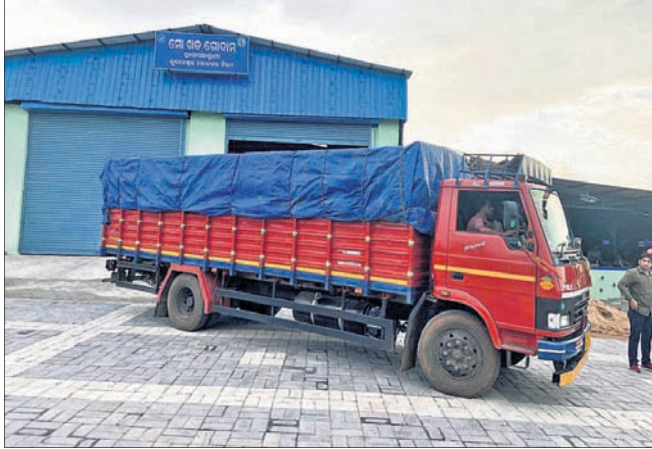
ହାତୀଆଣ୍ଡୁଣୀଠାରେ ମୋ ଖାତ ରୋବାଟିକ୍।

ସଂଗ୍ରହ ହେଉଥିବା ଆବର୍ଜନାକୁ ସହରର ୨୨ଟି ସ୍ଥାନରେ ଥିବା ୩୩ଟି ଏମ୍‌ସି (ମୋ ଖାତ) କମ୍ପୋଷ୍ଟ ସେଣ୍ଟର ଓ ୨୬ଟି ଏମ୍‌ଆର୍‌ଏମ୍ (ମୋ ଖାତ) ରିକଭର ଫାସିଲିଟି)କୁ ନିଆଯାଇଛି। ସେଠାରେ ଓଦା ଓ ଶୁଖିଲାକୁ ପୃଥକ କରାଯିବା ପରେ ଓଦା ଆବର୍ଜନାକୁ ପ୍ରକ୍ରିୟାକରଣ କରାଯାଇ ସେଥିରୁ ମୋ ଖାତ ପ୍ରସ୍ତୁତ ହେଉଛି। ଏମ୍‌ସିରେ ବିଭିନ୍ନ ପ୍ରକାରର ଖତ ଉତ୍ପାଦନ କରାଯାଇଛି। ଏମ୍‌ସିରୁ ଉତ୍ପାଦିତ ମୋ ଖାତ ପ୍ରସ୍ତୁତ ହେଉଛି। ଦୈନିକ ପ୍ରାୟ ୫୦୦ ଟନ୍ ଉର୍ଦ୍ଧ୍ୱ କେ.ଜି. ଲେଖାଏ ମୋ ଖାତ ବାହାରକୁ ଉତ୍ପାଦନ କରାଯାଇ ଏମ୍‌ସିରୁ ବିକ୍ରି କରାଯାଉଛି। ଏମ୍‌ଆର୍‌ଏମ୍ ଓ ରୋବାଟିକ୍ ଜମା କରି ରଖାଯାଇଛି। ପ୍ରଥମେ ମୋ ଖାତ