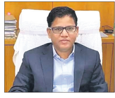
ଭୁବନେଶ୍ୱର, ୩୦.୭ (ଅସମାପିକା ସାହୁ)

ବରିଷ୍ଠ ପ୍ରଶାସକ ନିକ୍ଷୁଞ୍ଜି ବିହାରୀ ଧଳ ମୁଖ୍ୟମନ୍ତ୍ରୀଙ୍କ ଅତିରିକ୍ତ ମୁଖ୍ୟ ଶାସନ ସଚିବ ଭାବେ ନିଯୁକ୍ତି ପାଇଛନ୍ତି । ଏ ନେଇ ରବିବାର ମୁଖ୍ୟମନ୍ତ୍ରୀଙ୍କ କାର୍ଯ୍ୟାଳୟ ପକ୍ଷରୁ ସୂଚନା