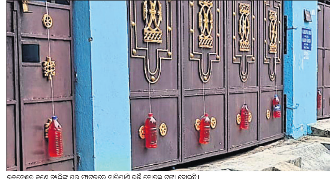
ଭୁବନେଶ୍ୱର ଜଣେ ବ୍ୟକ୍ତିଙ୍କ ଘର ଫାଟକରେ ନାଲିପାଣି ଭଳି ବୋତଲ ଚଢ଼ା ହୋଇଛି ।

ବିଜ୍ଞାନ ଯୁଗରେ ବି ବହୁ ଅନ୍ଧବିଶ୍ୱାସକୁ ଲୋକେ ବିଶ୍ୱାସ କରି ନେଉଛନ୍ତି ବା ମାନି ଆସୁଛନ୍ତି । ବହୁ ଅନ୍ଧବିଶ୍ୱାସ ବିଜ୍ଞାନ ସମ୍ମତ ଭାବେ ପ୍ରମାଣିତ ହେବା ସହ ସମାଜରେ ମାନବ ଜାତିର କାମରେ ଆସୁଛି । ବିଶେଷକରି ଗ୍ରାମାଞ୍ଚଳ ଓ ଆଦିବାସୀ ଅଧିକାଂଶ ଲୋକ ପୁରୁଣା ପ୍ରଥା, ବିଶ୍ୱାସକୁ କାବୁଟି ଧରିଛନ୍ତି । ହେଲେ ବ୍ରାହ୍ମଧାନୀ ଭୁବନେଶ୍ୱର ଭଳି ସହରରେ କିଛି କିଛି ଘଟଣାକୁ ନେଇ ମନରେ ନାନା ପ୍ରଶ୍ନ ଉଠୁଛି । ବୋକାନ ବଜାର ହେଉଛି ଲୋକଙ୍କ ଘର ଆଗରେ ନାଲି ପାଣି ବୋତଲ ରଖିଥିବା ବା ଚଢ଼ା ହେଉଥିବା ଦେଖିବାକୁ ମିଳୁଛି । ବିଶେଷକରି ରାତି ସମୟରେ ଏହା ଅଧିକ ନଜରକୁ ଆସୁଛି । ତେବେ ଏହା ପଛର କାରଣ ବା ରହସ୍ୟ ଜାଣିବାକୁ ଆମେ ଚେଷ୍ଟା କରିଥିଲୁ । ଏହା ବିଜ୍ଞାନ ସମ୍ମତ କୌଣସି ପ୍ରମାଣ ନ ଥିଲେ ମଧ୍ୟ ନାଲି ବୋତଲ ଦେଖିଲେ କୁହୁର ସେହି ସ୍ଥାନ ମାଡ଼ୁଛି ନାହିଁ କି ଗାଣିଗାରୁ ଭଳି ବୁଲାଇ ଶାବକକୁ ଅଧିଆ