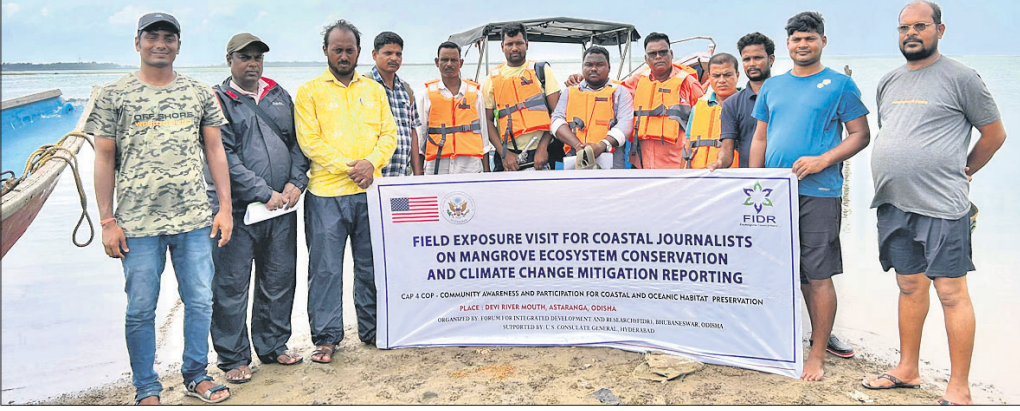
ଦେବା ନଦୀ ମୁହାଣ ଓ ଲୁଣା ଜଙ୍ଗଲ ପରିବର୍ତ୍ତନ ଅବସରରେ ଉପସ୍ଥିତ ଖବରଦାତା ଏବଂ ଅନ୍ୟମାନେ।