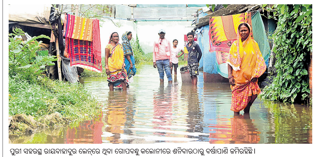
ପୂରୀ ସହରରୁ ରାୟବାହାପୁର ଲେନ୍‌ରେ ଥିବା ଗୋପବନ୍ଧୁ କଲୋନୀରେ ଶନିବାରଠାରୁ ବର୍ଷାପାଣି ଜମିରହିଛି।

୪୫ ମିନିଟ୍ ପର୍ଯ୍ୟନ୍ତ ଏଭଳି ସ୍ଥିତି ଲାଗି ରହିଥିଲା। ଶେଷରେ ମୋବାଇଲ ଲାଇଟ କମାଳ ରୋଗୀଙ୍କୁ ସାଲାଇନ ଦିଆଯିବା ସହ ପ୍ରେସ୍‌କର୍ମିନି ଲେଖାଯାଇଥିବା ବେଶ୍‌ବାକୁ ମିଳିଛି। ଜିଲ୍ଲା ଚିକିତ୍ସାଳୟରେ ବାରମ୍ବାର ବିଦ୍ୟୁତ୍ ବିଚ୍ଛିନ୍ନ ହେଉଥିବା ନେଇ ସବୁ ସମୟରେ ଅଭିଯୋଗ ହୋଇ ଆସୁଥିଲେ ମଧ୍ୟ କୌଣସି ପଦକ୍ଷେପ ଗ୍ରହଣ କରାଯାଇନାହିଁ। ଅନେକ ସମୟରେ ରୋଗୀମାନେ ପିଇବା ପାଇଁ ପାଣି ପାଉ ନ ଥିବା ଅଭିଯୋଗ ହେଉଛି। ଏ ନେଇ ରୋଗୀଙ୍କ ମଧ୍ୟ ଅସନ୍ତୋଷ ପ୍ରକାଶ ହୋଇଛି।