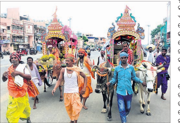
ଦେଉଳି ମଠ ପକ୍ଷରୁ ଶ୍ରୀକ୍ଷେତ୍ରରେ ଆସି ପହଞ୍ଚିଥିବା ଫଳଭାର।

ଦିବସରେ ରବିବାର କାକଟପୁରର ଦେଉଳି ମଠ ପକ୍ଷରୁ ବାହୁଡ଼ିଆଙ୍କ ଉଦ୍ଦେଶ୍ୟରେ ଅଣସର ଭାର ଶ୍ରୀମନ୍ଦିରକୁ ଆସିଛି। ଭାରରେ ଆୟ, ପଣସ, ସପ୍ତରୀ, ନଡ଼ିଆ, ସେଠ, ଡାଲିମ, କମଳା ଆଦି ବିଭିନ୍ନ ପ୍ରକାର ଫଳ ରହିଛି। ସେହିପରି ପଦ୍ମମାଳ, ବୁଲୁଣା ମାଳ ଓ ପଦ୍ମପୁଲ ଆଦି ରହିଛି। ପ୍ରତ୍ୟେକ ବର୍ଷ ଅଣସର ସମୟରେ ଦେଉଳି ମଠ ପକ୍ଷରୁ ଫଳଭାର ପଠାଯାଉଥିବା ମଠ ପକ୍ଷରୁ ସୂଚନା ଦିଆଯାଇଛି।