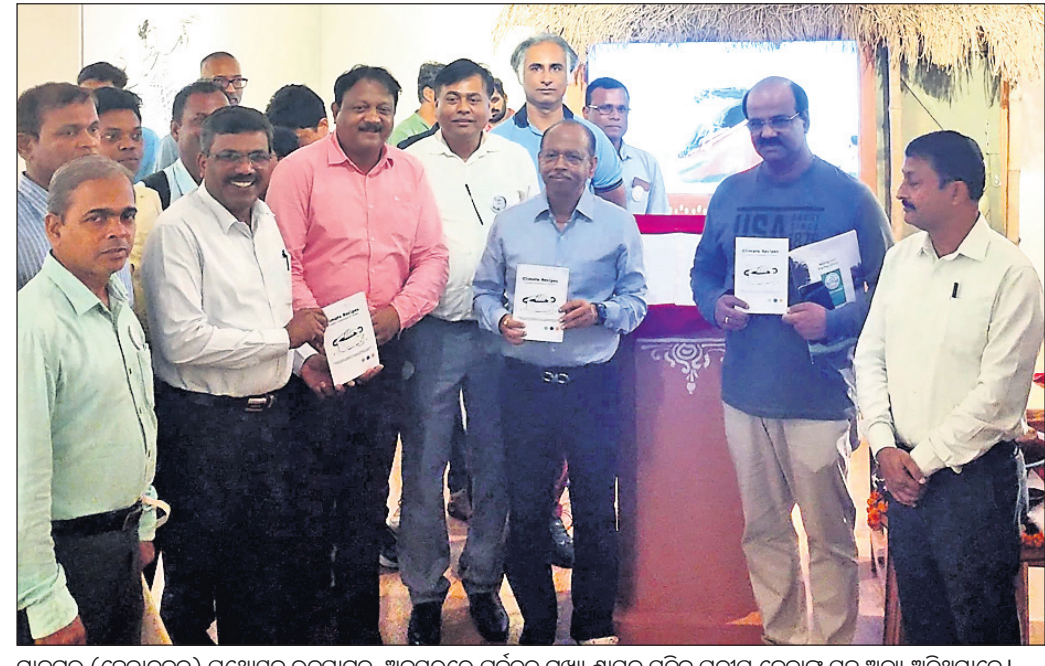
ମାନଗୁରୁ (ହେତୁଲବନ) ପଥୋସ୍ତର ଉଦ୍ଘାଟନ ଅବସରରେ ପୂର୍ବତନ ମୁଖ୍ୟ ଶାସନ ସଚିବ ପ୍ରଦୀପ ଜେନାଙ୍କ ସହ ଅନ୍ୟ ଅତିଥିମାନେ ।