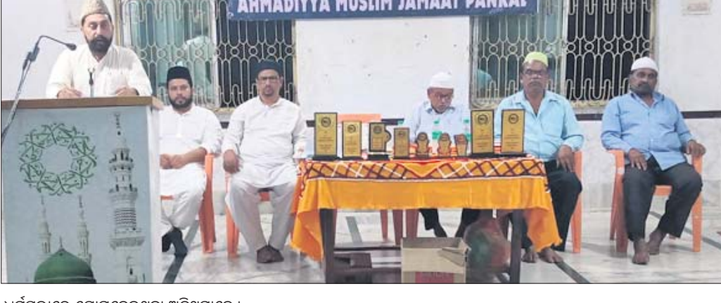
ଧର୍ମସଭାରେ ଯୋଗଦେଇଥିବା ଅତିଥିମାନେ ।