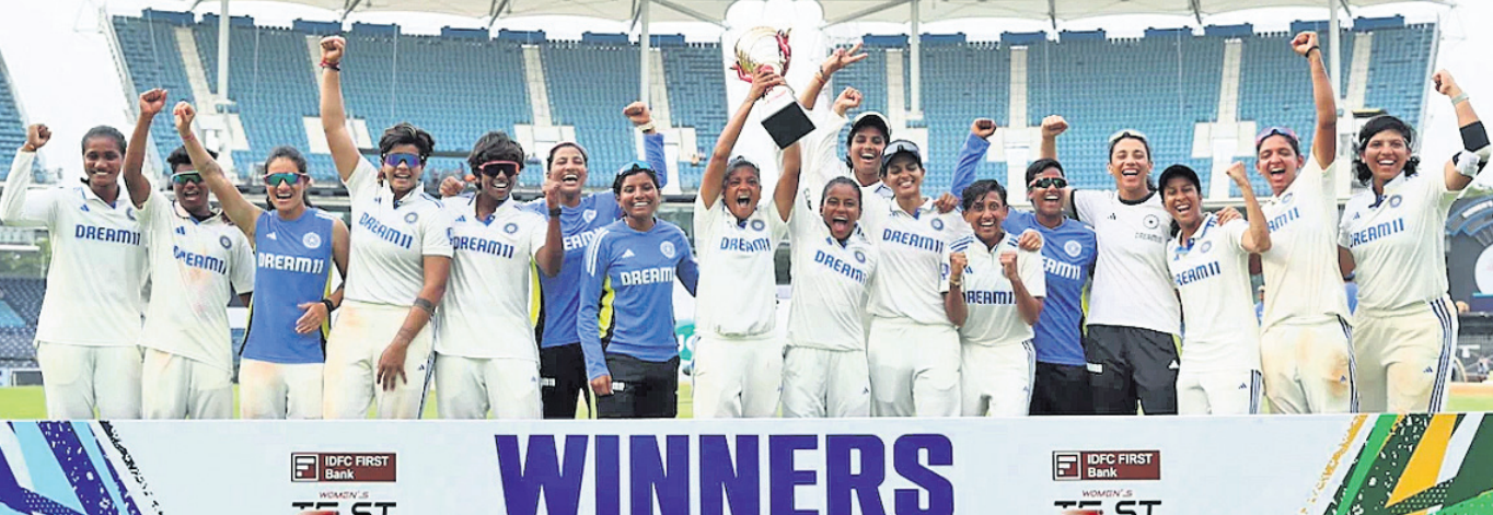
ଦକ୍ଷିଣ ଆଫ୍ରିକା ବିପକ୍ଷରେ ମହିଳା ଚେଷ୍ଟା ପକ୍ଷରୁ ବିଜୟୀ ଭାରତୀୟ ଦଳ ।