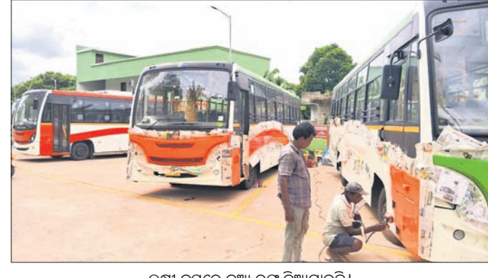
ଲକ୍ଷ୍ମୀ ବସ୍ରେ ନୂଆ ରଙ୍ଗ ଦିଆଯାଇଛି।