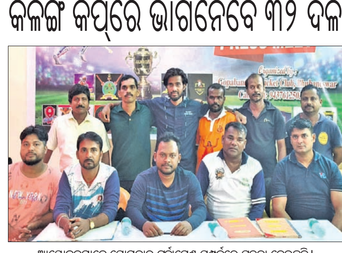
ଆୟୋଜକମାନେ ସୋମବାର ରୁନିମେଣ୍ଟ ସମ୍ପର୍କରେ ପୂର୍ତ୍ତା ଦେଉଛନ୍ତି ।

ଫେଡ଼ରେଶନ ଦ୍ୱାରା ଏସ୍.ଆର୍. ଚେଷ୍ଟା ଆୟୋଜନ ପ୍ରଦାନ କରିଛି । ଫେଡ଼ରେଶନ ଆୟୋଜନ ଅଧିକାର ପ୍ରଦାନ କରିଛି ।