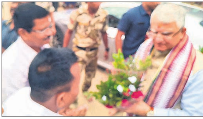
ମୁଖ୍ୟ ବିଚାରପତି ଚକ୍ରଧାରୀ ଶରଣ ସିଂହ ବାଣପୁରୀଙ୍କୁ ଦର୍ଶନ କରିବା ସହ ଆଶୀର୍ବାଦ ଦେଇଛନ୍ତି।

ଓଡ଼ିଶା ଉଚ୍ଚ ନ୍ୟାୟାଳୟର ମୁଖ୍ୟ ବିଚାରପତି ଚକ୍ରଧାରୀ ଶରଣ ସିଂହ ଯୋଗଦାନ କରି ଶ୍ରୀମତୀ ବାଣପୁରୀଙ୍କୁ ମା' ଭଗବତୀଙ୍କୁ ଦର୍ଶନ କରିବା ସହ ଆଶୀର୍ବାଦ ଲାଭ କରିଛନ୍ତି।