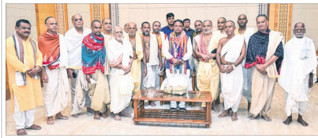
ଭୁବନେଶ୍ୱରରେ ରାଜ୍ୟ ଅତିଥି ଭବନରେ ଯୋଜନା କରାଯାଇଥିବା ଯୋଜନା ଉଦ୍ଦେଶ୍ୟରେ ସାମ୍ନାତ କରୁଛନ୍ତି।