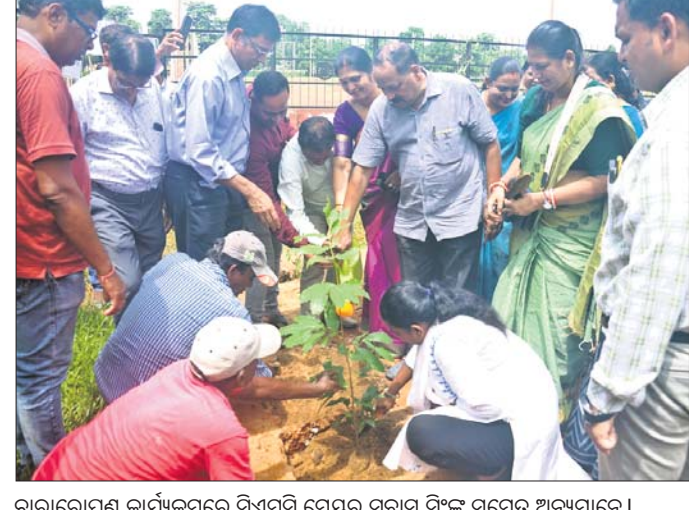
ଚାରାରୋପଣ କାର୍ଯ୍ୟକ୍ରମରେ ସିଏମ୍‌ସି ମେୟର ସୁବାସ ସିଂଙ୍କ ସମେତ ଅନ୍ୟମାନେ ।