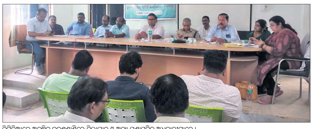
ଚରିତ୍ର ଆରେ ଅନୁଷ୍ଠିତ ଜନଶୁଣାଣୀରେ ଜିଲ୍ଲାପାଳ ଓ ଅନ୍ୟ ପ୍ରଶାସନିକ ଅଧିକାରୀମାନେ ।

ଚରିତ୍ର ଆ ବୁକ୍ସ କାର୍ଯ୍ୟକ୍ରମ ସମ୍ମିଳନୀ କକ୍ଷରେ ଯୋଗଦାନ କଟକ ଜିଲ୍ଲାପାଳଙ୍କ ଜନଶୁଣାଣୀ ଶିବିର ଅନୁଷ୍ଠିତ ହୋଇଯାଇଛି । ୨୯୩ ମାସ ପରେ ଏହି ଶିବିର ଅନୁଷ୍ଠିତ ହୋଇଥିବାରୁ ଏନେଇ ଅଞ୍ଚଳ ବାସୀଙ୍କ ମଧ୍ୟରେ ଉତ୍ସାହ ପରିଲକ୍ଷିତ ହୋଇଛି ।