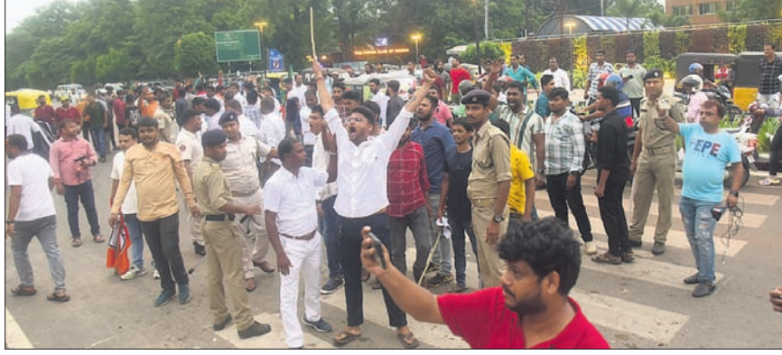
ଭୁବନେଶ୍ୱର ମାଷ୍ଟରକ୍ୟାଣ୍ଟିନ ଛକରେ ମଙ୍ଗଳବାର ଭାଜପା ଓ କଂଗ୍ରେସ କର୍ମୀ ମୁହଁମୁହିଁ ହୋଇଛନ୍ତି।

ଭୁବନେଶ୍ୱର ମାଷ୍ଟରକ୍ୟାଣ୍ଟିନ ଛକରେ ଭାଜପା ଏବଂ କଂଗ୍ରେସ କର୍ମୀଙ୍କ ମଧ୍ୟରେ ମଙ୍ଗଳବାର ସନ୍ଧ୍ୟା ସମୟରେ ମୁହଁମୁହିଁ ପରିସ୍ଥିତି ଦେଖିବାକୁ ମିଳିଛି। ପାଲିମେଣ୍ଟରେ ବିରୋଧୀ ଦଳ ନେତା ରାହୁଲ ଗାନ୍ଧୀଙ୍କ ମନ୍ତବ୍ୟକୁ ନେଇ ଉଭୟ ଭାଜପା ଏବଂ କଂଗ୍ରେସ କର୍ମୀଙ୍କ ମଧ୍ୟରେ ଲକ୍ଷ୍ମୀକାଣ୍ଡ ପୃଷ୍ଠି ହୋଇଥିବା ଦେଖିବାକୁ ମିଳିଛି। ପରିସ୍ଥିତି ଏତକ ହୋଇଥିଲା ଯେ, ଭାଜପା ଏବଂ କଂଗ୍ରେସ କର୍ମୀ ପରସ୍ପର ଉପରକୁ ଡେଇଁ, ପଥର