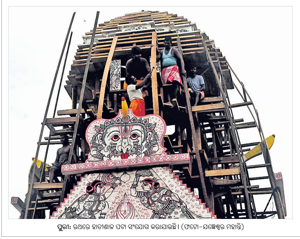
ପୂରା: ରଥରେ ହାତୀଗାଳ ପଟା ସଂଯୋଗ କରାଯାଇଛି।