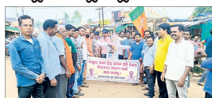
ରାଜଘରଠାରେ ବିକ୍ଷୋଭ ପ୍ରଦର୍ଶନ କରାଯାଇଛି।

ରାଜଘରଠାରେ ବିକ୍ଷୋଭ ପ୍ରଦର୍ଶନ କରାଯାଇଛି। ରାଷ୍ଟ୍ରଲଙ୍କ ମତବ୍ୟକୁ ନେଇ ସାରା ଦେଶରେ ବିରୋଧ ସୂଚୀମାନୁ ମିଳିଛି।