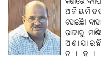
କିଶୋର ବ୍ୟାପକ ଅନିୟମିତତା ହୋଇଛି।

ନବରଙ୍ଗପୁର ଜିଲ୍ଲାରେ ୫-ଟି ସ୍କୁଲଗୁଡ଼ିକ ଖର୍ଚ୍ଚ ଅବକଳ ମୂଲ୍ୟ କିଏ ନିର୍ଦ୍ଧାରଣ କରିଛନ୍ତି।