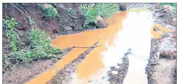
ନିର୍ମାଣାଧୀନ ରାସ୍ତା ଉପରେ ଜମିଥିବା ବର୍ଷାପାଣି ।

ରାୟଗଡ଼ା ଜିଲ୍ଲା କାଶୀପୁର ବ୍ଲକ୍ ତଳାଞ୍ଚଳ ପଞ୍ଚାୟତ ପ୍ରମୁଖସଦର ଗ୍ରାମରେ ଉତ୍ତରାଞ୍ଚଳା ଗୋବରା ୪ ଶିଳ୍ପ ପୁରୁ ଘରଣା ସାଥୀ ରାଜ୍ୟରେ ଚଳୁଥିବା କୃଷି କରୁଥିଲା । ଗ୍ରାମକୁ ରାସ୍ତା ନ ଥିବାରୁ ସାମ୍ପ୍ରାୟ ସେବା ଅସମ୍ଭବ ଯୋଗୁ ଏକ ପରିସ୍ଥିତି ସୃଷ୍ଟି ହୋଇଥିବା ଅଭିଯୋଗ ହୋଇଥିଲା । ଏହି ଖବର ବିଜ୍ଞାନ ଗଣନାଧିକାରୀ ପ୍ରକାଶ ପାଲକା ପରେ ପ୍ରଥମେ ଗ୍ରାମକୁ ଭଲ ରାସ୍ତା ନିର୍ମାଣ କରିବା ପାଇଁ ରାଜ୍ୟ ସରକାର ନିର୍ଦ୍ଦେଶ ଦେଇଥିଲେ । ଫଳରେ ପ୍ରମୁଖସଦର ଗ୍ରାମକୁ ଯିବା ପାଇଁ ପାହାଡ଼ିଆ ରାସ୍ତାକୁ କାଟି ରାସ୍ତା ନିର୍ମାଣ