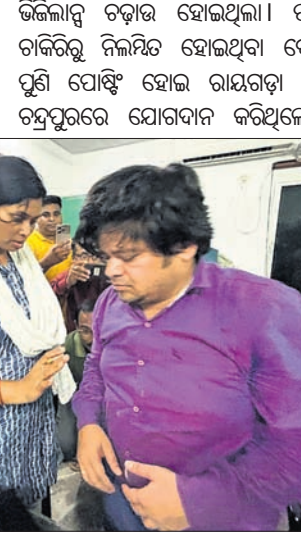
ତହସିଲଦାରଙ୍କୁ ଉଲ୍ଲିମାଟ୍ ଟିଏସ୍ପିକ କାର୍ଯ୍ୟକ୍ରମରୁ ନିଆଯାଇଛି ।

ବିଚିତ୍ରାନନ୍ଦ ଲାଞ୍ଚ ଟଙ୍କା ଗାଡ଼ିରେ ରଖିଥିବା କୌଣସି ସୂତ୍ରରୁ ଉଲ୍ଲିମାଟ୍ ଜବତକାରୀ ତତ୍ତ୍ୱାବଧାନ କରାଯାଇଛି । ଉଲ୍ଲିମାଟ୍ ଚନ୍ଦ୍ରପୁର ଗୋଷ୍ଠୀ ଗିରଫ କରିଛି । ବିଚିତ୍ରାନନ୍ଦଙ୍କ ଗାଡ଼ିକୁ ପିଛାକରିଥିଲେ । ତହସିଲଦାର ରାୟଗଡ଼ା ଜିଲ୍ଲାପାଳ କାର୍ଯ୍ୟକ୍ରମରୁ ଏକ ବୈଠକରେ ଯୋଗଦେବାକୁ ଆସିଥିଲେ । ବୈଠକ ସମୟରେ ପରେ ଜିଲ୍ଲାପାଳ କାର୍ଯ୍ୟକ୍ରମରୁ ବାହାରି ଚନ୍ଦ୍ରପୁର ଫେରିବା ସମୟରେ ଉଲ୍ଲିମାଟ୍ ଚନ୍ଦ୍ରପୁରରେ ଯୋଗଦାନ କରିଥିଲେ ।