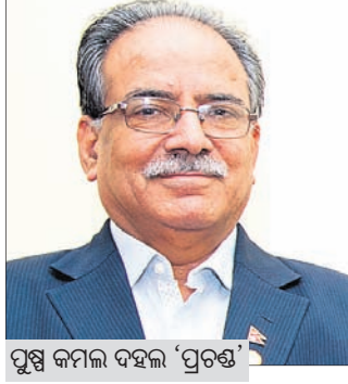
ପୁଷ୍ପ କମଳ ଦହଳ 'ପ୍ରଚଣ୍ଡ'