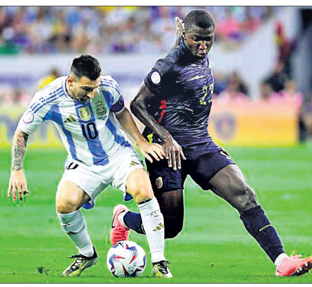
ଆର୍ଜେଣ୍ଟିନା ଓ ଇଙ୍ଗ୍ରେଡର ମଧ୍ୟରେ ଅନୁଷ୍ଠିତ ମ୍ୟାଚ।

ଗତଥର ଚାମ୍ପିୟନ ଆର୍ଜେଣ୍ଟିନା ୪-୨ ପେନାଲ୍ଟି କିକ୍ରେ ଇଙ୍ଗ୍ରେଡରକୁ ପରାସ୍ତ କରି କୋପା ଆମେରିକା ଫୁଟବଲର ସେମିଫାଇନାଲରେ ପ୍ରବେଶ କରିଛି।