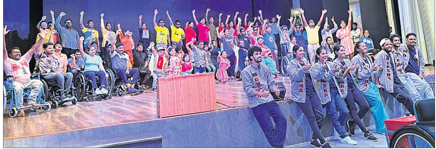
'ଦିବ୍ୟ କଳା ମେଳା'ରେ ଅଂଶଗ୍ରହଣ କରିଥିବା ବିଦ୍ୟାଳୟମାନେ।

ଭାରତ ସରକାରଙ୍କ ସାମାଜିକ ନ୍ୟାୟ ଓ ସଶକ୍ତୀକରଣ ମନ୍ତ୍ରାଳୟ ଅଧୀନ ଭିନ୍ନଭିନ୍ନ ସଶକ୍ତୀକରଣ ବିଭାଗ ପକ୍ଷରୁ ଜାତୀୟ ଭିନ୍ନଭିନ୍ନ ଅର୍ଥ ଓ ଉନ୍ନୟନ ନିଗମ (ଏନ୍‌ଏସ୍‌ଏସ୍‌ଟିଭି) ସହଯୋଗରେ ଶୁକ୍ରବାର କିଏ ବିଷୟବିଦ୍ୟାଳୟରେ ବିଦ୍ୟାଳୟ ଉଦ୍‌ଘୋଷଣା, କାରିଗର ଓ ଶିଳ୍ପୀଙ୍କ ପ୍ରତିଭା ଓ କାରିଗରୀ କୌଶଳକୁ ସମ୍ମାନ ଜଣାଇ 'ଦିବ୍ୟ କଳା ମେଳା' ଆରମ୍ଭ ହୋଇଯାଇଛି। କେନ୍ଦ୍ର ସାମାଜିକ ନ୍ୟାୟ ଓ ସଶକ୍ତୀକରଣ ରାଷ୍ଟ୍ର ମନ୍ତ୍ରୀ ବି.ଏଲ୍. ବର୍ମା କାର୍ଯ୍ୟକ୍ରମକୁ ଉଦ୍‌ଘାଟିତ କରିଛନ୍ତି। ସେ କହିଥିଲେ, ଆଜି ଆମେ 'ସାମର୍ଥ୍ୟ' ପ୍ରଦର୍ଶନ କରୁଛୁ। 'ଦିବ୍ୟ କଳା ମେଳା'ରେ ଅଂଶଗ୍ରହଣ କରୁଥିବା ଆମର ବିଦ୍ୟାଳୟ ଭଉଣୀଭାଙ୍ଗମାନେ ଦୁଇ ସାଙ୍ଗ ଅର୍ଥର ସାଜାଯାଇଥିବା ଏବଂ ଘରେ ସେ ଏକ୍ସିଟିଆ ଥିଲେ। ପୂର୍ବରୁ ତାଙ୍କ ସାଙ୍ଗ କୌଣସି କାମରେ ରୁମ୍‌କୁ ଆସିଥିବା ବେଳେ ଭିତର ପଟୁ କବାଟ ବନ୍ଦ ଥିବା ଓ ଫ୍ୟାନ୍‌ରେ ମାତ୍ର ଝୁଲୁଥିବା ଦେଖି ପୋଲିସକୁ ଖବର ଦେଇଥିଲେ।