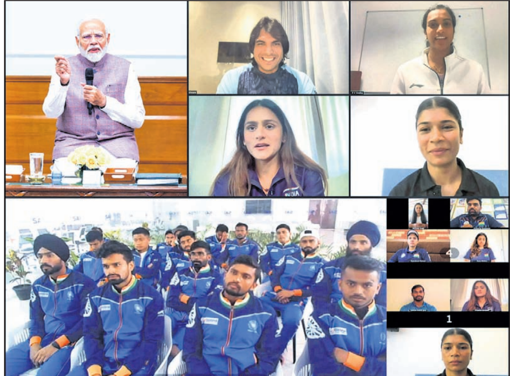
ପ୍ୟାରିସ ଅଲିମ୍ପିକ୍ସରେ ଭାରତୀୟ ଦଳର ଆଶୀର୍ବାଦୀ ପ୍ରଧାନମନ୍ତ୍ରୀ ନରେନ୍ଦ୍ର ମୋଦି।

ଭାରତ ୨୦୨୪ ଅଲିମ୍ପିକ୍ସ ବିତ୍ ହାସଲ କରିବା ନେଇ ପ୍ରଧାନମନ୍ତ୍ରୀ ନରେନ୍ଦ୍ର ମୋଦି ଦୃଢ଼ ଆଶୀର୍ବାଦୀ। ଏହି ପରିପ୍ରେକ୍ଷାରେ ସେ ପ୍ୟାରିସ ଗେମ୍ସରେ ଭାରତୀୟ ଦଳର ପ୍ରଦର୍ଶନକୁ ଆଶୀର୍ବାଦ ଦେଇଛନ୍ତି।