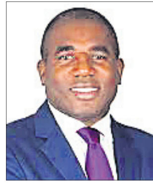
ଶୁକ୍ରବାର ଭାରତ ଆସିବେ

ଟ୍ରିଟେନ୍ ପ୍ରଧାନମନ୍ତ୍ରୀ କିର ଷ୍ଟର୍ଣ୍ଣର ଶୁକ୍ରବାର ଲେବର ଏମ୍ପି ଡେଭିଡ୍ ଲାମିଙ୍କୁ ଦେଶର ନୂଆ ବହିର୍ବ୍ୟାପାର ସଚିବ ନିଯୁକ୍ତ କରିଛନ୍ତି। ୫୧ ବର୍ଷୀୟ ଡେଭିଡ୍ ଭାରତ ସହ ଦୃଢ଼ ଦ୍ୱିପାକ୍ଷିକ ସମ୍ପର୍କ ସମ୍ପାଦନା କରିବା ପାଇଁ ଲେବର ପାର୍ଟିର ବହିର୍ବ୍ୟାପାର ମନ୍ତ୍ରୀ ଏସ୍. ଜୟଶଙ୍କରଙ୍କୁ ଜଣେ ବନ୍ଧୁ ବୋଲି ଅଭିହିତ କରିଛନ୍ତି। ଏଥିସହ ମାସକ ଭିତରେ ଭାରତ ଗପ୍ତ କରିପାରନ୍ତି ବୋଲି କହିଛନ୍ତି। ଡେଭିଡ୍‌ଙ୍କ ନେତୃତ୍ୱରେ ଭାରତ-ଟ୍ରିଟେନ୍ ପୁଣି ବାଣିଜ୍ୟ ରୁଦ୍ଧି (ଏମ୍ପିଏ) ସମ୍ପାଦନ ହୋଇପାରେ ବୋଲି ଆଶା କରାଯାଉଛି।