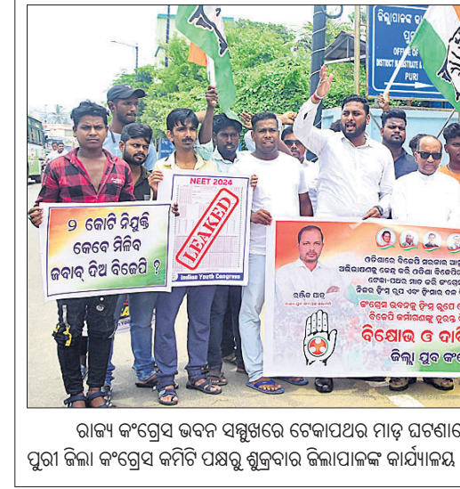
ରାଜ୍ୟ କଂଗ୍ରେସ ଉପକ୍ରମରେ ଚେକାପତର ମାଡ଼ ଘଟଣାରେ ଅଭିଯୁକ୍ତ ଭାଗ୍ୟାଳୁ କର୍ମୀଙ୍କୁ ରୁକ୍ଷତା ଗ୍ରହଣ କରିବାକୁ ନିର୍ଦ୍ଦେଶ ଦେଇଛନ୍ତି।

କେନ୍ଦ୍ରୀୟ ପାଠ୍ୟପୁସ୍ତକ ପ୍ରଣୟନ ପୂର୍ବଦେଶୀୟ ପ୍ରଶାସନ ପ୍ରକାଶନ ନାମରେ କ୍ୟାପିଟାଲ ଥାନାରେ ଏତଲା ଦେଇଛନ୍ତି।