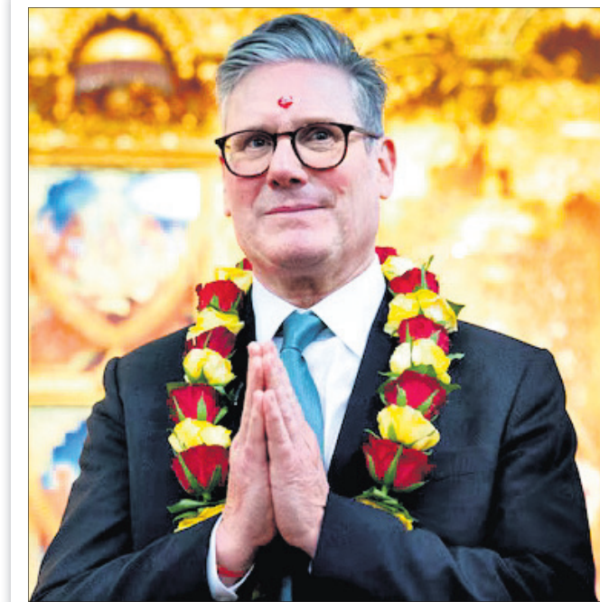
ଲେବର ପାର୍ଟି ନେତା କିର ଷ୍ଟର୍ଣ୍ଣର କୁଲ୍ ୨୮ରେ ନିର୍ବାଚନ ପ୍ରଚାର ବେଳେ ଭାରତୀୟ ବଂଶୋତ୍ତର ଭୋତରୁ ଆକର୍ଷିତ କରିବା ପାଇଁ ଲଣ୍ଡନର କିଙ୍ଗ୍‌ସ୍‌କ୍ରୋସ୍ଟ ସାମାଜିକବାଦୀ ମନ୍ଦିରକୁ ଯାଇଥିଲେ।

ଭାରତ ସରକାର ଏହି ଉପରେ କୁଲନ୍ ଏକାକୀବେଧ୍ୟ ଅଧିକ୍ଷ କରିବା ପାଇଁ ଯୋଜନା କରିଥିଲେ। ତେବେ ମୋଦିଙ୍କ ଅନୁକୂଳ ନିର୍ବାଚନରେ ଜନ୍ ମେଜରଙ୍କ ନେତୃତ୍ୱାଧୀନ କଞ୍ଚାଭେଟିକ୍ ପାର୍ଟି ଗୋଟି ରୂପରେ ଲେବର ପାର୍ଟିକୁ ହାରିଯାଇଥିଲା। ଭାରତରେ ମଧ୍ୟ ଲେବର କୁମାର ଗୁଜରାଲଙ୍କ ନେତୃତ୍ୱରେ ମିଳିତ ସରକାର ଗଠନ ହେଲା। କୁଲନ୍ ଏକାକୀବେଧ୍ୟ ଅଭୋଦ୍ଧରେ