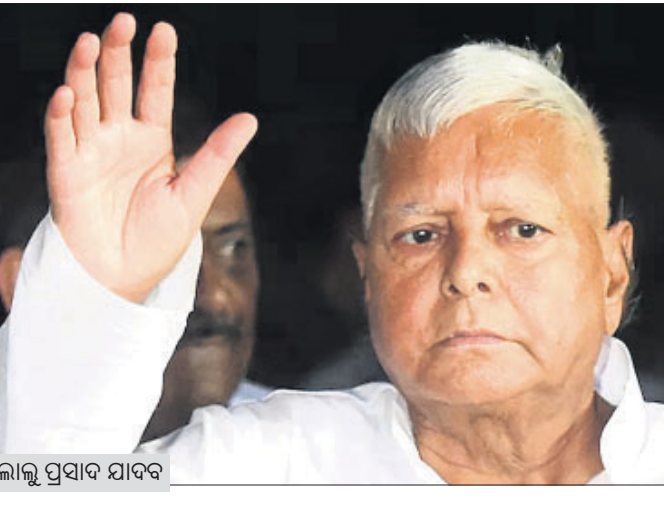
ଲାଲୁ ପ୍ରସାଦ ଯାଦବ

ନେତା ଦାବି କରୁଥିବା ଲାଲୁ କହିଛନ୍ତି। ଅନ୍ୟପକ୍ଷରେ ବିହାରର ପୂର୍ବତନ ଉପମୁଖ୍ୟମନ୍ତ୍ରୀ ତଥା ଆରଜେଡି ନେତା ତେଜସ୍ୱୀ ଯାଦବ ମୁଖ୍ୟମନ୍ତ୍ରୀ ନାତାଣି କୁମାରଙ୍କୁ କଡ଼ା ସମାଲୋଚନା କରିଛନ୍ତି।