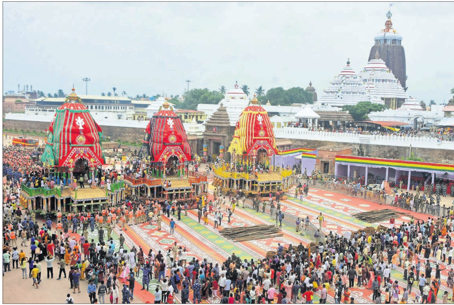
ଆଜି ରଥଯାତ୍ରା: ପୁରୀ ଶ୍ରୀମନ୍ଦିର ସିଂହଦ୍ୱାର ସମ୍ମୁଖରେ ଶନିବାର ପ୍ରସ୍ତର ହୋଇରହିଥିବା ନନ୍ଦିଘୋଷ, ଦର୍ପଦଳନ ଓ ତାଳଧ୍ୱଜ ରଥ ।

ପୁରୀ ଶ୍ରୀମନ୍ଦିର ପ୍ରସ୍ତର ଯାତ୍ରାରେ ପଥକୁ ଓହ୍ଲାଇବେ ଦାରୁଦିଆଁ ପୁରୀ ଶ୍ରୀମନ୍ଦିର ପ୍ରସ୍ତର ଯାତ୍ରାରେ ପଥକୁ ଓହ୍ଲାଇବେ ଦାରୁଦିଆଁ ପୁରୀ ଶ୍ରୀମନ୍ଦିର ପ୍ରସ୍ତର ଯାତ୍ରାରେ ପଥକୁ ଓହ୍ଲାଇବେ ଦାରୁଦିଆଁ