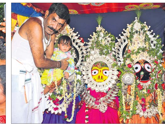
ଝାଡୁଆପଡ଼ାରେ ରଥାରୁଡ଼ି ବ୍ରହ୍ମପୁରା ଠାକୁରଙ୍କଠାରେ ପଶ୍ଚିମ ଓଡ଼ିଶାର ନିଆରା ପରମ୍ପରା ଶିଶୁଙ୍କ ରଥଛୁଆଁ ନୀତି।