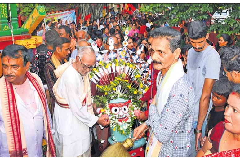
ଧନୁପାଲି ଗୋପାଳଜୀ ମନ୍ଦିର ପକ୍ଷରୁ ଆୟୋଜିତ ବକଉଡ଼ୁ ଠାକୁରଙ୍କ ପହଞ୍ଚି ବିକେ ନୀତି।