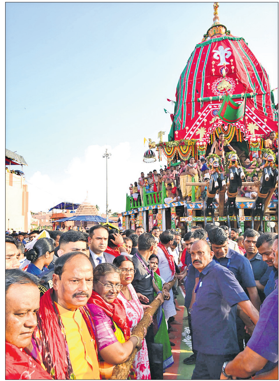
ଭବିବାର ଅପରାହ୍ନରେ ପୁରୀରେ ଗନ୍ଧଧୂଳି ଉତ୍ସବ ପାଳନ କରାଯାଇଥିବା ସମୟରେ ଘୋଷଣାତ୍ରା ଗୋଡ଼ା ଚଳାଇବା ପାଇଁ।