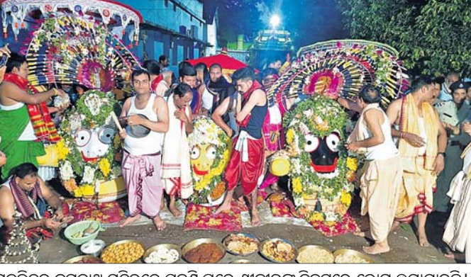
ଗଡ଼ଜାତର ଜଗନ୍ନାଥ ମନ୍ଦିରରେ ପହଞ୍ଚି ପରେ ଶ୍ରୀଜୀଉଙ୍କ ନିକଟରେ ଭୋଗ ଲଗାଯାଉଛି।