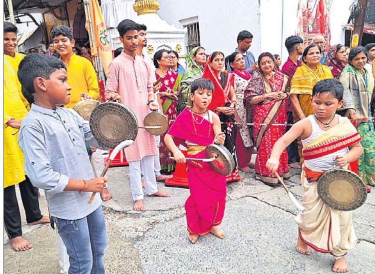
ଝାଡୁଆପଡ଼ା ରଥଯାତ୍ରାରେ କୁନି ପିଲାମାନେ ଘଣ୍ଟବାଦ୍ୟ କରୁଛନ୍ତି।