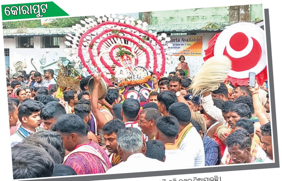
ଘୋଷଣାତ୍ରା ପାଇଁ ଘୋଷଣା ପାଳନ କରାଯାଇଛି।