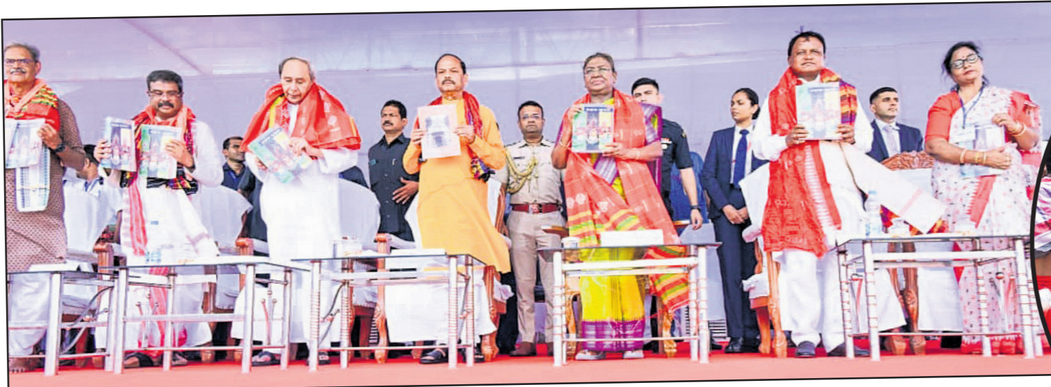
ଘୋଷଣାତ୍ରା ଅବସରରେ ପୁରୀରେ (ବାମପାର୍ଶ୍ୱ) ଘୋଷଣାତ୍ରା ପାଇଁ ଘୋଷଣା ପାଳନ କରାଯାଇଛି।