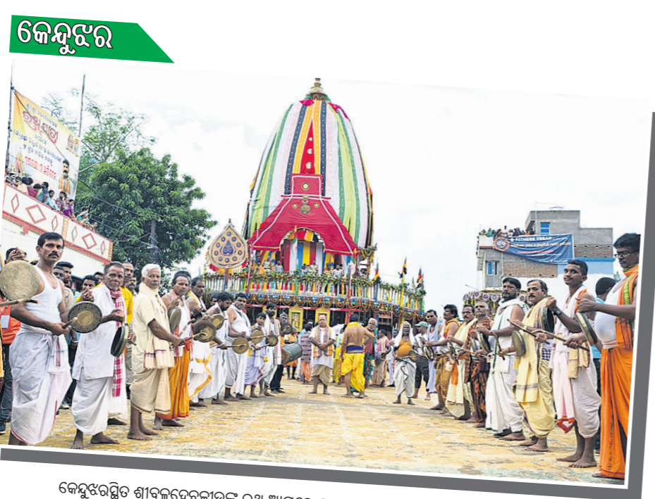
ଘୋଷଣାତ୍ରା ପାଇଁ ଘୋଷଣା ପାଳନ କରାଯାଇଛି।