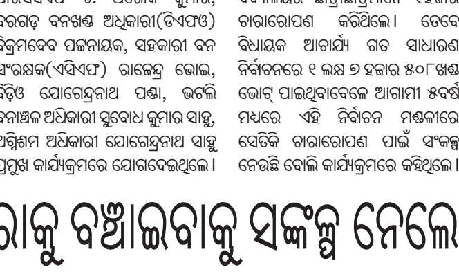
ବନ ମହୋତ୍ସବ ପାଳନ ଅବସରରେ ଅତିଥିଙ୍କ ସହ ଛାତ୍ରାଛାତ୍ରୀ।

ଶାର୍ଦ୍ଧକ ଭାବଧାରୀଙ୍କୁ ନେଇ ୨୫୦ରୁ ଉପସ୍ଥିତ ଥିଲେ। ଶେଷରେ ସମସ୍ତେ ଉର୍ଦ୍ଧ୍ୱ ଚାରା ରୋପଣ କରାଯାଇଥିଲା। ନିଜ ରୋପଣ କରିଥିବା ଚାରାକୁ ଏହି କାର୍ଯ୍ୟକ୍ରମରେ ଶ୍ରୀସତ୍ୟବାଇ ସେବା ସଙ୍ଗଠନ ପୁରୁଷ୍କୃତର ସଦସ୍ୟମାନେ ଉପସ୍ଥିତ ଥିଲେ। ଶେଷରେ ସମସ୍ତେ ଉର୍ଦ୍ଧ୍ୱ ଚାରା ରୋପଣ କରିଥିବା ଚାରାକୁ ଏହି କାର୍ଯ୍ୟକ୍ରମରେ ଶ୍ରୀସତ୍ୟବାଇ ସେବା ସଙ୍ଗଠନ ପୁରୁଷ୍କୃତର ସଦସ୍ୟମାନେ