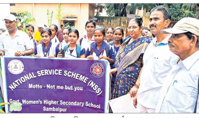
ବନ ମହୋତ୍ସବରେ ସାମିଲ ଅଧ୍ୟାପିକା, ଅଧ୍ୟାପକ, କର୍ମଚାରୀଙ୍କ ସହ ଛାତ୍ରୀମାନେ।

ସମ୍ବଲପୁର ସରକାରୀ ମହିଳା ମହାବିଦ୍ୟାଳୟରେ ସପ୍ତାହବ୍ୟାପୀ ବନ ମହୋତ୍ସବ ପାଳିତ ହୋଇଯାଇଛି। ଏହି ପରିବେଶରେ ମହାବିଦ୍ୟାଳୟ ପରିସରରେ ଆୟୋଜିତ କାର୍ଯ୍ୟକ୍ରମରେ ବନ ବିଭାଗ, ଶ୍ରୀସତ୍ୟସାଧ ସେବା ସଙ୍ଗଠନ ସମ୍ବଲପୁରର ମିଳିତ ସହଯୋଗରେ ଚାରୋପଣ ସହିତ ବିହନ ଗୋଳା ତିଆରି ଅଭିଯାନ ଅନୁଷ୍ଠିତ ହୋଇଥିଲା। ମହାବିଦ୍ୟାଳୟ ଅଧ୍ୟକ୍ଷ ଆଲୋଚନାଚକ୍ର ଓ ପ୍ରତିଯୋଗିତା ଆୟୋଜନ କରାଯିବ ବୋଲି ଅନୁଷ୍ଠାନ ପକ୍ଷରୁ ସୂଚନା ଦିଆଯାଇଛି।