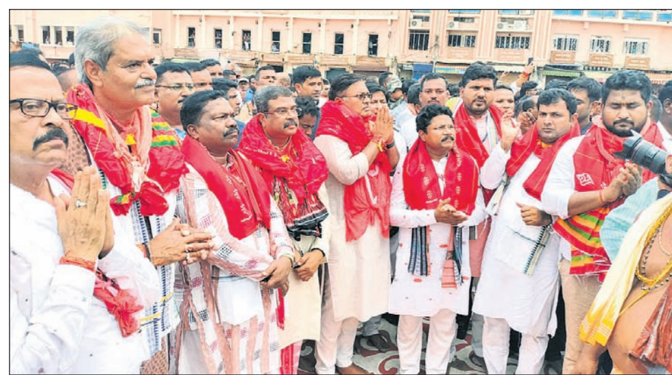
ପୁରୀରେ ବିନିମୟ ସମ୍ପର୍କରେ ଘୋଷଣାତ୍ରା ପାଇଁ ଘୋଷଣା ପାଳନ କରାଯାଇଛି।