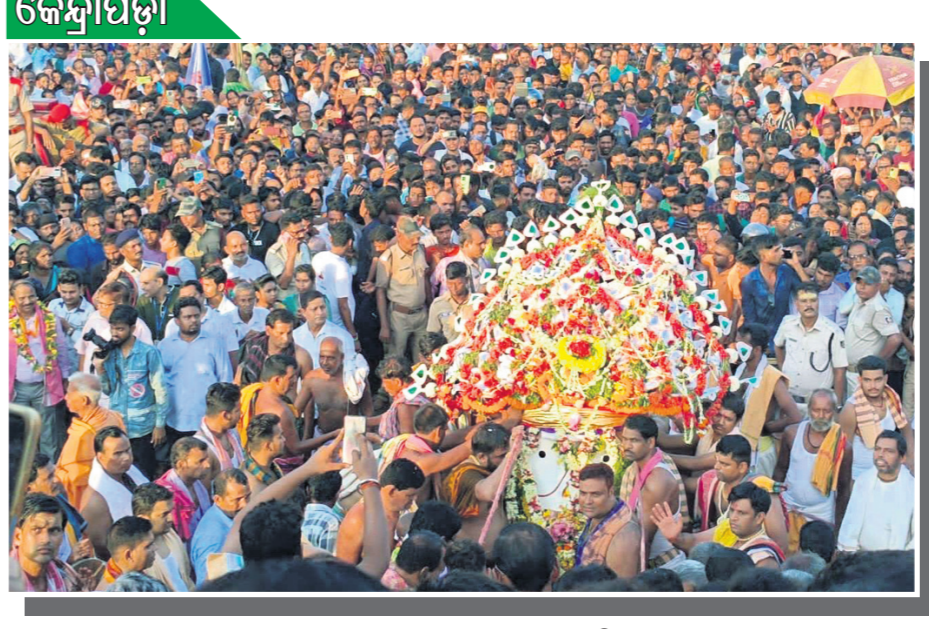
ଘୋଷଣାତ୍ରା ପାଇଁ ଘୋଷଣା ପାଳନ କରାଯାଇଛି।