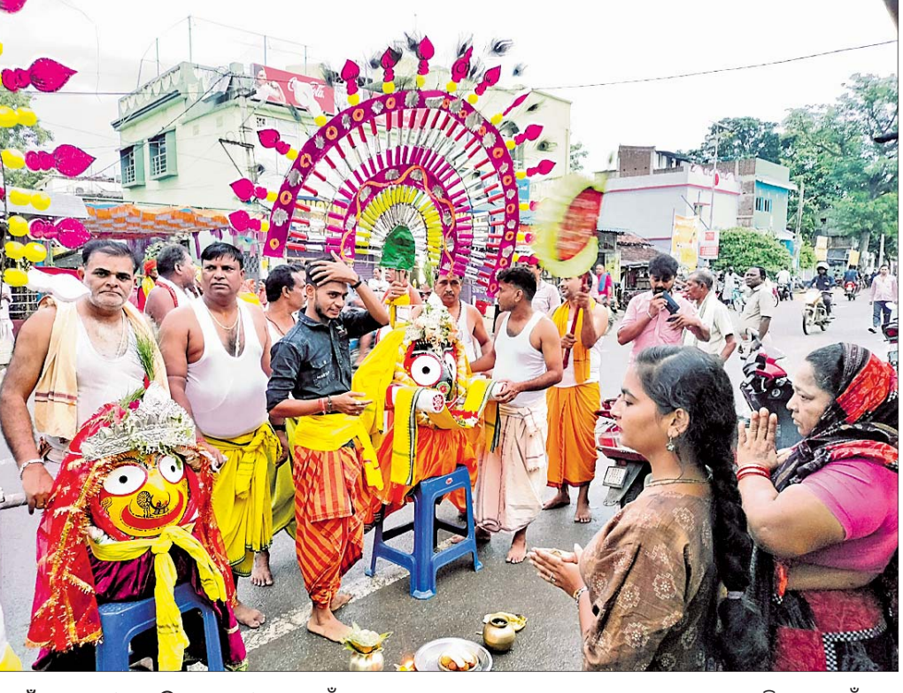
ବାଉଁଶୁଣୀ, ୭୭ (ବେଦାଶିଷ ନେପାଳ)

ବରଗଡ଼ ଜିଲ୍ଲା ବାଉଁଶୁଣୀ ଛକ ସମେତ ଆଖପାଖ ବିଭିନ୍ନ ଗ୍ରାମରେ ବିରାଜିତ ଶ୍ରୀଜଗନ୍ନାଥ ମହାପ୍ରଭୁଙ୍କ ରଥଯାତ୍ରା ପାଳିତ ହୋଇଯାଇଛି। ଅପରାହ୍ନରେ ଆନ ଅଞ୍ଚଳର ଗଡ଼ଜାତର, ବାଉଁଶୁଣୀ, ବହିରା, ବରାହପଥର, ବନପାଳି, ପଲସପାଟ, ଗୁଲୁଣିଆ ସମେତ ପଡ଼ୋଶୀ ଛେରା ପହରା କରିଥିଲେ। ରଥଯାତ୍ରା ଦେଖିବା ପାଇଁ ବହୁ ଶ୍ରଦ୍ଧାଳୁଙ୍କ ସମାଗମ ହୋଇଥିଲା। ସେହିପରି ବାଉଁଶୁଣୀ