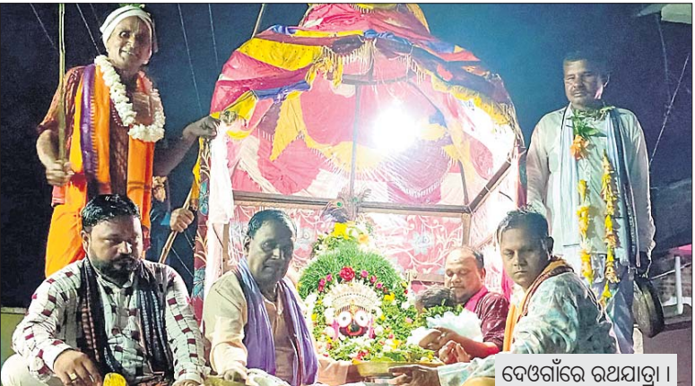
ଦେଓଗାଁରେ ରଥଯାତ୍ରା ।