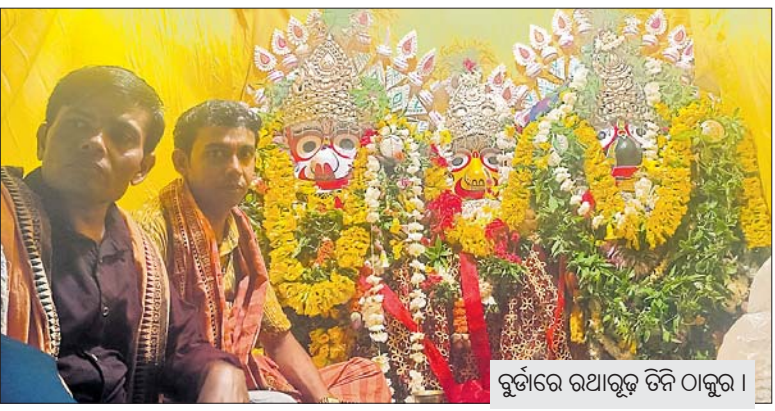
ଦୁର୍ଗାରେ ରଥାବୃତ୍ତ ତିନି ଠାକୁର ।