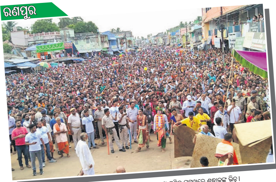
ଘୋଷଣାତ୍ରା ପାଇଁ ଘୋଷଣା ପାଳନ କରାଯାଇଛି।