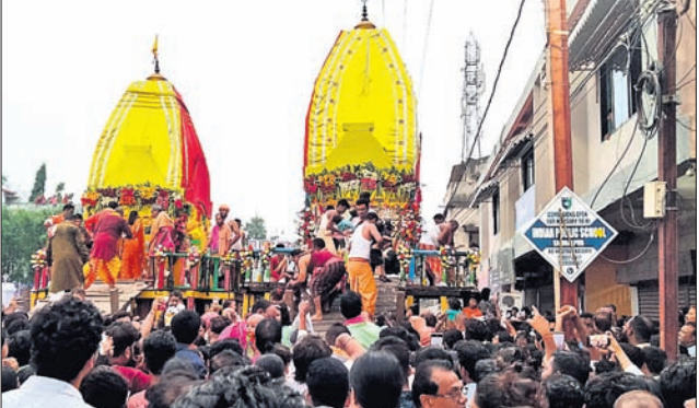
ସୁନ୍ଦରଗଡ଼ରେ ଭକ୍ତଙ୍କ ମେଳରେ ଦୁଇ ରଥ ।