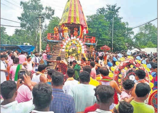
ବଣାଇଁରେ ଠାକୁରଙ୍କୁ ପହଞ୍ଚି କରି ରଥକୁ ନିଆଯାଉଛି ।