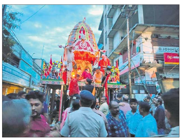
ଗୋପାଳଜୀ ମନ୍ଦିର ରଥକୁ ଭକ୍ତମାନେ ଚାଣି କରି ନେଉଛନ୍ତି । ସହରର ଅନ୍ୟତମ ଲୋକପ୍ରିୟ ରଥ ସାହାଣୀ ରଥ, ଜଗନ୍ନାଥପଡ଼ାର ରଥ, ଚିତ୍ରାପଡ଼ା ଗାନ୍ଧୀ ମନ୍ଦିର ରଥ, ଶୈଳଶ୍ରୀ ପେଲେସରୁ ବାହାରିଥିବା ରଥ, ପ୍ରତାପ ସାଗରପଡ଼ା, ଚିତ୍ରାପଡ଼ା ରଥ ଓ