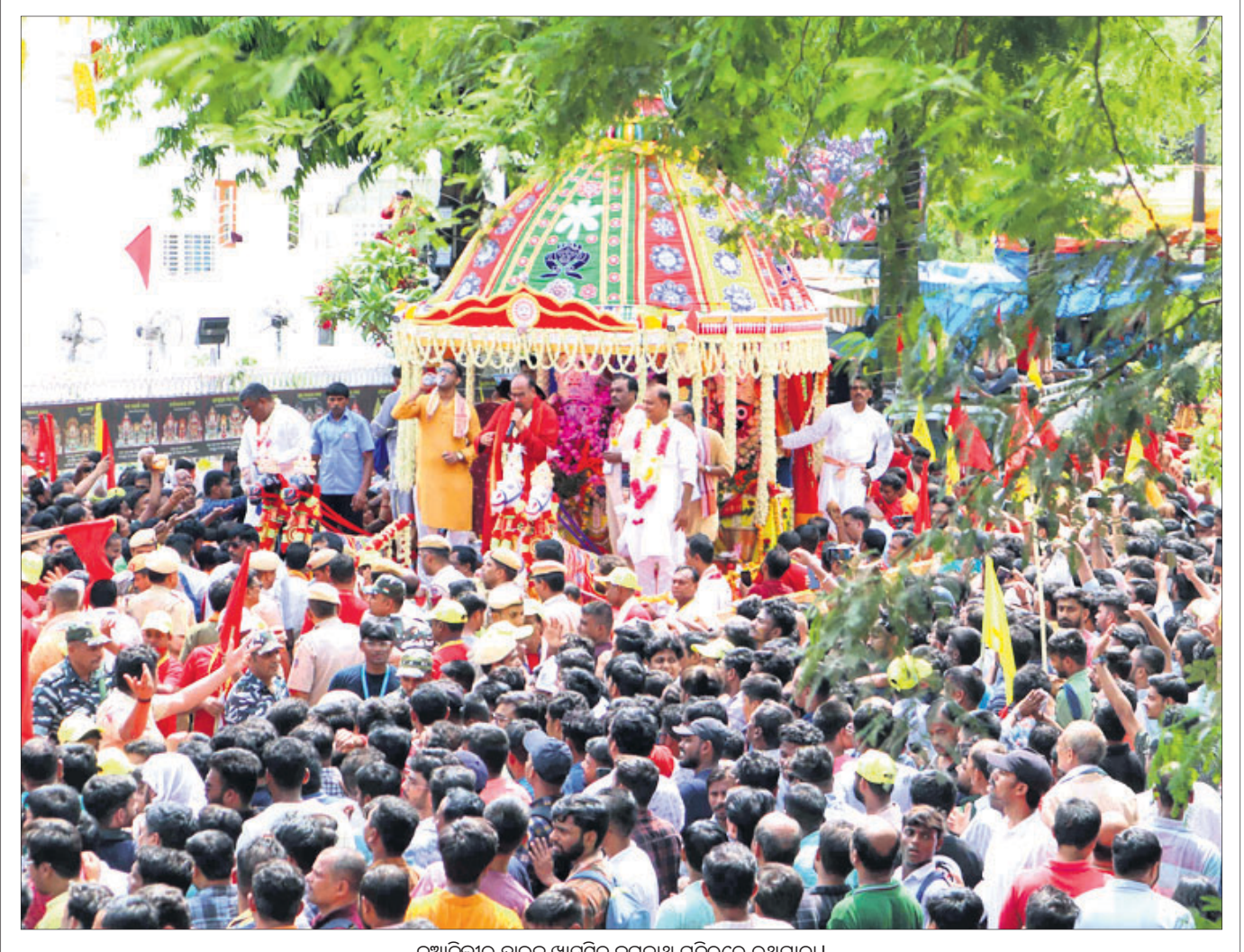
ନୂଆଦିଲ୍ଲୀର ହାଇଦ୍ରାବାଦ୍ କରନାଥ ମନ୍ଦିରରେ ରଥଯାତ୍ରା।