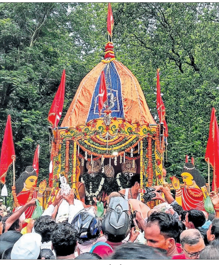
ରାଜଗାଙ୍ଗପୁରରେ ରଥରେ ଚତୁର୍ଦ୍ଧାମୂର୍ତ୍ତି ।