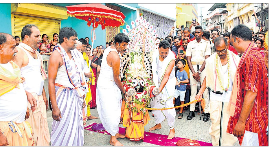
ରବିବାର ସେବାୟତ ଓ ଭକ୍ତମାନେ ସମ୍ବଲପୁର ଝାଡୁଆପଡ଼ାରେ ବ୍ରହ୍ମପୁରା(ଜଗନ୍ନାଥ) ଠାକୁରଙ୍କ ପହଞ୍ଚି ବିକେ ନୀତି କରୁଛନ୍ତି।

ସମ୍ବଲପୁର ସରକାରୀ ମହିଳା ମହାବିଦ୍ୟାଳୟରେ ସପ୍ତାହବ୍ୟାପୀ ବନ ମହୋତ୍ସବ ପାଳିତ ହୋଇଯାଇଛି। ଏହି ପରିବେଶରେ ମହାବିଦ୍ୟାଳୟ ପରିସରରେ ଆୟୋଜିତ କାର୍ଯ୍ୟକ୍ରମରେ ବନ ବିଭାଗ, ଶ୍ରୀସତ୍ୟସାଧ ସେବା ସଙ୍ଗଠନ ସମ୍ବଲପୁରର ମିଳିତ ସହଯୋଗରେ ଚାରୋପଣ ସହିତ ବିହନ ଗୋଳା ତିଆରି ଅଭିଯାନ ଅନୁଷ୍ଠିତ ହୋଇଥିଲା। ମହାବିଦ୍ୟାଳୟ ଅଧ୍ୟକ୍ଷ ଆଲୋଚନାଚକ୍ର ଓ ପ୍ରତିଯୋଗିତା ଆୟୋଜନ କରାଯିବ ବୋଲି ଅନୁଷ୍ଠାନ ପକ୍ଷରୁ ସୂଚନା ଦିଆଯାଇଛି।