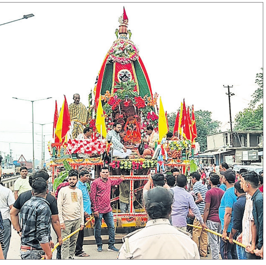
କୁତ୍ରାରେ ଶ୍ରୀକାନ୍ତମାନେ ରଥକୁ ଚାଣୁଛନ୍ତି ।