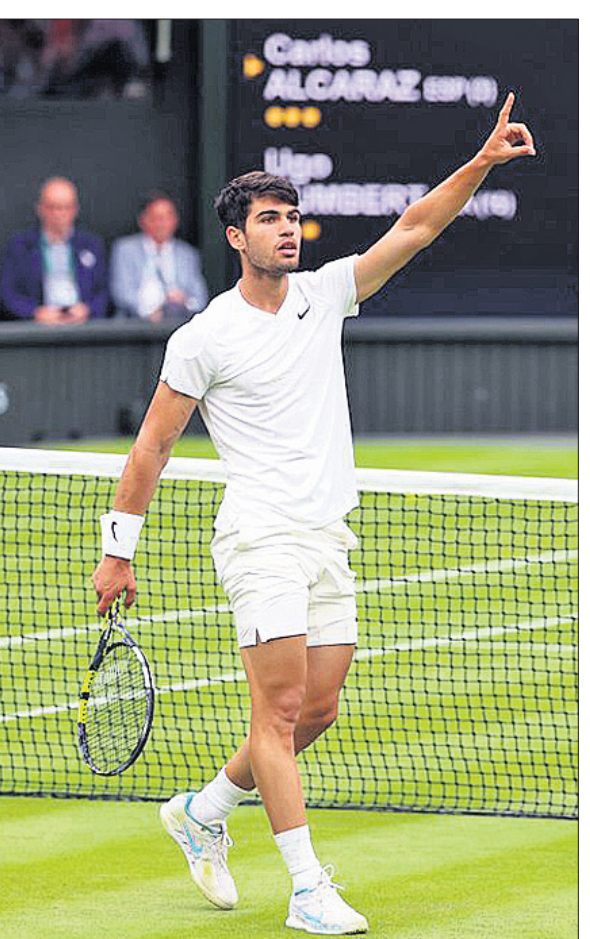
ମ୍ୟାଚ ଜିତିବାପରେ କାର୍ଲୋସ୍ ଅଲକାରାଜ।

ବ୍ରେକ କରିବା ସହିତ ଅଲକାରାଜ ମ୍ୟାଚ୍ ଟାଇଟ୍‌ରେକ୍ଟକୁ ଯିବାର ଆଶଙ୍କା ରହିଥିଲେ ମଧ୍ୟ ଅଲକାରାଜ ସହଜ ବିଜୟ ସହ କ୍ୱାର୍ଟର ଫାଇନାଲରେ ପ୍ରବେଶ କରିଥିଲେ। ଏହା ସହ କ୍ରମାଗତ ଦ୍ୱିତୀୟ ବର୍ଷରେ ଅଲକାରାଜ କ୍ୱାର୍ଟର ଫାଇନାଲରେ ପ୍ରବେଶ କରିଛନ୍ତି। ମହିଳା ସିଙ୍ଗଲ୍ସରେ ଇଟାଲୀର ଜର୍ଜିନି ପାଓଲିନି ପ୍ରଥମ ଥର ପାଇଁ