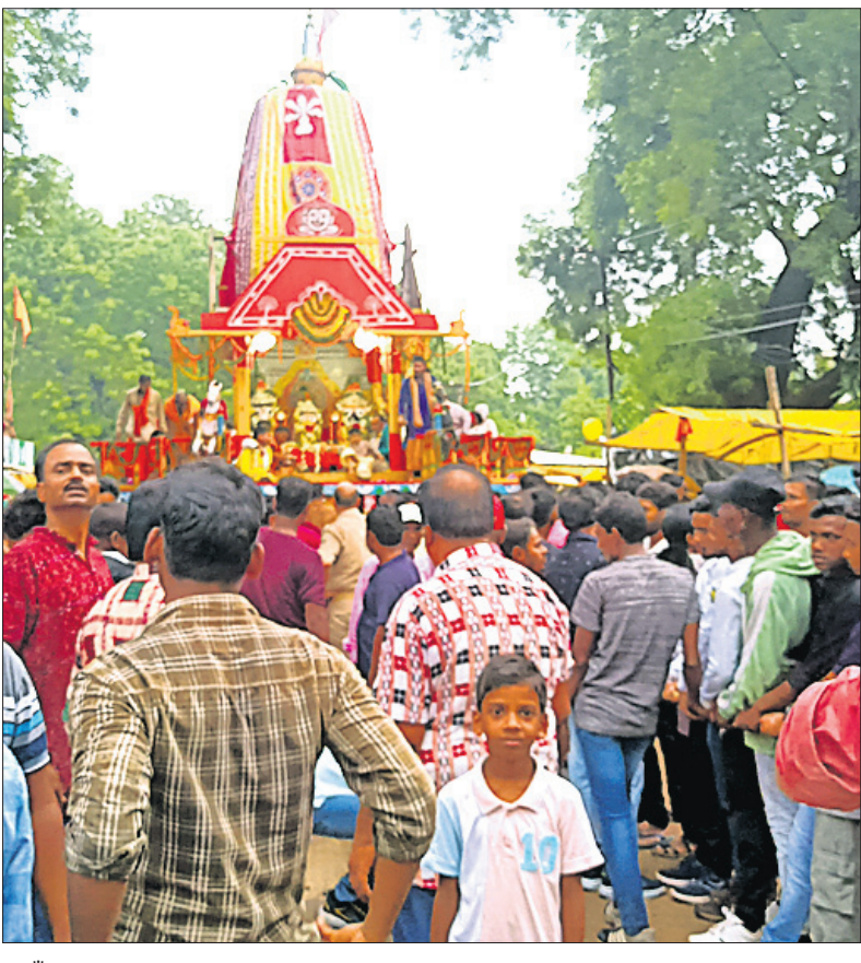
କୁଆଁରପୁଣ୍ଡା: ରଥାଭୁଡ଼ ଶ୍ରୀଜୀଉ ।