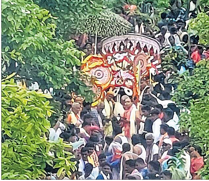
ଝଟିଆ ପାହାଡ଼ରୁ ମହାପ୍ରଭୁଙ୍କୁ ଧାଡ଼ି ପହଞ୍ଚି କରି ଅଣାଯାଉଛି। ଖେଚୁଡ଼ି ଭୋଗ, ମହାପ୍ରଭୁଙ୍କ ବେଶ ଓ ରଥ ପ୍ରତିଷ୍ଠା ପରେ ତିନି ଠାକୁରଙ୍କୁ ଧାଡ଼ି ପହଞ୍ଚି କରାଯାଇଥିଲା। ଝଟିଆ ପାହାଡ଼ ଶିଖରରୁ ମହାପ୍ରଭୁଙ୍କୁ ଧାଡ଼ି ପହଞ୍ଚି

ଘୋଷପୁର/ଭଲୁଣ୍ଡା, ୭୭ (ମୁଖ୍ୟାଞ୍ଚଳ ଶତପଥୀ/ଭଲୁଣ୍ଡା ପାଣ୍ଡିଆ)