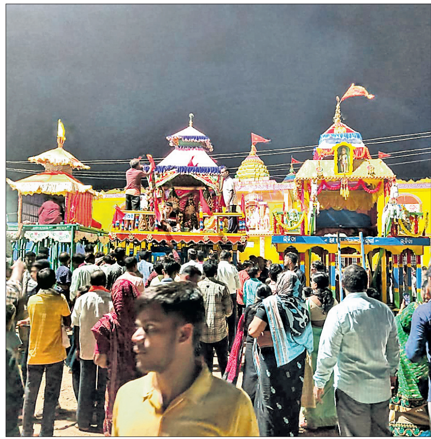
ବରଗଡ଼ ଜିଲାର ବିଭିନ୍ନ ସ୍ଥାନରେ ରଥଯାତ୍ରାର ଦୃଶ୍ୟ: ଭବଳି ରଥଯାତ୍ରା