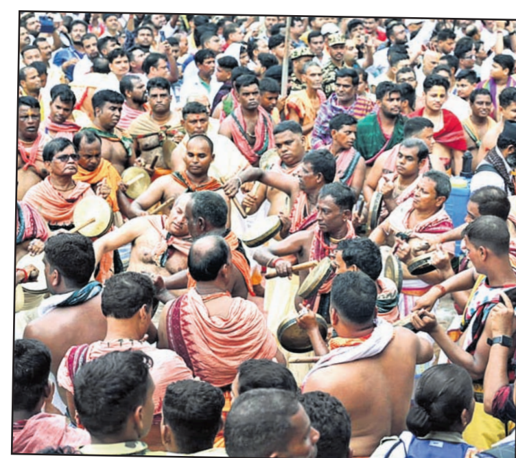
ପୁରୀରେ ଘୋଷଣାତ୍ରା ପାଇଁ ଘୋଷଣା ପାଳନ କରାଯାଇଛି।