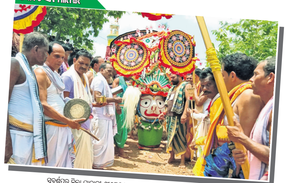
ଘୋଷଣାତ୍ରା ପାଇଁ ଘୋଷଣା ପାଳନ କରାଯାଇଛି।