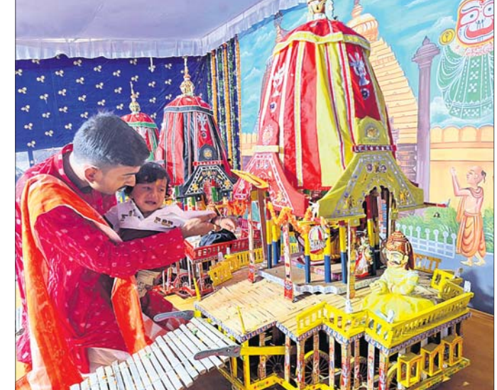
ଶୁଭମ୍ କଲୋନାଠାରେ ପୂରୀ ରଥ ସଦୃଶ ରଥ ନିର୍ମାଣ କରାଯାଇ ଠାକୁରଙ୍କୁ ରଥାରୁଡ଼ି କରାଯାଇଛି।