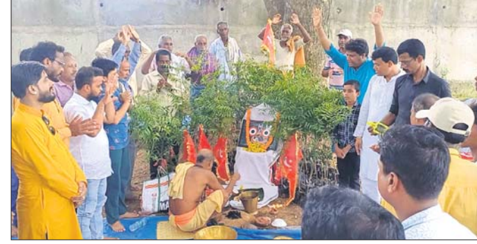
ସଚେତନ ନାଗରିକ ମଞ୍ଚ ପକ୍ଷରୁ ଦାରୁ ବଗିଚା ପୂଜାର୍ଚ୍ଚନା କରାଯାଇଛି ।