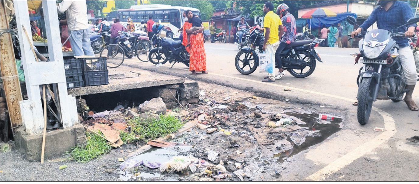
ଲେମ୍ବୁ ଛକ ରାସ୍ତା କାଦୁଅ ହୋଇଥିବାବେଳେ ଡ୍ରେନକାର୍ଯ୍ୟ ସମ୍ପୂର୍ଣ୍ଣ ହୋଇ ନାହିଁ ।

ନୟାଗଡ଼, ୮୭ (ଲୋକନାଥ ମିଶ୍ର) ନୟାଗଡ଼ ଜିଲ୍ଲା ସଦର ମହକୁମାର ଗୋଲେଇ ଗ୍ରାମିକ ଛକ ପାଖ ଲେମ୍ବୁ ଛକ ବର୍ଷା ହେଲେ କାଦୁଅ ପତପତ ହୋଇ ରହୁଛି । କଳାଙ୍ଗୀ-ଖୋର୍ଦ୍ଧା ୫୭ ନଂ. ଜାତୀୟ ରାଜପଥର ଡ୍ରେନେଜ କଳ ଲେମ୍ବୁ ଛକରେ ଲାହୁଡ଼ି ମାରି ୨୧ ନଂ. ରାଜ୍ୟ ରାଜପଥ ନୟାଗଡ଼-ଭଞ୍ଜନଗର ରାସ୍ତା ଓ ୫୭ ନଂ. ଜାତୀୟ ରାଜପଥକୁ କାଦୁଅ ଓ ଅପରିଷ୍କାର କରୁଛି । ନୟାଗଡ଼ ଜିଲ୍ଲାପାଳଙ୍କ କାର୍ଯ୍ୟାଳୟ ସମ୍ମୁଖ ଦାସିଆ ଥଳା ପ୍ରତିମୂର୍ତ୍ତି ନିକଟସ୍ଥ ଅଞ୍ଚଳରୁ ବାହାରିଥିବା ଡ୍ରେନ ଲେମ୍ବୁ ଛକ ନିକଟରେ ଅପୂର୍ଣ୍ଣ ଛକ ହୋଇ ରହିଛି । ନର୍ଦ୍ଦମା କଳ ବିଭିନ୍ନ ସମୟରେ ୫୭ ନଂ. ଜାତୀୟ ରାଜପଥ ଓ ୨୧ ନଂ. ରାଜ୍ୟ ରାଜପଥ ଉପରେ ପ୍ରବାହିତ ହେଉଛି । ସେହିପରି ବର୍ଷା ହେଲେ ବେଶୀ ଅସୁବିଧା ହେଉଛି । ଓଡ଼ିଶା ରାସ୍ତାକୁ ଆସିଥିବା ଡ୍ରେନ ଲେମ୍ବୁ ଛକ ନିକଟରେ ମଧ୍ୟ ଲିକେଜ୍ ହେଉଛି । ଏଣୁ ୨୧ ନଂ. ରାଜ୍ୟ ରାଜପଥ ବି ଅପରିଷ୍କାର ରହୁଛି । ପୂର୍ବ ବିଭାଗ ମଧ୍ୟ ଡ୍ରେନ କାମ ମରାମତି କରୁନି । ଏଣୁ ସହରବାସୀଙ୍କ ସମେତ ପଥଗାରି ହଇରାଣ ହରକତ ହେଉଛି । ଡ୍ରେନ କାମ ମରାମତି ଓ କାମ ସମ୍ପୂର୍ଣ୍ଣ କରିବାକୁ ଦାବି ହେଉଛି ।