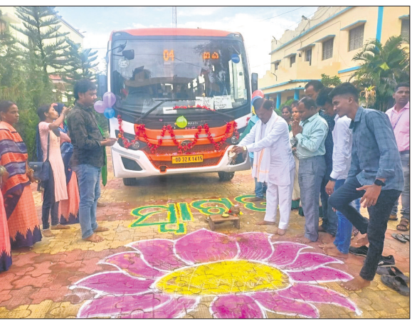
ମୁଖ୍ୟମନ୍ତ୍ରୀ ବସ୍ ସେବା ଶୁଭାରମ୍ଭ କରୁଛନ୍ତି ଗୁରୁପୁର ଜିଲ୍ଲା ଭାଙ୍ଗପା ସଭାପତି।

ରଥଯାତ୍ରା ଉପଲକ୍ଷେ ଗଞ୍ଜାମ ଜିଲ୍ଲା ସାନଖେମୁଣ୍ଡି କୁଳଠାରୁ ଶ୍ରୀଜଗନ୍ନାଥ ଧାମ ଶ୍ରୀକ୍ଷେତ୍ର ପୁରୀକୁ ମୁଖ୍ୟମନ୍ତ୍ରୀ ବସ୍ ସେବାର ଏକ ବସ୍ ଯାତ୍ରା କରିଛି।