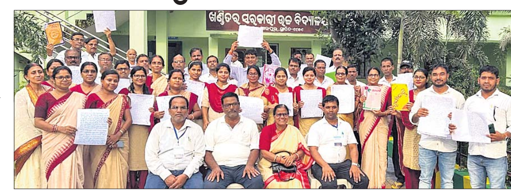
ସାହିତ୍ୟ ସୃଜନୀ ପ୍ରଶିକ୍ଷଣ ଶିବିରରେ ଯୋଗଦେଇଥିବା ଶିକ୍ଷୟିତ୍ରୀ ଶିକ୍ଷକ ବୃନ୍ଦ ।