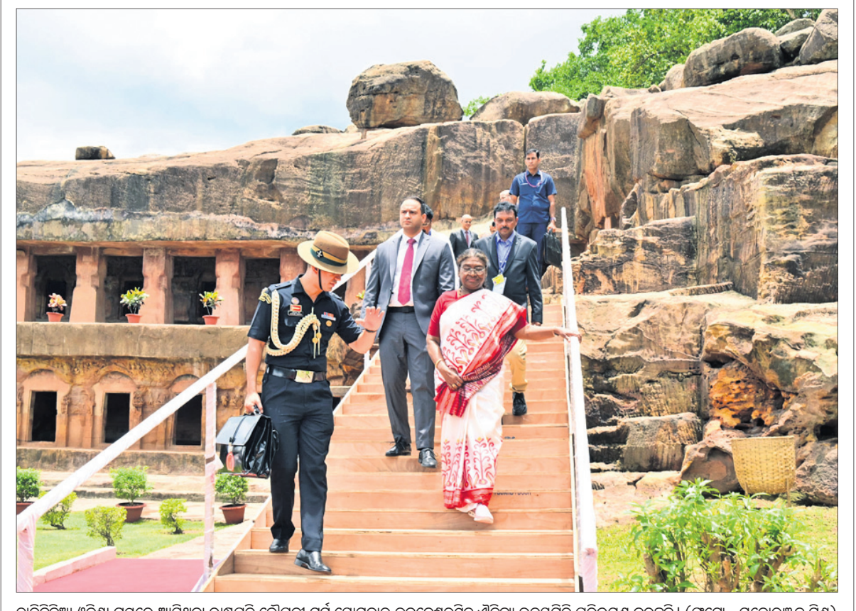
ଚାରିଦିନିଆ ଓଡ଼ିଶା ଗସ୍ତରେ ଆସିଥିବା ରାଷ୍ଟ୍ରପତି ଡ୍ରୌପଦୀ ମୂର୍ଦ୍ଧି ସୋମବାର ଭୁବନେଶ୍ୱରସ୍ଥିତ ଶ୍ରୀରାମ ଉପାସନା ପରିଭ୍ରମଣ କରୁଛନ୍ତି।

ଦୃଷ୍ଟିରେ ରଖି ଜେନେରାଲ, ଡ୍ୱିପର୍ ଏବଂ ଏସ୍‌ଏଲ୍‌ଆର୍ କୋର୍ ପାଇଁ ଅନୁତ ଭାରତ ସିଟିଲ ଉପରେ ରୁଚ୍ଛୁ ଦିଆଯାଇଛି। ନନ୍-ଏସି କୋର୍ରେ ଯାତ୍ରା କରୁଥିବା ଯାତ୍ରୀଙ୍କ ପାଇଁ ପର୍ଯ୍ୟାପ୍ତ ଏବଂ ଉଚ୍ଚତ ସୁବିଧା ପ୍ରଦାନ ଲାଗି ରେଳ ମନ୍ତ୍ରାଳୟ ଯୋଜନା କରୁଥିବା ସୂଚନା ରହିଛି।