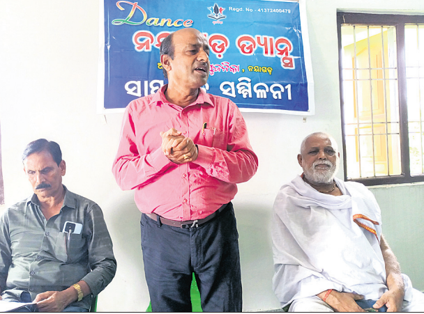
ସୂଚନା ପକ୍ଷରୁ ଖବରଦାତା ସମ୍ମିଳନୀ ସବ୍ୟସାମାନେ ।

ନୂଆଗାଁ ୮୭ (ଧନେଶ୍ୱର ସାହୁ) ନୟାଗଡ଼ ଜିଲ୍ଲା ଭାଷା ସାହିତ୍ୟ ଓ ସଂସ୍କୃତି ପରିଷଦ ସୂଚନା ପକ୍ଷରୁ ତ୍ୟାଗୁ ନୟାଗଡ଼ ତ୍ୟାଗୁ ପ୍ରତିଯୋଗିତା ଆୟୋଜନ କରାଯାଇଛି । ଏଥିପାଇଁ ନୟାଗଡ଼ ଜିଲାର ପ୍ରତିକୂଳ ଅତିସନ ମାଧ୍ୟମରେ ପ୍ରତିଯୋଗୀ ଚୟନ କରାଯାଇଛି । ସେହିକ୍ରମରେ ନୂଆଗାଁ ବ୍ଲକରେ ଚଳିତ ମାସ ୨୧ ତାରିଖ ରବିବାର ସକାଳ ୯ଟାରେ ସ୍ଥାନୀୟ ବିଜୁ ଭବନଠାରେ ଅତିସନ କରାଯିବା ନେଇ ସୂଚନା ପକ୍ଷରୁ ଖବରଦାତା ସମ୍ମିଳନୀ ମାଧ୍ୟମରେ ସୂଚନା ଦିଆଯାଇଛି । ତ୍ୟାଗୁ ନୟାଗଡ଼ ତ୍ୟାଗୁ ପ୍ରତିଯୋଗିତାରେ ୮ ରୁ ୧୮ ବର୍ଷର ପ୍ରତିଯୋଗୀ ଭାଗ ନେଇ ପାରିବେ । ସକାଳ ୯ ଟାକୁ ପ୍ରତିଯୋଗୀମାନଙ୍କ ନାମ ପଞ୍ଜୀକରଣ ଓ ପୂର୍ବାହ୍ନ ୧୦ଟାକୁ ପ୍ରତିଯୋଗିତା ଆରମ୍ଭ କରାଯିବ । ନୂତନ ପରିବେଷଣର ସମୟ ସାମାନ୍ୟ ମନିଷ୍ଟ ରଖାଯାଇଛି । ଏଥିରେ ଦ୍ୱିଅର୍ଥବୋଧକ ଗୀତ ବ୍ୟତୀତ ଅନ୍ୟ ସମସ୍ତ ଗୀତରେ ନୂତନ କରାଯାଇପାରିବ । ଉକ୍ତ ଅତିସନରେ ୫ ଜଣ ପ୍ରତିଯୋଗୀଙ୍କୁ ଚୟନ କରାଯିବ । କୁହୁସ୍ତରୀୟ ଅତିସନରେ ମନୋନୀତ ପ୍ରତିଯୋଗୀ ନୟାଗଡ଼ଠାରେ ଅନୁଷ୍ଠିତ ହେବାକୁଥିବା ଜିଲ୍ଲାସ୍ତରୀୟ ତ୍ୟାଗୁ ନୟାଗଡ଼ ତ୍ୟାଗୁ ପ୍ରତିଯୋଗିତାରେ ଅଂଶଗ୍ରହଣ କରିବେ । ସେଠାରେ ପ୍ରଥମ, ଦ୍ୱିତୀୟ ଓ ୩ୟ ଭାବେ ୩ ଜଣଙ୍କୁ ଚୟନ କରାଯିବ । ପ୍ରଥମ ସ୍ଥାନ ଅଧିକାର କରିଥିବା ପ୍ରତିଯୋଗୀଙ୍କୁ ମାନପତ୍ର ସହ ୧୦ ହଜାର ଦ୍ୱିତୀୟଙ୍କୁ ମାନପତ୍ର ସହ ୫ ହଜାର ଓ ୩ୟ ସ୍ଥାନ ଅଧିକାର କରିଥିବା ପ୍ରତିଯୋଗୀଙ୍କୁ ମାନପତ୍ର ସହ ୩ ହଜାର ଟଙ୍କା ଦେବା ସହ ପ୍ରତିଯୋଗିତାରେ ଅଂଶଗ୍ରହଣ କରିଥିବା ସମସ୍ତ ପ୍ରତିଯୋଗୀଙ୍କୁ ମାନପତ୍ର ଦିଆଯିବ ବୋଲି ସୂଚନା ଦିଆଯାଇଛି । ନୟାଗଡ଼ ଜିଲାର ପିଲାମାନଙ୍କର ନୂତନ ପ୍ରତିଭାକୁ ଲୋକଲୋଚନକୁ ଆଣିବା ପାଇଁ ଏହି ପ୍ରୟାସ କରାଯାଉଥିବା ନେଇ ସୂଚନାଦାତା ସଭାପତି ପ୍ରଧାନା ବୁଦାବନ ମହାପାତ୍ର ସମ୍ମିଳନୀରେ ପ୍ରକାଶ କରିଥିଲେ । ପ୍ରତିସଦର ସଚିବ ନିର୍ମଳ ଚନ୍ଦ୍ର ଶୁରଦେବ ପ୍ରତିଯୋଗିତାରେ ନୀତି ନିୟମ ଉପରେ ଖବରଦାତାମାନଙ୍କୁ ସୂଚନା ଦେଇଥିଲେ । ଶେଷରେ ସାମାଜିକ କର୍ମୀ ଦାମୋଦର ସାହୁ ସମସ୍ତ ଖବରଦାତାମାନଙ୍କୁ ଧନ୍ୟବାଦ ଜଣାଇଥିଲେ ।