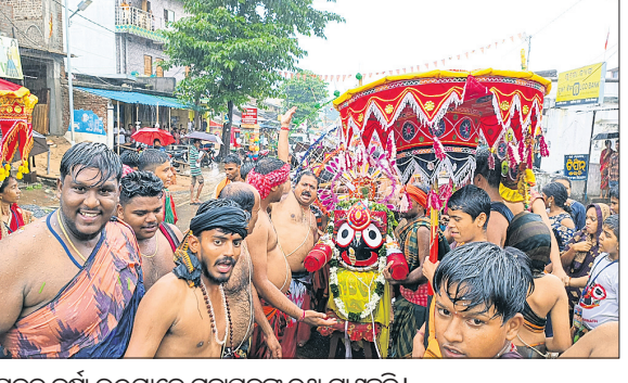
ପ୍ରବଳ ବର୍ଷା ଭଣ୍ଡମାନେ ମହାପ୍ରଭୁଙ୍କୁ ରଥ ଚାଲୁଛନ୍ତି।

କର୍ମକ୍ରମ ସଫଳତାରେ ଉପସ୍ଥିତ ରହି ସମସ୍ତ କାର୍ଯ୍ୟ ପରିଚାଳନାରେ ସହଯୋଗ କରିଥିଲେ। ଶାନ୍ତିରକ୍ଷା ନିୟମାବଳୀ ପାଳନ କରାଯାଇଥିଲା।