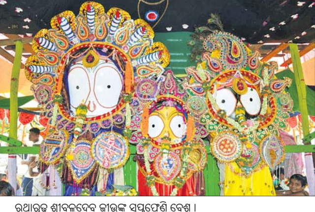
ରଥାକୁଳ ଶ୍ରୀବଳଦେବ କାଉଁଟ ସପ୍ତପେଣି ବେଶ ।

■ ଭୁଜାସାକ୍ଷେତ୍ରରେ ଲକ୍ଷ୍ମୀଧ୍ୱଜ ଶ୍ରୀବାଲୁ ■ ମଙ୍ଗଳବାର ପୂର୍ବାହ୍ନ ୧୧ଟାରେ ରଥଟଣା ହେବ କେନ୍ଦ୍ରାପଡ଼ା, ୮।୭ (ଜଗନ୍ନାଥ ଧଳ)