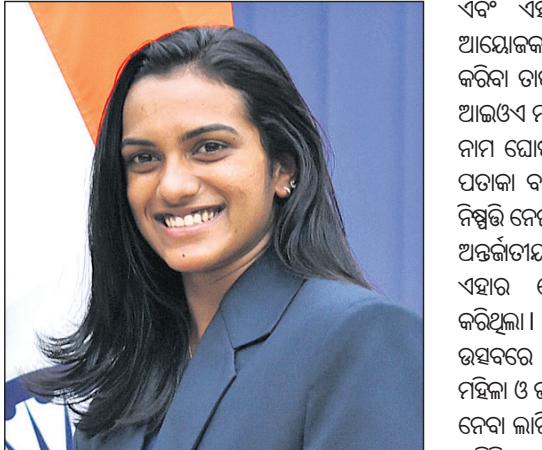
ଗଗନ ନାରଙ୍ଗ (ଆଲମ୍ପିକ୍) ସଭାପତି ପି.ଟି. ଉଷା ଜଗେ ଅଲିମ୍ପିକ୍ ପଦକ ବିଜେତା ମିଥୁନ ବୋଲି ସେ ଚାହୁଁଥିଲେ। ମେରୀ କମ୍ପ୍ୟୁଟର ଉଦ୍‌ଘାଟନା ଉତ୍ସବରେ ଦେଶର ଅଗ୍ରଣୀ ବ୍ୟାଡ୍ମିଣ୍ଟନ ଖେଳାଳି ପି.ଭି. ସିନ୍ଧୁ ମହିଳା ପତାକା ବାହକ ଦାୟିତ୍ୱ ଗ୍ରହଣକରିବେ। ମେରୀ କମ୍ପ୍ୟୁଟର ପରେ ଡେପୁଟି ଚିପ୍ ଡି' ମିଶନ ଥିବା ୪୧ ବର୍ଷୀୟ ନାରଙ୍ଗଙ୍କ ପତାକା ଶାଢ଼ୀବଦ୍ଧି ବୋଲି ଭାରତୀୟ ଅଲିମ୍ପିକ୍ ଆୟୋଜିଟର