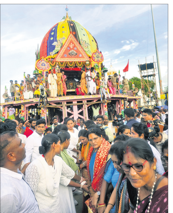
ମହିଳାମାନଙ୍କ ସହ ଉପମୁଖ୍ୟମନ୍ତ୍ରୀ ପ୍ରଭାତୀ ପରିଡ଼ା ସୁଭଦ୍ରାଙ୍କ ରଥ ଚାଣିଛନ୍ତି।

ସୁଭଦ୍ରାଙ୍କ ରଥ ଚାଣିଲେ ଉପମୁଖ୍ୟମନ୍ତ୍ରୀ ପ୍ରଭାତୀ ପରିଡ଼ା ସୁଭଦ୍ରାଙ୍କ ରଥ ଚାଣିଛନ୍ତି। ଚାରିଦିନିଆ ଓଡ଼ିଶା ଗସ୍ତରେ ଆସିଥିବା ରାଷ୍ଟ୍ରପତି ଡ୍ରୌପଦୀ ମୂର୍ଦ୍ଧି ସୋମବାର ଭୁବନେଶ୍ୱରସ୍ଥିତ ଶ୍ରୀରାମ ଉପାସନା ପରିଭ୍ରମଣ କରୁଛନ୍ତି।