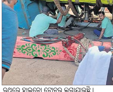
ରଥରେ ହାଜଡ଼ୋ ଟ୍ରୋଟର ଲଗାଯାଉଛି ।

■ ଭୁଜାସାକ୍ଷେତ୍ରରେ ଲକ୍ଷ୍ମୀଧ୍ୱଜ ଶ୍ରୀବାଲୁ ■ ମଙ୍ଗଳବାର ପୂର୍ବାହ୍ନ ୧୧ଟାରେ ରଥଟଣା ହେବ କେନ୍ଦ୍ରାପଡ଼ା, ୮।୭ (ଜଗନ୍ନାଥ ଧଳ)