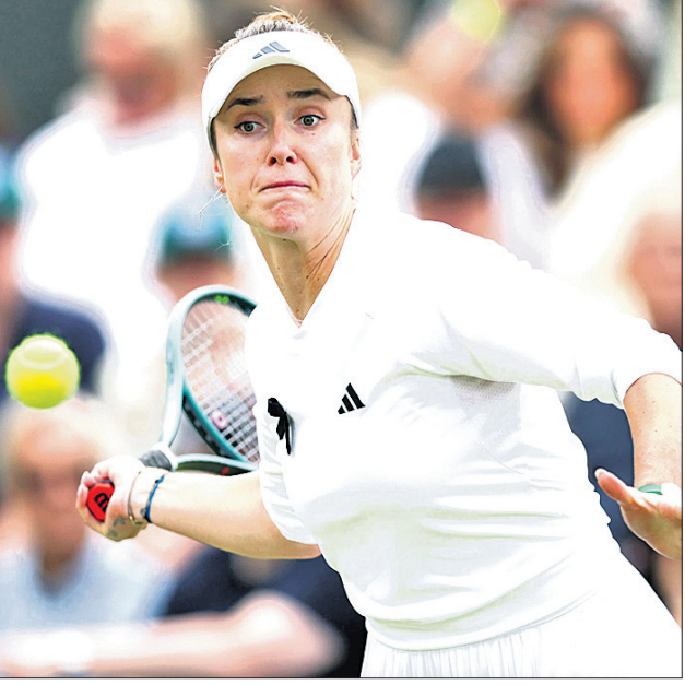
ଫ୍ରେଲଡର୍ ଓପନ ଗ୍ରାଣ୍ଡସ୍ଲାମ ମହିଳା ସିଙ୍ଗଲ୍ସ ରାଉଣ୍ଡ ଅଫ୍-୧୬ ମ୍ୟାଚ୍ ଅବସରରେ ଏମ୍ମା ନାଭାରୋ ଓ ଏଲିନା ସ୍ୱିଡୋଲିନା।