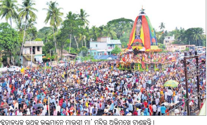
ବ୍ରହ୍ମତାଳଧ୍ୱଜ ରଥକୁ ଭକ୍ତମାନେ ମାଉସୀ ମା' ମନ୍ଦିର ଅଭିମୁଖେ ଚାଣୁଛନ୍ତି ।