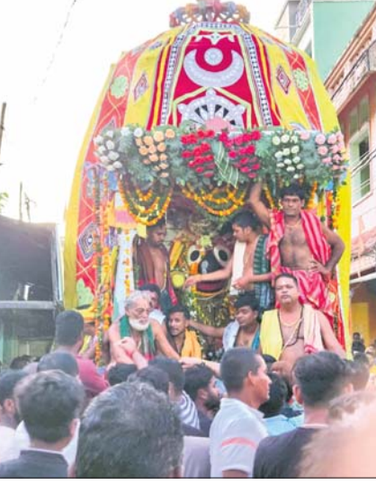
ଯାଜପୁର ମାଉସୀ ମା' ମନ୍ଦିର ସମ୍ମୁଖରେ ଚିନି ରଥ ।