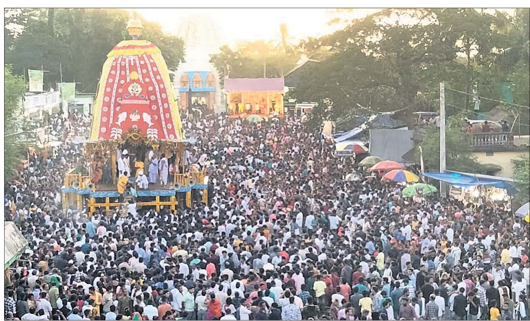
ଗଡ଼କୁଜଙ୍ଗ ସୁଭଦ୍ରାକ୍ଷେତ୍ରରେ କୁଞ୍ଜବିହାରୀଙ୍କ ରଥକୁ ଶ୍ରୀବାଲୁମାନେ ଚାଣି ନେଉଛନ୍ତି ।