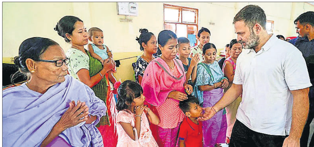
ରାହୁଲ ଗାନ୍ଧୀ ମଣିପୁରର ଜିରିବାମ୍ ଜିଲାର ଏକ ରିଲିଫ୍ କ୍ୟାମ୍ପରେ ହିଂସା ଯତ୍ନକୁ ଭେଟୁଛନ୍ତି।

ଲୋକ ସଭାର ବିରୋଧୀ ଦଳ ନେତା ରାହୁଲ ଗାନ୍ଧୀ ଯୋମବାର ହିଂସା ଯତ୍ନକୁ ମଣିପୁରର ଜିରିବାମ୍ ଏବଂ ତୁରାଗାନ୍ଦପୁର ଜିଲାକୁ ଯାଇ ରିଲିଫ୍ କ୍ୟାମ୍ପକୁ ପରିଦର୍ଶନ କରିଛନ୍ତି। ଏହି ଅବସରରେ ସେ ରିଲିଫ୍ କ୍ୟାମ୍ପରେ ଅଗ୍ରଣ ନେଇଥିବା ହିଂସା ପ୍ରପାତ୍ତିତମାନଙ୍କ ସହ କଥା ହୋଇଥିଲେ।