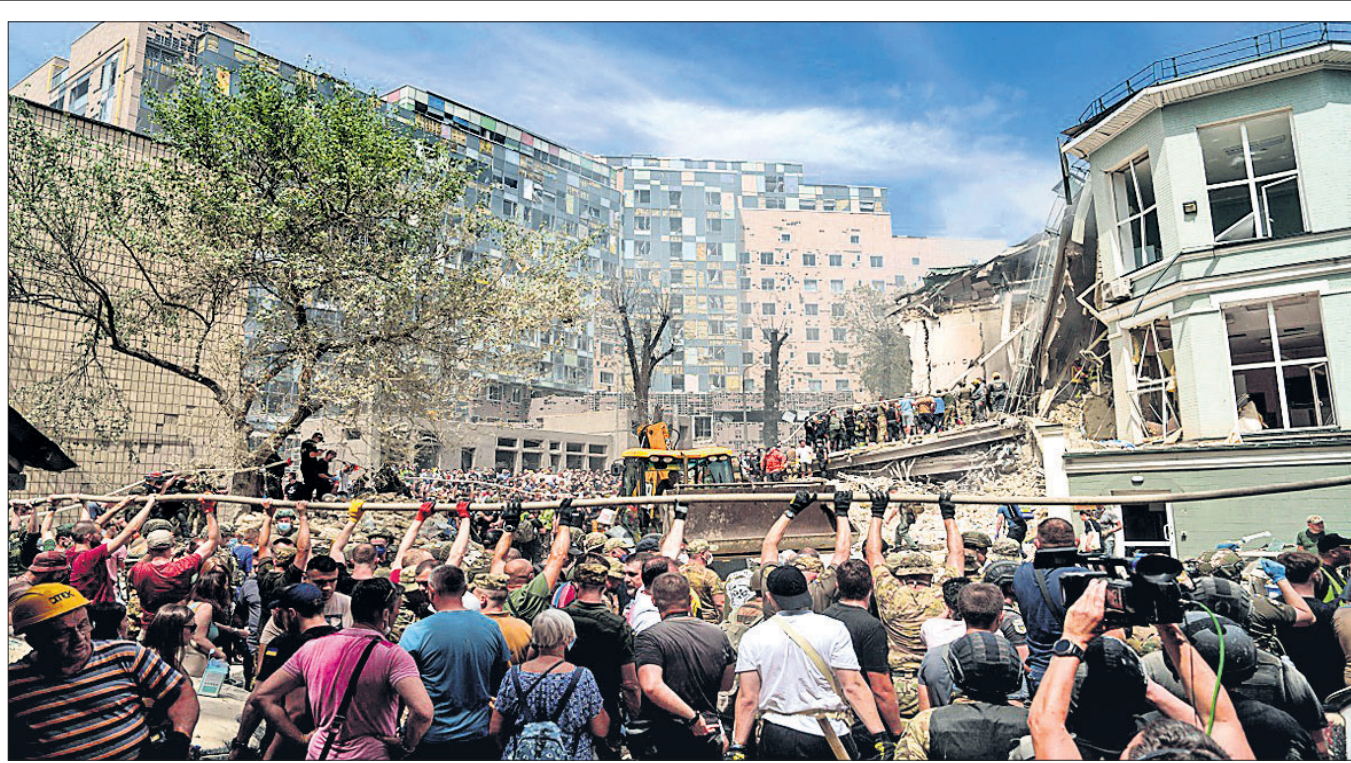
ରୁଷିଆର ମିଶାଲ ମାଡ଼ ପରେ ଯୋମବାର ୟୁକ୍ରେନର ରାଜଧାନୀ କିଭର ଓଖମାତାଲଟ ଶିଶୁ ହସ୍ତଚାଳନାରେ ଉଦ୍ଧାରକାର୍ଯ୍ୟ କରାଯାଇଛି।