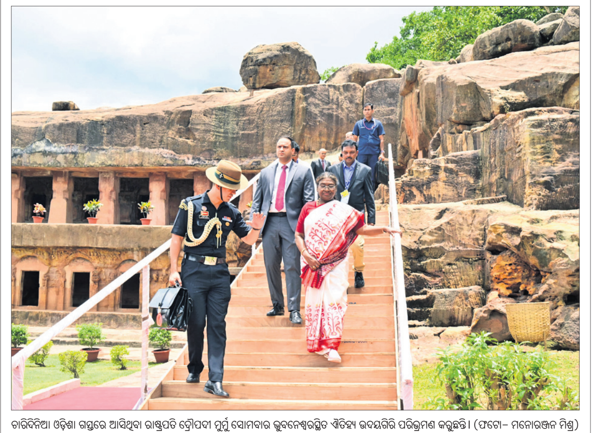
ଗାନ୍ଧିନୀ ଓଡ଼ିଶା ଗସ୍ତରେ ଆସିଥିବା ରାଷ୍ଟ୍ରପତି ଦ୍ରୌପଦୀ ମୂର୍ତ୍ତି ସୋମବାର ଭୁବନେଶ୍ୱରସ୍ଥିତ ଶ୍ରୀକୃଷ୍ଣ ଭବନରେ ପରିଭ୍ରମଣ କରୁଛନ୍ତି।

ଦୁର୍ଘଟରେ ରକ୍ଷା କେନ୍ଦ୍ରରାଲ, ଡ୍ରିପର୍ ଏବଂ ଏସ୍ଏଲଆର୍ କୋର୍ ପାଇଁ ଅନୁତ ଭାରତ ସିଭିଲ ଉପରେ ରୁଜୁ ଦିଆଯାଇଛି। ନନ୍-ଏସି କୋର୍ରେ ଯାତ୍ରୀ କରୁଥିବା ଯାତ୍ରୀଙ୍କ ପାଇଁ ପର୍ଯ୍ୟାପ୍ତ ଏବଂ ଉଚ୍ଚ ଗୁଣ୍ଠିଆ ପ୍ରଦାନ ଲାଗି ରେଳ ମନ୍ତ୍ରାଳୟ ଯୋଜନା କରୁଥିବା ସୂଚନା ରହିଛି।