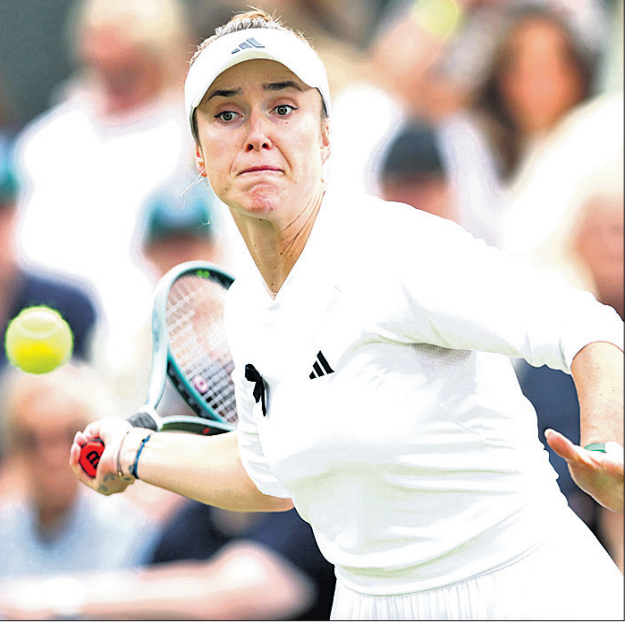
ଫ୍ରେଲଡର୍ ଓପନ ଗ୍ରାଣ୍ଡସ୍ଲାମ ମହିଳା ସିଙ୍ଗଲ୍ ରାଉଣ୍ଡ ଅଫ୍-୧୬ ମ୍ୟାଚ ଅବସରରେ ଏମ୍ମା ନାଭାରୋ ଓ ଏଲିନା ସ୍ୱିଡୋଲିନା।