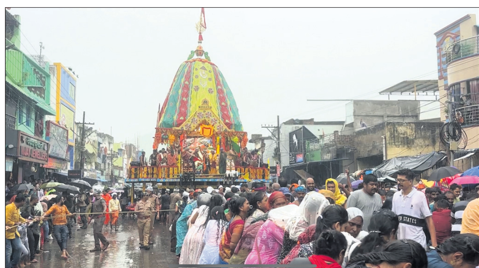
ଶ୍ରଦ୍ଧା ଶ୍ରୀକ୍ଷେତ୍ରରେ ଶ୍ରଦ୍ଧା ବର୍ଷାରେ ରଥ ଗାଣୁଛନ୍ତି ।