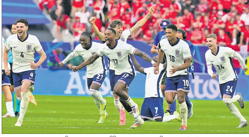
ପେନାଲ୍ଟି ଶୁଟାଉଟରେ ମ୍ୟାଚ ଜିତିବାପରେ ଇଂଲଣ୍ଡ ଖେଳାଳିଙ୍କ ଆନନ୍ଦ ଉଲ୍ଲାସ।

ୟୁରୋ କପ୍ ୨୦୨୪ର ସେମି ଫାଇନାଲ ଲାଇନଅପ୍ ରୂପାନ୍ତ ହୋଇଛି।