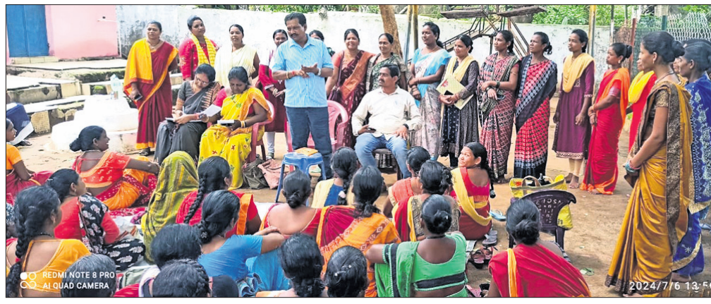
ବୈଠକରେ ବିଏମ୍‌ଏସ୍ କର୍ମକର୍ତ୍ତାଙ୍କ ସହ ଉପସ୍ଥିତ ଅଙ୍ଗନୱାଡି କର୍ମଚାରୀ ।