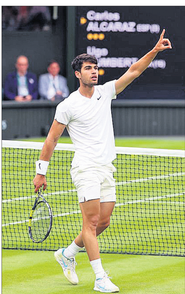
ମ୍ୟାଚ ଜିତିବାପରେ କାର୍ଲୋସ୍ ଅଲକାରାଜ।

ବ୍ରେକ କରିବା ସହିତ ଅଲକାରାଜ ମ୍ୟାଚ୍‌କୁ ଫେରିଥିଲେ। ମ୍ୟାଚ୍ ଟାଇମ୍‌ରେ କିଏ ଯିବାର ଆଶଙ୍କା ରହିଥିଲେ ମଧ୍ୟ ଅଲକାରାଜ ସହଜ ବିଜୟ ସହ କ୍ୱାର୍ଟର ଫାଇନାଲରେ ପ୍ରବେଶ କରିଥିଲେ। ଏହା ସହ କ୍ରମାଗତ ଦ୍ୱିତୀୟ ବର୍ଷରେ ଅଲକାରାଜ କ୍ୱାର୍ଟର ଫାଇନାଲରେ ପ୍ରବେଶ କରିଛନ୍ତି। ମହିଳା ସିଙ୍ଗଲ୍‌ରେ ଜଗଲାର ଜୟମିନ ପାଠଲିନି ପ୍ରଥମ ଥର ପାଇଁ