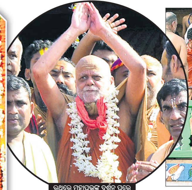
ଉତ୍ସବ ମହାପ୍ରଭୁଙ୍କ ଦର୍ଶନ ପରେ ଶଙ୍କରାଚାର୍ଯ୍ୟ ନିର୍ଦ୍ଦେଶନା ଦେଖାଯାଇଛି।