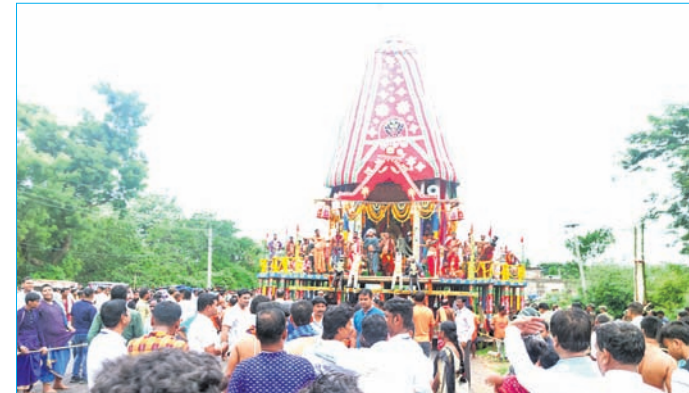
ଗୁଣ୍ଡିଚା ମନ୍ଦିରରେ ବଡ଼ ରଥକୁ ଭକ୍ତମାନେ ଚାଣି ନେଉଛନ୍ତି ।