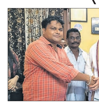
ଏମ୍ପି ସପ୍ତଗିରିକୁ ଶୁଭେଚ୍ଛା ଜଣାଇଛନ୍ତି ପ୍ରତିନିଧି ଦଳ ।

ରାୟଗଡ଼ା ଜିଲ୍ଲା ବିଷମକଟକ ବ୍ଲକର ଏମ୍ପି ପ୍ରତିନିଧି ଦଳ ବ୍ରିଟାନ୍ ଥର ନିର୍ବାଚିତ ହୋଇଥିବା କୋରାପୁଟ ଏମ୍ପି ସପ୍ତଗିରି ଉତ୍ତମାଙ୍କୁ ରବିବାର ଚାଳ ବାସଭବନରେ ଭେଟି ଶୁଭେଚ୍ଛା ଜଣାଇଛନ୍ତି । ଏହି ପରିପ୍ରେକ୍ଷାରେ କଂଗ୍ରେସ ଦଳ ଆହୁରି କିପରି ମଜବୁତ ହେବ, ସେ ସମ୍ପର୍କରେ ସପ୍ତଗିରି ସହ ପ୍ରତିନିଧି ଦଳ ଆଲୋଚନା କରିଥିଲେ । ଉତ୍ତମାଙ୍କ ସହ ସାକ୍ଷାତ୍‌କାର ସମୟରେ ଏମ୍ପି