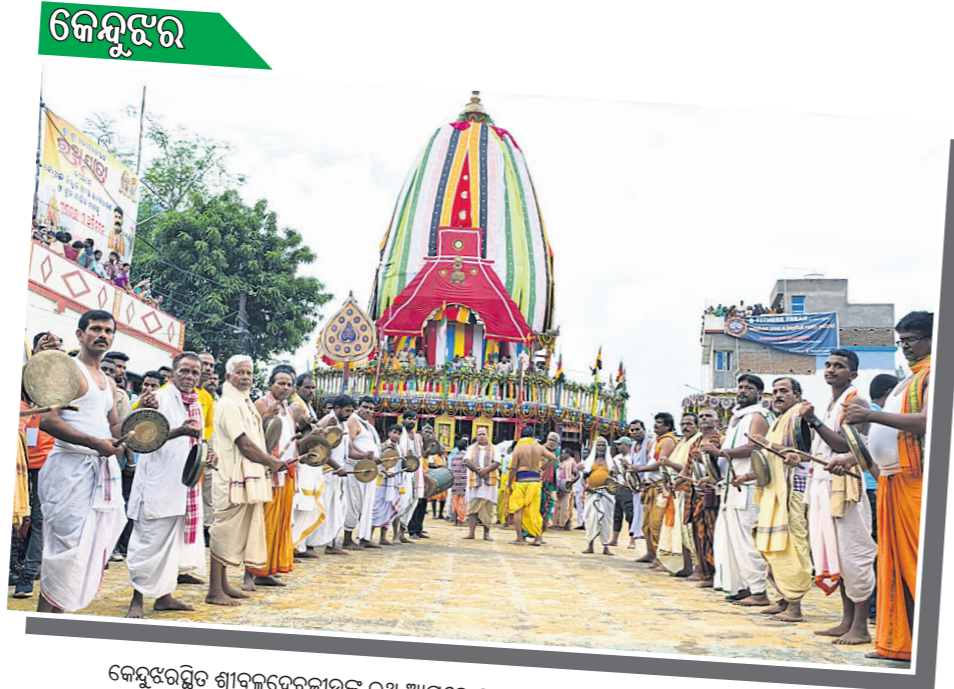
କେନ୍ଦ୍ରଶାସନିତ ଶ୍ରୀକରନେତାଙ୍କ ଉପ ଆସରେ ଘୋଷଣାମାନ ସମାପ୍ତ ପରିବେଷଣ କରାଯାଇଛି।