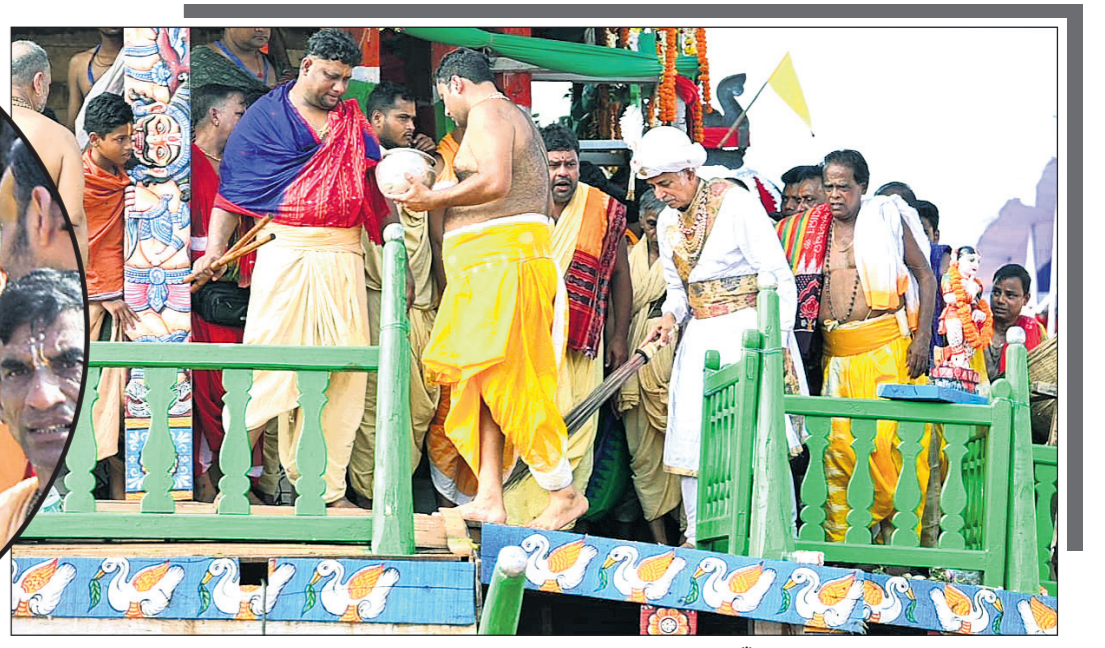
ଗନ୍ଧଧୂଳି ଉତ୍ସବରେ ଉପସ୍ଥିତ ମହାରାଜା ବିଦ୍ୟାଧିପତି ଦେବ ଚରଣପତିଙ୍କ ଦୃଶ୍ୟ।