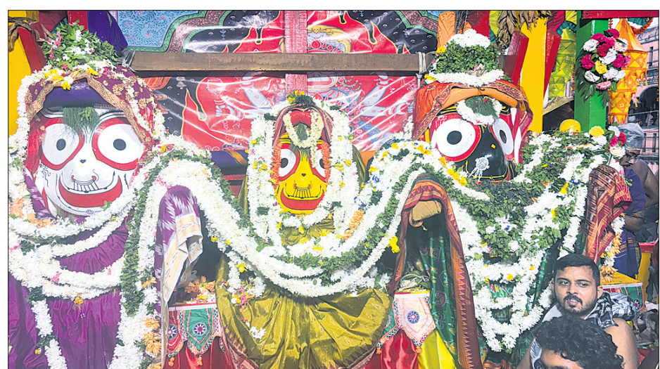
ରାୟଗଡ଼ାରେ ରଥାରୁତ ଚିନିଠାକୁର ।