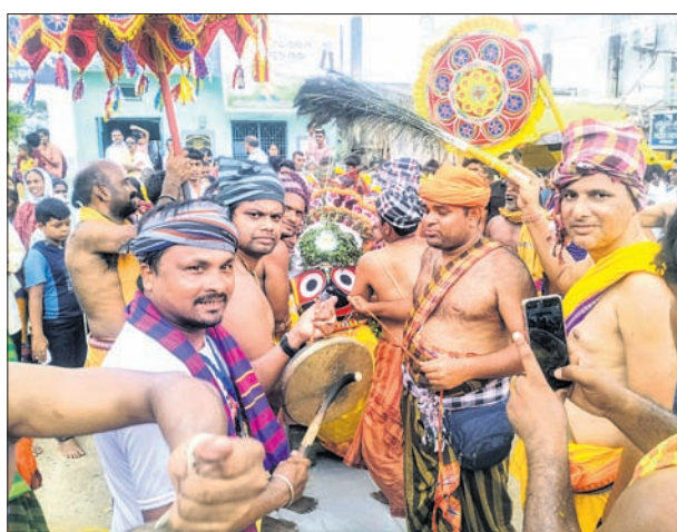
ପୁନିଗୁଡ଼ାରେ ପ୍ରଭୁ ଶ୍ରୀକ୍ଷେତ୍ରର ପହଞ୍ଚି କରି ରଥକୁ ନିଆଯାଉଛି ।