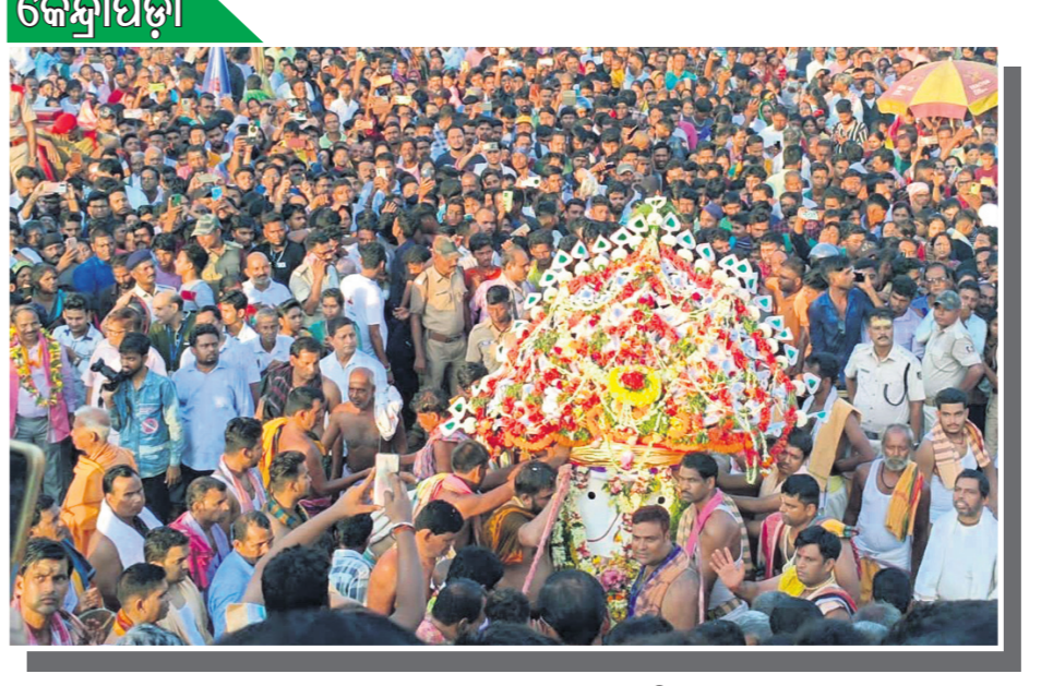
କେନ୍ଦ୍ରାପଡ଼ା ପ୍ରକୃତ ଗନ୍ଧଧୂଳି ଉତ୍ସବର ଦାସଙ୍କ ଦୃଶ୍ୟ।