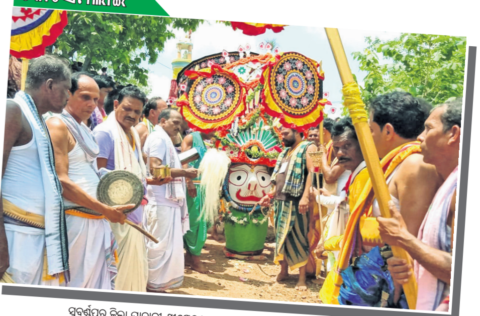
ସୁବର୍ଣ୍ଣପୁର ଜିଲ୍ଲା ପାଟଣା ଶ୍ରୀକରନେତାଙ୍କ ମହାପ୍ରଭୁଙ୍କ ଦର୍ଶନ ପହଣ୍ଡି କରି କରାଯାଇଛି।