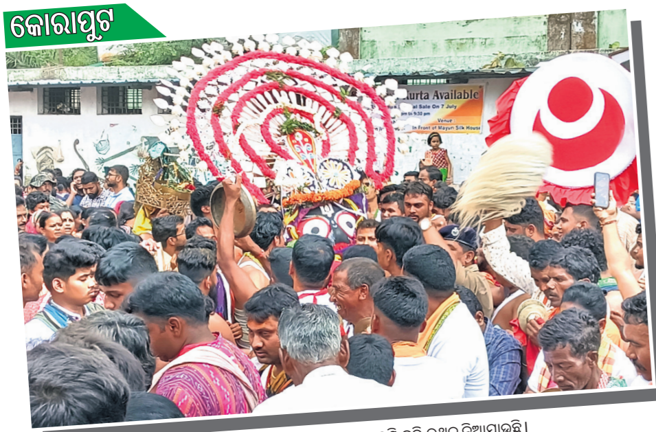
ଘୋଷଣା ପ୍ରସଙ୍ଗରେ ଶ୍ରୀକରନାଥପୁରୀ ପହଣ୍ଡି କରି ଉତ୍ସବ ନିର୍ବାହ କରାଯାଇଛି।