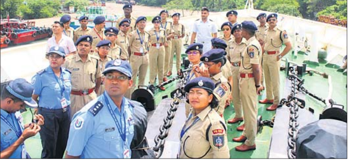
କୋଷ୍ଠଗାର୍ଡ ସୁରକ୍ଷା ପ୍ରଣାଳୀ ଦେଖିଲେ ଆଇପିଏସ୍ ପ୍ରଶିକ୍ଷାର୍ଥୀ ।

ପାରାଦୀପ, ୧୦।୭ (ଶରତ ରାଉତ) ସର୍ଦ୍ଦାର ବଳଭଦ୍ରଙ୍କ ପତ୍ନୀ ଜାତୀୟ ପୋଲିସ୍ ଏକାଡେମୀର ୭୬ ଆଡ଼ମ୍ବର ବ୍ୟବସ୍ଥା ୨୫ଜଣ ଆଇପିଏସ୍ ପ୍ରଶିକ୍ଷାର୍ଥୀମାନଙ୍କ ପାଇଁ ଏକ ପ୍ରଶିକ୍ଷଣ କାର୍ଯ୍ୟକ୍ରମର ଆୟୋଜନ ରୁଧିରୀ ପାରାଦୀପରୁ ତତ୍ତ୍ୱାବଳିକା ମୁଖ୍ୟାଳୟ ନମ୍ବର ୭ରେ ଅନୁଷ୍ଠିତ ହୋଇଥିଲା । ଆଇପିଏସ୍ ପ୍ରଶିକ୍ଷାର୍ଥୀମାନଙ୍କୁ ଭାରତୀୟ ତତ୍ତ୍ୱ ରକ୍ଷକ ଚୁକ୍ରିକା ଓ ସାମୁଦ୍ରିକ ବିଷୟରେ ସଂକ୍ଷିପ୍ତ ସୂଚନା ଦିଆଯାଇଥିଲା । ଭାରତୀୟ ତତ୍ତ୍ୱାବଳିକା ପାରାଦୀପରେ ଥିବା ସାମୁଦ୍ରିକ ଉଦ୍ଭାସ ଉପକେନ୍ଦ୍ର, ସୁନ୍ଦର ସଞ୍ଚାର କେନ୍ଦ୍ର ଓ ସଞ୍ଚାର କକ୍ଷର କାର୍ଯ୍ୟାନୁଷ୍ଠାନ ପ୍ରଣାଳୀ ବିଷୟରେ ଅବଗତ କରାଯିବା ସହ ତତ୍ତ୍ୱ ରକ୍ଷକ କ୍ରମାବଳୀରେ