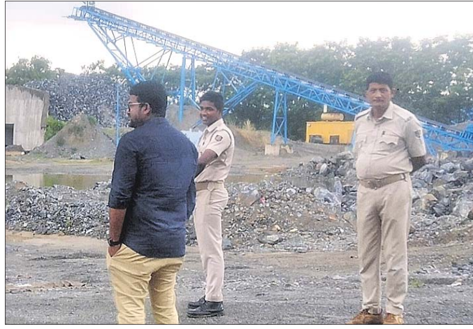
ଏକ କ୍ରଶରରେ ଚଢ଼ାଉ କରାଯାଇଛି ।

ଧର୍ମଶାଳା/ଚଢ଼େଇଧରା, ୧୦।୭ (ବଟକୃଷ୍ଣ ପରିଡ଼ା/ବିକାସ ପରିଡ଼ା):