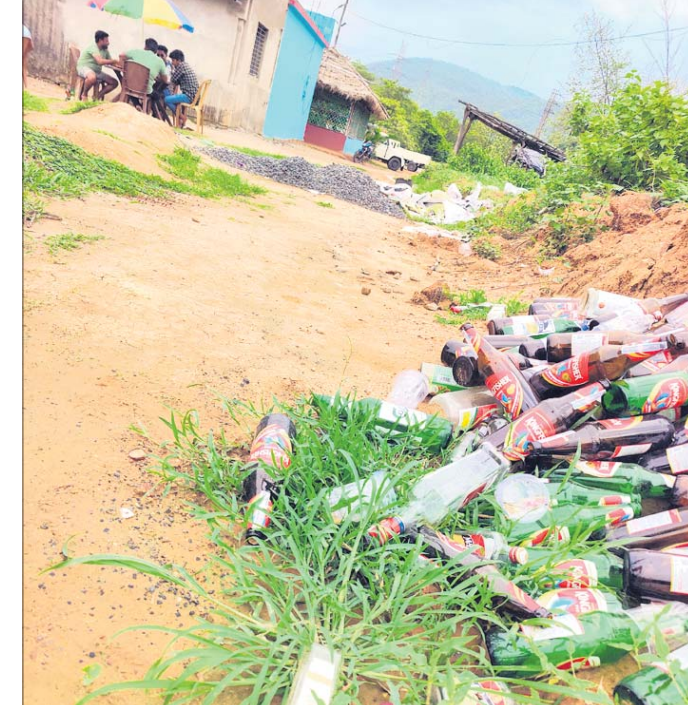
ଏକ ଢାବା ସମ୍ମୁଖରେ ଗଦା ହୋଇଥିବା ମଦ ବୋତଲ ।

ଫଳରେ ସୁପ୍ରିମକୋର୍ଟେ ନିର୍ଦ୍ଦେଶ ଅନୁଯାୟୀ ଦୁର୍ଘଟଣା ନିୟନ୍ତ୍ରଣ ହେବା ପରିବର୍ତ୍ତେ ଆହୁରି ବଢ଼ିବାରେ ଲାଗିଛି । ଜାତୀୟ ରାଜପଥ ପାର୍ଶ୍ୱରେ ଥିବା ଜିଲ୍ଲାଗୁଡ଼ିକରେ ପ୍ରାୟ ୧୦%ରୁ ଉର୍ଦ୍ଧ୍ୱ ଦୁର୍ଘଟଣା ଜନିତ ମୃତ୍ୟୁ ବଢ଼ିବାରେ ଲାଗିଛି । ରାଜ୍ୟରେ ଦୁର୍ଘଟଣାଜନିତ ମୃତ୍ୟୁହାର ହ୍ରାସ କରିବାକୁ ଅନେକ ଯୋଜନା କାର୍ଯ୍ୟକାରୀ ହେଉଛି । ପ୍ରଶାସନ ପକ୍ଷରୁ ନିୟମିତ ମଦଦୋକାନଗୁଡ଼ିକୁ ୫୦୦ ମିଟର ଦୂରକୁ ସ୍ଥାନାନ୍ତର କରାଯାଇଛି । ଏହି କ୍ରମରେ ମଦ ଦୋକାନ ବନ୍ଦ ହୋଇଛି ସତ ହେଲେ ଜାତୀୟ ରାଜପଥ ପାର୍ଶ୍ୱରେ ଥିବା ଢାବାରେ ବେଆଇନ ମଦ ବିକ୍ରୀ ଅଣାୟତ ହୋଇଛି । କଟକ, ଯାଜପୁର, ବାଲେଶ୍ୱର, କେନ୍ଦୁଝର, ଅନୁଗୋଳ, ବେଢ଼ାକାନା, କେନ୍ଦ୍ରାପଡ଼ା ଆଦି ପିନ୍ଧିବା ଏବଂ ସିଟ୍ଟେଲ୍ ନ ଲଗାଇବା ଜଣା ଦେଇ ଯାଇଥିବା ୧୬, ୨୦, ୫୩ ଓ ୫୫ ନମ୍ବର ଜାତୀୟ ରାଜପଥ ପାର୍ଶ୍ୱରେ ଥିବା ଅଧିକାଂଶ ଢାବାରେ ବେଆଇନ ମଦ ବିକ୍ରୀ ଚାଲିଥିବା ଅଭିଯୋଗ ହେଉଛି ।