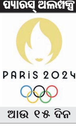
ଆଉ ୧୫ ଦିନ