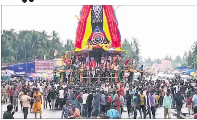
ମାଉସୀ ମା' ମନ୍ଦିର ଚକଡ଼ାରେ ଲାଗିଲା ବ୍ରହ୍ମ ଚାଳକଙ୍କୁ ରଥ ।

ନିର୍ମାଣ ଓ ପରିଚାଳନାରେ ତ୍ରୁଟି ଯୋଗୁ ଗତ ରାତିରେ ଶ୍ରୀରାମଦେବଜୀଉଙ୍କୁ ଆଡ଼ପ ମଣ୍ଡପ ବିଜେ ହୋଇପାରି ନ ଥିଲା । ଫଳରେ ଅନୁଭୋଗ ପରିବର୍ତ୍ତେ ଶ୍ରୀରାମ ରଥରେ ଚୁଡ଼ା ଭୋଗ ଖାଇ ରହିବାକୁ ପଡ଼ିଥିଲା । ଏହାକୁ ନେଇ ଏବେ ଶ୍ରୀରାମଙ୍କ ମଧ୍ୟରେ ଚାନ୍ଦୁ ଅସନ୍ତୋଷ ଦେଖାଦେଇଛି । ରଥ ପରିଚାଳନା ନେଇ ଥିବା ଅସନ୍ତୋଷ ଓ ରୋଷକୁ ନିର୍ମାଣଗତ ତ୍ରୁଟି କହି ଚାହୁଁଛନ୍ତି । ମାତ୍ର ରଥ ନିର୍ମାଣ ଓ ଫିଟନେସ ପ୍ରମାଣପତ୍ର ପ୍ରଦାନ ପୂର୍ବ ବିଭାଗ ଅଧୀନ । ଗତ ୪ଦିନ ଧରି ରଥ ଅବ୍ୟବସ୍ଥାରେ ରାଲିଥିଲେ ମଧ୍ୟ ପ୍ରମାଣପତ୍ର ଗ୍ରହଣ ବୋର୍ଡ଼ ନିକଟରେ ପହଞ୍ଚି ନାହିଁ । ଲିମ୍ବା ପ୍ରଶାସନର ଏପରି ଖାମୁଖୁଆଳି ମନୋଭାବକୁ ଶ୍ରୀରାମମାନେ ନାପସନ୍ଦ କରିଛନ୍ତି । ଧାର୍ମିକ ଭାବନା ଓ ଆତ୍ମା ପ୍ରତି ଖେଳ ହୋଇଥିବା ଅଭିଯୋଗକରି ଏହାର ତଦନ୍ତ ଦାବି କରିଛନ୍ତି ।