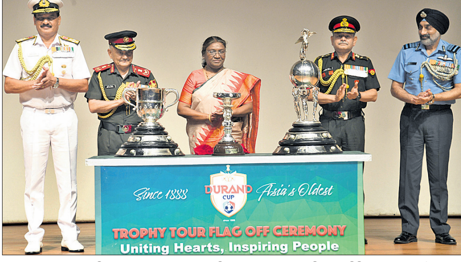
ଭୂରାଣ୍ଡ କର୍ମ ଟ୍ରଫି ଉନ୍ମୋଚନ ଅବସରରେ ଆଡମିରାଲ ଦୀନେଶ୍ କୁମାର ତ୍ରିପାଠୀ, ସିପିଏସ୍ ଅନାଲ ଚୌହାନ, ରାଷ୍ଟ୍ରପତି ଡ୍ରୋପଦୀ ମୁର୍ମୁ, ଛକ ସେନା ମୁଖ୍ୟ ଉପେନ୍ଦ୍ର ବିବେକା ଓ ଏୟାର ମାର୍ଶାଲ ଅମର ପ୍ରାଟ ସିଂ।

ଦୁଆବିଲ୍ଲା, ୧୦।୭(ପି.ଟି.) ଭାରତୀୟ ପୁରୁଷଲର ଚୁକ୍ତିକ୍ରମ ଗ୍ରହଣ ବିକାଶ ପାଇଁ ଆହ୍ୱାନ ଦେଇଛନ୍ତି ରାଷ୍ଟ୍ରପତି ଡ୍ରୋପଦୀ ମୁର୍ମୁ। ରୁଧିର ଏସିଆର ସର୍ବପୁରାତନ ପୁରୁଷଲର ଚୁକ୍ତିକ୍ରମ ଉନ୍ମୋଚନ ଅବସରରେ ରାଷ୍ଟ୍ରପତି ଏଭଳି କହିଛନ୍ତି। ଏସିଆର ସର୍ବପୁରାତନ ଚୁକ୍ତିକ୍ରମ ୧୩୩ ଡିଏସ୍ ଡିଏସ୍ ଡିଏସ୍ ଡିଏସ୍ ୨୭ ଚାରିଖଣ୍ଡ ଆରମ୍ଭ ହେବ। କୋଲକାତା, ଆସାମର କୋକ୍ରାଜେର, ମେଘାଳୟର ଶିଲିଂ ଓ ଝାଡ଼ଖଣ୍ଡର କାମସେଦପୁରରେ ଏହି ଚୁକ୍ତିକ୍ରମ ଖେଳାଯିବ। ରାଷ୍ଟ୍ରପତି ଭବନରେ ଅନୁଷ୍ଠିତ ଏକ କାର୍ଯ୍ୟକ୍ରମରେ ଭୂରାଣ୍ଡ କର୍ମ ସହିତ ପ୍ରେସିଡେଣ୍ଟସ୍ କର୍ମ ଓ ଶିମ୍ଲା କର୍ମ ମଧ୍ୟ ଉନ୍ମୋଚନ କରାଯାଇଥିଲା। ପୁରୁଷଲ ବିଶ୍ୱର ଏକ ଲୋକପ୍ରିୟ ଖେଳ। ପ୍ରଫେଶନାଲ ପୁରୁଷଲର ମାନେ ଦର୍ଶକଙ୍କ ମନୋରଞ୍ଜନ କରିଥାନ୍ତି। ବର୍ତ୍ତମାନ ଚାଲିଥିବା ଯୁବକ କର୍ମର ଚର୍ଚ୍ଚା ସମଗ୍ର ବିଶ୍ୱରେ ଦେଖିବାକୁ ମିଳୁଛି ବୋଲି ରାଷ୍ଟ୍ରପତି ନିଜ ବକ୍ତବ୍ୟରେ କହିଥିଲେ। ତେଣୁ ପୁରୁଷଲ ସହ ଜଡିତ ସମଗ୍ର ବ୍ୟକ୍ତି ଓ ସଂସ୍ଥାନ ଚୁକ୍ତିକ୍ରମ ଗ୍ରହଣ ଏହାର ବିକାଶ ପାଇଁ ପ୍ରୟାସ କରିବା ଉଚିତ ବୋଲି କହିଥିଲେ ରାଷ୍ଟ୍ରପତି। ଶିମ୍ଲାରେ ୧୮୮୮ରେ ପ୍ରଥମ ଥର ଏହି ଚୁକ୍ତିକ୍ରମ ଆୟୋଜିତ ହୋଇଥିଲା। ସାର ହେନରୀ ମର୍ଟିମର ଭୂରାଣ୍ଡକ ନାମ ଅନୁସାରେ ଏହି କର୍ମକୁ ନାମିତ କରାଯାଇଛି। ଭାରତୀୟ ସେନା ଓ ସର୍ବାଭାରତୀୟ ପୁରୁଷଲ ମହାସଂଘ ପକ୍ଷରୁ ମିଳିତ ଭାବରେ ଏହି ଚୁକ୍ତିକ୍ରମ ଆୟୋଜନ କରାଯାଉଥିବା ବେଳେ ଚିପ୍ ଅଫ୍ ଡିଫେନ୍ସ ଷ୍ଟାଫ୍ ଅନାଲ ଚୌହାନ, ଛକ ସେନା ମୁଖ୍ୟ ଉପେନ୍ଦ୍ର ବିବେକା, ନୌସେନା ମୁଖ୍ୟ ଆଡମିରାଲ ଦୀନେଶ୍ କୁମାର ତ୍ରିପାଠୀ ଓ ଏୟାର ମାର୍ଶାଲ ଅମର ପ୍ରାଟ ସିଂ ଉପସ୍ଥିତ ଥିଲେ।