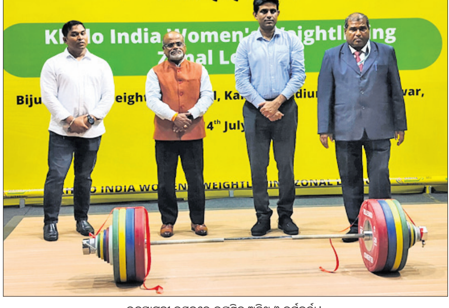
ଉଦ୍‌ଘାଟନା ଉପରେ ଉପସ୍ଥିତ ଅତିଥି ଓ କର୍ମକର୍ତ୍ତା।

ଭୁବନେଶ୍ୱର, ୧୦।୭(ତପନ ସାଲ୍) ଓଡ଼ିଶା ଭାରୋଭୋଲନ ସଂଘ ଓ ରାଜ୍ୟ ସରକାରଙ୍କ କ୍ରୀଡ଼ା ବିଭାଗ ଆନୁକୁଲ୍ୟରେ ଅସିନା ଖେଲୋ ଇଣ୍ଡିଆ ମହିଳା ଭାରୋଭୋଲନ ଜୋନାଲ ଲିଗ୍ ରୁଧିର କଳଙ୍କ ଷ୍ଟାଡିୟମ ହୋର୍ଟ୍ସ କମ୍ପ୍ଲେକ୍ସରେ ବିକ୍ରମ ପକ୍ଷୀୟ ଡିଫେନ୍ସିଭ୍ ହଲ୍ରେ ଆରମ୍ଭ ହୋଇଛି। ୧୪ ତାରିଖ