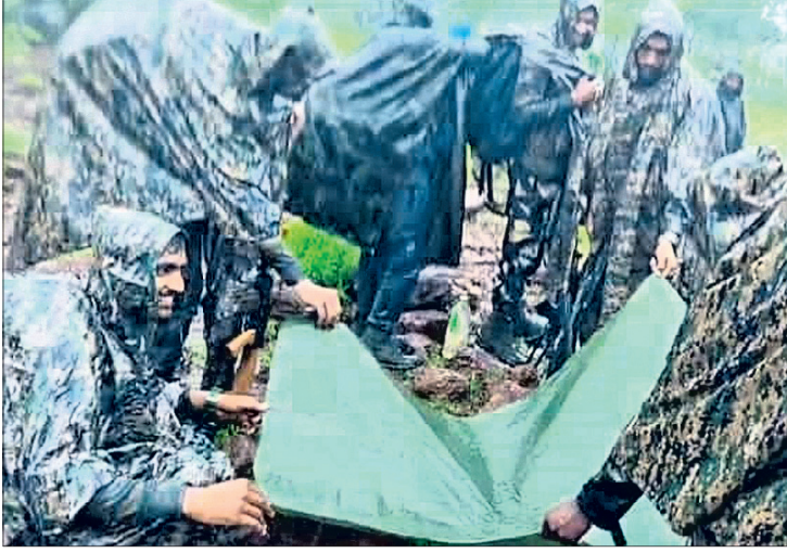
ଯାନଚାଳକମାନେ ସଂଗ୍ରହ କରୁଥିବା ବର୍ଷାପାଣି।

ବିଦେଶରେ ରୋଜଗାରର ସୁଯୋଗ ପାଇବାରେ ଓଡ଼ିଶାର କୁଶଳୀ ଯାନ ଚାଳକମାନେ ଉଲ୍ଲେଖନୀୟ ସଫଳତା ହାସଲ କରିଛନ୍ତି। ଜଣେ ମହିଳାଙ୍କ ସମେତ ଓଡ଼ିଶାର ୩୦ ଜଣ ଯାନଚାଳକ ଖୁବ୍‌ଶୀଘ୍ର ଜାପାନରେ ଅଧିକ ବେତନ ଓ ସୁବିଧା ଥିବା ନିୟୁକ୍ତି ପାଇବାକୁ ଯାଉଛନ୍ତି। ବୁଧବାର ଖାରବେଳ ଭବନରେ ଆୟୋଜିତ ବିଦେଶରେ ସୁବାହକଙ୍କ ନିୟୁକ୍ତି କାର୍ଯ୍ୟକ୍ରମରେ ବାଣିଜ୍ୟ ଏବଂ ପରିବହନ, ଇସ୍ପାତ ଏବଂ ଖଣି ବିଭାଗ ମନ୍ତ୍ରୀ ବିଭୂତି ଭୃଷ୍ଣାଙ୍କ ଛେନା ଏହି ସଫଳ ଯାନଚାଳକମାନଙ୍କୁ ସମ୍ମାନିତ କରିବା ସହ ଶୁଭେଚ୍ଛା ଜଣାଇଛନ୍ତି। ମନ୍ତ୍ରୀ ଛେନା କହିଛନ୍ତି, ଉତ୍ତମ ବ୍ୟବହାର, ଜିରୋ କାନ୍ଥୁଆଲିଟି ଓ ନିରାପତ୍ତା ଯାନଚାଳକମାନଙ୍କ ଆଦର୍ଶ ହେବା ଉଚିତ। ସେମାନେ ସତ୍ତ୍ୱେ ସୁରକ୍ଷା କ୍ଷେତ୍ରରେ ଗୁରୁତ୍ୱପୂର୍ଣ୍ଣ ଭୂମିକା ଗ୍ରହଣ କରିପାରିବେ। ଭାଙ୍ଗପାର ସଙ୍କଳ୍ପ ପତ୍ରରେ ଉଲ୍ଲିଖିତ ନିୟୁକ୍ତି ପ୍ରତିଷ୍ଠିତ ପାଳନ କରିବାରେ ବାଣିଜ୍ୟ ଓ ପରିବହନ ବିଭାଗ ପ୍ରଥମକରି ସଫଳତା ହାସଲ କରିଥିବାରୁ ସେ ବିଭାଗ ଓ ରାଜ୍ୟ ପରିବହନ ପ୍ରାଧିକାରଣକୁ ସାଧୁବାଦ ଜଣାଇଛନ୍ତି।