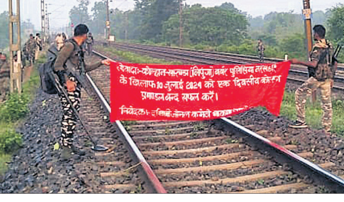
ରେଳଧାରଣାରେ ଲାଗିଥିବା ମାଓବାଦୀ ବ୍ୟାନର।

ପାଇଁ ରେଳଧାରଣାରେ ମାଓବାଦୀ ବ୍ୟାନର ଲଗାଇ ଚେତାବନୀ ଦେଇଛନ୍ତି। ଦକ୍ଷିଣ ପୂର୍ବ ରେଳପଥର ବୃତ୍ତୀୟ ଲାଇନ୍‌ରେ ମନୋହରପୁର- କରେଇକେଲା ମଧ୍ୟରେ ୨ଟି ଉର୍ଦ୍ଧ୍ୱ ମାଓବାଦୀ ବ୍ୟାନର ଜବତ କରିଛି ରେଳବାଇ ସୁରକ୍ଷା ବଳ। ଫଳରେ ହାତ୍ତାତୀ- ପୂର୍ଣ୍ଣା ଚାନ୍ଦିନୀ ଥିବା ଟ୍ରେନଗୁଡ଼ିକ ଅଟକି ରହିଥିଲା। ଆରୁଦ୍ଧିପର୍ଯ୍ୟନ୍ତ ପକ୍ଷରୁ ପାହାଣି ଓ ଯାତ୍ରୀ ପରେ ପ୍ରାୟ ୪ ଘଣ୍ଟା ପରେ ଟ୍ରେନ ଚଳାଚଳ ସ୍ୱାଭାବିକ ହୋଇଥିଲା। ମଙ୍ଗଳବାର ବିଳମ୍ବିତ ରାତି ପ୍ରାୟ ୨ଟାରେ ତାହାଜଣାଇବାକୁ ଆସୁଥିବା ଏକ ଟ୍ରେନର ଲୋକୋ ପାଲାଇଟ୍ ମନୋହରପୁର- କରେଇକେଲା ୩୫ ଲାଇନ୍‌ସ୍ଥିତ ୩୭୮/୩୫୫ (ରାଂଘା ଓ କରମପଡ଼ା ସେକ୍ଟର) ମଧ୍ୟରେ ବ୍ୟାନରଗୁଡ଼ିକ ଲଗାଯାଇଥିବା ଦେଖିବାକୁ ପାଇଥିଲେ। ରେଳଓଡ଼ି ଉଚ୍ଚ ଅଧିକାରୀଙ୍କୁ ସୂଚନା ଦେବା ପରେ ଘଟଣାସ୍ଥଳରେ ଆରୁଦ୍ଧିପର୍ଯ୍ୟନ୍ତ କର୍ମୀ, କୋରାସ କମାଣ୍ଡଃ ଓ ମନୋହରପୁର ପୋଲିସ୍ ପହଞ୍ଚି ଯାତ୍ରୀ କାର୍ଯ୍ୟ କରିଥିଲେ। ସକାଳ ୬ଟାରେ ଟ୍ରେନ ଚଳାଚଳ ପାଇଁ ଅନୁମତି ମିଳିଥିଲା। ଦକ୍ଷିଣ କୋଲାଇ କମିଟି ମାକପା ପକ୍ଷରୁ ଏହି ବ୍ୟାନର ଲଗାଯାଇଥିବା ଉଲ୍ଲେଖ ରହିଛି। ତେବେ ମାଓବାଦୀମାନେ ନିଜ ଉପସ୍ଥିତି ଦର୍ଶାଇବା ପାଇଁ ଏପରି କାଣ୍ଡ ଭିଆଇଥିବା ସୁରକ୍ଷାକର୍ମ ପକ୍ଷରୁ କୁହାଯାଇଛି।