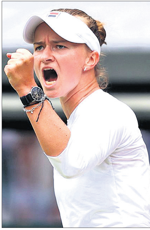
କ୍ୱାର୍ଟର ଫାଇନାଲ ଚିଟିବାପରେ ଏଲିନା ରିବାକିନା ଓ ବାର୍ବରା କ୍ରେଜିକୋଭା।

କ୍ରେଜିକୋଭା ପ୍ରଥମଥରପାଇଁ ପ୍ରବେଶ କରିଛନ୍ତି। ପୁରୁଷ ଡବ୍ଲିଉଏସ୍ ଓସ୍ଟ୍ରେଲିଆନ ଗ୍ରାଣ୍ଡସ୍ଲାମରେ ସେମିଫାଇନାଲରେ ସିଙ୍ଗଲ୍ରେ ଅଷ୍ଟ୍ରେଲିଆର ଆଲେକ୍ସାନ୍ଦ୍ର ମେଡ୍ଭେନେ ଆହତ ସମସ୍ୟା ଯୋଗୁ ଓହରି ଯିବାରୁ ସର୍ବମୋଟ