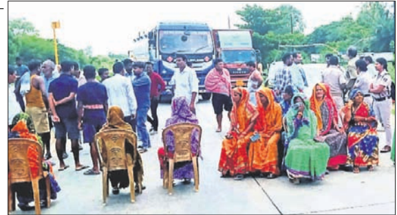
ଗୋଦାମ ଘର ତାଲା ଖୋଲିବା ନେଇ ରୁପସାହାୟ ଟ୍ରାକ୍ଟରକୁ ଡିଙ୍ଗି ହଇଜାରେ ବିଜେଡି ସମର୍ଥକମାନେ ରାଜପଥ ଅବରୋଧ କରିଛନ୍ତି ।

ବାଲୁଗା, ୧୦୭(ସଂଗ୍ରାମ ପାଲକରାୟ) ଖୋର୍ଦ୍ଧା ଜିଲ୍ଲା ଚିଲିକା ବ୍ଲକ ଅଧୀନ ଆଲୁଆ ପଞ୍ଚାୟତରେ ଚାଉଳ ବଣ୍ଟନକୁ ନେଇ ଭାଜପା-ବିଜେଡି ସମର୍ଥକଙ୍କ ମଧ୍ୟରେ ବିବାଦ ଦେଖାଦେଇଛି । ଏହି ପଞ୍ଚାୟତରେ ଚାଉଳ ବଣ୍ଟନରେ ଅନିୟମିତତା ଅଭିଯୋଗ ଆଣି ଭାଜପା ସମର୍ଥକମାନେ ଗତ ୪ ତାରିଖରେ କାର୍ଯ୍ୟାଳୟ ଗୋଦାମଘର ତାଲା ପକାଇଛନ୍ତି । ଫଳରେ ଖାଉଟି ସାମଗ୍ରୀ ବଣ୍ଟନ ସମ୍ପୂର୍ଣ୍ଣଭାବେ ବ୍ୟାହତ ହୋଇଛି । ଏହାର ପ୍ରତିବାଦରେ ରୁପସାହାୟ ଟ୍ରାକ୍ଟରକୁ ଡିଙ୍ଗି ହଇଜାରେ ଲାଗଣ ରାଜପଥ ଅବରୋଧ କରାଯାଇଥିଲା । ଫଳରେ ଉଭୟ ପକ୍ଷ ଆସୁଥିବା ଯାନବାହନ ଅଟକି ରହିଥିଲା । ଗୁରୁବାର କାର୍ଯ୍ୟାଳୟ ଗୋଦାମଘରୁ ତାଲା ଫିଟାଯିବା ସହ ଖାଉଟିକୁ ଚାଉଳ ବଣ୍ଟନ ନିମନ୍ତେ ଆବଶ୍ୟକ ପଦକ୍ଷେପ ନିଆଯିବ ବୋଲି ଜିଲ୍ଲାପାଳ ପ୍ରତିଶ୍ରୁତି ଦେବା ପରେ ଅପରାହ୍ଣ ୪ଟାରେ ଚାଉଳ ବଣ୍ଟନ ପ୍ରତ୍ୟାହତ ହୋଇଥିଲା । ପରେ ଯାନବାହନ ଚଳାଚଳ ସ୍ୱାଭାବିକ ହୋଇଥିଲା । ସୂଚନାପ୍ରାପ୍ତ କି, ବିଜେଡି ସମର୍ଥକ ଆଲୁଆ ସମର୍ଥକ ତତ୍କାଳୀନରେ ଖାଉଟିକୁ ରାଗଣ ସାମଗ୍ରୀ ବଣ୍ଟନ କାର୍ଯ୍ୟ ହୋଇଆସୁଥିଲା । ତେବେ ଖାଉଟି ସାମଗ୍ରୀ ବଣ୍ଟନରେ ଅନିୟମିତତା ଓ ହେଉଥିବା ଭାଜପା ସମର୍ଥକମାନେ ଅଭିଯୋଗ ଆଣିଥିଲେ । ଗତ ୨ତାରିଖରେ କୌଣସି କାରଣ ପାଇଁ ରାଗଣ ସାମଗ୍ରୀ ବଣ୍ଟନ ହୋଇପାରି ନ ଥିଲା । ରାଗଣ ସାମଗ୍ରୀ ହତୁଡ଼ି ହୋଇଥିବା ସନ୍ଦେହରେ ଭାଜପା ସମର୍ଥକମାନେ ୪ ତାରିଖରେ କାର୍ଯ୍ୟାଳୟ ଗୋଦାମଘର ତାଲା ପକାଇଦେଇଥିଲେ । ଘଟଣା ସମ୍ପର୍କରେ ବିଭାଗୀୟ ଉଚ୍ଚ କର୍ତ୍ତୃପକ୍ଷଙ୍କୁ ସରପଞ୍ଚ ଅବଗତ କରାଯାଇଥିଲା ।