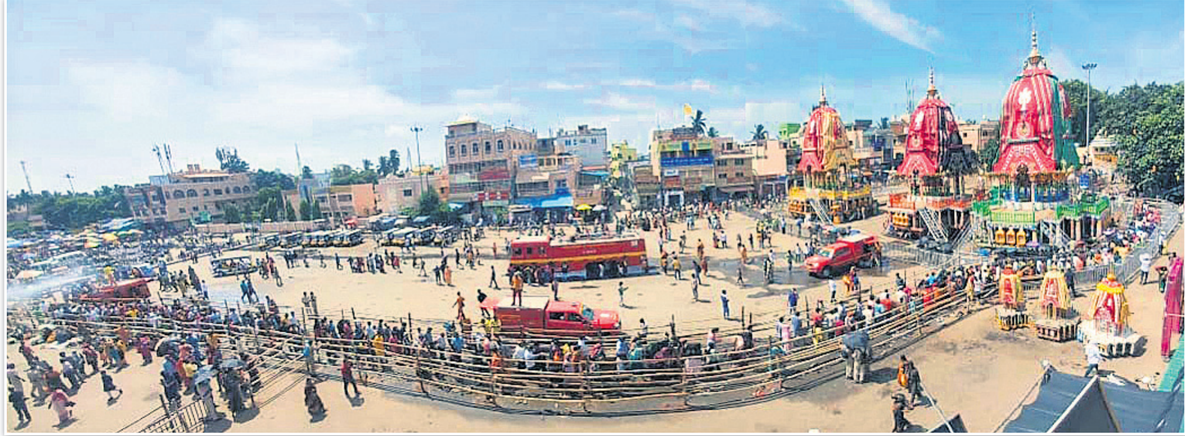
ଆଡ଼ପ ମଞ୍ଚପରେ ମହାପ୍ରଭୁଙ୍କ ଦର୍ଶନ ପାଇଁ ଶ୍ରଦ୍ଧାଳୁଙ୍କ ନିମନ୍ତେ ଶରଧାବାଲିରେ କରାଯାଇଥିବା ବ୍ୟାରିକେଡ୍ ।