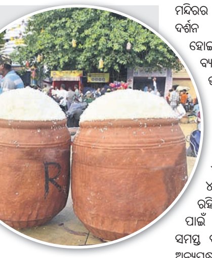
ବିଶ୍ୱାସ ରହିଛି । ସେହିପରି ଶ୍ରୀଗୁଣ୍ଡିଚା

ସକାଳ ଧୂପରେ ଅବଢ଼ା, ଘିଅ ଅନ୍ନ, କାନ୍ଦିକା, ଖେରୁଡ଼ି, ମେଣ୍ଟାମୁଣ୍ଡିଆ, ଅଦା ଓ ହେଙ୍ଗୁ ଖେରୁଡ଼ି, ଭାଲମା, ବେସର, ମହୁର, ଶାଗ, ପିତା, ଖଟା ଆଦି ବିଭିନ୍ନ ପ୍ରକାରର ଭୋଗ ଲାଗି କରାଯାଇଛି । ଭକ୍ତମାନେ ଯେପରି ସୁରୁଖୁରୁରେ ମହାପ୍ରସାଦ ପାଇପାରିବେ ସେଥିପାଇଁ ସୁଆର ମହାସୁଆର ନିୟୋଗ ପକ୍ଷରୁ ବ୍ୟବସ୍ଥା ହୋଇଛି । ଆଡ଼ପ ମଞ୍ଚପରେ ମହାପ୍ରଭୁଙ୍କୁ ଦର୍ଶନ କରି ଆଡ଼ପ ଅବଢ଼ା ଖାଇଲେ ଶହେ ଜନ୍ମର ପାପ କ୍ଷୟ ହୁଏ ବୋଲି ବିଶ୍ୱାସ ରହିଛି । ସେହିପରି ଶ୍ରୀଗୁଣ୍ଡିଚା