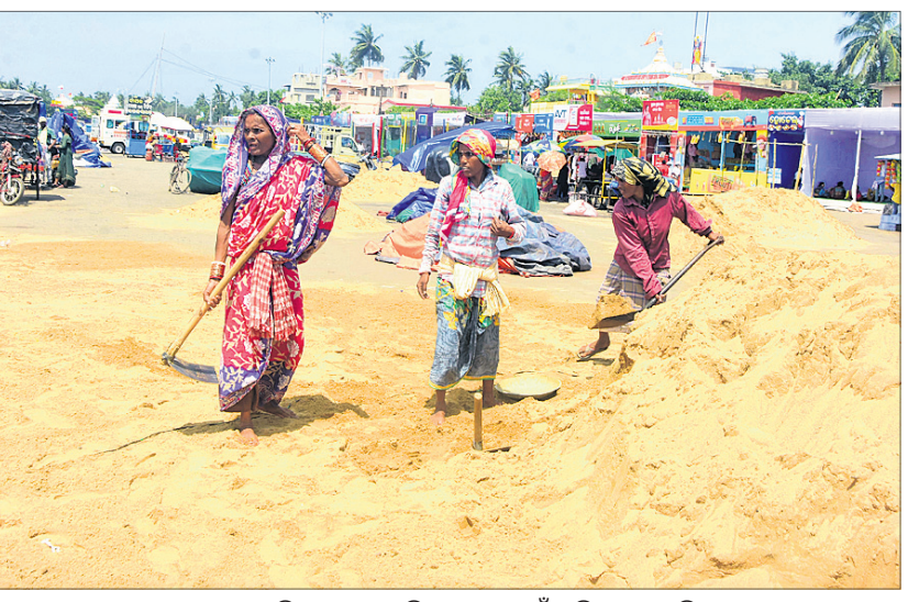
ଶରଧାବାଲିରେ ରଥର ଦକ୍ଷିଣ ମୋଡ଼ ପାଇଁ ବାଲି ପକାଯାଇଛି ।