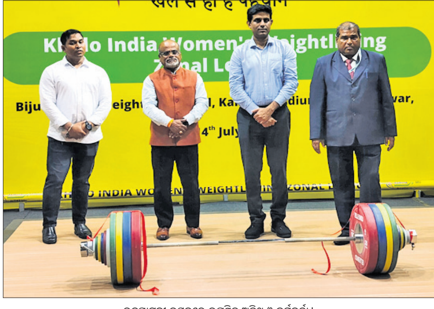
ଉଦ୍‌ଘାଟନା ଉତ୍ସବରେ ଉପସ୍ଥିତ ଅତିଥି ଓ କର୍ମଚାରୀ।

ଭୁବନେଶ୍ୱର, ୧୦/୭ (ତପନ ସାଲ୍) ଓଡ଼ିଶା ଭାରୋଭୋଲନ ସଂଘ ଓ ରାଜ୍ୟ ସରକାରଙ୍କ କ୍ରୀଡ଼ା ବିଭାଗ ଆନୁକୁଲ୍ୟରେ ଅନୁଷ୍ଠିତ ହେଲେ ଇଣ୍ଡିଆ ମହିଳା ଭାରୋଭୋଲନ ଜୋନାଲ ଲିଗ୍ ରୁସ୍ତାବାର କଳିଙ୍ଗ ଷ୍ଟାଡିୟମ ହୋର୍ଟ୍ସ୍ କମ୍ପ୍ଲେକ୍ସରେ ବିକ୍ଟୁ ପକନାୟକ ଫ୍ଲୋରିଡିଂ ହଲ୍ରେ ଆରମ୍ଭ ହୋଇଛି। ୧୪ ତାରିଖ