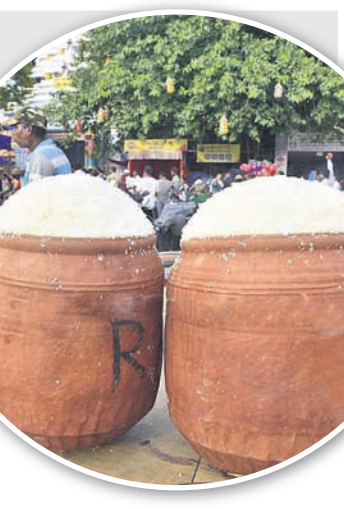
ବିଶ୍ୱାସ ରହିଛି । ସେହିପରି ଶ୍ରୀଗୁଣ୍ଡିଚା

ସକାଳ ଧୂପରେ ଅବଢ଼ା, ଘିଅ ଅନ୍ନ, କାନ୍ଦିକା, ଖେରୁଡ଼ି, ମେଣ୍ଟାମୁଣ୍ଡିଆ, ଅଦା ଓ ହେଙ୍ଗୁ ଖେରୁଡ଼ି, ଭାଲମା, ବେସର, ମହୁର, ଶାଗ, ପିତା, ଖଟା ଆଦି ବିଭିନ୍ନ ପ୍ରକାରର ଭୋଗ ଲାଗି କରାଯାଇଛି । ଭକ୍ତମାନେ ଯେପରି ସୁରୁଖୁରୁରେ ମହାପ୍ରସାଦ ପାଇପାରିବେ ସେଥିପାଇଁ ସୁଆର ମହାସୁଆର ନିୟୋଗ ପକ୍ଷରୁ ବ୍ୟବସ୍ଥା ହୋଇଛି । ଆଡ଼ପ ମଞ୍ଚପରେ ମହାପ୍ରଭୁଙ୍କୁ ଦର୍ଶନ କରି ଆଡ଼ପ ଅବଢ଼ା ଖାଇଲେ ଶହେ ଜନ୍ମର ପାପ କ୍ଷୟ ହୁଏ ବୋଲି ବିଶ୍ୱାସ ରହିଛି । ସେହିପରି ଶ୍ରୀଗୁଣ୍ଡିଚା