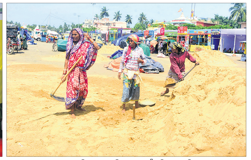
ଶରଧାବାଲିରେ ରଥର ଦକ୍ଷିଣ ମୋଡ଼ ପାଇଁ ବାଲି ପକାଯାଉଛି ।