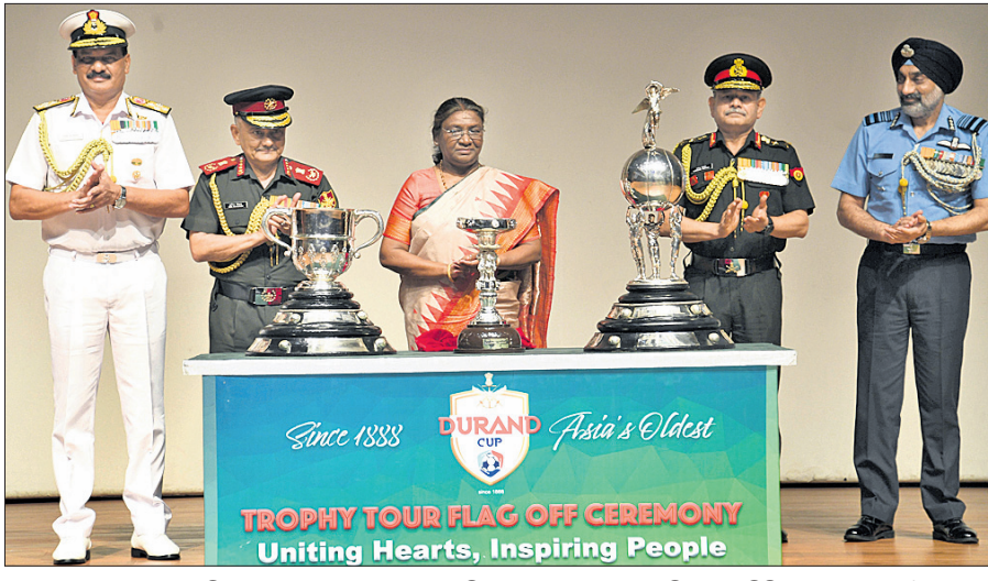
ଡୁରାଣ୍ଡ କପ୍ ଟ୍ରଫି ଉନ୍ମୋଚନ ଅବସରରେ ଆଡମିରାଲ ଦୀନେଶ୍ କୁମାର ତ୍ରିପାଠୀ, ସିଡିଏସ୍ ଅନାଲ ଚୌହାନ, ରାଷ୍ଟ୍ରପତି ଶ୍ରୀପଦା ପୂର୍ଣ୍ଣ, ଛଳ ସେନା ମୁଖ୍ୟ ଉପେନ୍ଦ୍ର ବ୍ରତବୀ ଓ ଏୟାର ମାର୍ଶାଲ ଅମର ପ୍ରାଟ ସିଂ।

ପୁରୀ, ୧୦/୭ (ପି.ଟି.) ଭାରତୀୟ ପୁରୁଷଲର ଡୁରାଣ୍ଡ ପ୍ରଭୁ ବିକାଶ ପାଇଁ ଆହ୍ୱାନ ଦେଇଛନ୍ତି ରାଷ୍ଟ୍ରପତି ଶ୍ରୀପଦା ପୂର୍ଣ୍ଣ। ରୁସ୍ତାବାର ଏସିଆର ସର୍ବପୁରାତନ ପୁରୁଷଲ ଚୁନାମେଣ୍ଟ ଡୁରାଣ୍ଡ କପ୍ ଟ୍ରଫି ଉନ୍ମୋଚନ ଅବସରରେ ରାଷ୍ଟ୍ରପତି ଏଭି ଜିଏସ୍ ଚୌହାନ ଏସିଆର ସର୍ବପୁରାତନ ଚୁନାମେଣ୍ଟ ୧୩୩ ତମ ସଂସ୍କରଣ ଚଳିତ ମାସ ୨୭ ତାରିଖରୁ ଆରମ୍ଭ ହେବ। କୋଲକାତା, ଆସାମର କୋକ୍ରାଜେର, ମେଘାଳୟର ଶିଲିଂ ଓ ଝାଡ଼ଖଣ୍ଡର ଜାମସେଦପୁରରେ ଏହି ଚୁନାମେଣ୍ଟ ଖେଳାଯିବ। ରାଷ୍ଟ୍ରପତି ଉନ୍ମୋଚନ ଅବସରରେ ଡୁରାଣ୍ଡ କପ୍ ସହିତ ପ୍ରେସିଡେଣ୍ଟସ୍ କପ୍ ଓ ଶିମ୍ଲା କପ୍ ମଧ୍ୟ ଉନ୍ମୋଚନ କରାଯାଇଥିଲା। ପୁରୁଷଲ ବିଶ୍ୱର ଏକ ଲୋକପ୍ରିୟ ଖେଳ। ପ୍ରଫେଶନାଲ ପୁରୁଷଲ ମାନେ ଦର୍ଶକଙ୍କ ମନୋରଞ୍ଜନ କରିଥାନ୍ତି। ବର୍ତ୍ତମାନ ଚାଲିଥିବା ଯୁବକ କପ୍ ଚର୍ଚ୍ଚା ସମଗ୍ର ବିଶ୍ୱରେ ଦେଖିବାକୁ ମିଳୁଛି ବୋଲି ରାଷ୍ଟ୍ରପତି ନିଜ ବକ୍ତବ୍ୟରେ କହିଥିଲେ। ତେଣୁ ପୁରୁଷଲ ସହ ଜଡିତ ସମସ୍ତ ବ୍ୟକ୍ତି ଓ ସଂସ୍ଥାନ ଡୁରାଣ୍ଡ ପ୍ରଭୁରୁ ଏହାର ବିକାଶ ପାଇଁ ପ୍ରୟାସ କରିବା ଉଚିତ ବୋଲି କହିଥିଲେ ରାଷ୍ଟ୍ରପତି। ଶିମ୍ଲାରେ ୧୮୮୮ରେ ପ୍ରଥମ ଥର ଏହି ଚୁନାମେଣ୍ଟ ଆୟୋଜିତ ହୋଇଥିଲା। ସାର ହେନ୍ରୀ ମର୍ଟିମର ଡୁରାଣ୍ଡଙ୍କ ନାମ ଅନୁସାରେ ଏହି କପ୍ଟୁ ନାମିତ କରାଯାଇଛି। ଭାରତୀୟ ସେନା ଓ ସର୍ବାଭାରତୀୟ ପୁରୁଷଲ ମହାସଂଘ ପକ୍ଷରୁ ମିଳିତ ଭାବରେ ଏହି ଚୁନାମେଣ୍ଟ ଆୟୋଜନ କରାଯାଉଥିବା ବେଳେ ଚିପ୍ ଅଫ୍ ଡିଫେନ୍ସ ଷ୍ଟାଫ୍ ଅନାଲ ଚୌହାନ, ଛଳ ସେନା ମୁଖ୍ୟ ଉପେନ୍ଦ୍ର ବ୍ରତବୀ, ନୌସେନା ମୁଖ୍ୟ ଆଡମିରାଲ ଦୀନେଶ୍ କୁମାର ତ୍ରିପାଠୀ ଓ ଏୟାର ମାର୍ଶାଲ ଅମର ପ୍ରାଟ ସିଂ ଉପସ୍ଥିତ ଥିଲେ।