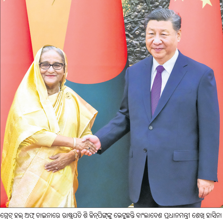
ଗ୍ରେଟ୍ ହଲ୍ ଅଫ୍ ରାଜନୀତିରେ ରାଷ୍ଟ୍ରପତି ଶି ଜିନ୍ପିଙ୍ଗଙ୍କୁ ଭେଟୁଛି ବାଂଲାଦେଶ ପ୍ରଧାନମନ୍ତ୍ରୀ ଶେଖ୍ ହାସିନା।

ଅବସାନ ସମ୍ଭବ ବୋଲି ମୋଦି କହିଛନ୍ତି। ତେଣୁ ସେ ପୁଟିନଙ୍କୁ ଏହି ବର୍ତ୍ତମାନ ମୁଖ ଶେଷ କରିବାକୁ ପରାମର୍ଶ ଦିଅନ୍ତୁ। ରାଷ୍ଟ୍ରପତି ପୁଟିନ ଏହି ମୁଖ ଆରମ୍ଭ କରିଥିଲେ। ସେ ହିଁ ମୁଖାବସାନ କରିପାରିବେ।