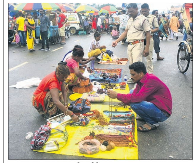
ଶରଧାବାଲିରେ ବିକ୍ରି ହେଉଥିବା ସାମଗ୍ରୀ ।

କଲେ । ଭକ୍ତପଦ୍ମ କର୍ମଚାରୀମାନେ ସେମାନଙ୍କୁ ନିୟନ୍ତ୍ରଣ କରିବାରେ କ୍ଷମତା ନାହିଁ ଏହାଦ୍ୱାରା ଆଗାମୀ ଦିନରେ ମହାପ୍ରଭୁଙ୍କ ନାଟକାନ୍ତରେ ବିଭ୍ରାଟ ଦେଖାଦେଇପାରେ । ଘଟଣାର ତଦନ୍ତ ସହ କାର୍ଯ୍ୟାନୁଷ୍ଠାନ ଗ୍ରହଣ କରାଯାଉ ବୋଲି ସେ କହିଛନ୍ତି । ପୁରୀ ମହାପ୍ରଭୁର ନିୟୋଗର ବରିଷ୍ଠ ସେବାୟତ ଦାମୋଦର ମହାପ୍ରଭୁଙ୍କୁ କହିଛନ୍ତି, ତୋର କୋହଳ ହୋଇଯିବାରୁ ଏପରି ହେଲା । ନିୟନ୍ତ୍ରଣ କରିବା ସମ୍ଭବ ହେଲାନାହିଁ । ତେବେ ଏ କାଳିର ଦଣ୍ଡ ରୁହେଁ । ଯେଉଁଦିନ ମହାପ୍ରଭୁ କ୍ରମକୁ ଭିତରଞ୍ଜ ସେବାୟତମାନେ ତାଙ୍କ ନିକଟରେ ପ୍ରଥମେ ଭୋଗ ନ କରି ଆଗ ସେନାପତି ଲାଗି କରିଦେଲେ, ଯାହା ନାଟି ବିରୋଧ । ବଡ଼ ଠାକୁର ପହଞ୍ଚି ସମୟରେ ତାଙ୍କୁ ଶିଖ ମହାପ୍ରଭୁଙ୍କ ଶ୍ରୀଜଗନ୍ନାଥ ଗୋଟିଏ ପଟକୁ ଅଣେଇ ହୋଇ ପଡ଼ିଥିଲା । ଫଳରେ ୨୪ ବର୍ଷର ସରକାର ଭାଙ୍ଗିଯାଇଥିଲା । ହେଲେ ଏଥର ବଳଭଦ୍ର ମହାପ୍ରଭୁ ପଡ଼ିଯିବା ଏକ ବଡ଼ ଅଶୁଭ ସଙ୍କେତ ବଡ଼ଠାକୁରଙ୍କ ଶ୍ରୀଅଙ୍ଗକୁ କୌଣସି କ୍ଷତି ହୋଇନାହିଁ । ଭବିଷ୍ୟତରେ ଯେପରି ଏଭଳି ଅଘଟଣାର ପୁନରାବୃତ୍ତି ନ ଘଟେ ସେଥିପ୍ରତି ଧ୍ୟାନ ଦିଆଯିବ । ବାରମ୍ବାର ଦଳଗାପତି ନିୟୋଗ ପକ୍ଷରୁ ପହଞ୍ଚିବେ ସଂଖ୍ୟା ନିୟନ୍ତ୍ରଣ ପାଇଁ ଦାବି କରାଯାଇଆସୁଛି, ମାତ୍ର ସୁଫଳ ମିଳିଲା ନାହିଁ । ବର୍ତ୍ତମାନ ଉପସ୍ଥିତ ନିଷ୍ପତି ନେବା ଆବଶ୍ୟକ । ଶ୍ରୀବିଗ୍ରହମାନେ ସୁରକ୍ଷିତ ରହିଲେ ହିଁ ରଥଯାତ୍ରା ହେବ । ଏକାଧିକ