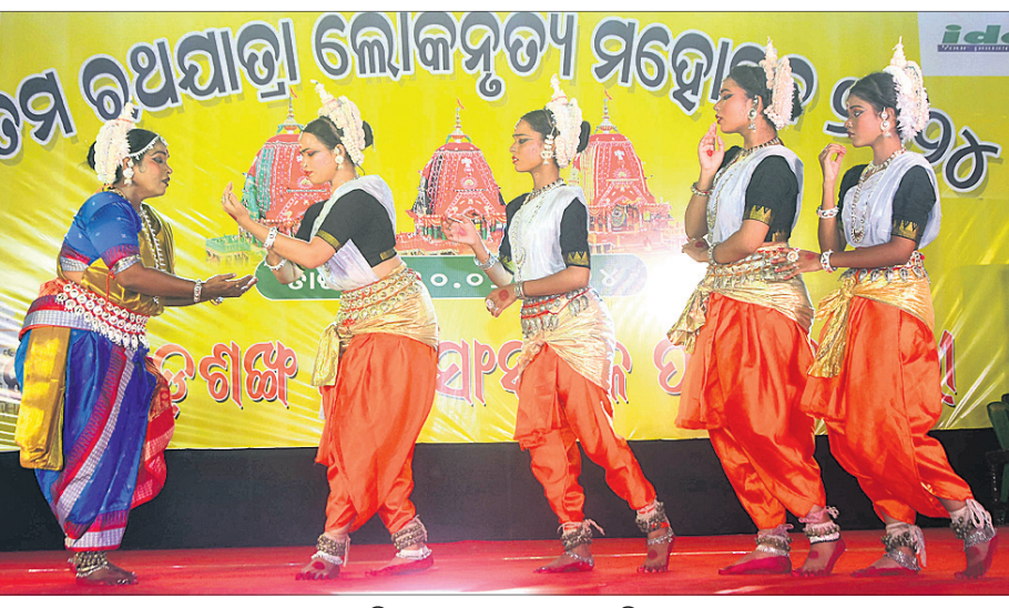
ବଡ଼ଶଙ୍ଖ ସାଂସ୍କୃତିକ ମହୋତ୍ସବ ପକ୍ଷରୁ ଆୟୋଜିତ ଲୋକନୃତ୍ୟ ।