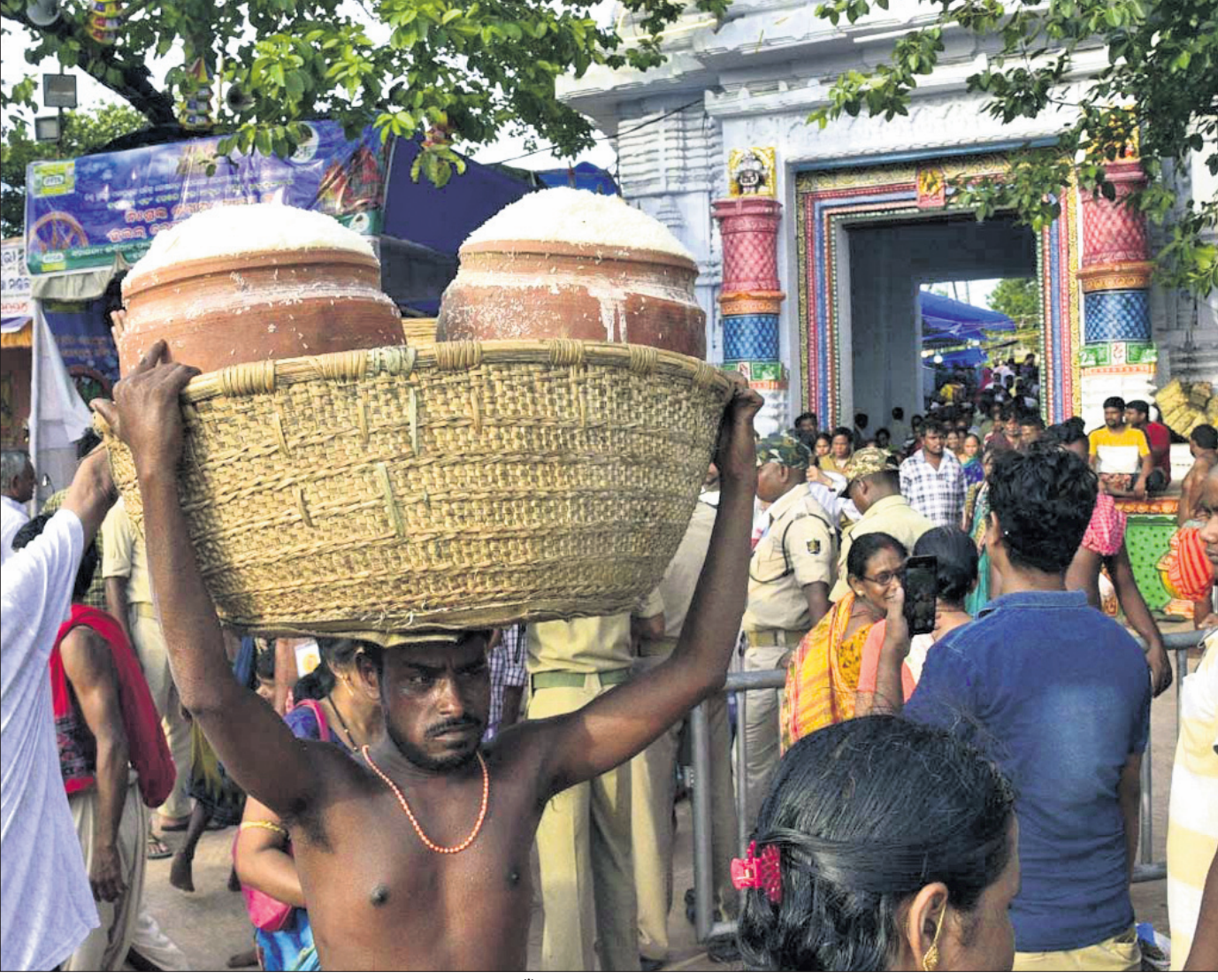
ପୁରୀ ରୁକ୍ଷିତା ମନ୍ଦିରରୁ ବୁଧବାର ଭକ୍ତଙ୍କ ପାଇଁ ବାହାରିଥିବା ପ୍ରଥମ ଆଡ଼ପ ଅବଦାନ।