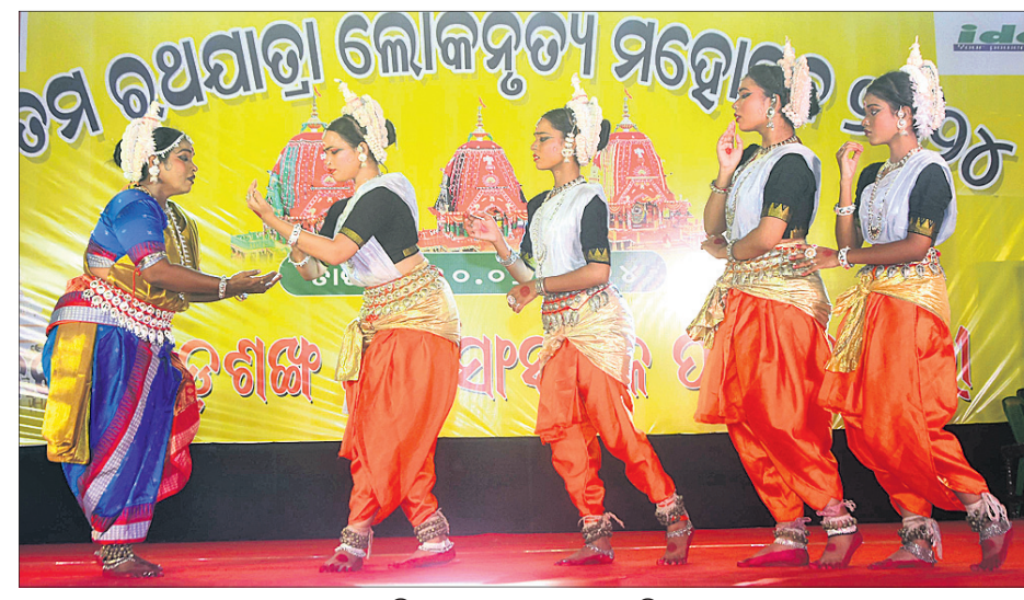
ବଡ଼ଶଙ୍ଖ ସାଂସ୍କୃତିକ ମହୋତ୍ସବ ପକ୍ଷରୁ ଆୟୋଜିତ ଲୋକନୃତ୍ୟ ।