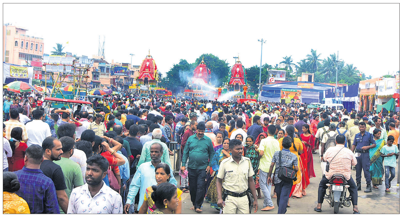
ଗୁରୁବାର ହେଉଥିବା ଅବସରରେ ଆଡ଼ିପ ମଣ୍ଡପରେ ମହାପ୍ରଭୁଙ୍କୁ ଦର୍ଶନ ପାଇଁ ପୁରୀ ଶରଧାବାଲିରେ ଶ୍ରୀଧାନ୍ୱଳ ଭିଡ଼ ।