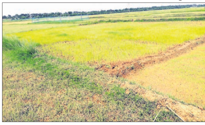
ଚାଷକର୍ମୀରେ ପାଣି ନ ପାଇ ଧାନତଳି ହଳଦିଆ ପଡ଼ିଯାଇଛି।

ଆଷାଢ଼ ମାସ ସରିବାକୁ ବସିଲାଣି। ହେଲେ ବର୍ଷା ଆଭାବ ପାରୁନି ଚାଷକାମ। ଧାନତଳି ଶୁଖି ଫାଟିଗଲାଣି। ତଳିରେ ଧାନଗଛ ସବୁ ହଳଦିଆ ପଡ଼ିଗଲାଣି। ଅପରପକ୍ଷେ ଚାଷକର୍ମୀଙ୍କୁ ଜଳସେଚିତ କରିବାକୁ ଉଦ୍ଦିଷ୍ଟ ଦଶମଶିଖା କେନାଲ ଶୁଖିଲା ପଡ଼ିଛି। ଭଦ୍ରକ ଜିଲ୍ଲା ତିହିଡ଼ି ବ୍ଲକରେ ଏହି ପ୍ରତିକୂଳ ସ୍ଥିତିରେ ଚାଷୀମାନଙ୍କ ମଧ୍ୟରେ ନୈରାଶ୍ୟଭାବ ସୃଷ୍ଟି ହୋଇଛି। ଆସନ୍ତା ସପ୍ତାହକ ମଧ୍ୟରେ ଲଗାଣ ବର୍ଷା ନ ହେଲେ ସ୍ଥିତି କଟକ ହେବାର ଆଶଙ୍କା ଉପୁଜିଛି। ତଳିତ ଖରିଫ ଋତୁରେ ବ୍ଲକରେ ୨୦ହଜାର ହେକ୍ଟର ଜମିରେ ଧାନଚାଷ ପାଇଁ ଲକ୍ଷ୍ୟ ରଖାଯାଇଛି। ଗଜ ସଂକ୍ରାନ୍ତି ପୂର୍ବରୁ ପାଗ ଅନୁକୂଳ ନ ହେବାରୁ ଚାଷୀମାନେ ବର୍ତ୍ତମାନ ଚଳି ପକାଇ ପାରି ନ ଥିଲେ। ସଂକ୍ରାନ୍ତି ପରେ ପରେ ବର୍ତ୍ତମାନ ଚଳି ପକାଇବାକୁ ସମ୍ଭବ ହୋଇଥିଲେ। ଏପରିକି ଏହା ଭିତରେ କେତେଜଣ ଚାଷୀ ଖାଲୁଆ ଜମିରେ ଆତରା ତଳି ମଧ୍ୟ