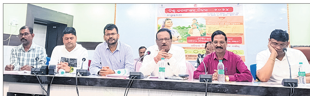
କାର୍ଯ୍ୟକ୍ରମରେ ମହାସାଧନ ଅତିଥି ।