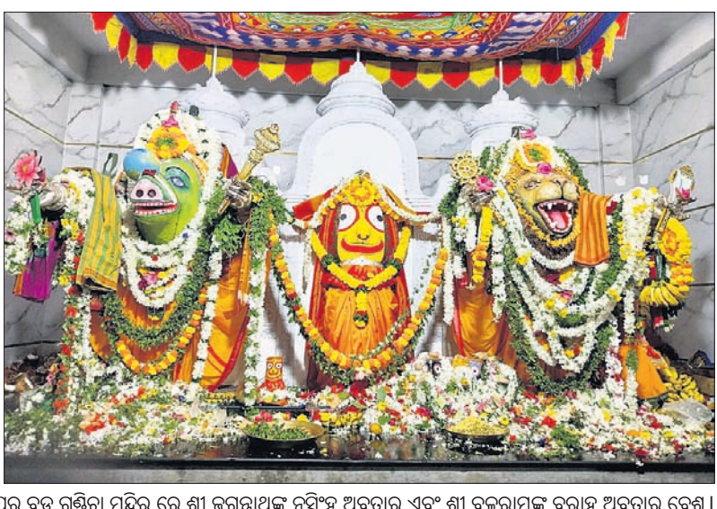
ହେରା ପଞ୍ଚମୀ ଅବସରରେ ରାୟଗଡ଼ାସ୍ଥିତ ଗୁଣ୍ଡିଚା ମନ୍ଦିରରେ ଶ୍ରୀଜୀଉ ନରସିଂହ ଅବତାରରେ ଭକ୍ତଙ୍କୁ ଦର୍ଶନ ଦେଉଛନ୍ତି । ଗୁଣ୍ଡପୁର ବଡ଼ ଗୁଣ୍ଡିଚା ମନ୍ଦିର ରେ ଶ୍ରୀ ଜଗନ୍ନାଥଙ୍କ ନୃସିଂହ ଅବତାର ଏବଂ ଶ୍ରୀ ବଳରାମଙ୍କ ବରାହ ଅବତାର ଦେଖା ।