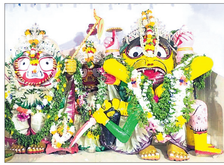
କୋରାପୁଟ ଶାବର ଶ୍ରୀକ୍ଷେତ୍ର ଆଡ଼ପ ମଠରେ ଗୁରୁବାର ଶ୍ରୀକାଳ ଲକ୍ଷ୍ମୀ ନୃସିଂହ ଅବତାରରେ ଶ୍ରୀକାଳକୁ ଦର୍ଶନ ଦେଉଥିବା ବେଳେ ଜୟପୁରରେ ବଳଭଦ୍ର ନରସିଂହ ଓ ଜଗନ୍ନାଥ ନାରାୟଣ ଓ ଦାମନଯୋଡ଼ିରେ ଶ୍ରୀକାଳ ନୃସିଂହ ବେଶରେ ଦର୍ଶନ ଦେଉଛନ୍ତି ।