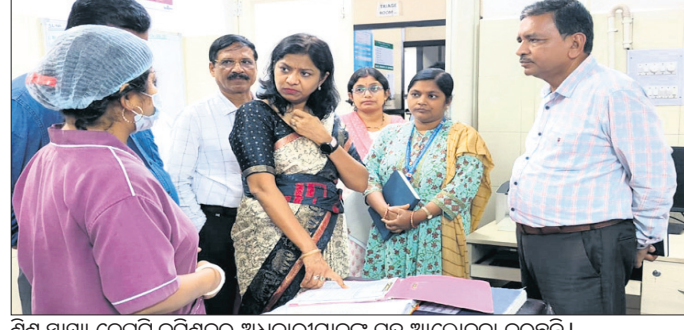
ଶିଶୁ ସ୍ୱାସ୍ଥ୍ୟ ଡେପୁଟି କମିଶନର ଅଧିକାରୀମାନଙ୍କ ସହ ଆଲୋଚନା କରୁଛନ୍ତି ।