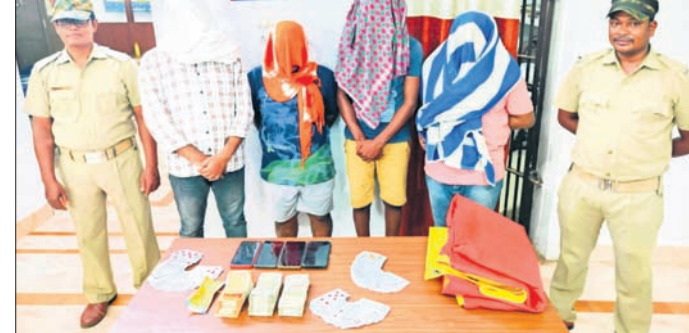
ଗିରଫ ଅଭିଯୁକ୍ତଙ୍କ ସହ ଜବତ ମୋବାଇଲ ଏବଂ ଟଙ୍କା ।