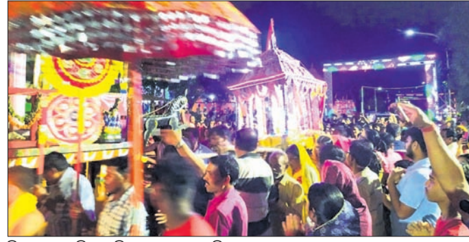
ବିନାମରେ ଭୃତ୍ତରା ମନ୍ଦିରକୁ ଯାତ୍ରା କରୁଛନ୍ତି ମହାଲକ୍ଷ୍ମୀ ।

କରମପୁର/କୋରାପୁଟ/ଦାମନଯୋଡ଼ି, ୧୧୧୭ (ପବନ ପାଣିଗ୍ରାହୀ/ଅନିତା ବେହେରା/ମାନ୍ୟ ସଂଖ୍ୟା କର)