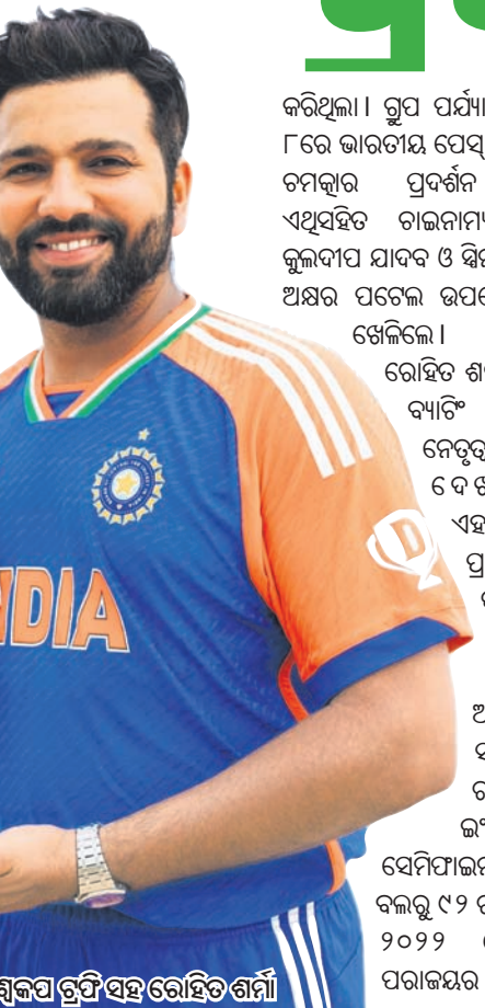
ବିଶ୍ୱକପ ଟ୍ରଫି ସହ ରୋହିତ ଶର୍ମା

ନାହିଁ ବୋଲି ଅନେକ କ୍ରିକେଟ ଅଧିନାୟକ, ପୂର୍ବତନ ଖେଳାଳି ଓ ଭାଷ୍ୟକାର ମନ୍ତବ୍ୟ ଦେଇଥିଲେ। ମାତ୍ର ରୋହିତ ବାହିନୀ ତାହାକୁ ଭୁଲ୍ ବୋଲି ପ୍ରମାଣିତ କରି ଦେଖାଇଲେ। ବିତୀୟ ଥର ପାଇଁ ଟି୨୦ ବିଶ୍ୱକପ ସହିତ ମୋଟ ୫ଥର ଆଇସିସି ଟ୍ରଫି ଜିତିବା ଭାରତ। ଆମେରିକାର ବ୍ୟାଲେଞ୍ଜିଂସ୍ 'ଡ୍ରପ୍-ଇନ୍' ପିଟ୍ରେ ଭାରତ ଗ୍ରୁପ୍ ପର୍ଯ୍ୟାୟରେ ଅପରାଜୟ ରହିଥିଲା। ପରେ ସୁପର ୮ ପର୍ଯ୍ୟାୟରେ ବିପୁଳ ବ୍ୟବଧାନରେ ଆଫଗାନିସ୍ତାନ, ବ୍ୟାଲ୍‌ଦେଶ ଏବଂ ଅଷ୍ଟ୍ରେଲିଆ ପରି ଶକ୍ତିଶାଳୀ ଓ ଭଲ ପ୍ରଦର୍ଶନ କରିଥିବା ଟିମ୍ଗୁଡ଼ିକୁ ପରାସ୍ତ କଲା। ସେମିଫାଇନାଲରେ ଡିଫେଣ୍ଡିଂ ଚାମ୍ପିୟନ ଇଂଲଣ୍ଡକୁ ହରାଇ ଅପରାଜୟ ଭାବେ ଫାଇନାଲରେ ପ୍ରବେଶ