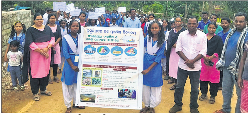
ଶୋଭାଯାତ୍ରାରେ ଛାତ୍ରଛାତ୍ରୀମାନେ ଗ୍ରାମ ପରିକ୍ରମା କରୁଛନ୍ତି ।