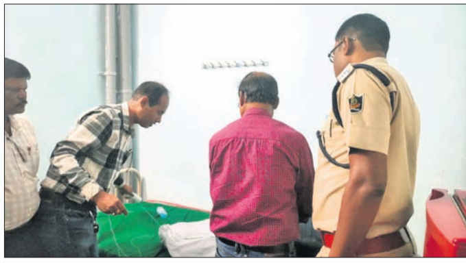
ଅଧିକାରୀମାନେ ଅଲଗ୍ରାସାଉଣ୍ଡ ମେଶିନକୁ ସିଲ୍ କରୁଛନ୍ତି ।