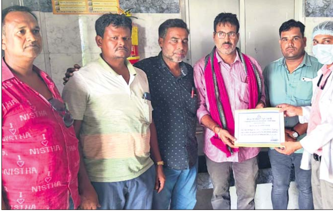
ମୃତକଙ୍କ ପରିବାର ଲୋକେ ଚକ୍ଷୁଦାନ ପ୍ରମାଣପତ୍ର ଗ୍ରହଣ କରୁଛନ୍ତି।

ହୋଇଥିଲେ। ଘାନୀୟ ଲୋକେ ତାଙ୍କୁ ଉଦ୍ଧାର କରି ଲିମ୍ବା ଚକ୍ଷୁ ଡାକ୍ତରଖାନାକୁ ଆଣିଥିଲେ। ମାତ୍ର ଡାକ୍ତର ତାଙ୍କୁ ମୃତ ଘୋଷଣା କରିଥିଲେ। ସାମାଜିକ ଅନୁଷ୍ଠାନ ନିଷ୍ଠା ପରିବାରର ଅନୁରୋଧକ୍ରମେ