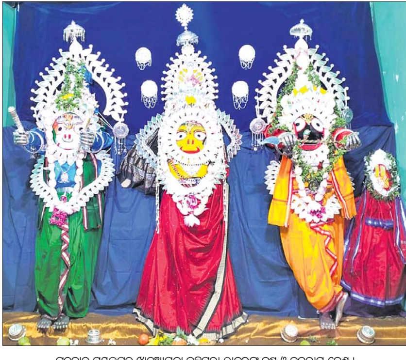
ଗୁରୁବାର ସମ୍ବଲପୁର ଖଣ୍ଡୁଆପତା ବ୍ରହ୍ମପୁରା ଠାକୁରଙ୍କୁ କୃଷ୍ଣ ଓ ବଳରାମ ବେଶ।