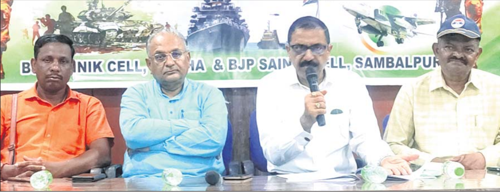
ଭାଜପା ସୈନିକ ସେଲର ଖବରଦାତା ସମ୍ମିଳନୀରେ ଉପସ୍ଥିତ କର୍ମଚାରୀଗଣ।