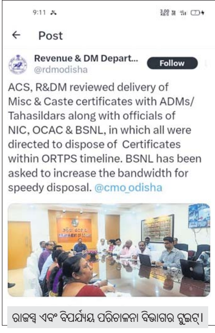
ରାଜସ୍ୱ ଏବଂ ବିପର୍ଯ୍ୟୟ ପରିଚାଳନା ବିଭାଗର ଗୁରୁତ୍ୱ।

ତହସିଲର ଖେତସାଧକଗୁଡ଼ିକ ସରଭର କାମ ହେବା ଯୋଗୁ ଠିକ୍ ଭାବରେ ଖୋଲୁନାହିଁ। ଏଥିଯୋଗୁ ହଜାରହଜାର ପ୍ରମାଣପତ୍ର ଆବେଦନ ପଡ଼ିରହିଛି। ଏ ସମ୍ପର୍କରେ ଖବର ୧୧୭ତାରିଖ ଧରିପ୍ରାରେ ପ୍ରକାଶ ପରେ ରାଜ୍ୟ ରାଜସ୍ୱ ବିଭାଗ ଏହାକୁ ଗୁରୁତର ସହ ନେଇଛି।