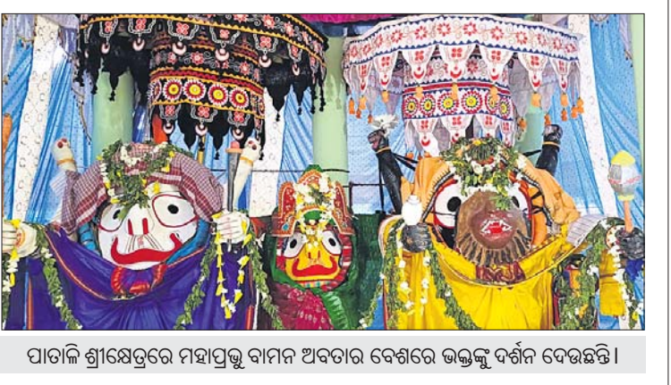
ପାଟଣା ଶ୍ରୀକ୍ଷେତ୍ରରେ ମହାପ୍ରଭୁ ବାମନ ଅବତାର ଦେଖିବାକୁ ଭକ୍ତଙ୍କୁ ଦର୍ଶନ ଦେଉଛନ୍ତି ।