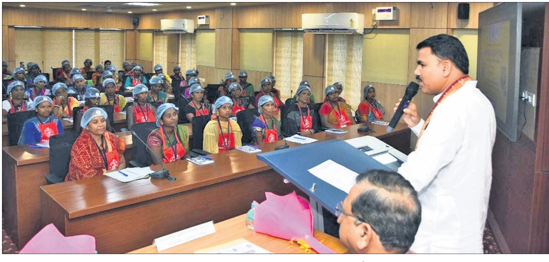
ପିଏମ୍-ପୋଷଣ ପ୍ରଶିକ୍ଷଣ ଶିବିରରେ ମନ୍ତ୍ରୀ ନିତ୍ୟାନନ୍ଦ ଗଣ ପାଟିକା ଓ ସହାୟକାଳୁ ପରାମର୍ଶ ଦେଉଛନ୍ତି।

ଭୁବନେଶ୍ୱର, ୧୧୭(ଅସମାପିତା ସାହୁ) ସରକାରୀ ବିଦ୍ୟାଳୟରେ ପଢୁଥିବା ଛାତ୍ରଛାତ୍ରୀଙ୍କୁ ସୁରକ୍ଷିତ ଓ ସ୍ୱାସ୍ଥ୍ୟକର ମଧ୍ୟାହ୍ନଭୋଜନ ଯୋଗାଇଦେବା ଲକ୍ଷ୍ୟରେ ପୁଷ୍ଟିକର ମିଶ୍ରଣ ଶକ୍ତି ଭବନ ପରିସରରେ ବୁଲିଦିଆ ପ୍ରଶିକ୍ଷଣ ଆରମ୍ଭ ହୋଇଛି। ବିଦ୍ୟାଳୟ ଓ ଗଣଶିକ୍ଷା ମନ୍ତ୍ରୀ ନିତ୍ୟାନନ୍ଦ ଗଣ ପୁଷ୍ଟି ଅଭିଯାନ ଉପରେ ଯୋଗଦେଇ ଏହାକୁ ଉତ୍ସାହରେ କରୁଛନ୍ତି। ଭାରତ ସରକାରଙ୍କ ପିଏମ୍-ପୋଷଣ, ମିଳିତ କାଟିଙ୍ଗ୍, ବିଶ୍ୱ ଖାଦ୍ୟ ସଂଗଠନ ଏବଂ ଓଡ଼ିଶା ସରକାରଙ୍କ ଗଣଶିକ୍ଷା ବିଭାଗ ପକ୍ଷରୁ ଆୟୋଜିତ ଏହି କାର୍ଯ୍ୟକ୍ରମରେ ପିଲାମାନଙ୍କୁ ପୋଷଣମୁକ୍ତ ମଧ୍ୟାହ୍ନଭୋଜନ ଯୋଗାଇବା ସମ୍ପର୍କରେ ଆଲୋଚନା କରାଯାଇଛି। ଓଡ଼ିଶାରୁ ଅପସ୍ଥିତ ରୁନାକରଣ ଓ କିପରି ପୁଷ୍ଟିକର ମଧ୍ୟାହ୍ନଭୋଜନ