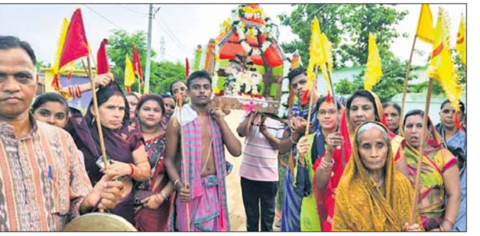
ଧର୍ମାତ୍ମକରେ ଲକ୍ଷ୍ମୀକୁ ବିମାନ ଯୋଗେ ନିଆଯାଇଛି ।

ଖପ୍ରାଖୋଲ, ୧୧୭(ଅଭୟ ତ୍ରିପାଠୀ) ଖପ୍ରାଖୋଲ ବ୍ଲକ୍ ଧର୍ମାତ୍ମକ ଗାଁରେ ହେବାପଞ୍ଚମୀ ଉତ୍ସବ ଗୁରୁବାର ପାଳିତ ହୋଇଯାଇଛି । ଗାଁର ଜଗନ୍ନାଥ ମନ୍ଦିରରୁ ଏକ ଶୋଭାଯାତ୍ରାରେ ଅଭିନୀତା ମା' ଲକ୍ଷ୍ମୀ ବିମାନ ଯୋଗେ ମାଉସୀ ମା' ମନ୍ଦିର ଯାଇ ଜଗନ୍ନାଥ ମନ୍ଦିର ନିକଟରେ ଅର୍ପଣ କରାଯାଇଛି ।