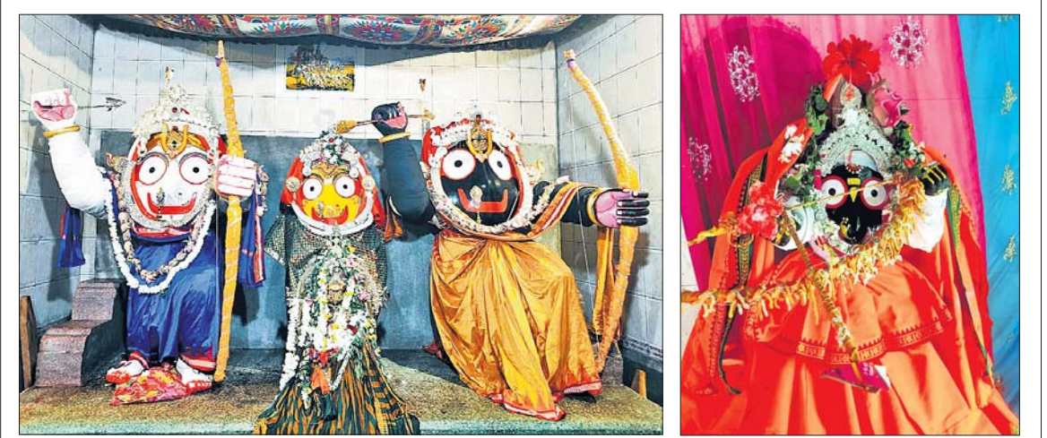
ସୋନପୁର ଗୁଣ୍ଡିଚା ମନ୍ଦିରରେ ଶ୍ରୀ ଜୀଉ ରାମ ଲକ୍ଷ୍ମଣ ବେଶରେ ଭକ୍ତଙ୍କୁ ଦର୍ଶନ ଦେଉଛନ୍ତି(ବାମ), ସୋନପୁର ବୃନ୍ଦାବନ ବିହାରୀ ମନ୍ଦିରରେ ଜଗନ୍ନାଥ ରାମ ବେଶରେ ଭକ୍ତଙ୍କୁ ଦର୍ଶନ ଦେଉଛନ୍ତି ।