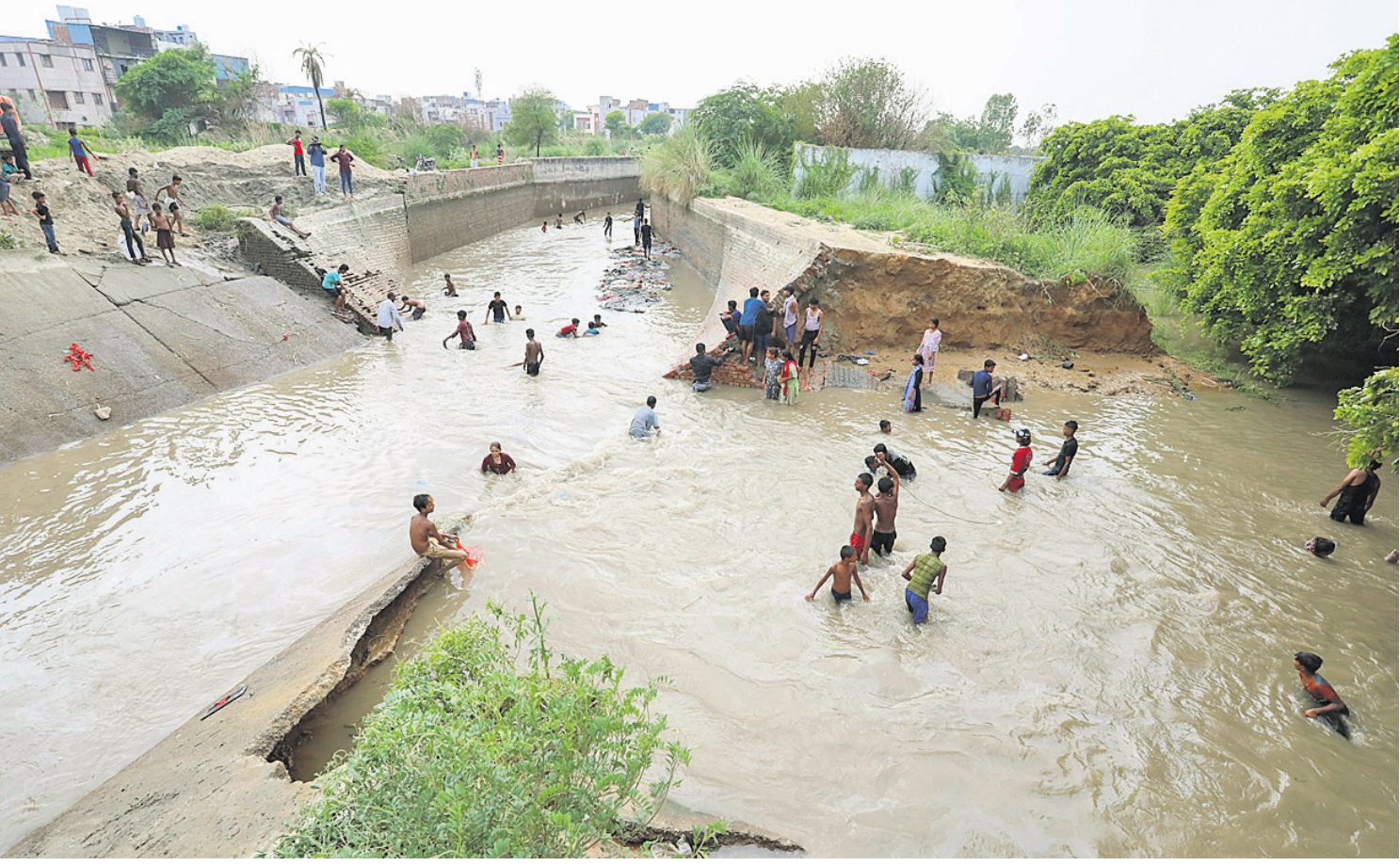
ହରିୟାଶାଠୁ ଦିଲ୍ଲୀକୁ ପ୍ରବାହିତ ମୁନକ୍ କେନାଲ ଲୁଣ୍ଠିବା ପରେ ରାଜଧାନୀର ବଢ଼ାମାସ୍ତିତ ଜେଜେ କଲୋନି ଜଳମୟ ହୋଇଯାଇଛି।