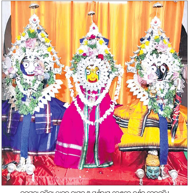
ନନ୍ଦପତା ବରିହା ଠାକୁର ବାମନ ଓ ପର୍ଶୁରାମ ବେଶରେ ଦର୍ଶନ ଦେଉଛନ୍ତି।