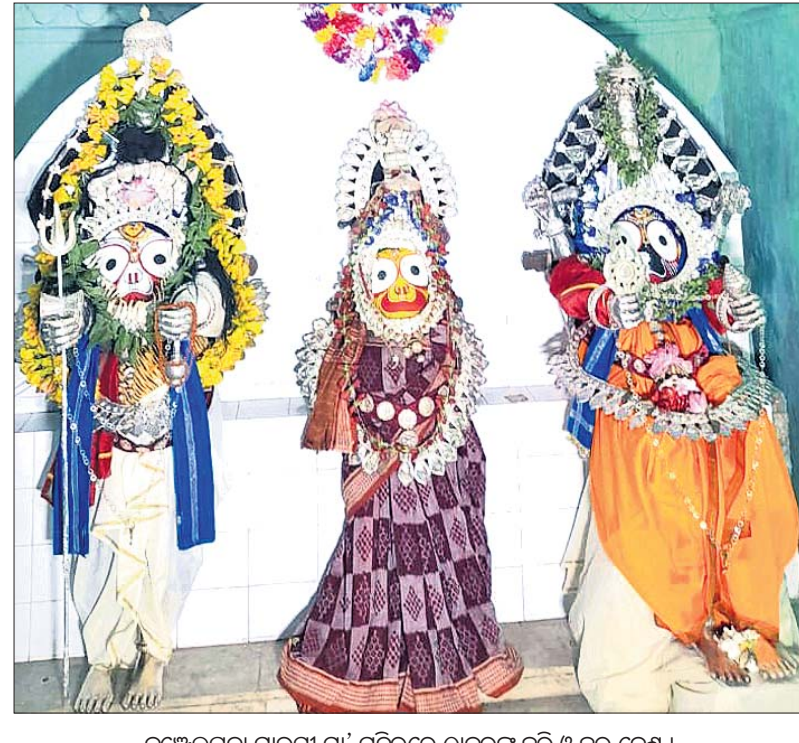
କୁଞ୍ଜଳାପତା ମାଉସୀ ମା' ମନ୍ଦିରରେ ଠାକୁରଙ୍କୁ ହରି ଓ ହର ବେଶ।