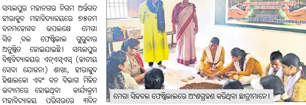
ମେଗା ସିଡ଼ବଲ୍ ଫେଷ୍ଟିଭାଲରେ ଅଂଶଗ୍ରହଣ କରିଥିବା ଛାତ୍ରୀମାନେ।