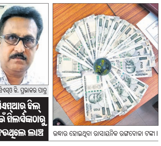
ଚିପ୍ ସିଏସ୍‌ସ୍ ଉପରେ ପୁଲିସ୍ ଠାକୁରାଣୀଙ୍କୁ ଅନୁରୋଧ କରାଯାଇଛି।

ସୋନପୁର, ୧୨.୭.୨୪(ପ୍ରଭାତ ପାଣିଗ୍ରାହୀ) ଭିଜିଲାନ୍ସ ଜାଲରେ ବଲାଙ୍ଗୀର ଚିପ୍ ସିଏସ୍‌ସ୍ ଉପରେ ପୁଲିସ୍ ଠାକୁରାଣୀଙ୍କୁ ଅନୁରୋଧ କରାଯାଇଛି।