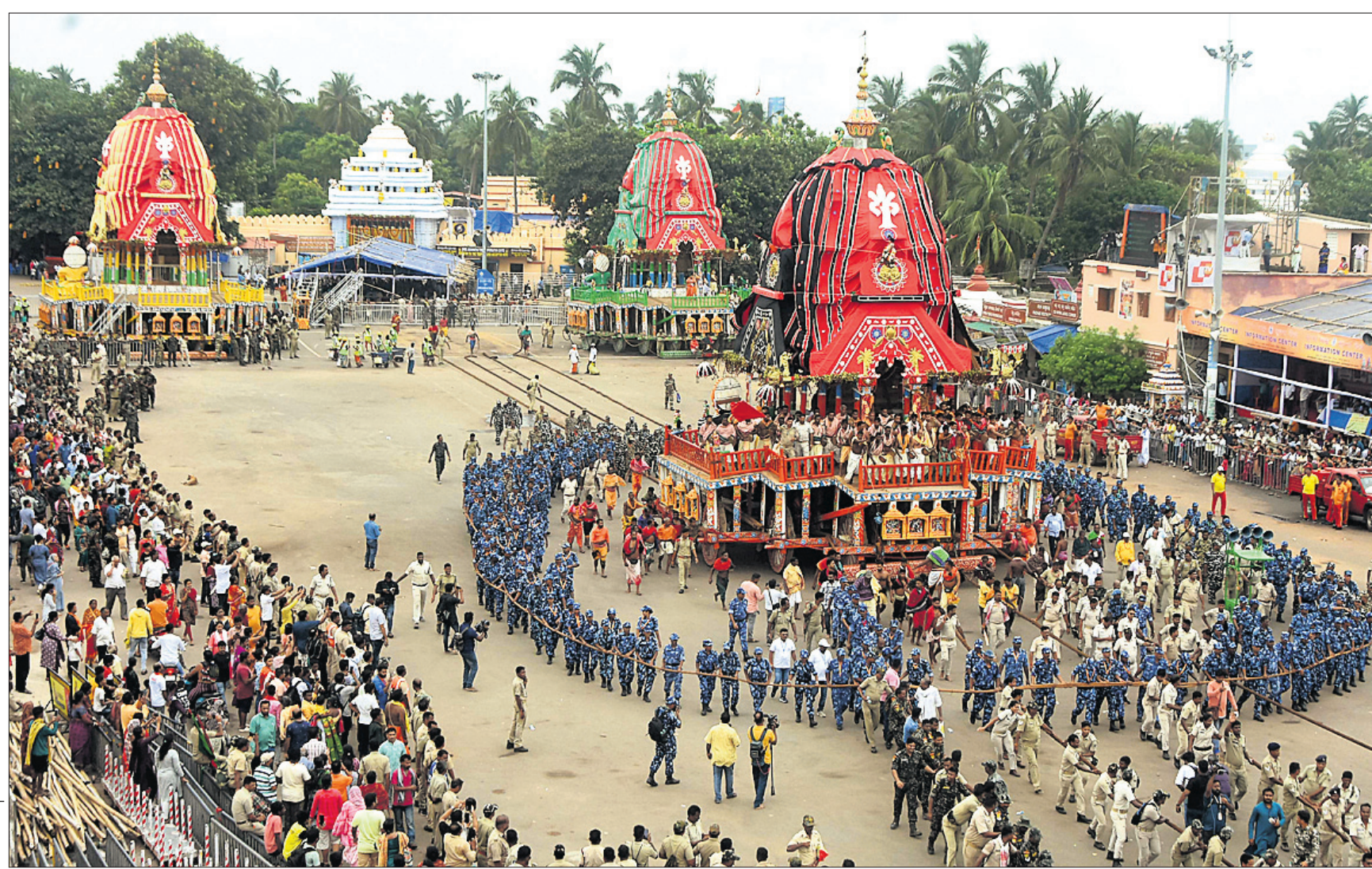
ପୁରୀ ଗୁଣ୍ଡିଚା ମନ୍ଦିର ସମ୍ମୁଖ ଶରଧାବାଲିରେ ଶୁକ୍ରବାର ତିନି ଠାକୁରଙ୍କ ରଥର ଦକ୍ଷିଣୋଦ୍ଗମ କରାଯାଇଛି।

ଓଡ଼ିଶାରେ ଡେବୁ କଲେ ରିଡେଶ 'ପିଲ' ଷ୍ଟେଟ୍ ସିରିଜ ସହ ଅଭିନେତା ରିଡେଶ ଦେଶମୁଖ ଓଡ଼ିଶାରେ ଡେବୁ କରିଛନ୍ତି।