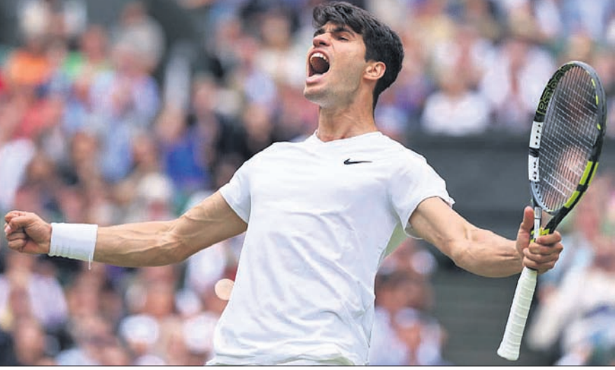
ସେମିଫାଇନାଲ ଜିତିବାପରେ ଉଲ୍‌କାରାଜ ଫାଇନାଲରେ ଯିବେ

ଫ୍ରେମଲଡନ, ୧୨।୭ ଡିପେଣ୍ଡେଣ୍ଟ ଚାମ୍ପିୟନ ଶ୍ରେୟର କାର୍ଲୋସ ଅଲ୍‌କାରାଜ ଚଳିତ ଫ୍ରେମଲଡନ ଓପନ ଗ୍ରାଣ୍ଡସ୍ଲାମ ଚେମ୍ପିୟନ୍ ପୁରୁଷ ସିଙ୍ଗଲ୍ ଫାଇନାଲରେ ପ୍ରବେଶ କରିଛନ୍ତି। ଶୁକ୍ରବାର ସେଣ୍ଟର କୋର୍ଟରେ ଅନୁଷ୍ଠିତ ପ୍ରଥମ ସେମିଫାଇନାଲରେ