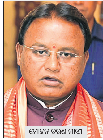
ମୋହନ ଚରଣ ମାଝୀ

ପ୍ରାଣ ବଜେଟ୍ ଆଲୋଚନା: ଅନୁଲୋଚନାରେ ମିଳିଛି ୧୨ ହଜାରରୁ ଊର୍ଦ୍ଧ୍ୱ ମତାମତ ଆଶା ଆକାଂକ୍ଷାକୁ ପ୍ରତିଫଳିତ କରିବ, ସେଥିପାଇଁ ଉଦ୍ୟମ କାରିରହିଛି। ସେଥିପାଇଁ ସବୁ ବର୍ଗର ଲୋକମାନଙ୍କ ମତାମତ ଗ୍ରହଣ କରାଯାଉଛି। ଲୋକଙ୍କ ସରକାର ଭାବରେ ସାଧାରଣ ଜନତାଙ୍କ ମତାମତକୁ ଗୁରୁତ୍ୱ ଦେଇ ଆସୁଛି। ୨୦୨୪-୨୫ ଅର୍ଥକ୍ଷେତ୍ର ପାଇଁ ପ୍ରାଣ ବଜେଟ୍ ଆଗାମୀ ୨୫ ତାରିଖରେ ବିଧାନସଭାରେ ଉପସ୍ଥାପନ ହେବାର କାର୍ଯ୍ୟକ୍ରମ ରହିଛି। ଏଥିପାଇଁ ଅନୁଲୋଚନା କରାଯିବ।