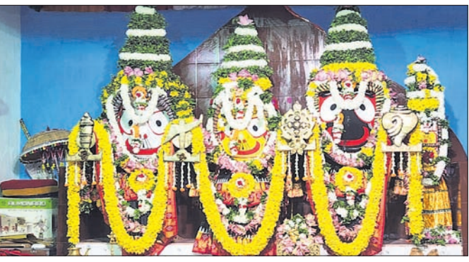
ନାଲକୋନଗରରେ ମହାପ୍ରଭୁଙ୍କ ନବାଙ୍କ ବେଶ।