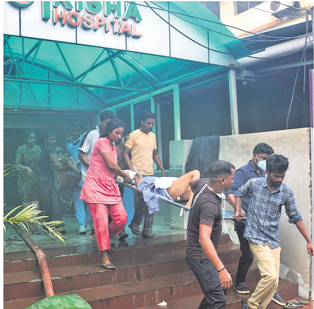
ତ୍ରିଶା ନର୍ସିଂହୋମ୍ରେ ନିଆଁ ଲାଗିବା ପରେ ରୋଗୀଙ୍କୁ ଉଦ୍ଧାର କରି ବାହାରକୁ ନିଆଯାଇଛି।