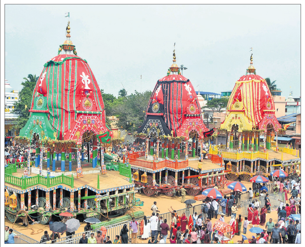
ବାହୁଡ଼ା ଯାତ୍ରା ପାଇଁ ଶନିବାର ଶ୍ରୀଗୁଣ୍ଡିଚା ମନ୍ଦିର ନାକତଣା ଦ୍ୱାର ସମ୍ମୁଖରେ ଦଶାହମୀନା ଥିବା ଦିନ ରଥ।