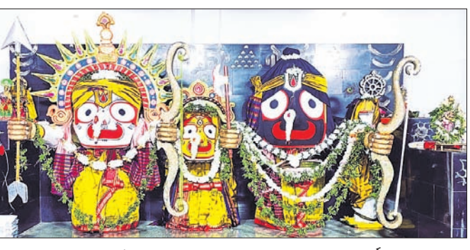
ଅନୁଗୋଳ ମାଉସୀ ମା' ଘର ଆଡ଼ପ ମଞ୍ଚପରେ ଠାକୁରଙ୍କ ରାମ ପର୍ଣ୍ଣରାମ ବେଶ।