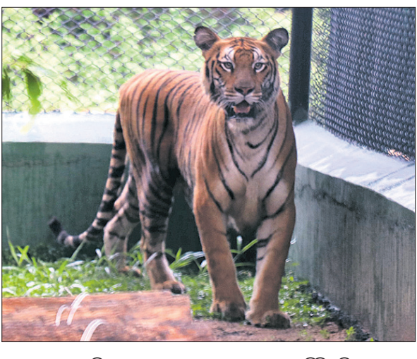
ମଙ୍ଗଳବାର ରୋଡିଏ ମାଲ ଧଳା ବାଘ, ୪ ଗୁରାଞ୍ଜି, ୪ ଶାଳିଆପତନ, ୨ ଭାରତୀୟ କୋକିଶିଆଳି, ୨ ଧୂସର ବରାହନା ପକ୍ଷୀ, ୨୦ ଅକ୍ଷରୀ ବର,

ବାରଙ୍ଗ, ୧୩।୭ (ଲିଲରାଜ ରାଉତ) ନନ୍ଦନକାନନ ପ୍ରାଣୀ ମଧ୍ୟରେ ନୂଆ ରକ୍ତ ସମ୍ପର୍କ ସୃଷ୍ଟି ଓ ବିଶ୍ୱସ୍ତରୀୟ ଚିତ୍ରାଖାନାରେ ପରିଣତ କରିବା ଲକ୍ଷ୍ୟ ନେଇ ପ୍ରାଣୀ ଅବଳବଦଳ ପ୍ରକ୍ରିୟା ଆରମ୍ଭ ହୋଇଛି। ଏହି ଆଧାରରେ କେନ୍ଦ୍ରୀୟ ଚିତ୍ରାଖାନା କର୍ତ୍ତୃପକ୍ଷଙ୍କ ଅନୁମୋଦନକୁ ମେ ରାଷ୍ଟ୍ରର ଭଗବାନ ବିର୍ସା ପ୍ରାଣୀ ଉଦ୍ୟାନ ଓ ନନ୍ଦନକାନନ ମଧ୍ୟରେ ପ୍ରାଣୀ ଅବଳବଦଳ ପ୍ରକ୍ରିୟା ଶନିବାର ଶେଷ ହୋଇଛି। ପ୍ରଥମକରି ବନପ୍ରାଣୀ ଚିକିତ୍ସକ, ବନପାଳ, ବନରକ୍ଷା ଓ ପ୍ରାଣୀ ରକ୍ଷକ ସମେତ ରାଷ୍ଟ୍ର ଆସିଥିବା ଏକ ଦଳ ନନ୍ଦନକାନନରୁ ଗତ