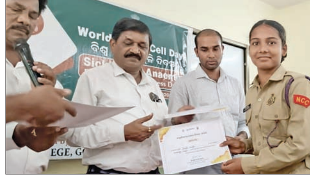
କାର୍ଯ୍ୟକ୍ରମରେ ଜଣେ ଛାତ୍ରୀଙ୍କୁ ପୁରସ୍କୃତ କରାଯାଇଛି ।

ପରେ ସେହି ବ୍ୟକ୍ତି ଜଣକ ଅନଲାଇନରେ କିଛି କାରବାର କରିବାକୁ କହିଥିଲେ । ଏହାପରେ ମହିଳାଙ୍କ ବ୍ୟାଙ୍କ ଆକାଉଣ୍ଟରୁ ୮୦ ହଜାର ଟଙ୍କା କଟିଯାଇଥିଲା । ପରେ ମହିଳା ଜଣକ ସଂପୃକ୍ତ ବ୍ୟକ୍ତିଙ୍କ ସହ ଯୋଗାଯୋଗ ପାଇଁ ଚେଷ୍ଟା କରି ବିଫଳ ହୋଇଥିଲେ । ଏହାପରେ ମହିଳା ଜଣକ ନିଜ ବ୍ୟାଙ୍କ ଶାଖାକୁ ଯାଇ ଅଭିଯୋଗ କରିଥିଲେ । ବ୍ୟାଙ୍କ କର୍ତ୍ତୃପକ୍ଷଙ୍କ ପରାମର୍ଶ କ୍ରମରେ ମହିଳା ଜଣକ ସଦର ଥାନାକୁ ଯାଇ ଲିଖିତ ଅଭିଯୋଗ କରିଥିଲେ । ତାଙ୍କ ଅଭିଯୋଗ ପ୍ରକାରେ ସଦର ଥାନା ପୋଲିସ କେସ ନଂ ୨୨୩୩/୨୪ ରେ ଏକ ମାମଲା ରୁଜୁ କରି ତଦନ୍ତ କରୁଥିବା କହିଛି ।