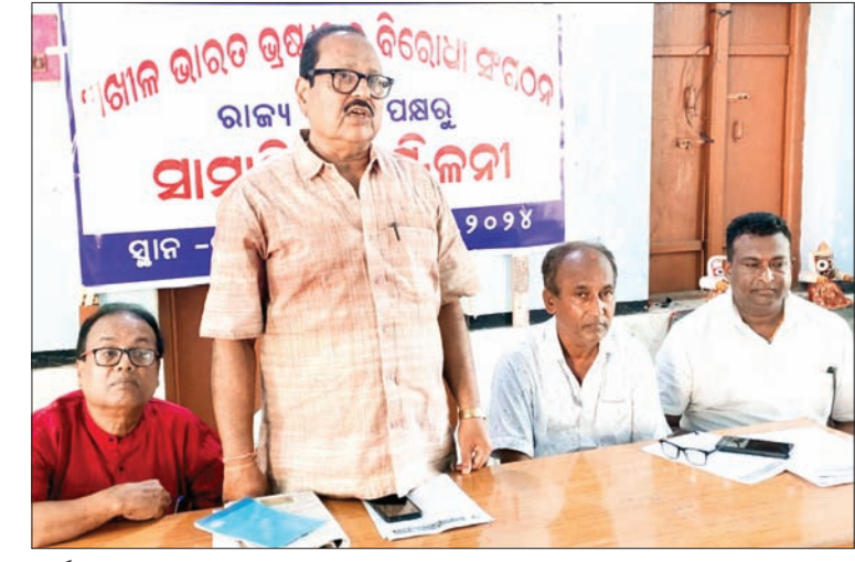
କାର୍ଯ୍ୟକ୍ରମରେ ଉପସ୍ଥିତ ସଂଗଠନର ସଦସ୍ୟ ।