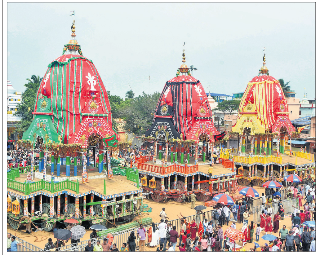
ବାହୁଡ଼ା ଯାତ୍ରା ପାଇଁ ଶନିବାର ଶ୍ରୀଗୁଣ୍ଡିଚା ମନ୍ଦିର ନାକତଣା ଦ୍ୱାର ସମ୍ମୁଖରେ ଦଶାହମାନ ଥିବା ଦିନ ରଥ ।

ଶ୍ରୀଗୁଣ୍ଡିଚା ମନ୍ଦିରରେ ରବିବାର ଦାରୁଦିଅଁଙ୍କ ନବମୀ ଦର୍ଶନ ତଥା ସନ୍ଧ୍ୟା ଦର୍ଶନ ଅନୁଷ୍ଠିତ ହେବ । ଏଥିଲାଗି ଭକ୍ତଙ୍କ ପ୍ରବଳ ଗହଳି ହେବାର ସମ୍ଭାବନା ରହିଛି । ସନ୍ଧ୍ୟା ଦର୍ଶନ ପରଦିନ ଦଶମୀ ତିଥିରେ ସୋମବାର ବାହୁଡ଼ା ଯାତ୍ରା ଅନୁଷ୍ଠିତ ହେବ । ବାହୁଡ଼ା ଯାତ୍ରା ପାଇଁ ଅନେକ ଗୁପ୍ତନାତି ନବମୀ ରାତିରେ ସମ୍ପନ୍ନ କରାଯିବ । ତେଣୁ ଚଳିତ ବର୍ଷ ସ୍ୱତନ୍ତ୍ର ନାତି ନିମନ୍ତେ ରବିବାର ଅପରାହ୍ଣ ୫ଟାରେ ଦର୍ଶନ ବନ୍ଦ ରହିବ । ଅପରାହ୍ଣ ୫ଟା ପରେ ମହାପ୍ରଭୁଙ୍କ ନାତି ଆରମ୍ଭ ହେବ । ଶ୍ରୀମନ୍ଦିର ପ୍ରଶାସନର ସୂଚନା ଅନୁଯାୟୀ, ୧୪ ଚାରିଖରେ ମହାପ୍ରଭୁଙ୍କ ସନ୍ଧ୍ୟା ଦର୍ଶନ ନାତି ହେବ । ଉକ୍ତ ଦିନ ସକାଳୁ ଅପରାହ୍ଣ ୫ଟା ପର୍ଯ୍ୟନ୍ତ ଦର୍ଶନ ଚାଲିବ । ଅପରାହ୍ଣ ୫ଟା ପରେ ଦର୍ଶନ ବନ୍ଦ କରାଯିବ । ତେଣୁ ନିର୍ଦ୍ଧାରିତ ସମୟ ମଧ୍ୟରେ ଆସି ମହାପ୍ରଭୁଙ୍କ ଦର୍ଶନ କରିବାକୁ ଭକ୍ତଙ୍କୁ ଅନୁରୋଧ କରାଯାଇଛି । ଦର୍ଶନ ବନ୍ଦ ଓ ଭକ୍ତମାନେ ମନ୍ଦିର ପରିସରକୁ ବାହାରିବା ପରେ ନାତି ଆରମ୍ଭ ହେବ । ଜିଲାପାଳ ସିଦ୍ଧାର୍ଥ ଶିଳର ସ୍ୱାଇଁ କହିଛନ୍ତି, ମହାପ୍ରଭୁଙ୍କ ନାତିକାନ୍ତି ନିର୍ଦ୍ଧାରିତ ସମୟରେ ଭାରି ରହିଛି । ସୋମବାର ବାହୁଡ଼ା ଯାତ୍ରା ଥିବାରୁ ଅନେକ ଗୁପ୍ତନାତି ଅନୁଷ୍ଠିତ ହେବ । ତେଣୁ ଅପରାହ୍ଣ ୫ଟା ପର୍ଯ୍ୟନ୍ତ ସର୍ବସାଧାରଣ ଦର୍ଶନ ଚାଲିବ । ଏହାପରେ ଦର୍ଶନ ବନ୍ଦ ହୋଇ ନାତି ଆରମ୍ଭ ହେବ । ଚଳିତ ବର୍ଷ ଅଧିକ ସଂଖ୍ୟାରେ ଭକ୍ତଙ୍କ ସମାଗମ ହେବାର ସମ୍ଭାବନା ଥିବାରୁ ପୂର୍ବବର୍ଷ ଅପେକ୍ଷା ଅଧିକ ୧ଘଣ୍ଟା ଅବଧି ବୃଦ୍ଧି କରାଯାଇଛି । ବାହୁଡ଼ା ପହଞ୍ଚିବା ଶୁଖିଳିତ କରିବା ନିମନ୍ତେ ପ୍ରଶାସନ ପକ୍ଷରୁ ସମସ୍ତ ବ୍ୟବସ୍ଥା ଗ୍ରହଣ କରାଯାଇଛି । ତେବେ ନାତି ବିଳମ୍ବ ନେଇ ଯେଉଁ ଅଭିଯୋଗ ହେଉଛି, ତାହା ଉପରେ ଅସୁଧାନ କରାଯାଇଛି । ମୁଖ୍ୟତଃ ଭକ୍ତମାନେ ଗୁଣ୍ଡିଚା ମନ୍ଦିରରେ ମହାପ୍ରଭୁଙ୍କ ପାଖକୁ ଦର୍ଶନ କରିବାର ସୁଯୋଗ ପାଇଥାନ୍ତି । ତେଣୁ ଭକ୍ତଙ୍କ ମଧ୍ୟରେ ପ୍ରବଳ ଉତ୍ସାହ ରହିଥାଏ । ଦର୍ଶନ କରି ବାହାରିବାରେ