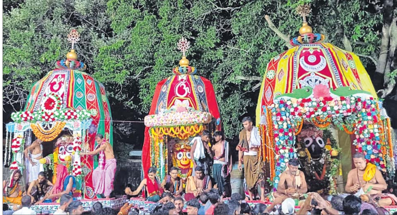
ଯାଜପୁର ସହର ଜଗନ୍ନାଥ ମନ୍ଦିର ନିକଟରେ ତିନି ରଥ ।