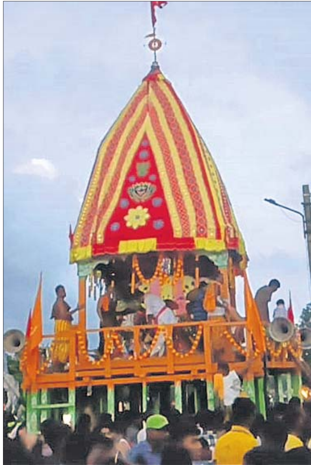
ବ୍ୟାସସରୋବର କ୍ଷେତ୍ରରେ ବାହୁଡ଼ା ରଥ ।