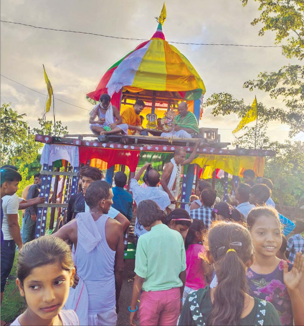
ରଗଡ଼ି ବାହୁଡ଼ା ରଥ ନିକଟରେ ପିଲାମାନେ ଶ୍ରୀଜୀଉଙ୍କୁ ଦର୍ଶନ କରୁଛନ୍ତି ।