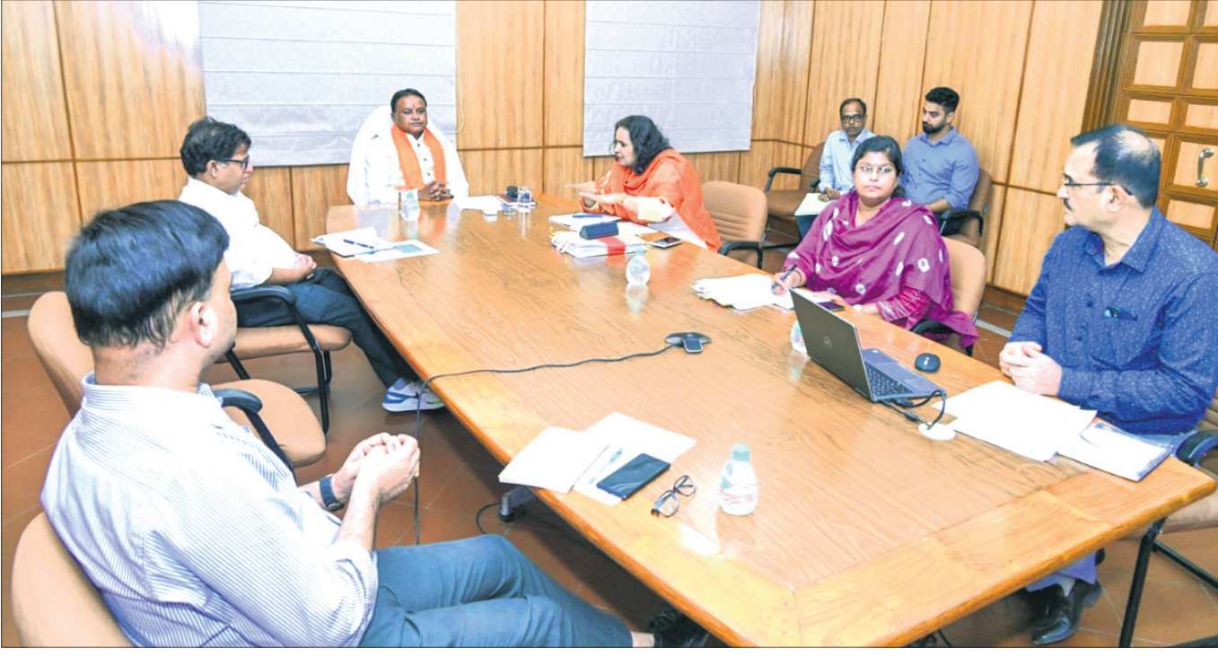
ଲୋକସଭା ଭବନରେ ଯୋଗଦାନ ଅନୁଷ୍ଠିତ ଆନ୍ଧ୍ର ରାଜ୍ୟ ଜଳସେଚନ ପ୍ରକଳ୍ପଗୁଡ଼ିକର ସମୀକ୍ଷା ଅବସରରେ ମୁଖ୍ୟମନ୍ତ୍ରୀ ମୋହନ ଚରଣ ମାଝୀ ଏବଂ ଅନ୍ୟ ବରିଷ୍ଠ ଅଧିକାରୀ।