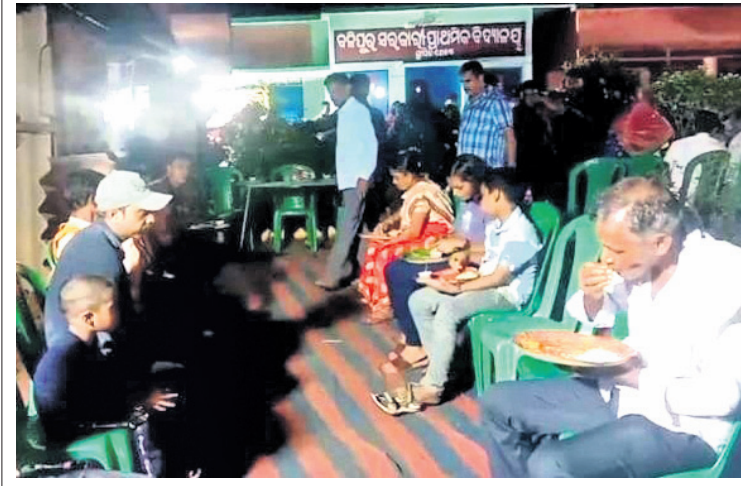
ବିଦ୍ୟାଳୟ ପରିସରରେ ବିବାହ ଉତ୍ସବ ପ୍ରାଥମିକ ଓ ଦ୍ୱିତୀୟ ଶିକ୍ଷକଙ୍କ ଦ୍ୱାରା ପରିଚାଳିତ ।

ଭଣ୍ଡାରିପୋଖରୀ, ୧୫୩୭(ରାଜ୍ୟ ଶତପଥୀ) ବିଦ୍ୟାଳୟ ପରିସରରେ ଏକ ବିବାହ ଉତ୍ସବକୁ ଅନୁମୋଦିତ ଭାବେ ଅତୁଆରେ ପଢ଼ିକୃତି ପ୍ରଧାନ ଶିକ୍ଷକ । ଏନେଇ ଅଭିଯୋଗ ପରେ ସ୍କୁଲ ଶିକ୍ଷା ଅଧିକାରୀ ଘଟଣାରେ ତଦନ୍ତ ନିର୍ଦ୍ଦେଶ ଦେଇଛନ୍ତି ।