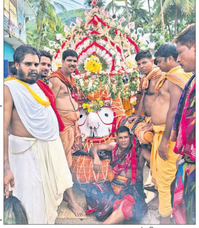
ରଣପୁରରେ ମାଉସୀ ମା' ମନ୍ଦିରରୁ ଶ୍ରୀ ବକଦେବ, ମା' ସୁଭଦ୍ରା, ଶ୍ରୀ ଜଗନ୍ନାଥଙ୍କୁ ସେବାୟତ ଓ ପୂଜକମାନେ ପହଞ୍ଚିବେ ନେଉଛନ୍ତି।