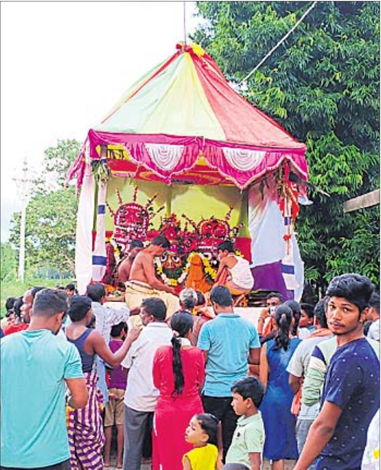
ଧର୍ମଶାଳା ବୁକ୍ ଭଉରପ୍ରତାପ ପଞ୍ଚାୟତ ନରସିଂହପୁରରେ ବାହୁଡ଼ା ଯାତ୍ରା ।