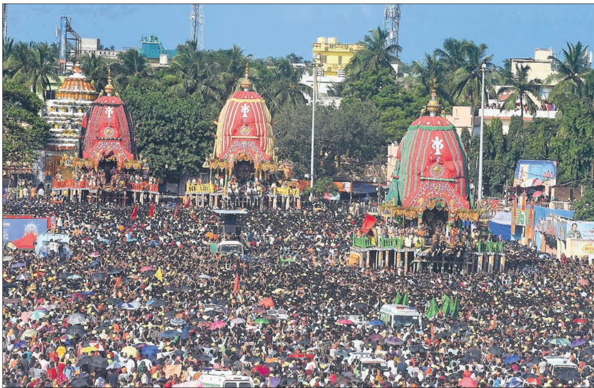
ବାହୁଡ଼ା ଯାତ୍ରା ଅବସରରେ ଯୋଗ୍ୟର ରଥାକୁଡ଼ି ବାହୁଡ଼ି ଗୁଣ୍ଡିଚା ମନ୍ଦିରକୁ ଶ୍ରୀମନ୍ଦିର ଅଭିଯୁକ୍ତ ବାହାରିଛନ୍ତି।

■ ସ୍ଥାନୀୟ ପ୍ରଶାସନ ଠିକ ଭାବେ ଅଭିଯୋଗ ଶୁଣାଣି ବୋଲି ନିର୍ଦ୍ଦେଶ ଦେଲେ ■ ସରକାରୀ ଅଧିକାରୀ ନିଜ କର୍ତ୍ତୃପକ୍ଷକୁ ଅଭିଯୋଗ ଶୁଣାଣି କେବଳ ଭୁବନେଶ୍ୱରରେ ସୀମିତ ନ ରଖି ଆର୍ଡିସି ସ୍ତରରେ ଅଭିଯୋଗ ଶୁଣାଣି ପାଇଁ ବିଚାର କରୁଛୁ। ଏହାସହ ଲୋକଙ୍କୁ ନ୍ୟାୟ ଫ୍ଟପୃଷ୍ଠା-୪