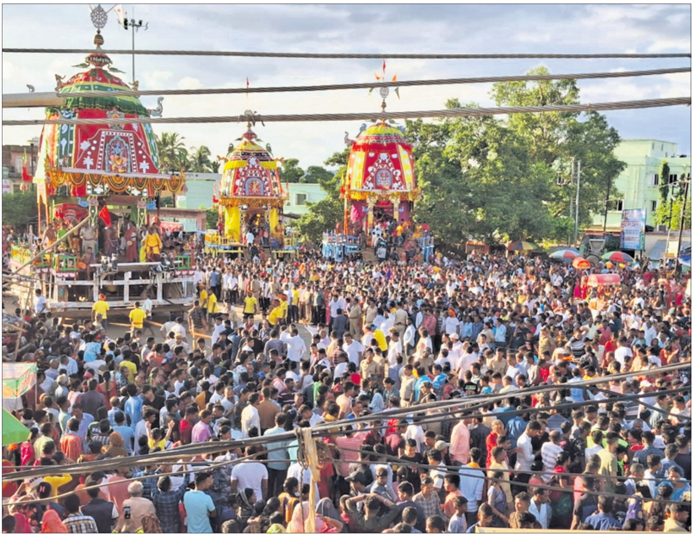
ରଣପୁର ବଡ଼ଦାଣ୍ଡରେ ୩ ରଥ ସମ୍ମୁଖରେ ଶ୍ରଦ୍ଧାଳୁଙ୍କ ଭିଡ଼।

ହେଇଥିଲା। ରଥ ରହି ରହି ଚାଲିଥିଲା। ଭକ୍ତମାନେ ତଥାପି ରଥକୁ ଚାଣି ନେଇ ସିଂହଦ୍ୱାରରେ ପହଞ୍ଚାଇଥିଲେ। ଏହାପରେ ରାତି ହୋଇଯିବାକୁ ରଥଟଣା କାର୍ଯ୍ୟକୁ ବନ୍ଦ ରଖା ଯାଇଥିଲା। ପବିତ୍ର ବାହୁଡ଼ାଯାତ୍ରା ଉପଲକ୍ଷେ ରଥଟଣା ଏକାଦଶୀ ତିଥିରେ ୩ ଠାକୁରଙ୍କ ରୂପାବେଶରେ ରଥ ଉପରେ ଶ୍ରଦ୍ଧାଳୁଙ୍କୁ ଦର୍ଶନ ଦେବେ। ଏହାପରେ ପଞ୍ଚଦୋଳ ପଡ଼ିଆରେ ରଣପୁର ଗଉଡ଼ିକୂଳ ପକ୍ଷରୁ ୩୮ ମ ଉଚ୍ଚନ ସମାରୋହ ରଥଟଣାରେ ସନ୍ଧ୍ୟାରେ ଆୟୋଜନ କରାଯିବାର କାର୍ଯ୍ୟାଳମ ରହିଛି। ଏଥିରେ ଓଡ଼ିଶାର ସୁନାମ ଧନ୍ୟ କଣ୍ଠଶିଳ୍ପୀ ସୋମବନ କରବେ ବୋଲି କୁବର ସମ୍ପାଦକ ପ୍ରକାଶ କରିଛନ୍ତି। ଶାନ୍ତିଶୁଖିଳା ରକ୍ଷା କରିବାକୁ ୨ ପ୍ଲାନୁ ଫୋର୍ସର ବ୍ୟବସ୍ଥା କରାଯାଇଥିଲା। ରୁରୁବାର ଶ୍ରୀମନ୍ଦିର ଭିତରକୁ ୩ ଠାକୁର ପ୍ରତ୍ୟାବର୍ତ୍ତନ ବାଟରେ ଲକ୍ଷ୍ମୀ ନାରାୟଣ ଭେଟ ହେବ ବୋଲି ଦେବୋତ୍ତର ବିଭାଗ ପକ୍ଷରୁ ସୂଚନା ଦିଆଯାଇଛି।