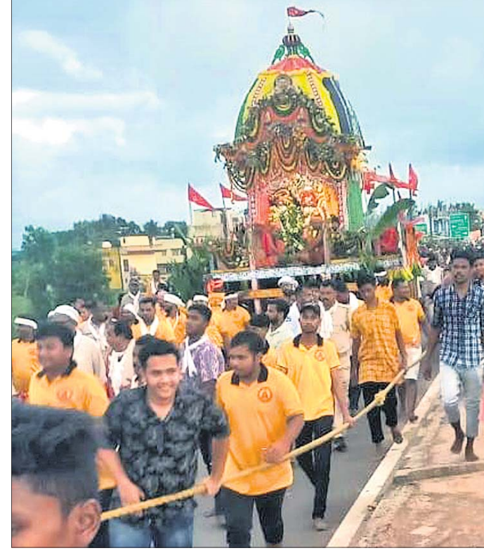
ଧର୍ମଶାଳାରେ ଶ୍ରୀଜୀଉଙ୍କ ରଥକୁ ଶ୍ରୀବାଲୁମାନେ ଚାରିନେଇଛନ୍ତି ।