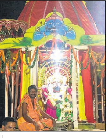
ଶରଣକୁଳରେ ୩ ରଥରେ ରଥାଚାରଣ ଠାକୁର।

ଖଣ୍ଡପଡ଼ା, ୧୫୭ (ଅଜୟ କୁମାର ମହାରଣା) : ଖଣ୍ଡପଡ଼ାରେ ଶ୍ରୀଜୀଉମାନଙ୍କ ବାହୁଡ଼ାଯାତ୍ରା ୪ ଦିନ ବ୍ୟାପୀ ଅନୁଷ୍ଠିତ ହେବ। ଠାକୁର ଜନ୍ମଦିନରେ ୨ ଦିନ ରହି ପରେ ସୋମବାର ଶ୍ରୀଜୀଉମାନେ ରତ୍ନବେଦିକୁ ବିଜେ ହେଉଛନ୍ତି। ସୋମବାର ଏହି ଅବସରରେ ଖଣ୍ଡପଡ଼ା, ଖଳିସାହି, ମର୍ଦ୍ଦରାଜପୁର ଓ କୁସାରପଡ଼ା ଗ୍ରାମରେ ବାହୁଡ଼ାଯାତ୍ରା ଦେଖିବାକୁ ଶ୍ରଦ୍ଧାଳୁମାନଙ୍କ ଭିଡ଼ ପରିଲକ୍ଷିତ ହୋଇଥିଲା। ଖଣ୍ଡପଡ଼ା ଦେବୋତ୍ତର ବିଭାଗ ପକ୍ଷରୁ ପରିଚାଳିତ ମହିମାମେଳା ଓ ରାଜ ପରିବାର ପକ୍ଷରୁ ପରିଚାଳିତ ଏକ ଜଗନ୍ନାଥ ପୂଜା ଉପରେ ସନ୍ଧ୍ୟା ପ୍ରାୟ ୬ ଘଣ୍ଟାରେ ବାହାରି ବଡ଼ଦାଣ୍ଡର ଖଣ୍ଡପଡ଼ା ଥାନା ନିକଟରେ