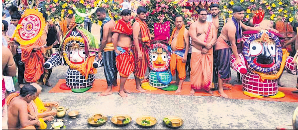
ନୟାଗଡ଼ରେ ପହଞ୍ଚିବେ ଆସୁଥିବା ୩ ଠାକୁରଙ୍କ ସମ୍ମୁଖରେ ଭୋଗ କରାଯାଇଛି।