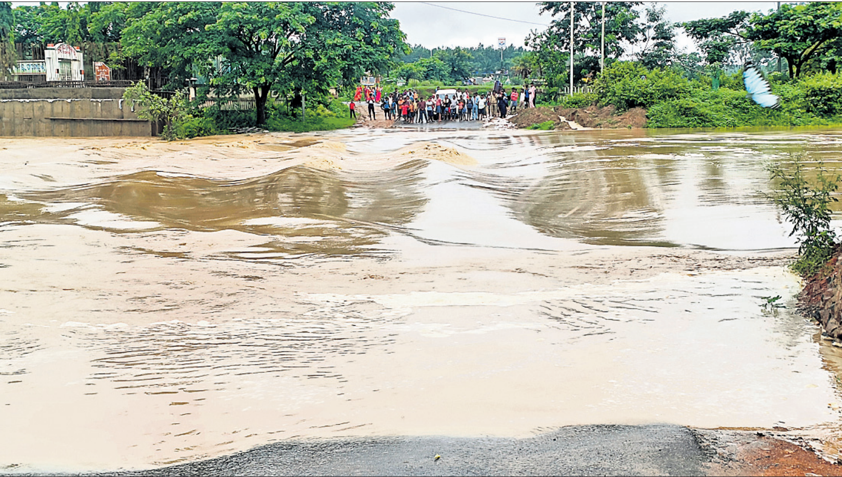
ରୁନା ନଦୀର ଅସ୍ଥାୟୀ ପୋଲ ଉପରେ ବର୍ଷାପାଣି ବହୁଥିବାରୁ ଯାନବାହନ ଅଟକି ରହିଛି ।