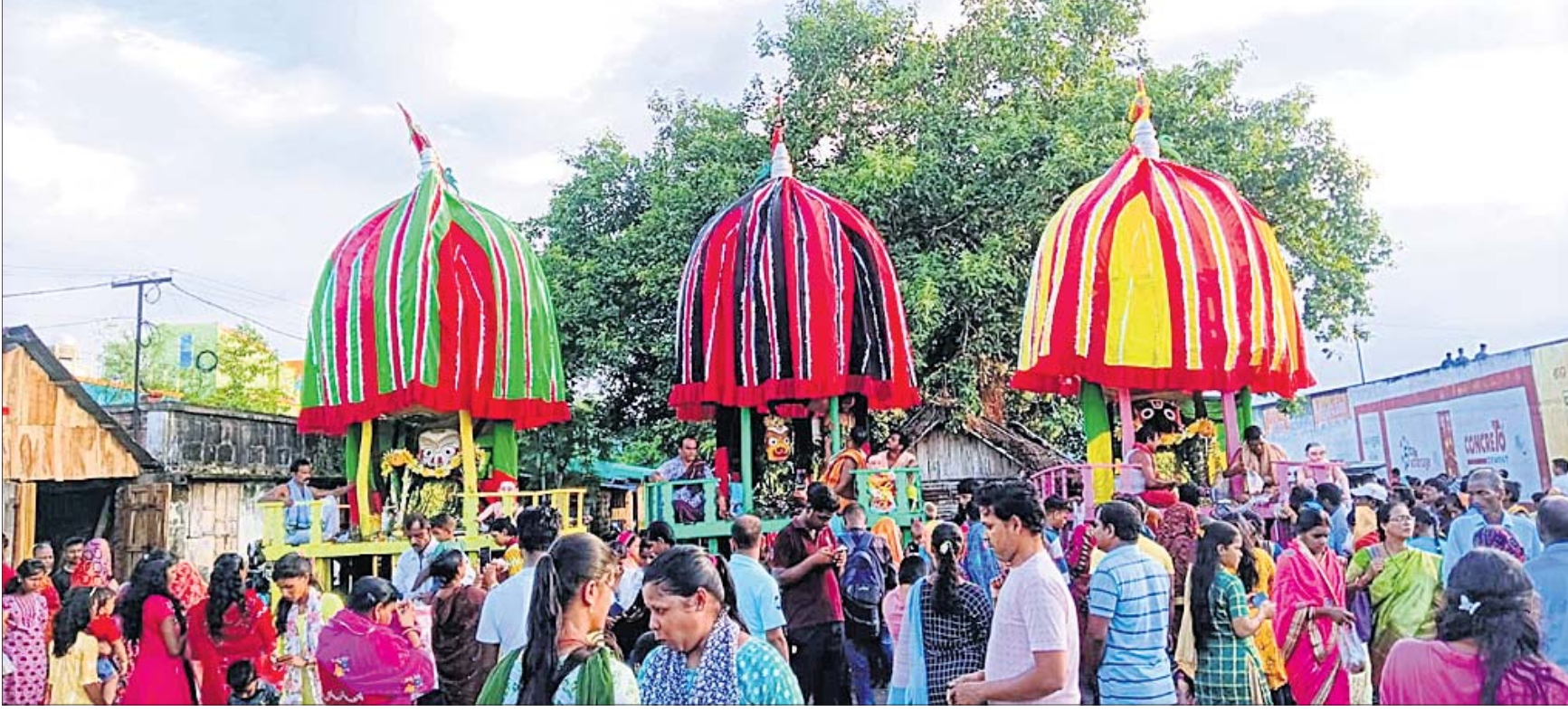
ଯାଜପୁର ଜିଲା ଛତିଆଠାରେ ଆୟୋଜିତ ବାହୁଡ଼ା ଯାତ୍ରାରେ ସାମିଲ ହୋଇଥିବା ଶ୍ରୀବାଲୁ ।