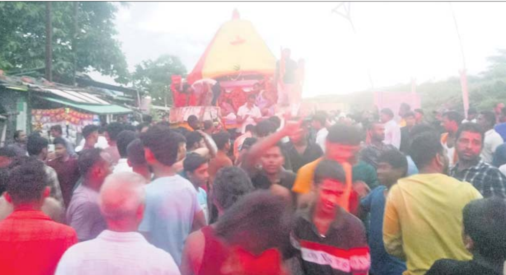
ବାଲିଚନ୍ଦ୍ରପୁର ରଥଯାତ୍ରାରେ ଶ୍ରୀବାଲୁଙ୍କ ଭିଡ଼ ।