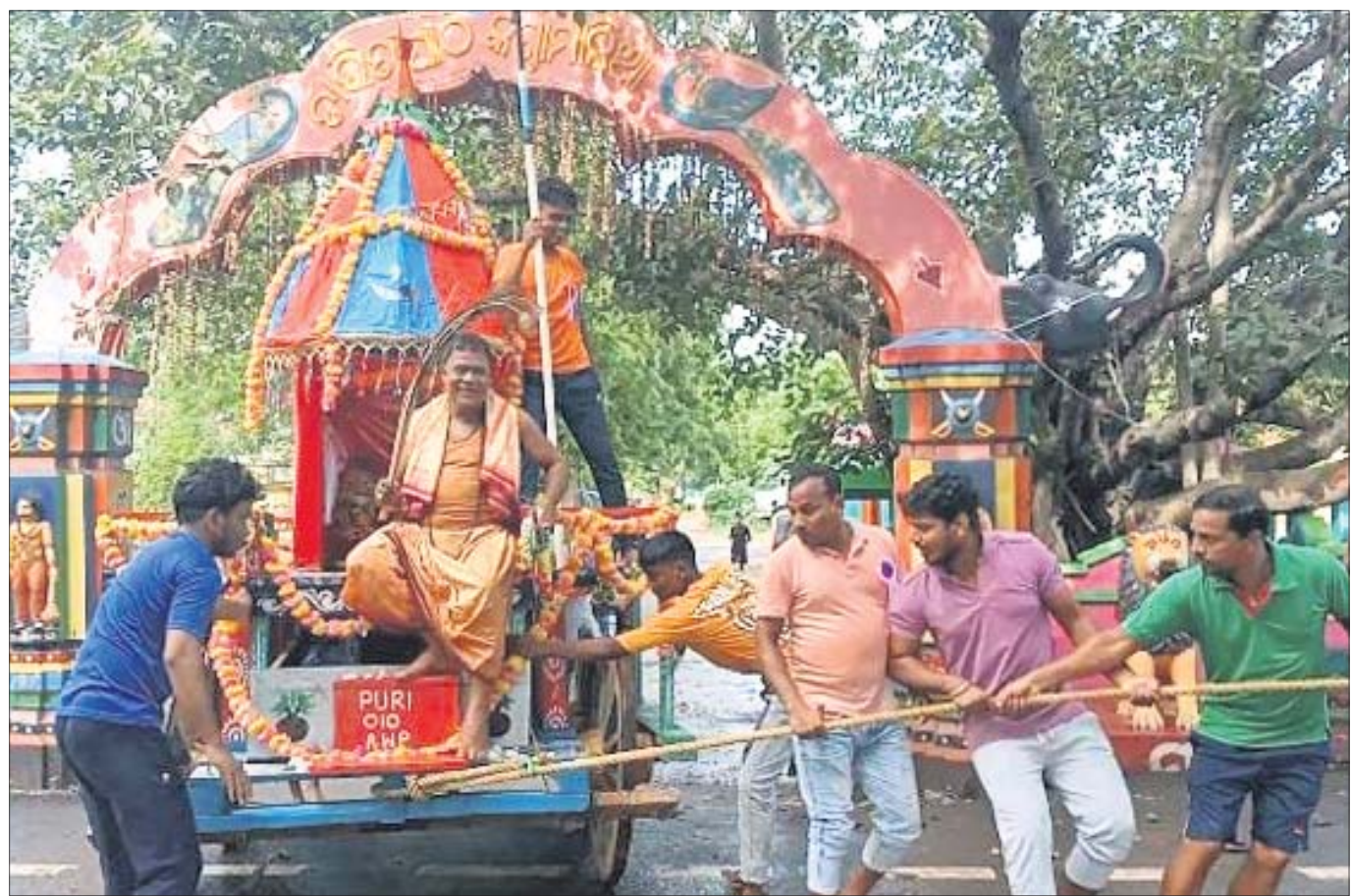
ଧର୍ମଶାଳା ବୁକ୍ ବନ୍ଧାମାଳିଆରେ ଭଦ୍ରମାନେ ରଥକୁ ଚାରିନେଇଛନ୍ତି ।