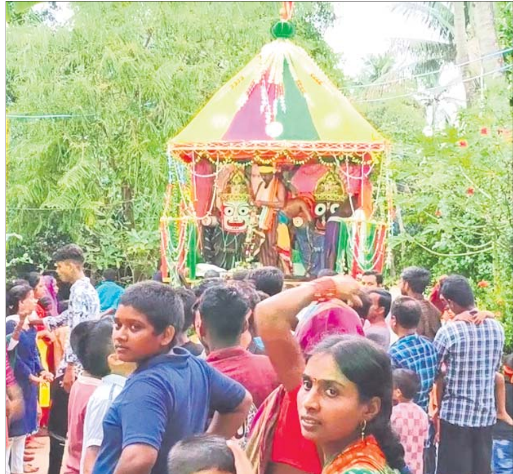
ବଡ଼କାଏଦା ପଞ୍ଚାୟତ ଅରଖପଦା ଗ୍ରାମରେ ବାହୁଡ଼ା ରଥରେ ତିନିଠାକୁର ।