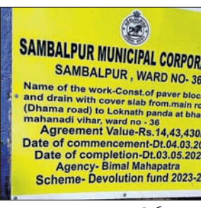
ରାସ୍ତା ରାସ୍ତା ଓ ଡ୍ରେନ୍ ନିର୍ମାଣ ପାଇଁ ଲାଗିଥିବା ଫଙ୍କା।

୨୦୨୪ ମାର୍ଚ୍ଚ ୪ ତାରିଖ ଓ କାର୍ଯ୍ୟ ଶେଷ ମେ ୩ ତାରିଖ ଧାର୍ଯ୍ୟ ହୋଇଥିଲା। ଅବଧୂ ସମୟରେ ନିର୍ମାଣ ହୋଇ ନ ପାରିବା ସମ୍ଭାବନାରେ ନିଗମ କର୍ତ୍ତୃପକ୍ଷଙ୍କ ପ୍ରତି ଅନୁକୂଳ ନିର୍ଦ୍ଦେଶ କରୁଛି।