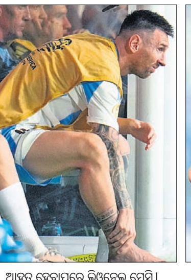
ଆହତ ହେବାପରେ ଲିଓନେଲ ମେସି।

ନ ଆସି ମଧ୍ୟ ପଡି ଯାଇଥିଲେ। କୋପା ମାଟ୍ରେ ଲାଖିଯାଇଥିବା ବେଳେ ସେ ପୁଣି ମାଟ୍ ଡେଇଁ ପଡିଥିଲେ। ପରେ ସେ ପଡିଆ ଛାଡି ଡାକ୍ତରଖାନାକୁ ଚାଲିଗଲେ।