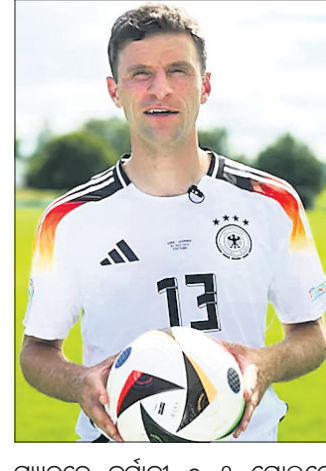
ମ୍ୟାଚରେ ଜର୍ମାନୀ ୦-୧ ଗୋଲରେ ଆର୍ଜେଣ୍ଟିନାକୁ ହାରିଥିଲା।