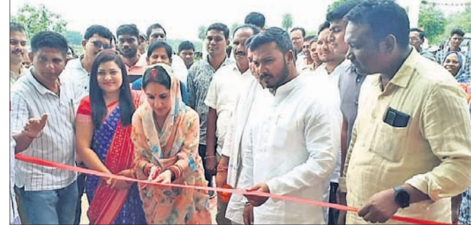
ରାଜ୍ୟ ନିରୀକ୍ଷକ କାର୍ଯ୍ୟାଳୟ ଉଦ୍ଘାଟନ କରାଯାଇଛି ।

କେସିଲ, ୧୫୬ (ଭୁବନେଶ୍ୱର ସାହି) କଳାହାଣ୍ଡି ଜିଲା କେସିଲ ତହସିଲ ଅଧୀନ