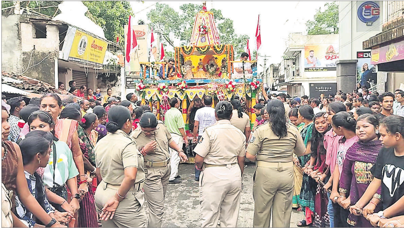
ଝଡ଼ିଆଳଠାରେ ମହିଳାମାନେ ରଥ ଚାଣି ନେଉଛନ୍ତି ।

କୋକସରାରେ ବାହୁଡ଼ା ଯାତ୍ରା କୋକସରା, ୧୫୬ (ଭୁବନେଶ୍ୱର ପାଟଣାପାଲି):