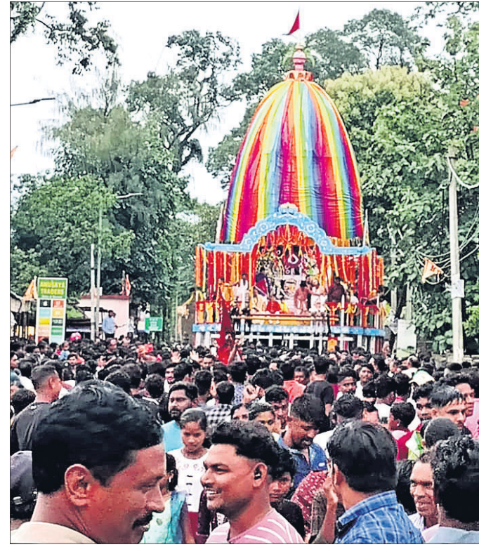
ଲାଞ୍ଜିଗଡ଼ଠାରେ ରଥ ଚାଣି ନେଉଛନ୍ତି ଶ୍ରଦ୍ଧାଳୁ ।