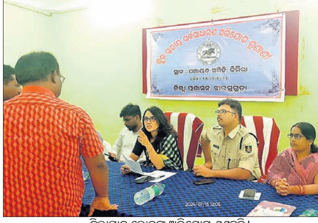
ଜିଲ୍ଲାପାଳ ଲୋକଙ୍କ ଅଭିଯୋଗ ଶୁଣୁଛନ୍ତି।

ନୀତିଗତ ପ୍ରବର୍ତ୍ତନ ହେବ। ଏହି ମେଳାରେ ଜିଲ୍ଲା, ରାଜ୍ୟ ତଥା ଦେଶର ବହୁ ଆଦିବାସୀ ନେତୃମଣ୍ଡଳ ଯୋଗଦେବା ସହ ଅବସରରେ ଯୋଗଦେଇଥିବା ଅଧିକାରୀମାନଙ୍କ ମଧ୍ୟରେ ବିଭା ପରିଚିତ ହେବା ସହିତ ସମସ୍ତଙ୍କ ପାରମ୍ପରିକ