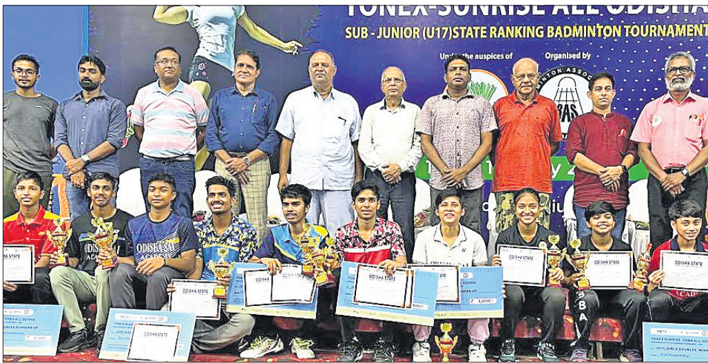
୧୭ ବର୍ଷରୁ କମ ସବୁଜୁନିୟର ରାଜ୍ୟ ବ୍ୟାଡମିଣ୍ଟନ ଚାମ୍ପିୟନସ୍ ଚଳାଉଛନ୍ତି।

ସମ୍ବଳପୁର, ୧୫୬ (ବି.ଶଙ୍କର) ସମ୍ବଳପୁର ବୀର ସୁରେନ୍ଦ୍ର ସାଧୁ ଭନଡୋର ଷ୍ଟାଡ଼ିୟମରେ ଚାଳିଥିବା ବୃକ୍ଷଦିନିଆ ୧୭ ବର୍ଷରୁ କମ ସବୁଜୁନିୟର ରାଜ୍ୟ ରାଜ୍ୟ ବ୍ୟାଡମିଣ୍ଟନ ଚାମ୍ପିୟନସ୍ ଚଳାଉଛନ୍ତି।