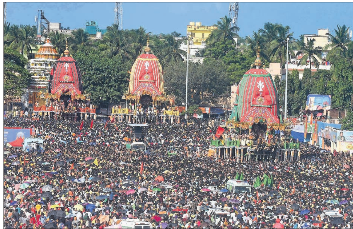
ବାହୁଡ଼ା ଯାତ୍ରା ଅବସରରେ ସୋମବାର ରଥାଭୁଡ଼ା ଦାରୁଦିଏଁ ଗୁଣ୍ଡିଚା ମନ୍ଦିରକୁ ଶ୍ରୀମନ୍ଦିର ଅଭିଯୁକ୍ତ ବାହାରିଛନ୍ତି।