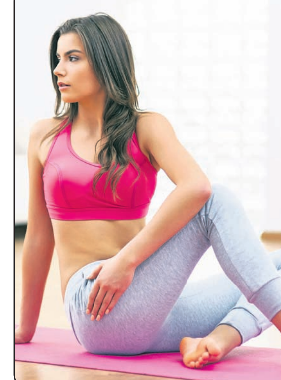
ଯୋଗାସନରୁ ମହିଳାମାନେ ନିଜ ସ୍ୱାସ୍ଥ୍ୟ ରକ୍ଷା କରିପାରନ୍ତି।

ପେଟ ଭିତରକୁ ଯାଇଥାଆନ୍ତି। ଫଳରେ ପରବର୍ତ୍ତୀ ସମୟରେ ଆମେ ଅସୁସ୍ଥ ହେବାକୁ ବାଧ୍ୟ ହେବା। ତେଣୁ ବର୍ଷାଦିନେ ଆମେ ଆମେ କେତେକ ସତର୍କତା ରଖିବା। ଏହା ଯେଉଁ ଶେଷ ପର୍ଯ୍ୟନ୍ତ ଯାହା ଆମେ କରୁଛୁ ତାହା ଚିନ୍ତା କରିବା।