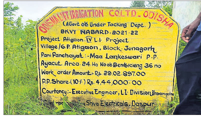
ଊଠା ଜଳସେଚନ ପ୍ରକଳ୍ପ ସୂଚନା ଫଳକ ।

ରାଜ୍ୟ ସରକାର ଜଳସେଚନ ପାଇଁ ବିଭିନ୍ନ ଯୋଜନାରେ କୋଟି କୋଟି