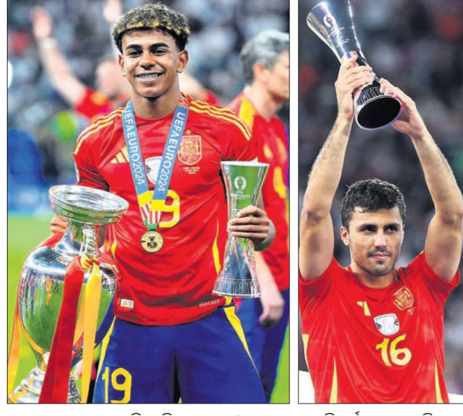
ଶ୍ରେଷ୍ଠ ଯୁବ ଖେଳାଳି ଲାମିନ ଯାମାଲ୍ ଓ ପ୍ଲେୟର ଅଫ୍ ଦି ଟୁର୍ନାମେଣ୍ଟ୍ ରୋଡ୍ରିଗ୍ସ୍।