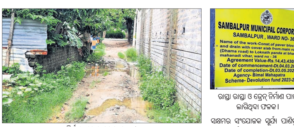
ନିର୍ମାଣ ହୋଇ ନଥିବା ରାସ୍ତା।

ସମ୍ବଳପୁର ମହାନଦୀ ନିଗମ ଖର୍ଚ୍ଚ ନୟର ୩୬ ଅନ୍ତର୍ଗତ ଧନାରୋଡ଼ରେ ଉତ୍ତରା ମହାନଦୀ ବିହାର ରାସ୍ତା ନିର୍ମାଣ କାର୍ଯ୍ୟର ଅବଧୂ ଶେଷ ହୋଇଯାଇଛି।