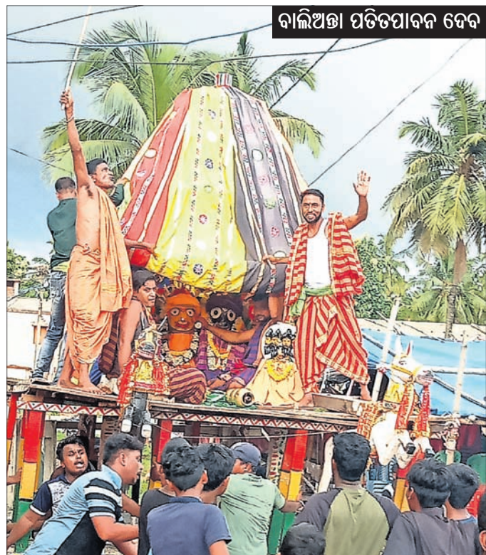
ବାଲିଅନ୍ତା ପତିତପାବନ ଦେବ

ବିଶ୍ୱପ୍ରସିଦ୍ଧ ଯୋଗଯାତ୍ରାର ବାହୁଡ଼ାଯାତ୍ରା ଉପଲକ୍ଷେ ସୋମବାର ରଘୁନାଥପୁରରୁ ମାଉସୀମା ମନ୍ଦିରକୁ ନନ୍ଦକାନନ ଛକସ୍ଥିତ ଜଗନ୍ନାଥ ମନ୍ଦିର ପର୍ଯ୍ୟନ୍ତ ସମସ୍ତ ରାତିନାତି ସହ ରଥଟଣା ସମ୍ପୂର୍ଣ୍ଣ ହୋଇ ସନ୍ଧ୍ୟାରେ ପହଞ୍ଚିଛି । ଭୋର ୫ଟା ୩୦ରେ ସୂର୍ଯ୍ୟପୂଜା, ୬ଟାରେ ଦ୍ୱାରପାଳ ପୂଜା, ସକାଳପୂର୍ଣ୍ଣ, ବଲ୍ଲଭ, ମଧ୍ୟାହ୍ନ ୧୨ଟାରେ ଖେଚୁଡ଼ି ଭୋଗ, ସାଢ଼େ ୩ଟାରେ ପହଞ୍ଚି, ୪ଟାରେ ଛେରା ପହରା, ସାଢ଼େ ୪ଟାରେ ଚାରମାଳ ପିଟା ଯାଇ ୫ଟାରେ ରଥଟଣା ଆରମ୍ଭ ହୋଇଥିଲା । ପରେ ଶହଶହ ଶ୍ରଦ୍ଧାଳୁ ନନ୍ଦକାନନ ପୁଖ୍ୟରାସ୍ତାରେ ରଥକୁ ଚାଣି ଚାଣି ନେଇଥିଲେ । ସେହିଭଳି ମୁଣ୍ଡଳି, ତଳଗଡ଼, ନରାଜ, ବ୍ରାହ୍ମଣୀଗାଁ, ମଧୁନ, ପୁଣ୍ଡୁହାଣ, କଣ୍ଠାପାଟଣା, ବେଞ୍ଚକାରପଡ଼ା, ପୁଲପାଟଣା, ପଦାସାହି ଆଦି ଗ୍ରାମରେ ବାହୁଡ଼ାଯାତ୍ରା ଶାନ୍ତିଶୁଖିଳାରେ ସହ ସରିଛି । କେତେକ ଗ୍ରାମରେ ବାଜା, ଘଣ୍ଟ, କାହାଳି, ସଂକୀର୍ତ୍ତନ ବିରାଟ ପଦ୍ମଆର ରଥ ଆଗରେ ଯାଉଥିବାବେଳେ ଶ୍ରଦ୍ଧାଳୁମାନେ ଡିପିଡିପି ବର୍ଷାକୁ ଖାତିର ନ କରି ରଥଚାଣିଥିଲେ ।