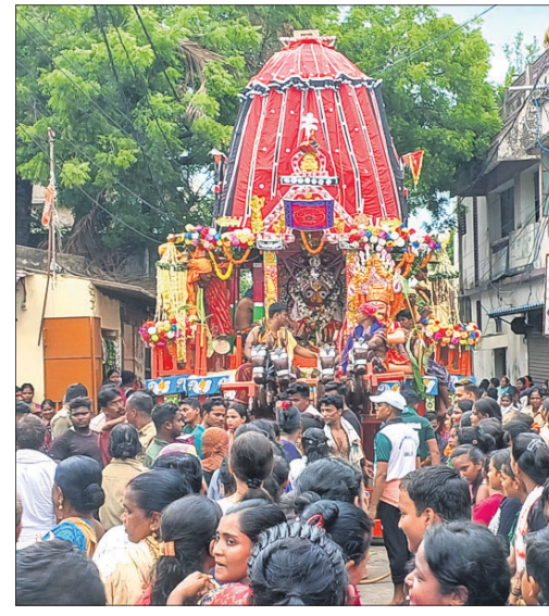
ରାଧିନୀଚୌକ ଅଞ୍ଚଳରେ ମା' ସୁଭଦ୍ରାଙ୍କ ରଥକୁ ମହିଳାମାନେ ଚାଣୁଛନ୍ତି।