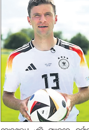
ହୋଇଥିଲା। ଏହି ମ୍ୟାଚରେ ଜର୍ମାନୀ ୦-୧ ଗୋଲରେ ଆର୍ଜେଣ୍ଟିନାଠାରୁ ହାରିଥିଲା।

ମ୍ୟୁନିଚ୍ (ଜର୍ମାନୀ), ୧୫.୭ (ଏପି): ଅନ୍ତର୍ଜାତୀୟ ଫୁଟବଲର ଜର୍ମାନୀର ଚାରକା ଫରଫ୍ଡିଥ ଥୋମାସ ମୁଲର ଯୋମବାର ଅବସର ଘୋଷଣା କରିଛନ୍ତି।