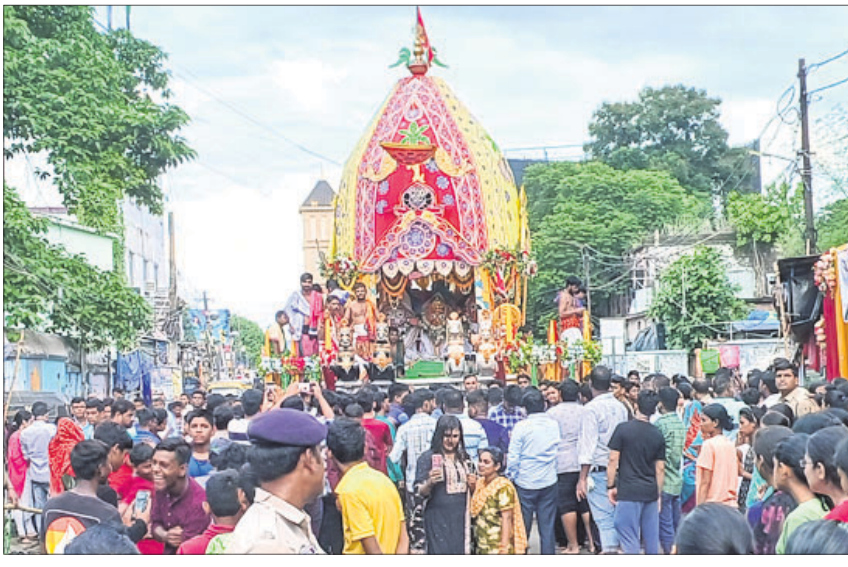
ରାଣୀହାଟଠାରେ ରଥକୁ ଭକ୍ତମାନେ ଚାଣୁଛନ୍ତି।