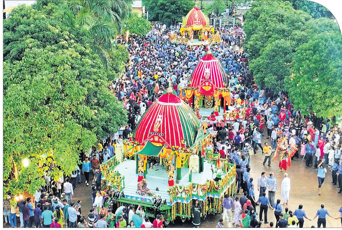
କିସ୍ ଶ୍ରୀବାଣୀ କ୍ଷେତ୍ରରେ ଅନୁଷ୍ଠିତ ବାହୁଡ଼ାଯାତ୍ରାରେ ଶ୍ରୀବାଳୁନାମେ ତିନି ଠାକୁରଙ୍କ ରଥକୁ ଚାଣି ନେଉଛନ୍ତି ।