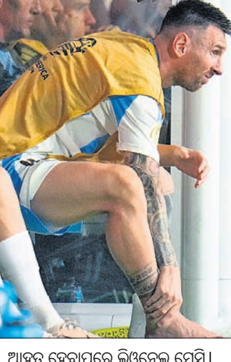
ଆହତ ହେବାପରେ ଲିଓନେଲ ମେସି।

ନିଓଭାନ ଲୋ ସେଲସୋ ଓ ଲିଓନେଲ ମେସିଙ୍କ ପାରଦେଶୀୟ ପାସ୍ତୁ ଏକ ଚମତ୍କାର ଖେଳାଳି ଭାବରେ ପଢ଼ିଆରେ ପ୍ରଦେଶ ଗାଇଲେ। ଆର୍ଜେଣ୍ଟିନା ପକ୍ଷରୁ ଅନ୍ତର୍ଜାତୀୟ ମାର୍କେଟିଂ ୨୯ ଚମ ଗୋଲ ଏକମାତ୍ର ଗୋଲ ଦେଇଥିଲେ।