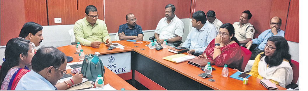
ଜିଲ୍ଲାପାଳଙ୍କ ଯୁଗ୍ମ ଜନ ଅଭିଯୋଗ ଶୁଣାଣି କାର୍ଯ୍ୟକ୍ରମରେ ଜିଲ୍ଲାପାଳ ଅଭିଯୋଗ ଡାକ୍ତରୀ ଓ ଅନ୍ୟମାନେ।