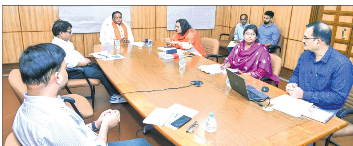
ଲୋକସଭାରେ ଭବନରେ ଯୋଗ୍ୟତା ଅନୁଷ୍ଠିତ ଆନ୍ଧ୍ର ରାଜ୍ୟ ଜଳସେଚନ ପ୍ରକଳ୍ପଗୁଡ଼ିକର ସମୀକ୍ଷା ଅବସରରେ ମୁଖ୍ୟମନ୍ତ୍ରୀ ମୋହନ ଚରଣ ମାଝୀ ଏବଂ ଅନ୍ୟ ବରିଷ୍ଠ ଅଧିକାରୀ।