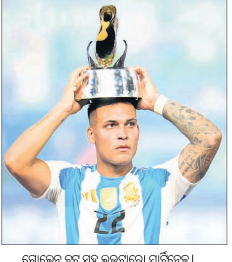
ଗୋଲ୍ମେନ ବୁର୍ ସହ ଲଭାଗାରୋ ମାର୍କେଟିଂ।