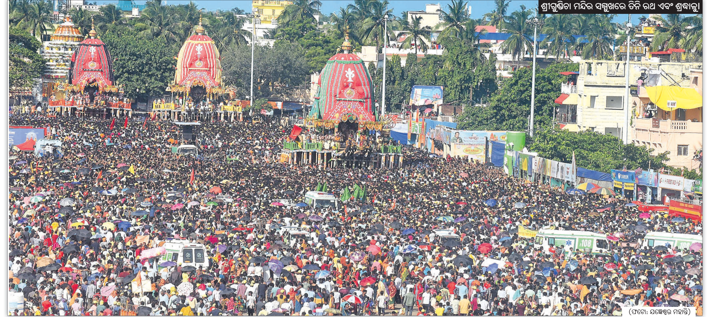
ଶ୍ରୀଗୁଣ୍ଡିଚା ମନ୍ଦିର ସମ୍ମୁଖରେ ତିନି ରଥ ଏବଂ ଶ୍ରୀଜୀଙ୍କୁ।