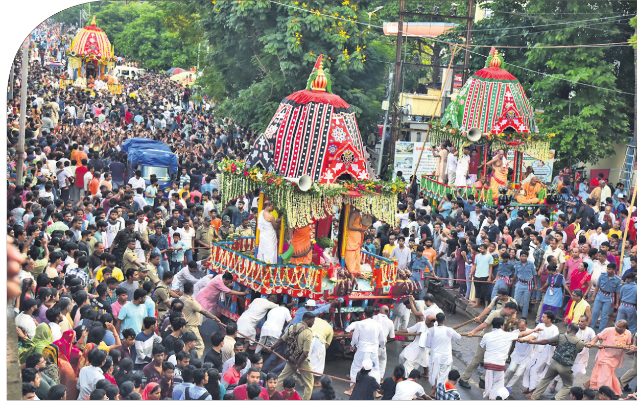
ଭୁବନେଶ୍ୱର ଇନ୍ଦ୍ର ମନ୍ଦିର ପକ୍ଷରୁ ଅନୁଷ୍ଠିତ ବାହୁଡ଼ାଯାତ୍ରା ।