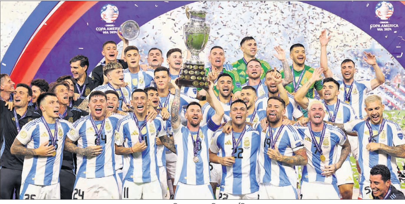
କୋପା ଆମେରିକା ଫୁଟବଲ ଚାମ୍ପିୟନ ଆର୍ଜେଣ୍ଟିନା ଦଳ।

କଟକ, ୧୫.୭ (ପି.ଟି.): ପାକିସ୍ତାନ କ୍ରିକେଟ ବୋର୍ଡ (ପିସିବି) ଆପଣା ୨୦୨୫ ଚାମ୍ପିୟନ୍ସ ଟ୍ରଫି ଆୟୋଜନ କରିବାକୁ ଯାଉଛି। ଭାରତୀୟ କ୍ରିକେଟ କମିଶନ ବୋର୍ଡ (ବିସିଆଇ) ଏହାର ଦଳ ନ ପଠାଇବାକୁ ନିଷ୍ପତ୍ତି ନେଇଥିବା ବେଳେ ଲିଖିତ ପ୍ରମାଣ ମାଗିଛି ପିସିବି।