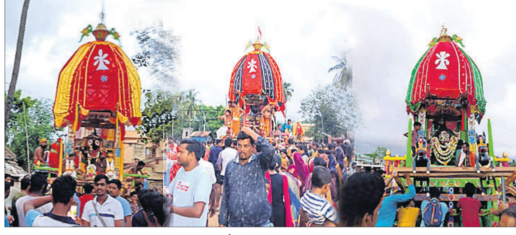
ମା'ଚର୍ଚ୍ଚିକାଙ୍କ ପୀଠର ତିନିରଥ।