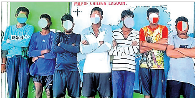
ବାଲୁଗା, ୧୫୭(ସଂଗ୍ରାମ ପାଇକବାଇ)

ବାଲୁଗା ବନ୍ୟପ୍ରାଣୀ ବିଭାଗ ଅଧୀନ ତଥା ପକ୍ଷୀ ଅଭୟାରଣ୍ୟ ନଳବଣ ନିଷିଦ୍ଧାଞ୍ଚଳରେ ଅନୁପ୍ରବେଶ କରି ବେଆଇନ ଭାବେ ମାଛ ମାଡ଼ୁଥିବା ବେଳେ ୭ଜଣ ମାସ୍ୟଜୀବୀଙ୍କୁ ଗିରଫ କରାଯାଇଛି।