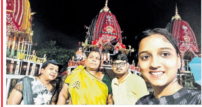
@ କଶିସ ହଲନ

ସେଲଫି ପଠାଇବା ସମୟରେ ନିଜର ନାମ ଏବଂ ମୋବାଇଲ ନମ୍ବର ଦେବାକୁ ଭୁଲୁଛନ୍ତି ନାହିଁ। ଯୋଗ୍ୟବିବେଚିତ ପଠାଏ ପ୍ରକାଶ ପାଇବ।