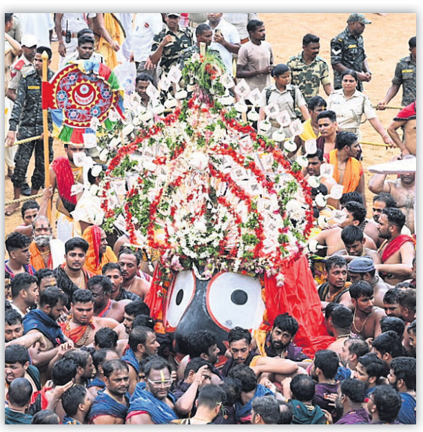
ମହାପ୍ରଭୁ ସୁବର୍ଣ୍ଣନ, ବଡ଼ଠାକୁର ବଳଭଦ୍ର, ମା' ସୁଭଦ୍ରା ଓ ଶ୍ରୀ ଜଗନ୍ନାଥଙ୍କୁ ପହଞ୍ଚି କରି ରଥ ଉପରକୁ ନିଆଯାଇଛି।