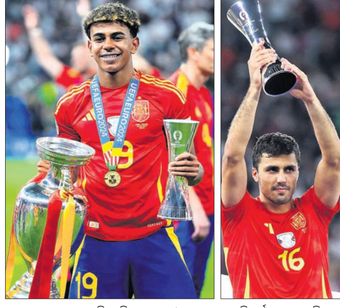
ଶ୍ରେଷ୍ଠ ଯୁବ ଖେଳାଳି ଲାମିନ ଯାମାଲ ଓ ଫ୍ଲୋର ଅଫ୍ ଦି ଟୁର୍ନାମେଣ୍ଟ ରୋଡ୍ରି।

ସ୍ପେନ କପ୍ ରୋଡ୍ରି ଫ୍ଲୋର ଅଫ୍ ଦି ଟୁର୍ନାମେଣ୍ଟ ବର୍ଲିନ୍, ୧୫.୭ (ପି.ଟି.): ଜର୍ମାନୀରେ ଅନୁଷ୍ଠିତ ସ୍ପେନ କପ୍ ୨୦୨୪ ଶେଷ ହୋଇଛି। ଫାଇନାଲରେ ଇଂଲଣ୍ଡକୁ ୨-୧ ଗୋଲରେ ହରାଇ ସ୍ପେନ୍ ଚାମ୍ପିୟନ ହୋଇଛି।