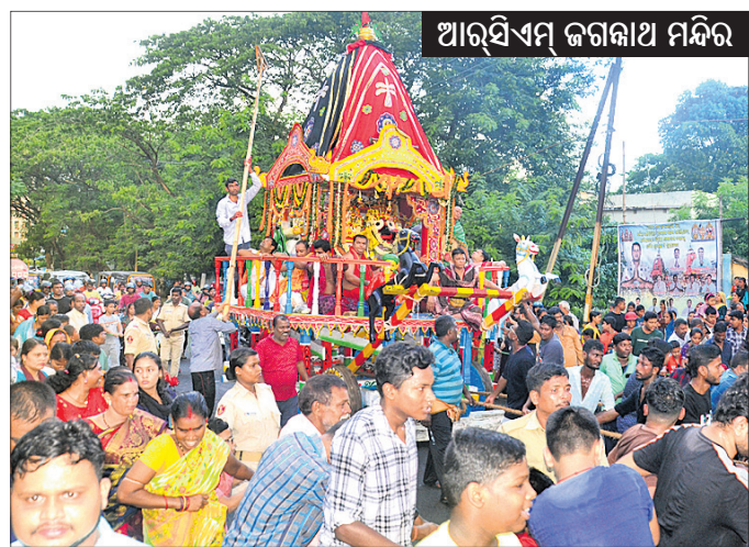
ଆରସିଏମ୍ ଜଗନ୍ନାଥ ମନ୍ଦିର