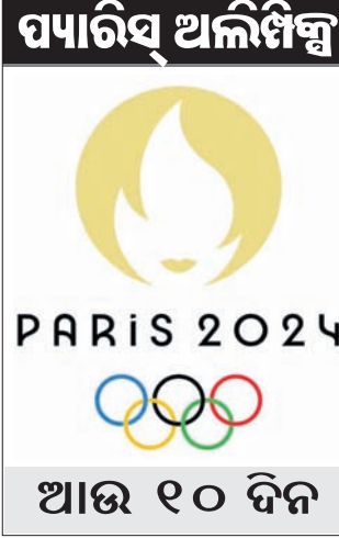
ଆଉ ୧୦ ଦିନ

କୋପାମେ ଟିଟି ମେକାନିକମର ଏକ ଅଂଶବିଶେଷ। ସେମାନେ ସେମାନଙ୍କର ଆଇଡିଆ ଦେବେ। ପୁଁ ମୋ ଯୋଜନା ଅନୁସାରେ କାର୍ଯ୍ୟ କରିବେ। ସେମାନଙ୍କଠାରୁ ପୁଁ ଶୁଣିବି ଏବଂ ସେମାନେ ମୋଠାରୁ ଶୁଣିବେ। ତେବେ ଶେଷ ନିଷ୍ପତ୍ତି ପୁଁ ନେବି। ଏଥିରେ କିଛି ଭୁଲ୍ ଥିବା ପୁଁ ଅନୁଭବ କରୁନାହିଁ ବୋଲି କଣ୍ଠାସିନି ପ୍ୟାରିସ୍ ଅଲିମ୍ପିକ୍ସ