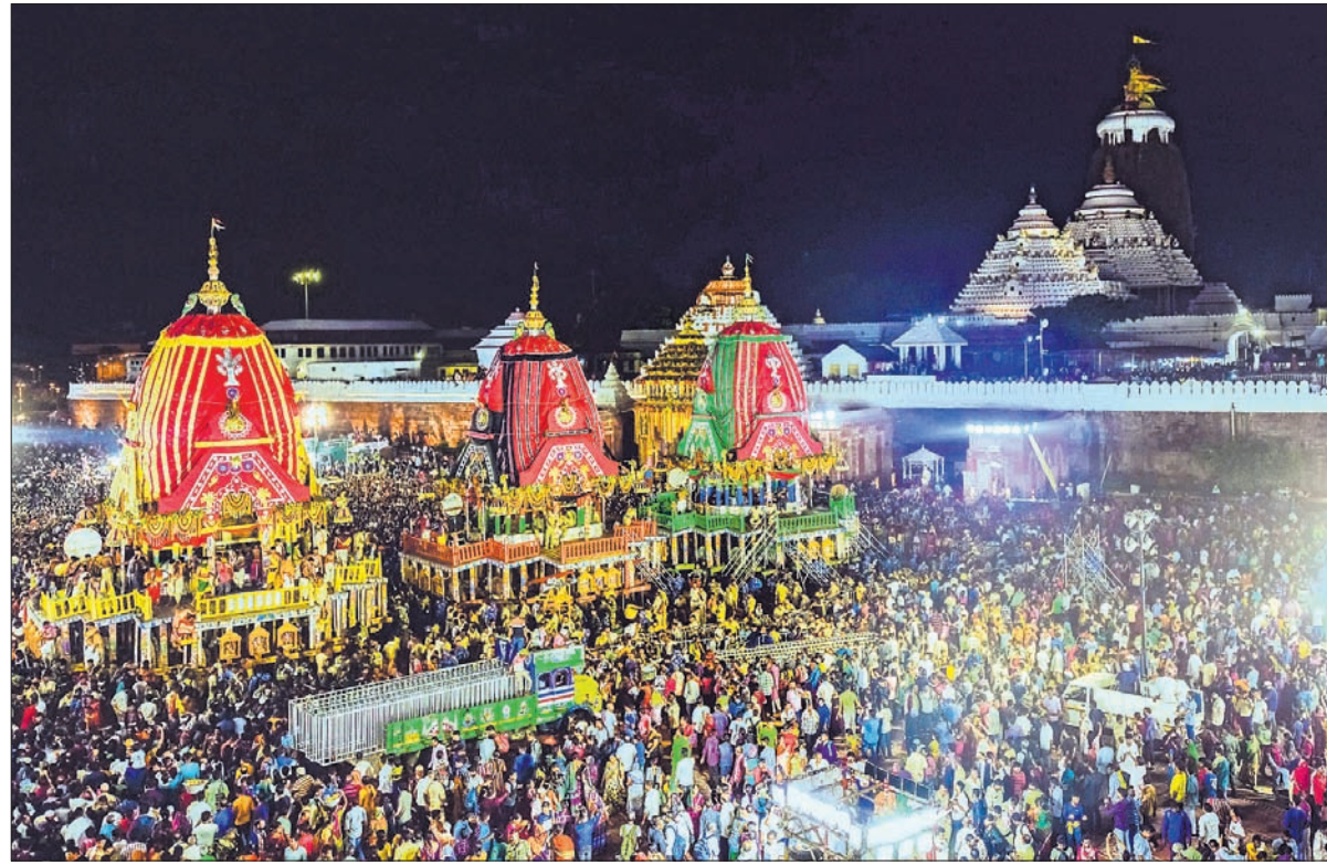
ବାହୁଡ଼ା ଯାତ୍ରା ଅବସରରେ ସୋମବାର ରଥାବୁଡ଼ ବାହୁଡ଼ିଆ ଗୁଣ୍ଡିଚା ମନ୍ଦିରକୁ ଆସି ଶ୍ରୀମନ୍ଦିର ସମ୍ମୁଖରେ ପହଞ୍ଚିଛି।