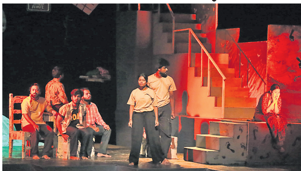
'ଜୀନରେଖା' ପକ୍ଷରୁ ମଞ୍ଚସ୍ଥ ନାଟକ 'ନିଃଶିକ୍ଷ ପାଦଶବ୍ଦ'।