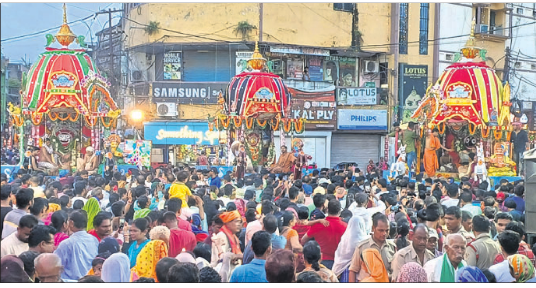
କଟକ ବୋଳପୁଣ୍ଡାଳ ଜଗନ୍ନାଥ ମନ୍ଦିର ସମ୍ମୁଖରେ ପହଞ୍ଚିବା ଦିନରଥ।