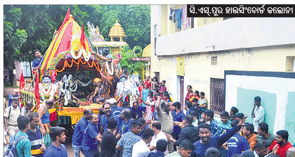
ସି.ଏସ୍.ପୁର ହାଇସ୍କୋଲ କଲୋନୀ