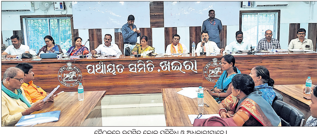
ବୈଠକରେ ଉପସ୍ଥିତ ଲୋକ ପ୍ରତିନିଧି ଓ ଅଧିକାରୀମାନେ ।

ଖଇରା ପଞ୍ଚାୟତ ସମିତି ବୈଠକ ବର୍ଷିକୋ ଏମ୍ପି, ବିଧାୟକ