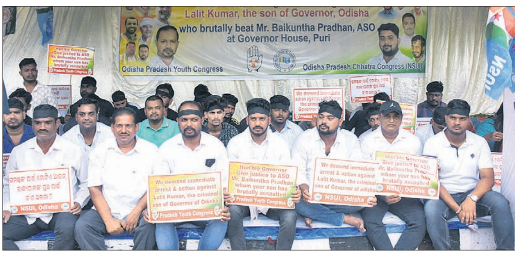
ରାଜଭବନ ସମ୍ମୁଖରେ ମଙ୍ଗଳବାର ପ୍ରଦେଶ ଛାତ୍ର ଓ ଯୁବ କଂଗ୍ରେସ ସମସ୍ତ ଦିଆଯାଇଥିବା ଧାରଣା ।