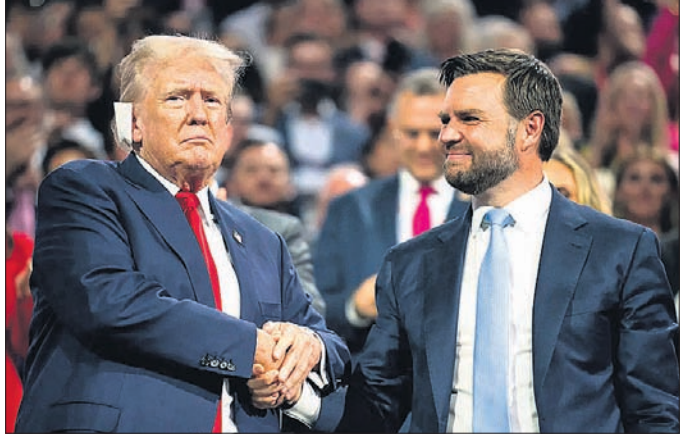
ରିପବ୍ଲିକାନ୍ କନ୍ଭେନ୍ସନ୍‌ରେ ରାଷ୍ଟ୍ରପତି ପ୍ରାର୍ଥୀ ଡୋନାଲ୍ଡ୍ ଟ୍ରମ୍ ଓ ଉପରାଷ୍ଟ୍ରପତି ପ୍ରାର୍ଥୀ ଜେ.ଡି.ଭାବୁ ।

୮ ବର୍ଷ ତଳେ ୨୦୧୬ ରାଷ୍ଟ୍ରପତି ନିର୍ବାଚନ ବେଳେ ଜେ.ଡି. ଭାବୁ ରିପବ୍ଲିକାନ୍ ନୋମିନି ଡୋନାଲ୍ଡ୍ ଟ୍ରମ୍‌ଙ୍କ ଘୋର ସମାଲୋଚକ ଥିଲେ। ସେତେବେଳେ ସେ ଟ୍ରମ୍‌ଙ୍କୁ 'ଇଡିଅଟ୍' କହି ସମାଲୋଚନା କରିଥିଲେ।