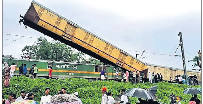
ବ୍ୟବସ୍ଥା (କବଚ) କାର୍ଯ୍ୟକାରୀତାକୁ ସର୍ବାଧିକ ପ୍ରାଥମିକତା ଦେବା ପାଇଁ ସିଆର୍‌ଏସ୍ ସୁପାରିସ୍ କରିଛନ୍ତି। ସିଗ୍ନାଲରେ ତ୍ରୁଟି ରହିଥିବାରୁ ତି/ଏ ୯୧୨ କରିଆରେ ସିଗ୍ନାଲ ଅତିକ୍ରମ

ପଶ୍ଚିମବଙ୍ଗର ଦାର୍‌ଲିଙ୍ଗ ଜିଲ୍ଲାରେ ଜୁନ୍ ୧୭ରେ କାଞ୍ଚନଜଙ୍ଗା ଏକ୍ସପ୍ରେସ୍ ଏକ ମାଲ୍‌ଗାଡ଼ିକୁ ଧକ୍କା ଦେବାରୁ ୧୦ ଜଣଙ୍କ ମୃତ୍ୟୁ ଘଟିଥିଲା। ବିଭିନ୍ନ ସ୍ତରରେ ତ୍ରୁଟି ଦୂରୀକରଣ ଯୋଗୁଁ ଅଯେକ୍ଷା କରିଥିଲା ବୋଲି ରେଲୱେ ସୁରକ୍ଷା କମିଶନର (ସିଆର୍‌ଏସ୍) କହିଛନ୍ତି।