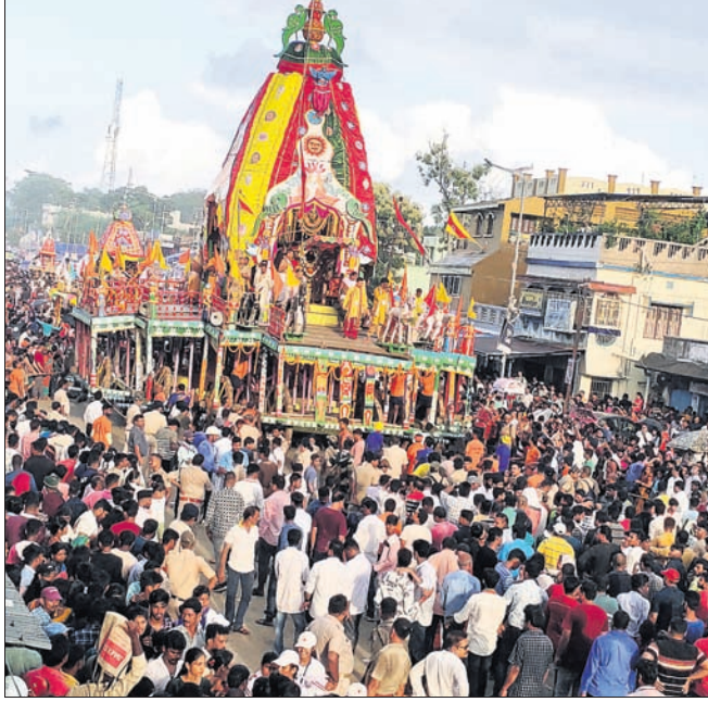
ବାହୁଡ଼ାଯାତ୍ରା ଉପଲକ୍ଷେ ରଥକୁ ଗାଣି ନେଉଛନ୍ତି ଶ୍ରଦ୍ଧାଳୁ ।

ପରମ୍ପରା ଅନୁସାରେ, ନୀଳଗିରିରେ ୨ଦିନ ଧରି ବାହୁଡ଼ାଯାତ୍ରା ଅନୁଷ୍ଠିତ ହୋଇଥାଏ । ପ୍ରଥମ ଦିନରେ ଶ୍ରଦ୍ଧାଳୁ ଓ ଜଗନ୍ନାଥପ୍ରେମୀ ଗୁଡ଼ିଆ ମନ୍ଦିର ନିକଟରୁ ରଥଗାଣି ବଡ଼ବାଣ୍ଟ ଅଧାରାସ୍ଥା ରଥା ଶଙ୍କରାଖଣ୍ଡା ପୋଖରୀ ସମ୍ମୁଖରେ ପହଞ୍ଚାଇଥାନ୍ତି ।