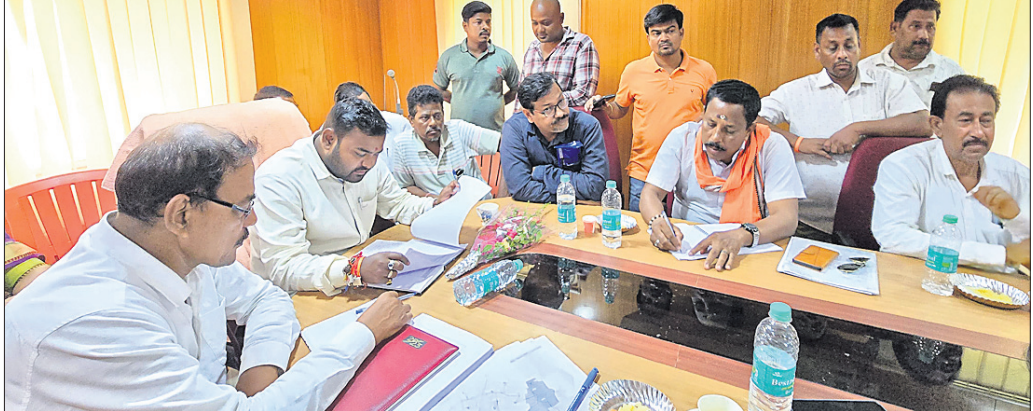
ସମାକ୍ଷା ବୈଠକରେ ଉପସ୍ଥିତ ବିଧାୟକ ଓ ଅଧିକାରୀମାନେ ।

ପାଇଁ ଯତ୍ନବାନ ହେବାକୁ ପରାମର୍ଶ ଦେଇଥିଲେ । ବାଲେଶ୍ୱର ସହରାଞ୍ଚଳର ପ୍ରତ୍ୟେକ ସେକ୍ଟରରେ ଜନସ୍ୱାସ୍ଥ୍ୟ ବିଭାଗର କମିଷ୍ନି ଯତ୍ନାତ୍ମକ ନିୟମିତ କ୍ଷେତ୍ର ପରିଦର୍ଶନ ସହ ବିଶୁଦ୍ଧ ପାନୀୟ ଜଳ ଯୋଗାଣ ପ୍ରକଳ୍ପକୁ ସମ୍ପୂର୍ଣ୍ଣ କରିବା ଦିଗରେ ପଦକ୍ଷେପ ନିଆଯିବ ।