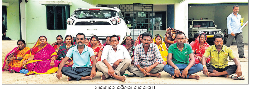
ଧାରଣାରେ ବସିଥିବା ଗ୍ରାମବାସୀ।

ପାଟଣା, ୧୬/୭(ବୀରକିଶୋର ଦାଶ) କେନ୍ଦୁଝର ଜିଲ୍ଲା ପାଟଣା ବ୍ଲକ୍ ମୁଖ୍ୟଖୋର୍ଦ୍ଧା ପଞ୍ଚାୟତର ମୁଖ୍ୟାଳୟ ଗ୍ରାମର ଏକ ଗୋଟରଜମିରେ ଆବାସ ନିର୍ମାଣକୁ