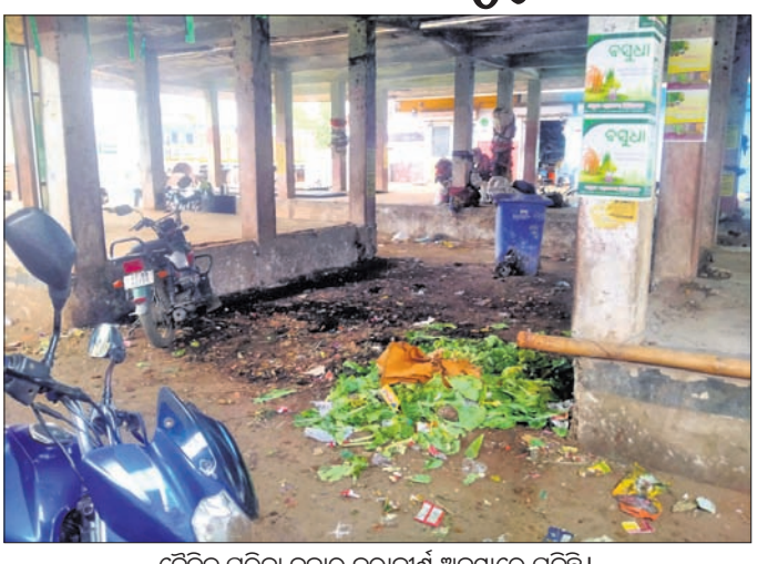
ଦୈନିକ ପରିବା ବଜାର ଜରାଜୀର୍ଣ୍ଣ ଅବସ୍ଥାରେ ପଡ଼ିଛି।

କେନ୍ଦୁଝର ଜିଲ୍ଲା ଚମ୍ପୁଆ ଦୈନିକ ପରିବା ବଜାର ଜରାଜୀର୍ଣ୍ଣ ଅବସ୍ଥାରେ ପଡ଼ିରହିଛି। ଚାଷୀଙ୍କ ପାଇଁ ଉଦ୍ଧୃଷ୍ଟ ପିଣ୍ଡ କାମରେ ଲାଗୁ ନ ଥିବାରୁ ବେଳେ ଛାତରୁ ସିମେଣ୍ଟ ଖଣ୍ଡ ଖସି ଅନେକ ସମୟରେ ଚାଷୀ ଆହତ ହେଉଛନ୍ତି।