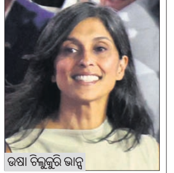
ଉଷା ଚିଲୁକ୍ତିରି ଭାବୁ