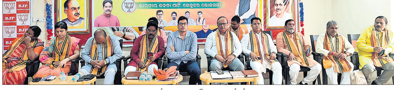
ସମ୍ବର୍ଦ୍ଧନା ସଭାରେ ଉପସ୍ଥିତ ଭାଜପା କର୍ମୀଗଣ।

କେନ୍ଦୁଝର, ୧୬/୭(ବାପଦ ମିଶ୍ର/ନରେଶ ଚନ୍ଦ୍ର ପଟ୍ଟନାୟକ) କେନ୍ଦୁଝର ଲୋକସଭା କ୍ଷେତ୍ର ଅନ୍ତର୍ଗତ ୭ ଟି ବିଧାନସଭା କ୍ଷେତ୍ରର ସମସ୍ତ ମନ୍ତ୍ରୀଙ୍କୁ