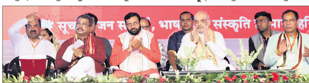
ହରିୟାଣାର ମହେନ୍ଦ୍ରଗଡ଼ରେ ସେଣ୍ଟ୍ରାଲ ଯୁନିଭର୍ସିଟି ପାଠିକରେ ମଙ୍ଗଳବାର ଆୟୋଜିତ ପଛୁଆବର୍ଣ୍ଣ ସମ୍ମାନ ସମ୍ମିଳନୀରେ ଯୋଗଦେଇ ସ୍ୱରାଷ୍ଟ୍ର ମନ୍ତ୍ରୀ ଅନିତ ଶାହା, କେନ୍ଦ୍ର ଶିକ୍ଷାମନ୍ତ୍ରୀ ଧର୍ମେନ୍ଦ୍ର ପ୍ରଧାନ, ହରିୟାଣା ମୁଖ୍ୟମନ୍ତ୍ରୀ ନାୟବ ସିଂହ ସୈନୀ ଓ ଅନ୍ୟମାନେ ।