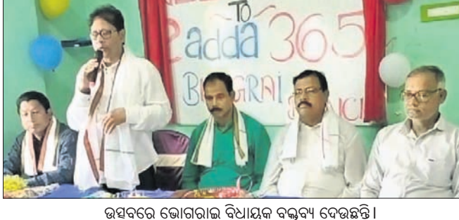
ଉତ୍ସବରେ ଭୋଗରାଜ ବିଧାୟକ ବକ୍ତବ୍ୟ ଦେଉଛନ୍ତି ।