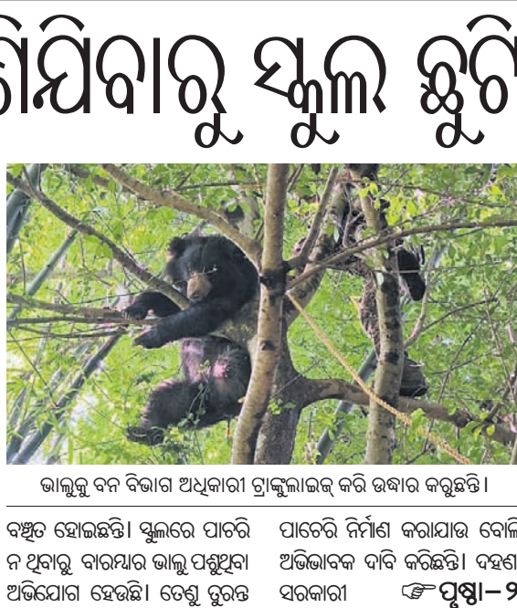
ଭଲ୍ଲୁକୁ ବନ୍ଦ ବିଭାଗ ଅଧିକାରୀ ଗ୍ରାଜୁଲାଭକ୍ କରି ଉଦ୍ଧାର କରୁଛନ୍ତି। ବନ୍ଧୁତ ହୋଇଛନ୍ତି। ସ୍କୁଲରେ ପାଠରୁ ନ ଥିବାରୁ ବାରମ୍ବାର ଭଲ୍ଲୁ ପଶୁଥିବା ଅଭିଯୋଗ ହୋଇଛି। ତେଣୁ ଛୁଟି ପାରେଇ ନିର୍ମାଣ କରାଯାଇ ବୋଲି ଅଭିଭାବକ ଦାବି କରିଛନ୍ତି। ଦହଣା ସରକାରୀ ପୃଷ୍ଠା-୨

ନନ୍ଦାହାଣ୍ଡି/ପାପଡ଼ାହାଣ୍ଡି, ୧୬/୭ (ପ୍ରତାପ କୁମାର ଦାଶ/ସ୍ୱପ୍ନକାନ୍ତ ପଟ୍ଟନାୟକ) ନବରଙ୍ଗପୁର ଜିଲ୍ଲାରେ ଭଲ୍ଲୁ ଆତଙ୍କ ଦେଖାଦେଇଛି। ବିଭିନ୍ନ କାରଣରୁ ଭଲ୍ଲୁ ଏବେ ଜଙ୍ଗଲଛାଡ଼ି ଜନବସତି ମୁହାଁ ହୋଇଛନ୍ତି। ସୋମବାର ବିକଳିତ ରାତିରେ ପାପଡ଼ାହାଣ୍ଡି ଥାନାରେ ପଶି ଆତଙ୍କିତ କରିଥିବାବେଳେ ମଙ୍ଗଳବାର ନନ୍ଦାହାଣ୍ଡି ରୁଜ ଦହଣା ସରକାରୀ ସ୍କୁଲରେ ଭଲ୍ଲୁ ପଶିଥିଲା। ଫଳରେ ବିଦ୍ୟାଳୟ ବନ୍ଦ କରିବାକୁ ପଡ଼ିଛି। ପିଲାମାନେ ପାଠପଢ଼ାକୁ