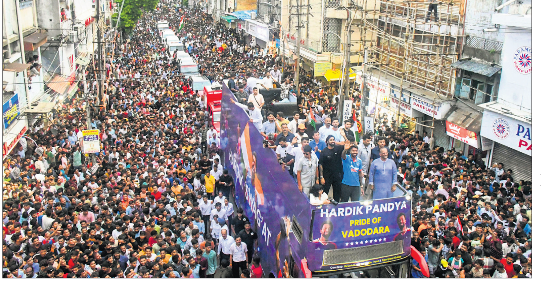
ଭାରତୀୟ କ୍ରିକେଟ ଦଳର ଟି୨୦ କ୍ରିକେଟ ବିଶ୍ୱକପ ବିଜୟ ଉପଲକ୍ଷେ ଭବାନୀପୁର ଅନୁଷ୍ଠିତ ହାର୍ଦ୍ଦିକ ପାଣ୍ଡ୍ୟାଙ୍କ ରୋଡ୍ ଶୋ ।