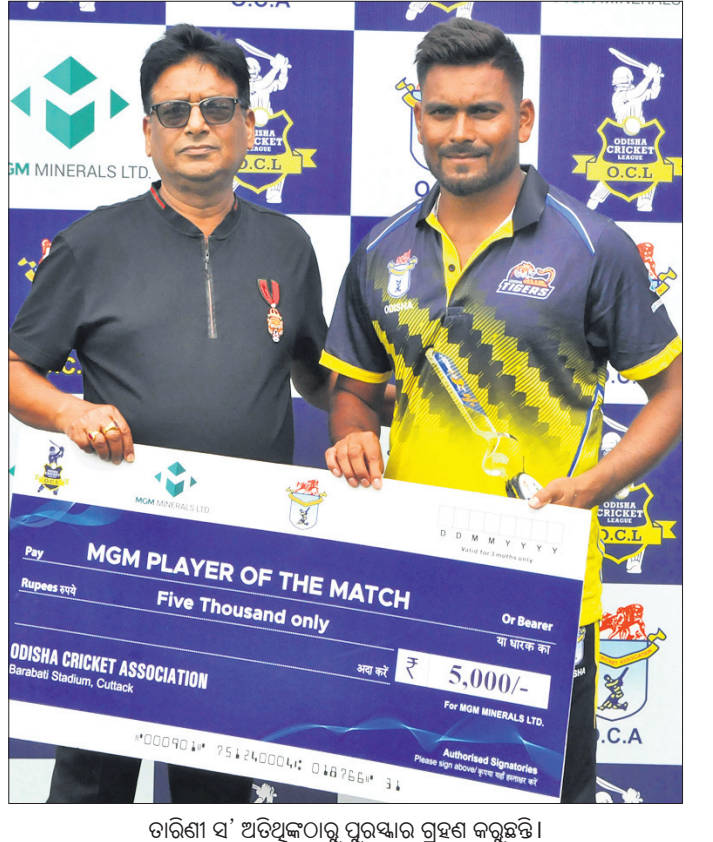
ଚାରିଶା ସ' ଅତିଥିତାପୁର ପୁରସ୍କାର ଗ୍ରହଣ କରୁଛନ୍ତି ।