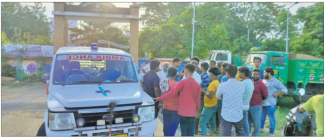
ଅଟକ ରଖି ନ ଥିବା କହିଲା ପୋଲିସ

ପୋଲିସ ଜିମା ଦିଆଯାଇଥିବା ଜଣେ ନବବଧୂ ହତ୍ୟା ଅଭିଯୁକ୍ତ ସ୍ୱାମୀ ଫାଣ୍ଡିରୁ ଚମ୍ପଟ ମାରିଥିବା ଅଭିଯୋଗ ହୋଇଛି। ତେବେ ପୋଲିସ ଏହାକୁ ଅସ୍ୱୀକାର କରିବା ସହ କାହାକୁ ଅଟକ ରଖି ଥିବା କହିଛି।