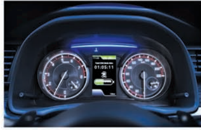
Multi-information Display (Dedicated CNG Fuel Gauge)