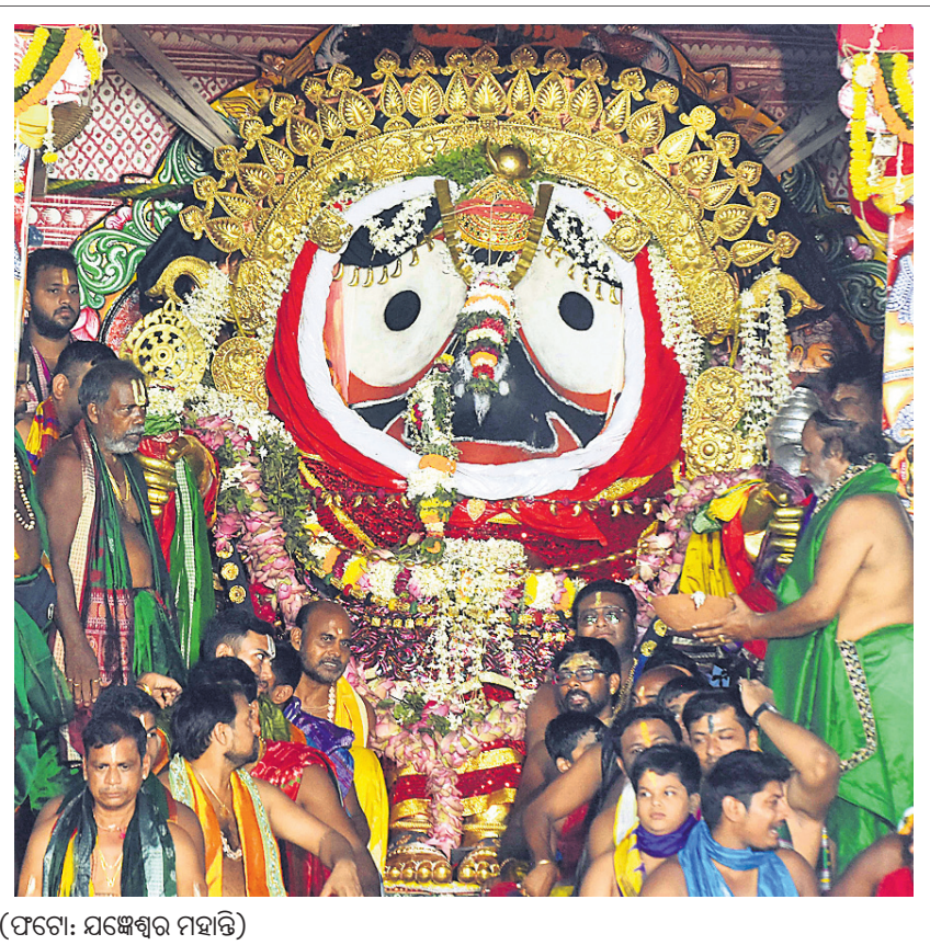
ପୁରୀ ସିଂହଦ୍ୱାର ସମ୍ମୁଖରେ ରୁଧିର ରଥାରୁ ଚିନି ଠାକୁରଙ୍କ ସୁନାବେଶ ।