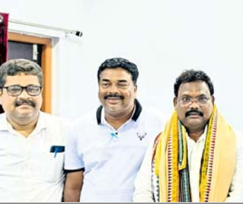
ମନ୍ତ୍ରୀଙ୍କୁ ବାର ଆସୋସିଏଟନ କର୍ମକର୍ତ୍ତା ଭେଟି ଦାବିପତ୍ର ପ୍ରଦାନ କରୁଛନ୍ତି।

ଧାନ ବିକି ଚାଷୀଙ୍କୁ ମିଳୁନି ଟଙ୍କା ପ୍ରଧାନମନ୍ତ୍ରୀଙ୍କୁ ଚିଠି ଲେଖିଲା କେନ୍ଦ୍ରୀୟ କ୍ରିୟାନୁଷ୍ଠାନ କମିଟି