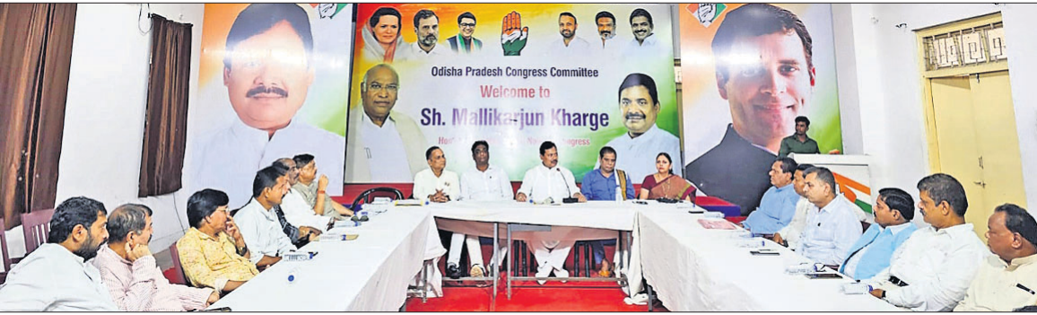
କଂଗ୍ରେସ ଭବନରେ ଆୟୋଜିତ ବୈଠକରେ ପିସିସି ସଭାପତି ଶରତ ପଟ୍ଟନାୟକ ଓ ଦଳୀୟ ନେତୃବୃନ୍ଦ ।