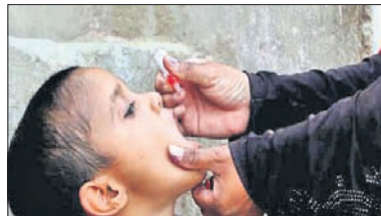
ପଚାରିଲେ, ଆପଣ ଏହି ପ୍ରଭୁକୁ ବିକ୍ରି କରି ବିପଦ ଅଧିକାରୀଙ୍କୁ ଦେଖାନ୍ତୁ । ଡାକ୍ତରୀରେ ଚିକିତ୍ସା କରାଯାଉଛି ।