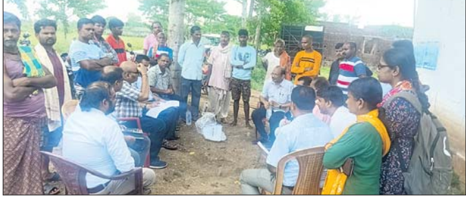
ବୈଠକରେ ଯୋଗଦେଇଥିବା ଆଖୁଚାଷୀ ଓ ଅଧିକାରୀମାନେ।