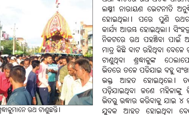
ଶ୍ରଦ୍ଧାଳୁମାନେ ରଥ ଶୁଖିଛନ୍ତି।