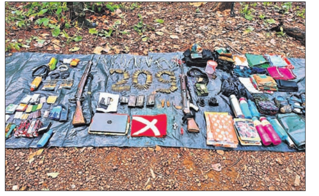
କବଚ ହୋଇଥିବା ବିପୁଳ ପରିମାଣର ମାଓବାଦୀ ସାମଗ୍ରୀ

ଓଡ଼ିଶା -ଖାଡ଼ଖଣ୍ଡ ସୀମାନ୍ତ ଛୋଟନାଗପୁର ସୋଲାଇଗଡ଼ ଜଙ୍ଗଲରେ ବୁଧବାର ଭୋରରୁ ମାଓବାଦୀ ଓ ସୁରକ୍ଷାକର୍ମୀଙ୍କ ମଧ୍ୟରେ ଗୁଳିବିନିମୟ ହୋଇଥିଲା।