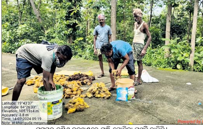
ଘୁମୁସର ଦକ୍ଷିଣ ବନଖଣ୍ଡରେ ମଞ୍ଜି ପୋତିବା ପ୍ରସ୍ତୁତି ଚାଲିଛି।

ଭଞ୍ଜନଗର, ୧୭୭ (ବାବୁଲ୍ଲା ପ୍ରଧାନ): ଜଳବାୟୁ ପରିବର୍ତ୍ତନ ସମେତ ବିଭିନ୍ନ କାରଣ ଯୋଗୁ ବଜ୍ରପାତ ବୃଦ୍ଧି ପାଇଛି। ଏହାଦ୍ୱାରା ଅନେକ ଧନ କ୍ଷତି ହେଉଛି। ବଜ୍ରପାତରୁ ରକ୍ଷା ପାଇଁ ଡାଳଗଛ ହିଁ ଏକମାତ୍ର ଭରସା ହେବାକୁ ଯାଉଛି। ତାଳ ଗଛ ଲାଗିଲେ ବଜ୍ରପାତ ଏତେବେଳେ ବୋଲି ବିଭାଗ ପକ୍ଷରୁ କୁହାଯାଉଛି। ଏଥିସହ ତାଳ ହାତୀର ପ୍ରିୟ ଖାଦ୍ୟ। ଅନେକ ସମୟରେ ହାତୀ ଖାଦ୍ୟ ଅନେକ୍ଷଣରେ ଜଙ୍ଗଲକୁ ବାହାରି ଜଙ୍ଗଲ ନିକଟସ୍ଥ ଗ୍ରାମକୁ ନିକଟରେ ପହଞ୍ଚି ଯିବାକୁ ଚାଲିଯାଏ। ତାଳ ପତ୍ରକୁ ସମୟରେ ହାତୀମାନେ ମଧ୍ୟ ଜଙ୍ଗଲକୁ ଆଉ ବାହାରକୁ ଆସିବେ ନାହିଁ ବୋଲି ଆଶା କରାଯାଉଛି। ତେଣୁ ଜଙ୍ଗଲ ବିଭାଗ ପକ୍ଷରୁ ଚଳିତ ବର୍ଷ ତାଳ ଗଛ ଲାଗାଇବା ଉପରେ ଜୋର ଦିଆଯାଇଛି। ସମସ୍ତ ତାଳ ମଞ୍ଜି ଜଙ୍ଗଲ ବିଭାଗର ସାମାଜିକ ପୋଡାଯିବ। ଗଛରୁଟିକ ବଡ଼