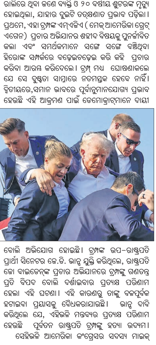
ବୋଲି ଅଭିଯୋଗ ହୋଇଛି ଗ୍ରହଣ ଉପ-ରାଷ୍ଟ୍ରପତି ପ୍ରଥମ ସିନେଟର ଜେ.ଡି. ଭାସ୍କୁ ପୁଲ୍ଲି କଲିଥିଲେ, ରାଷ୍ଟ୍ରପତି ଜେ. ବାଲଭେନକ୍ ପ୍ରଚାର ଅଭିଯାନରେ ଗ୍ରହଣ ଗଣତନ୍ତ୍ର ପ୍ରତି ବିପଦ ବୋଲି ଦର୍ଶାଇବା ପ୍ରତ୍ୟକ୍ଷ ପରିଶୋଧ ହେଲା ଏହି ଘଟଣା । ଏହି କାରଣରୁ ତାଙ୍କୁ ବଳପୂର୍ବକ ହଟାଇବା ପ୍ରସ୍ତାବକୁ ଦେଖାଯାଇଅଛି । ଭାସ୍କୁ ବାଦି କଲିଥିଲେ ଯେ, ଏହିଭଳି ମତବ୍ୟୟ ପ୍ରତ୍ୟକ୍ଷ ପରିଶୋଧ ହେଉଛି ପୂର୍ବତନ ରାଷ୍ଟ୍ରପତି ଗ୍ରହଣ ହେବା ଉପଯୋଗୀ ହୋଇପାରେ ।

ପୂର୍ବଦିନିଆରେ ଏକ ନିର୍ବାଚନ ପ୍ରଚାର ରାଜିରେ ତୋନାକୁ ଗ୍ରହଣ କରିବା ଉପରେ କାର୍ଯ୍ୟକାରୀ ପଦକ୍ଷେପ ଗ୍ରହଣ କରିବା ପାଇଁ ଧ୍ୟାନ ଦେବାକୁ ପଡ଼ିବ । ଏକ ନିର୍ବାଚନ ପ୍ରଚାର ପାଇଁ ଧ୍ୟାନ ଦେବାକୁ ପଡ଼ିବ । ଏକ ନିର୍ବାଚନ ପ୍ରଚାର ପାଇଁ ଧ୍ୟାନ ଦେବାକୁ ପଡ଼ିବ ।