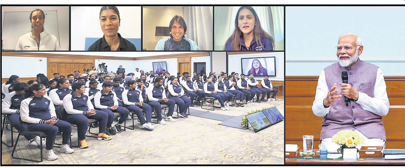
ପ୍ୟାରିସ୍ ଆଲିମ୍ପିକ୍ସ ପାଇଁ ବିଦାୟ ଶୁଭେଚ୍ଛା ଜଣାଇବାକୁ ଆୟୋଜିତ କାର୍ଯ୍ୟକ୍ରମରେ ଖେଳାଳିଙ୍କ ସହ ଭାବ ବିନିମୟ ଅବସରରେ ପ୍ରଧାନମନ୍ତ୍ରୀ ନରେନ୍ଦ୍ର ମୋଦି

ପ୍ୟାରିସ୍, ୧୭/୭ (ପି.ଟି.): କୋପା ଆନେରିକା ୨୦୨୪ ବିଜୟୀ ହୋଇଥିବା ଆର୍ଜେଣ୍ଟିନା ଦଳର ଖେଳାଳିଙ୍କ ନାମରେ ଜାତିଆଣ ଅଭିଯୋଗ ଆଣିଛନ୍ତି ଫେଡେରେଶନ।