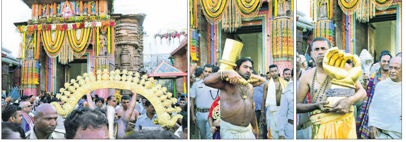
ବାରୁଦିଆଁଙ୍କ କିରୀଟ, ଶ୍ରୀପୟର, ଶ୍ରୀହସ୍ତ।