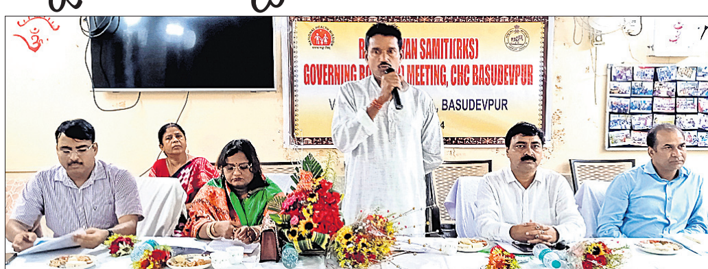
ବୈଠକରେ ଯୋଗଦେଇଥିବା ରୋଗୀ କଲ୍ୟାଣ ସମିତିର ସଦସ୍ୟମାନେ ।

ଭଦ୍ରକ ଜିଲ୍ଲା ବାସୁଦେବପୁର ଡାକ୍ତରଖାନା ପରିସରରେ ରୋଗୀ କଲ୍ୟାଣ ସମିତି ବୈଠକ ମଙ୍ଗଳବାର ଅପରାହ୍ଣରେ ଅନୁଷ୍ଠିତ ହୋଇଯାଇଛି।