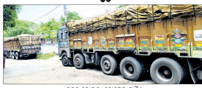
କବଚ କୋଇଲା ବୋଝେଇ ଗାଡ଼ି ।

ଭଦ୍ରକ ଜିଲ୍ଲାରେ ଚୋରା କୋଇଲା କାରବାର ବୃଦ୍ଧି ସାଙ୍ଗକୁ କୋଇଲା ମାଫିଆଙ୍କ ବୌଦ୍ଧାତ୍ମ୍ୟ ବୃଦ୍ଧି ପାଉଥିବା ଦେଖିବାକୁ ମିଳୁଛି।