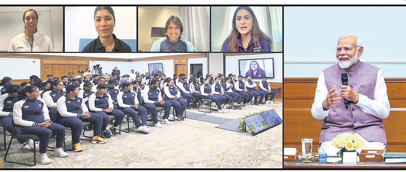
ପ୍ୟାରିସ୍ ଆଲିମ୍ପିକ୍ସ ପାଇଁ ବିଦାୟ ଶୁଭେଚ୍ଛା ଜଣାଇବାକୁ ଆୟୋଜିତ କାର୍ଯ୍ୟକ୍ରମରେ ଖେଳାଳିଙ୍କ ସହ ଭାବ ଦିନିମୟ ଅବସରରେ ପ୍ରଧାନମନ୍ତ୍ରୀ ନରେନ୍ଦ୍ର ମୋଦି

“୨୦୨୪ ଆଲିମ୍ପିକ୍ସରେ ପାଇଁ ଗଠିତ ପ୍ୟାରିସ୍ ଆୟୋଜକ କମିଟିର ନିୟମ ଅନୁସାରେ ୧୧ ଆଇଏସଏ ଅତିଥିଆଳ ୬୭ ମିଶାଇ ଆକ୍ରମିତରେ ଯାଆ ୬୭ ସପୋର୍ଟ ସ୍କ୍ୱାଡ୍ ରେମୁଣା ଭିଲେଜରେ