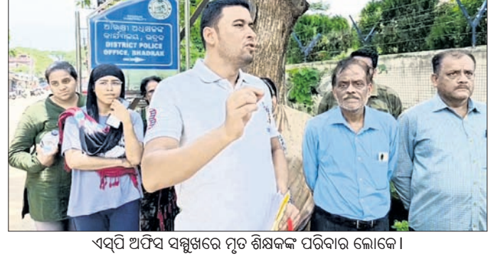
ଏସ୍ପି ଅଧିକାରୀଙ୍କ ସମ୍ମୁଖରେ ମୃତ ଶିକ୍ଷକଙ୍କ ପରିବାର ଲୋକେ ।

ରୋଗୀମାନେ ଅସୁବିଧା ଭୋଗୁଛନ୍ତି ହେବାରୁ ଥିବା କାର୍ଯ୍ୟ ସମ୍ପର୍କରେ ବିଧାୟକଙ୍କୁ ଅବଗତ କରାଯାଇଥିଲା।