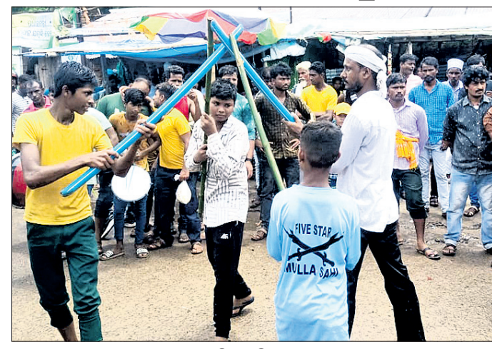
ଅନୁଷ୍ଠିତ ବାଡ଼ି ଖେଳ

ଆଖଡ଼ା ଦଳ ମଧ୍ୟରେ ବାଡ଼ିଖେଳ ପ୍ରତିଯୋଗିତା ପ୍ରଦାନ କରାଯାଇଛି। ପ୍ରତିଯୋଗିତାରେ ଏମ୍ପ୍ଟି ଚାକ୍ସିନ ଖେଳର ଧାରା ବିବରଣୀ ପ୍ରଦାନ କରାଯାଇଛି।