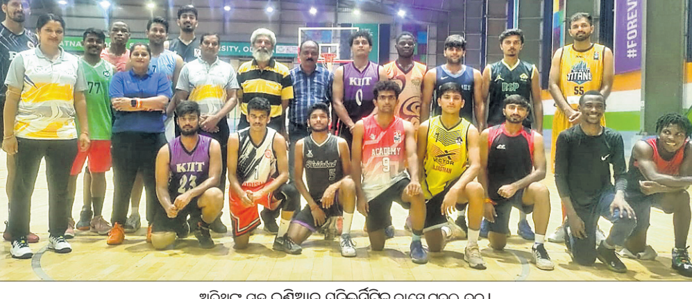
ଅତିଥିକ ସହ ଇଣ୍ଡିଆନ୍ ୟୁନିଭର୍ସିଟି ବାୟୋଟେକ ଦଳ।

ଭୁବନେଶ୍ୱର, ୧୭/୭ (ତପନ ସାଲ୍) ଏସୀୟ ବିଶ୍ୱବିଦ୍ୟାଳୟ ବାୟୋଟେକ (ପୁରୁଷ) ଚାମ୍ପିୟନଶିପ୍ ୭ମ ସଂସ୍କରଣ ଚାଲିପାରେ।