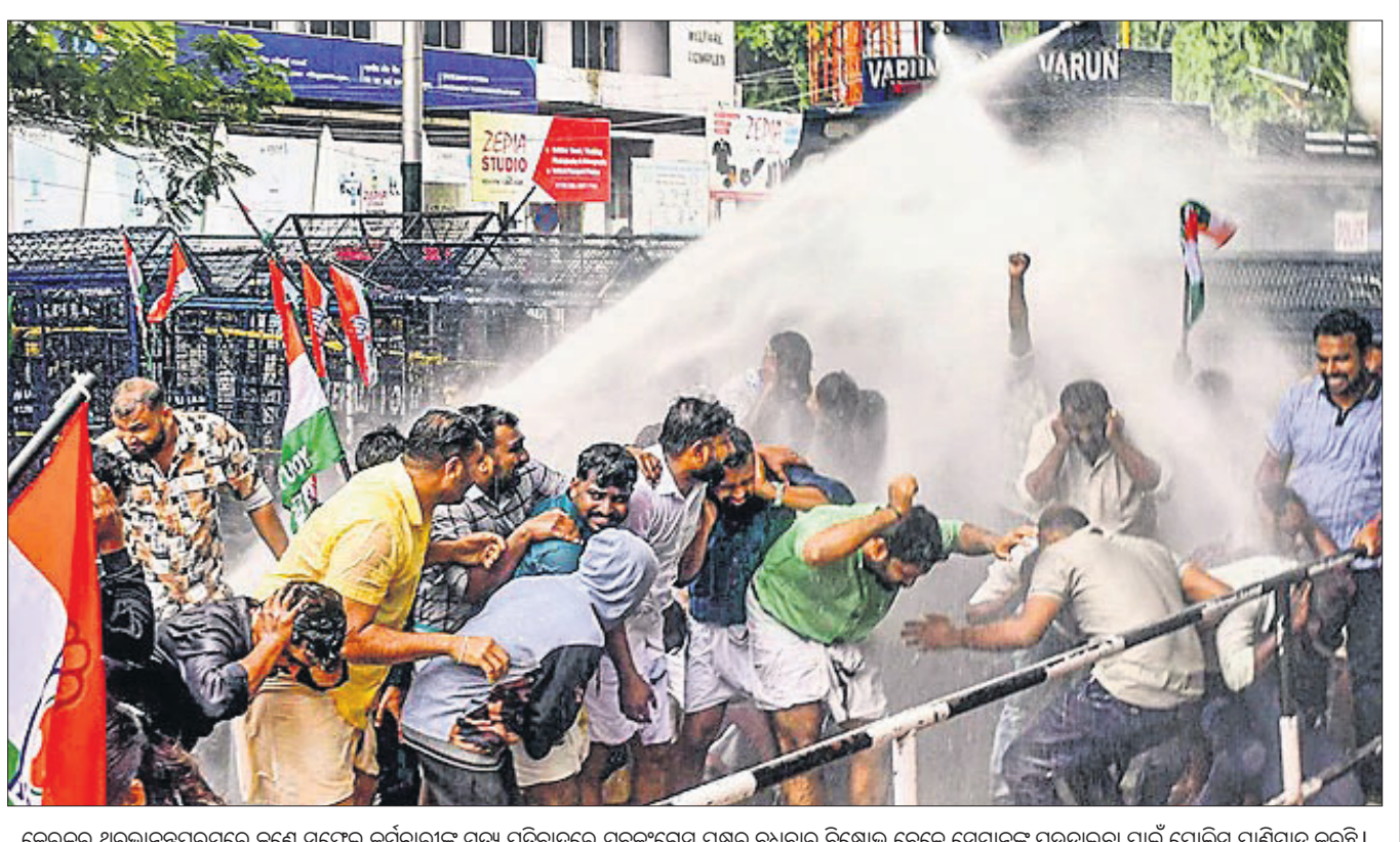
କେରଳର ଥୁରୁଲାନନ୍ଦପୁରମ୍ପରେ ଜଣେ ସଫେଇ କର୍ମଚାରୀଙ୍କ ମୃତ୍ୟୁ ପ୍ରତିବାଦରେ ଯୁବକଂଗ୍ରେସ ପକ୍ଷରୁ ବୁଧବାର ବିକ୍ଷୋଭ ବେଳେ ସେମାନଙ୍କୁ ଘଉଡ଼ାଇବା ପାଇଁ ପୋଲିସ୍ ପାଣିମାଡ଼ କରୁଛି।

ଏବଂ ପ୍ରସ୍ତୁତ ଆବେଦନକୁ ଅର୍ଥ ଓ ସାଧାରଣ ଉଦ୍ୟୋଗ ବିଭାଗ ଦାୟିତ୍ୱ ଦିଆଯାଇଛି। ସେହିପରି ତାଲିକାରେ ବିଧାୟକ ବ୍ରଜ କାର୍ଯ୍ୟକଳାପ ଉପରେ ୨/୩ ଜଣ ବିଧାୟକଙ୍କୁ ମଧ୍ୟ ଦାୟିତ୍ୱ ଦିଆଯାଇଛି।