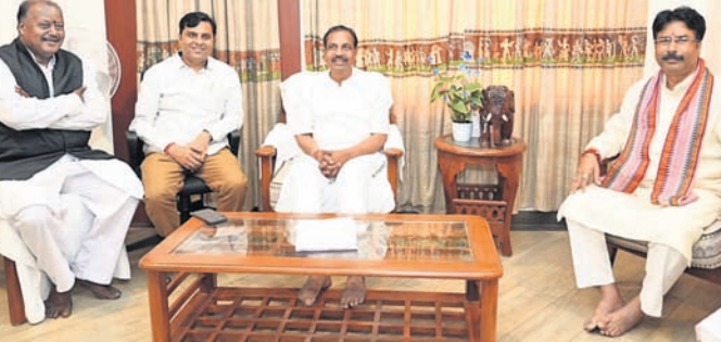
ପରିବହନ ମନ୍ତ୍ରୀ ବିଭୂତି ଭୂଷଣ ଜେନା, ନଗର ଭବନର ମନ୍ତ୍ରୀ କୃଷ୍ଣଚନ୍ଦ୍ର ମହାପାତ୍ର ଆଲୋଚନା କରୁଛନ୍ତି।

ନଗର ଭବନର ମନ୍ତ୍ରୀଙ୍କ ସହ ଆଲୋଚନାକଲେ ପରିବହନ ମନ୍ତ୍ରୀ