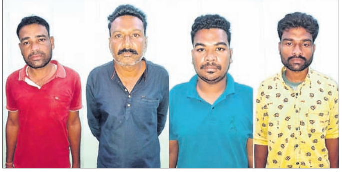
ଗିରଫ ୪ ଅଭିଯୁକ୍ତ।

ପ୍ରାକୃର ବିକ୍ରି ପାଇଁ ଗାଁକୁ ଯାଇଥିବା ଶୋ'ରୁମ୍ କର୍ମଚାରୀଙ୍କୁ ଗୃହରକ୍ଷାଙ୍କ ସମେତ ୪ଜଣ ଗୃହବନ୍ଦୀ ରଖି ନିଯୁକ୍ତ ମାଡ଼ ମାରିଛନ୍ତି।