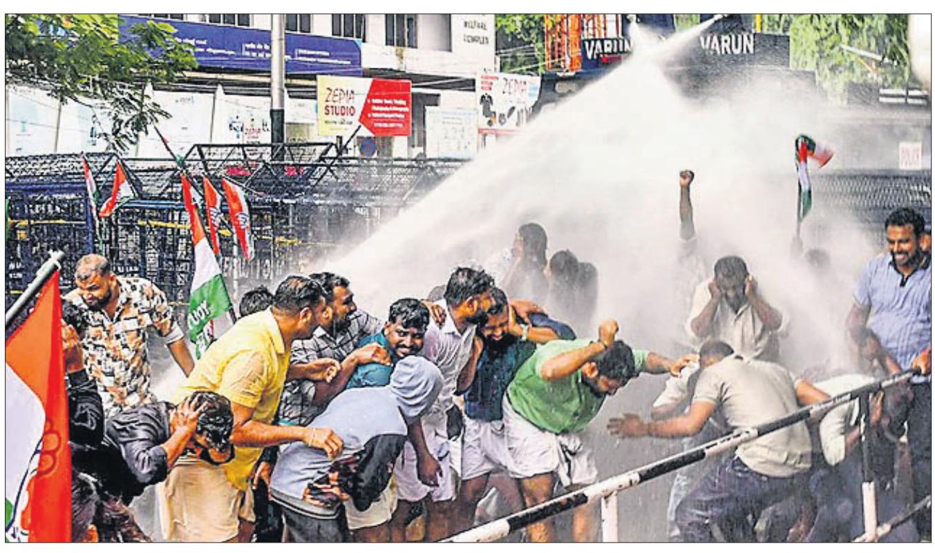
କେରଳର ଥୁରୁଲାନନ୍ଦପୁରମ୍ପରେ ଜଣେ ସଫେଇ କର୍ମଚାରୀଙ୍କ ମୃତ୍ୟୁ ପ୍ରତିବାଦରେ ଯୁବକଗ୍ରେସ ପକ୍ଷରୁ ବୁଧବାର ବିଶୋଭ ବେଳେ ସେମାନଙ୍କୁ ଘଉଡ଼ାଇବା ପାଇଁ ପୋଲିସ ପାଣିମାଡ଼ କରୁଛି।