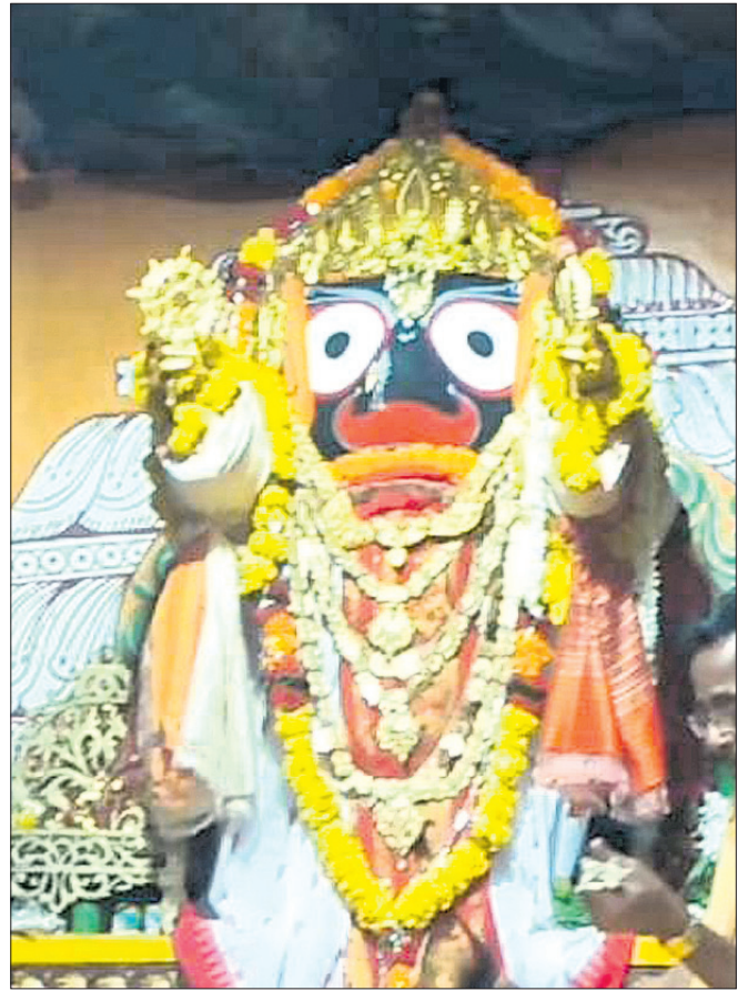
ସୁନାବେଶରେ ସଜେଇ ହୋଇଛନ୍ତି ମହାବାହୁ: ଶାବର ଶ୍ରୀକ୍ଷେତ୍ର କୋରାପୁଟରେ ଚନ୍ଦ୍ରବେଦୀକୁ ଯେଉଁଥିବା ଶ୍ରୀଜୀଉ ରୂପବାର ସୁନାବେଶରେ ଶ୍ରୀକାଳୁଙ୍କୁ ଦର୍ଶନ ଦେଉଛନ୍ତି ।