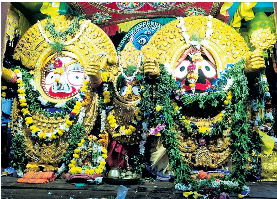
କୋରାପୁଟ ଜିଲ୍ଲା ସୁନାବେତା ଓ ଦାମନଯୋଡ଼ିରେ ଠାକୁରଙ୍କ ସୁନାବେଶ ।

ଖବରଦାତା ସମ୍ମିଳନୀରେ ରାଜ୍ୟ ସଂଘ ଉପରେ ବର୍ଷିଲେ ଓଡ଼ିଶା ଅମଳା ସଂଘ କର୍ମକର୍ତ୍ତା