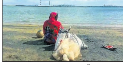
ମହାନଦୀ କୂଳରେ ସ୍ୱାମୀଙ୍କୁ ଚାହିଁ ବସିଛନ୍ତି ସ୍ତ୍ରୀ ସାଥୀନୀ ଖାଜୁନୀ।