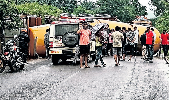
ଓଲଟି ପଡ଼ିଥିବା ଟ୍ୟାକ୍ସର।

କୋରାପୁଟରୁ ସୁନାବେଡ଼ା ଯାଇଥିବା ୨୨ ନଂ. ଜାତୀୟ ରାଜପଥର କୋରାପୁଟ ଗାଡ଼ନ ଥାନା ଅନ୍ତର୍ଗତ ଚୁରୁପୁରରେ ଶୁକ୍ରବାର ଭୋର ସମୟରେ ଭାରସାମ୍ୟ ହରାଇ ଏକ ସିଂକେଲ ବୋହେଲ ଟ୍ୟାକ୍ସର ଓଲଟି ପଡ଼ିଥିଲା। ଫଳରେ ଦୀର୍ଘ ୬ ଘଣ୍ଟା ଧରି ଜାତୀୟ ରାଜପଥ ଅବରୋଧ ହୋଇଥିଲା। ଏଥିଯୋଗୁ ରାଜପଥର ଉଭୟ ପାର୍ଶ୍ୱରେ ଶତାଧିକ ବସ୍, ଟ୍ରକ୍ ଓ ଚାରିତକିଆ ଯାନ ଅଟକିରହିଥିଲା। ଲୋକେ ନାହିଁ ନ ଥିବା ଅସୁବିଧାର ସମ୍ମୁଖୀନ ହୋଇଥିଲେ। ଏହି ଟ୍ୟାକ୍ସରଟି ସିଂକେଲ ଧରି ଆନ୍ଧ୍ରପ୍ରଦେଶକୁ କୋରାପୁଟ ଅଭିଯୁକ୍ତ ଆୟୁଥିବା ବେଳେ ଭୋର ୫ଟାରେ ଚୁରୁପୁର ନିକଟରେ ଭାରସାମ୍ୟ ହରାଇ ରାଜପଥ ଉପରେ ଓଲଟି ପଡ଼ିଥିଲା। ଫଳରେ ଉକ୍ତ ରାସ୍ତାରେ ଯାତାୟତ ସମ୍ପୂର୍ଣ୍ଣ ବନ୍ଦ ରହିଥିଲା। କଟକ, ଭୁବନେଶ୍ୱର, ବ୍ରହ୍ମପୁର, ବିଶାଖାପାଟଣା,