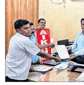
ସଙ୍ଗଠନର ଅନୁଗୋଳ ଶାଖା ପକ୍ଷରୁ ଦାବିପତ୍ର ପ୍ରଦାନ କରାଯାଇଛି।