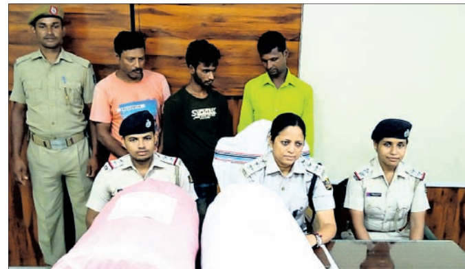
ଖବରଦାତା ସମ୍ମିଳନୀରେ ପୋଲିସ୍ ଘଟଣା ସମ୍ପର୍କରେ ସୂଚନା ଦେଇଛି ।