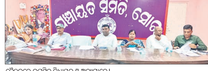
ବୈଠକରେ ଉପସ୍ଥିତ ବିଧାୟକ ଓ ଅନ୍ୟମାନେ।