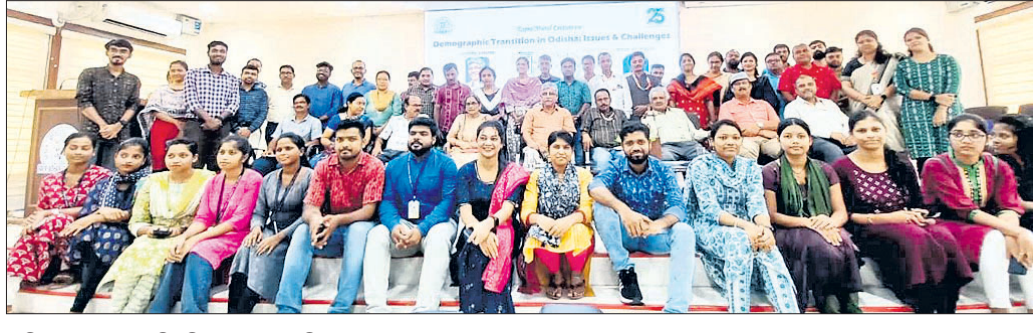
ଅତିଥିକ ଗହଣରେ ବିଶ୍ୱବିଦ୍ୟାଳୟ ଅଧ୍ୟାପକ ଓ ଛାତ୍ରାଛାତ୍ରୀମାନେ।