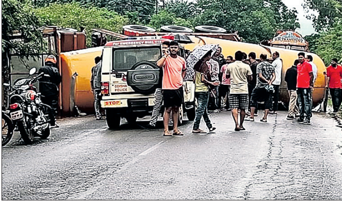
ଓଲଟି ପଡ଼ିଥିବା ଟ୍ୟାକ୍ସର।

କୋରାପୁଟରୁ ସୁନାବେଡ଼ା ଯାଇଥିବା ୨୨ ନଂ. ଜାତୀୟ ରାଜପଥର କୋରାପୁଟ ଗାଉଁସ ଥାନା ଅନ୍ତର୍ଗତ ଚୁରୁପିପାଟଣା ଶୁକ୍ରବାର ଭୋର ସମୟରେ ଭାରସାମ୍ୟ ହରାଇ ଏକ ସିଂଗଲ୍ ବୋହେଲ ଟ୍ୟାକ୍ସର ଓଲଟି ପଡ଼ିଥିଲା। ଫଳରେ ଦୀର୍ଘ ୬ ଘଣ୍ଟା ଧରି ଜାତୀୟ ରାଜପଥ ଅବରୋଧ ହୋଇଥିଲା। ଏଥିଯୋଗୁ ରାଜପଥର ଉଭୟ ପାର୍ଶ୍ୱରେ ଶତାଧିକ ବସ୍, ଟ୍ରକ୍ ଓ ଗାଡ଼ିଜିଆ ଯାନ ଅଟକିରହିଥିଲା। ଲୋକେ ନାହିଁ ନ ଥିବା ଅସୁବିଧାର ସମ୍ମୁଖୀନ ହୋଇଥିଲେ। ଏହି ଟ୍ୟାକ୍ସରଟି ସିମେଣ୍ଟ ଧରି ଆନ୍ଧ୍ରପ୍ରଦେଶକୁ କୋରାପୁଟ ଅଭିଯୁକ୍ତ ଆୟୁଥିବା ବେଳେ ଭୋର ୫ଟାରେ ଚୁରୁପିପାଟଣା ନିକଟରେ ଭାରସାମ୍ୟ ହରାଇ ରାଜପଥ ଉପରେ ଓଲଟି ପଡ଼ିଥିଲା। ଫଳରେ ଉକ୍ତ ରାସ୍ତାରେ ଯାତାୟତ ସମ୍ପୂର୍ଣ୍ଣ ବନ୍ଦ ରହିଥିଲା। କଟକ, ଭୁବନେଶ୍ୱର, ବ୍ରହ୍ମପୁର, ବିଶାଖାପାଟଣା,