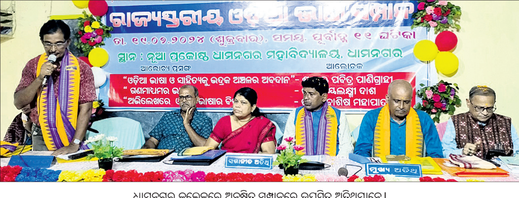
ଧାନନଗର କଲେଜରେ ଅନୁଷ୍ଠିତ ସମ୍ମାନରେ ଉପସ୍ଥିତ ଅତିଥିମାନେ ।

ଧାନନଗର, ୧୯୧୭(ସନ୍ତୋଷ କୁମାର ମହାପାତ୍ର/ବେବେନ୍ଦ୍ର ଆଦିଆ) ଭୁବନେଶ୍ୱର ଓଡ଼ିଆ ଭାଷା ପ୍ରତିଷ୍ଠାନ ଏବଂ ଧାନନଗର ମହାବିଦ୍ୟାଳୟର ଓଡ଼ିଆ ଭାଷା ଓ ସାହିତ୍ୟ ବିଭାଗର ମିଳିତ ଅଧିକାରୀମାନେ ଧାନନଗରରେ ମନମୁତୁ ଡାକ କରୁଥିବାବେଳେ ଏକ ଅସାଧ୍ୟକର ପରିବେଶ ସୃଷ୍ଟି ହେଉଛି । ଗୁରୁବାର ଗୋବରରେ ଗୋଡ଼ ପଡ଼ି ଖସିଯିବାକୁ ଜଣେ ବ୍ୟକ୍ତିଙ୍କ କିଛି ଫାଇଲ ଓ ଦରକାରୀ କାଗଜପତ୍ର ବର୍ଷାପାଣିରେ ପଡ଼ି ନଷ୍ଟ ହୋଇଯାଇଛି । ବ୍ଲକ୍ କାର୍ଯ୍ୟାଳୟ ପରିସରରେ ବୁଲି ଶୁଣି ଓ ଗୋରୁଙ୍କ ପ୍ରବେଶରେ ଅକ୍ରମଣ ସୃଷ୍ଟି ପାଇଁ ଦୀର୍ଘବର୍ଷ ପୂର୍ବରୁ ନିର୍ମିତ କାଓକେଟରଟି ପୋଡ଼ି ହୋଇପଡ଼ିଛି । ଫଳରେ ଏହି ସ୍ଥାନରେ ବର୍ଷାକଳ ଜମି ରହୁଛି । ନିୟମିତ ବ୍ୟବଧାନରେ ସରକାରୀ ପଦସ୍ତ୍ର ଅଧିକାରୀ, ଜିଲ୍ଲାପ୍ରଧାନ ଓ ରାଜ୍ୟପ୍ରଧାନ ଅଧିକାରୀ, ଲୋକ ପ୍ରତିନିଧି ବ୍ଲକ୍ କାର୍ଯ୍ୟାଳୟକୁ ପ୍ରବେଶ କରୁଥିବା ବେଳେ ଏହି କାଓକେଟରର ପୁନଃ ନିର୍ମାଣ ଦିଗରେ ପଦକ୍ଷେପ ନିଆଯାଇ ନ ଥିବାରୁ ଜନଅସନ୍ତୋଷ ଦେଖାଦେଉଛି । ଏ ଦିଗରେ ବିଭାଗୀୟ ଅଧିକାରୀ ଦୃଷ୍ଟି ଦେବାକୁ ଦାବି ହୋଇଛି ।