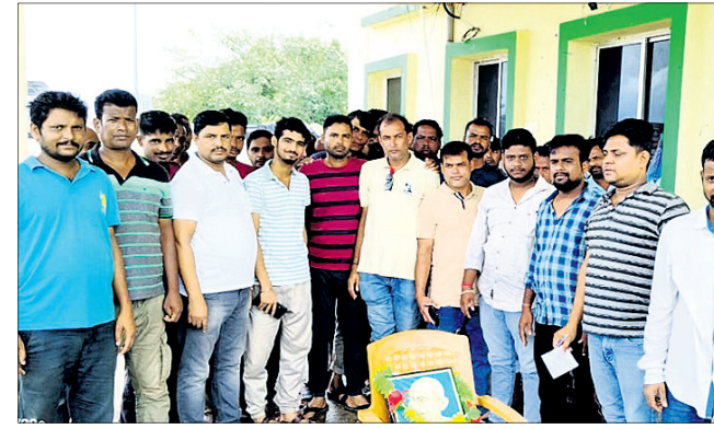
ଧାରଣାରେ ଟୋଲ୍‌ପ୍ଲାଜା କର୍ମଚାରୀମାନେ ।