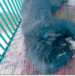
କେନ୍ଦୁଝର, ୧୯୭ (ନରେଶ ଚନ୍ଦ୍ର ପଟ୍ଟନାୟକ)

କେନ୍ଦୁଝର ସଦର ରେଞ୍ଜି ଅନ୍ତର୍ଗତ ମଇଦାନକେଲ ସେକ୍ଟରର ବାରଖଣ୍ଡା ହ୍ରଦରୁ ବନ ବିଭାଗ ଏକ ଅସୁସ୍ଥ ଭାଲୁ ଉଦ୍ଧାର କରିଛି । ତେବେ ଭାଲୁର ଆଭ୍ୟନ୍ତରୀଣା କ୍ଷତ ଥିବା ସତ୍ତ୍ୱେ ଏହାକୁ ଚିକିତ୍ସା ପାଇଁ ନନ୍ଦନକାନନକୁ ପଠାଯିବ ବୋଲି ବନ ବିଭାଗ ସୂଚନା ଦେଇଛି । ଶୁକ୍ରବାର ସକାଳେ ଭାଲୁ ଉଦ୍ଧାର ହୋଇ ଯନ୍ତ୍ରଣାରେ ଛତ୍ରପତ ହେଉଥିବା ନେଇ ଗ୍ରାମବାସୀ ବନ ବିଭାଗକୁ ଜଣାଇଥିଲେ । ବନ କର୍ମଚାରୀମାନେ ପହଞ୍ଚି ଲାଲ୍ ବିଛାଇ ଭାଲୁକୁ ଉଦ୍ଧାର କରି ଉତ୍ତର ଗାଡ଼ିରେ ସଦରରେଞ୍ଜି କାର୍ଯ୍ୟାଳୟକୁ ଆଣି ଚିକିତ୍ସା କରିଥିଲେ । ଭାଲୁଟିର ବୟସ ୧୫ ବର୍ଷ ହେବ ବୋଲି ବନ ବିଭାଗ ସୂଚନା ଦେଇଛି ।