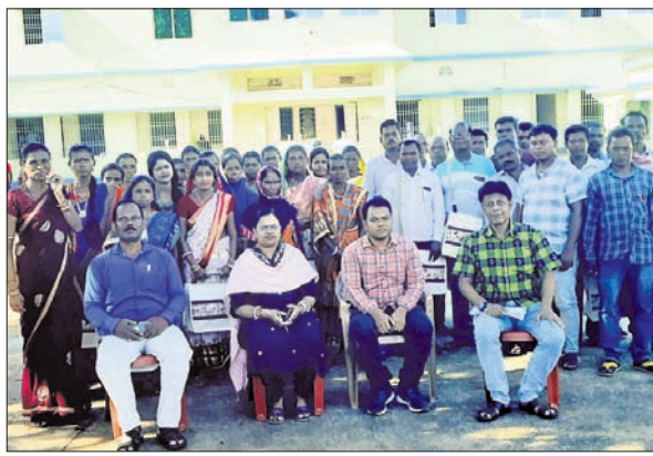
ପ୍ରଶିକ୍ଷକ ସହ ତାଲିମ୍ ନେଇଥିବା ଖାର୍ଚ୍ଚସଭାସଭ୍ୟ ।

ଉଦ୍ୟମରେ ଶିବିର ଆୟୋଜିତ ହୋଇଥିଲା । ୨୦ ପଞ୍ଚାୟତର ଖାର୍ଚ୍ଚ ସଦସ୍ୟ ପ୍ରଶିକ୍ଷଣ ନେଇଛନ୍ତି । ଖାର୍ଚ୍ଚସଭାମାନଙ୍କ ଭୂମିକା, ଦାୟିତ୍ୱ, ବିଭିନ୍ନ ଯୋଜନାରେ ସକ୍ରିୟ ସହଭାଗିତା ଓ ସେବା ପ୍ରଦାନର ମାର୍ଗଦର୍ଶିକା ଉପରେ ତାଲିମ୍ ପ୍ରଦାନ କରାଯାଇଛି । କୃଷିମୂଳକରେ ବିଭିନ୍ନ ଜନସଂସ୍ପର୍ଶକ ଯୋଜନାରେ ସଫଳ ରୂପାୟନରେ ଖାର୍ଚ୍ଚସଭାମାନଙ୍କ ଗୁରୁତ୍ୱପୂର୍ଣ୍ଣ ଭୂମିକା ଗ୍ରହଣ ଉଦ୍ଦେଶ୍ୟରେ ଏହି ଶିବିର ଅନୁଷ୍ଠିତ ହୋଇଥିବା ନୋଡାଲ ଅଧିକାରୀ ବିଭିନ୍ନ ଦାୟିତ୍ୱ ନିର୍ଦ୍ଧାରଣ କରିଛନ୍ତି ।