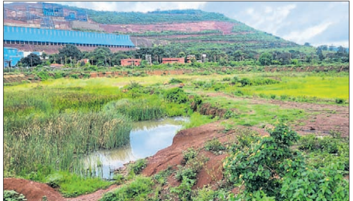
କାମ ନ ହୋଇ ଅଧାପଡ଼ିଆ ଅବସ୍ଥାରେ ଥିବା ଖୋଳା ।

କେନ୍ଦୁଝର ଜିଲ୍ଲା ଯୋଡ଼ା ପଞ୍ଚାୟତ ଅଧୀନ ୧୧୯୯୦. ଖାର୍ଚ୍ଚରେ ଏକ ବୃହତ୍ ଯୋଗରୀ ଖୋଳା କାମ ଅଧାପଡ଼ିଆ ହୋଇ ପଡ଼ିଛି। ଏହି ଖାର୍ଚ୍ଚ କମାରଯୋଡ଼ା ଏବଂ ବାଂଶପାଣିର ମଧ୍ୟଭାଗରେ ଥିବା ୧୧୯୯୯୦.୬୮ ଡିସିମିଲ ପରିମିତ ଜମିରେ ୨୦୧୯-୨୦ ଆର୍ଥିକ ବର୍ଷରେ ଓଡ଼ିଶା ମାଲିକ ବିଭାଗ (ଓମିବି) ଅନୁମୋଦନରେ ୬ କୋଟି ୩୯ ଲକ୍ଷ ବ୍ୟୟ ଅଟକଳରେ ଯୋଗରୀ ଖୋଳା ଆରମ୍ଭ ହୋଇଥିଲା ।