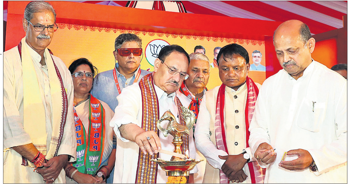
ପୁରୀଠାରେ ଭାଜପା ଚଳାଚଳ ପୁରୀର ରାଜ୍ୟ ପରିବର୍ଦ୍ଧିତ କାର୍ଯ୍ୟକାରୀତା ବୈଠକକୁ ପ୍ରଦାନ ପ୍ରସ୍ତୁତ କରି ଉଦ୍‌ଘାଟନ କରୁଛନ୍ତି ରାଷ୍ଟ୍ରୀୟ ଅଧ୍ୟକ୍ଷ ଜେ.ପି. ନନ୍ଦା। ନିକଟରେ ଅଛନ୍ତି ମୁଖ୍ୟମନ୍ତ୍ରୀ ମୋହନ ଚରଣ ମାଝୀ, ଉପମୁଖ୍ୟମନ୍ତ୍ରୀ ଜେ.ଭି. ସିଂଦେଓ, ପ୍ରଭାତୀ ପରିଡ଼ା, ରାଜ୍ୟ ସଭାପତି ମନମୋହନ ସାମଲ, ପ୍ରଭାତୀ ବିଜୟ ପାଲ ସିଂ ଚୋପାରା ଓ ରାଷ୍ଟ୍ରୀୟ ଉପାଧ୍ୟକ୍ଷ ବୈଜୟନ୍ତ ପଣ୍ଡା।