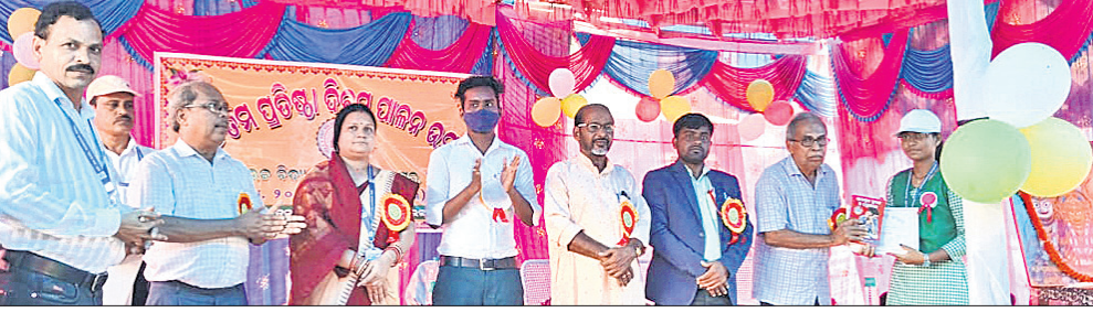
କିଶୋରନଗର ଉଚ୍ଚ ବିଦ୍ୟାଳୟର ପ୍ରତିଷ୍ଠା ଦିବସରେ ଅନୁଷ୍ଠିତ ହେଉଥିବା କାର୍ଯ୍ୟକ୍ରମର ଉଦ୍ଘାଟନା କରୁଥିବା ଅତିଥିମାନେ।