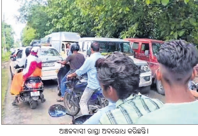
ଅଞ୍ଚଳବାସୀ ରାସ୍ତା ଅବରୋଧ କରିଛନ୍ତି।