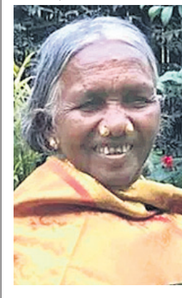
କଟକ/ କନ୍ୟାପୁର, ୨୦୧୭