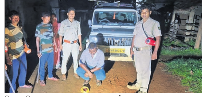
ଗିରଫ ଅଭିଯୁକ୍ତ ଓ ଜବତ ବୋଲେରୋ ସହ ବନ କର୍ମଚାରୀମାନେ।