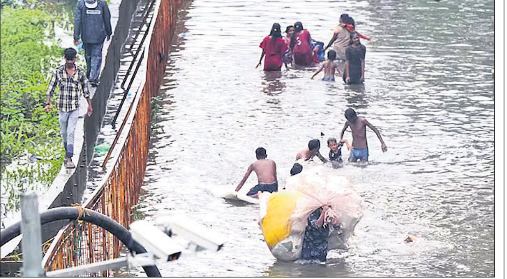
ଲାଗଣ ବର୍ଷା ଯୋଗୁ ମୁମ୍ବାଇର ଏକ ରାସ୍ତାରେ ଅଣ୍ଟାଏ ପାଣି ମଧ୍ୟରେ ଲୋକେ ଯାଉଛନ୍ତି।

ଗତ ୩ ଦିନ ଧରି ମୁମ୍ବାଇରେ ଲାଗଣ ବର୍ଷା ଯୋଗୁ ସହରର ବହୁ ଅଞ୍ଚଳରେ ଜଳମଗ୍ନ ସ୍ଥିତି ଦେଖାଯାଇଛି। ମୁମ୍ବାଇ ଓ ଏହାର ଆଖପାଖ ସହର ଯଥା ପୁଣେ, ଠାଣେ ଓ ପାଲଘରକୁ ଆସିବା ୨୪ ଘଣ୍ଟା ମଧ୍ୟରେ ପ୍ରବଳ ଭାବେ ପ୍ରବଳ ବର୍ଷା ନେଇ ମହାବାସ୍ତୁ ରାଜ୍ୟ ପାଣିପାଗ ବିଭାଗ ଅନୁମତି ଖୁବ୍ ଛାଡ଼ି କରୁଛି। ଶୁକ୍ରବାର ମଧ୍ୟ ମୁମ୍ବାଇରେ ହାରାହାରି ୭୮ ମିମି ବର୍ଷା ରେକର୍ଡ୍ ହୋଇଥିବାବେଳେ ପୂର୍ବ ଓ ପଶ୍ଚିମ ମୁମ୍ବାଇରେ ଯଥାକ୍ରମେ ୫୭ ଓ ୬୬ ମିମି ବର୍ଷା ରେକର୍ଡ୍ ହୋଇଛି। ସେହିପରି କେତେକ ପ୍ରମୁଖ ରାସ୍ତା ଓ ରେଳ ଟ୍ରାକରେ ପାଣି ଜମା ହୋଇଥିବାରୁ ମୁମ୍ବାଇର ସାଧାରଣ ପରିବହନ ବ୍ୟବସ୍ଥା ବାଧାପ୍ରାପ୍ତ ହୋଇଛି। ଶନିବାର ଲାଗଣ ବର୍ଷା ଯୋଗୁ ମୁମ୍ବାଇର ସ୍ଥାନୀୟ ଟ୍ରେନ୍‌ଗୁଡ଼ିକ ୧୫ରୁ ୨୦ ମିନିଟ୍ ବିଳମ୍ବରେ ଯାତାୟତ କରୁଛି। ସେହିପରି ସହରରେ ଯାତ୍ରୀମାନଙ୍କ ପେଷଣାକୁ କୁହାଯାଉଥିବା ଅନେକ ଓ ମାଲ୍‌ସ୍ ଛୁଟକ ମାର୍ଗରେ ପାଣି ଜମିଥିବାରୁ ସଡ଼କ୍‌ଟା ଦୃଷ୍ଟିରୁ ଏହାକୁ ବନ୍ଦ କରାଯାଇଛି।