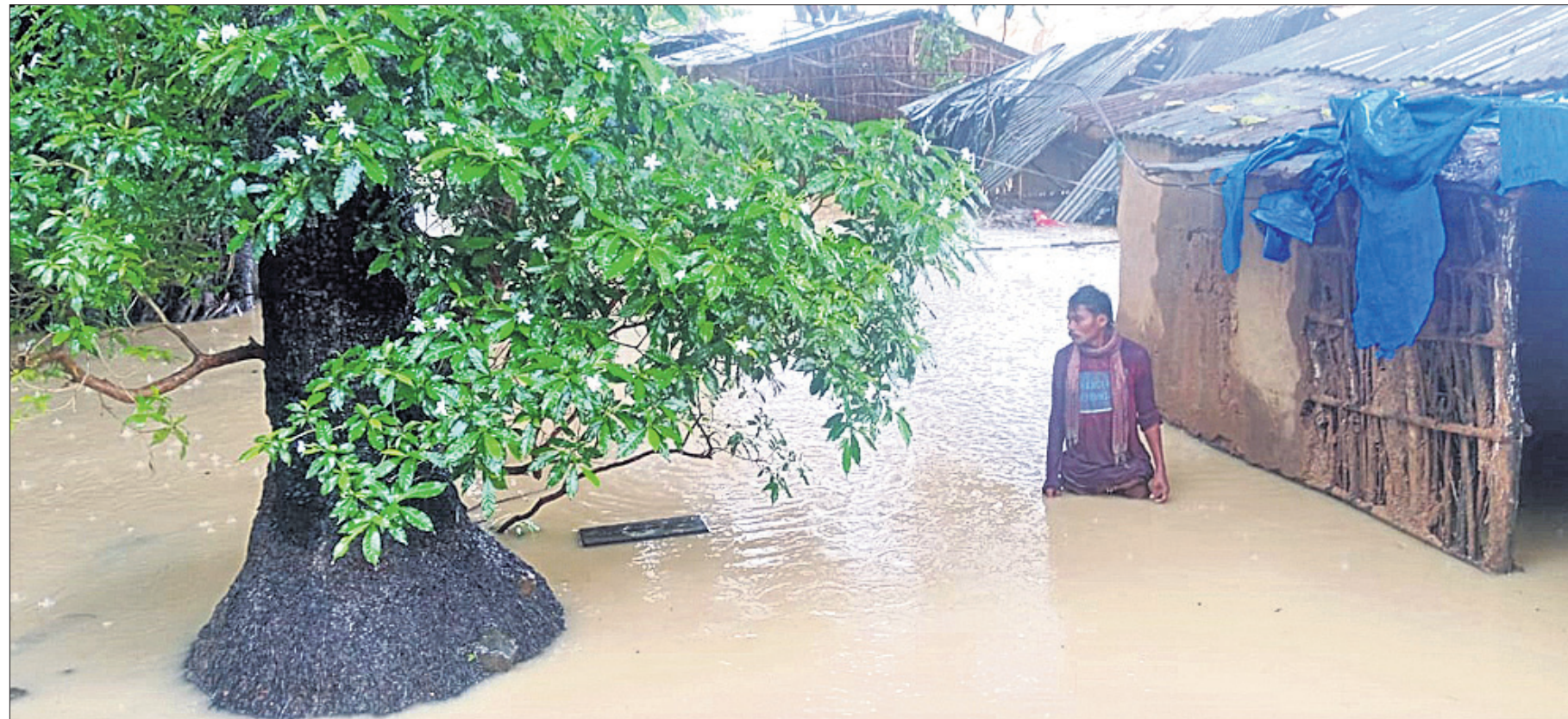
ମାଲକାନଗିରି ପୌରପରିଷଦ ଅନ୍ତର୍ଗତ ୭ ନଂ. ଖୁର୍ଦ୍ଦରେ ଶନିବାର ଘର ଭିତରେ ପଶିଥିବା ବର୍ଷା ଜଳ ।