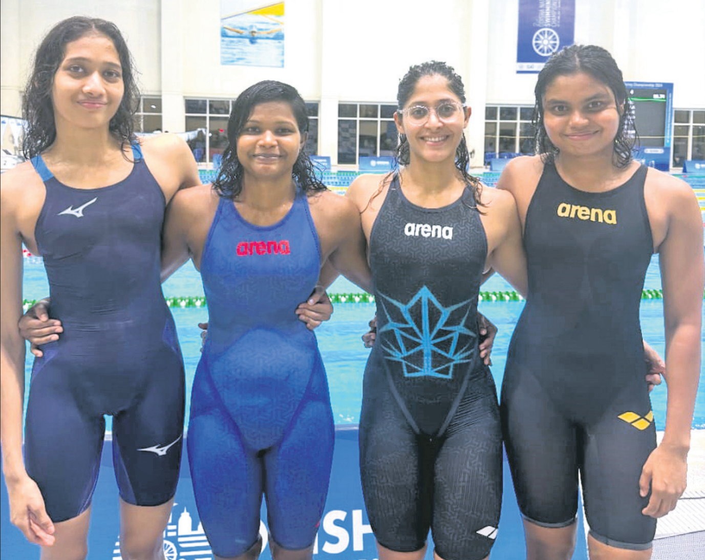
ସ୍ୱର୍ଣ୍ଣ ପଦକ ବିଜୟୀ ୪x୨୦୦ ମିଟର ମହିଳା ରିଲେ ଦଳ।