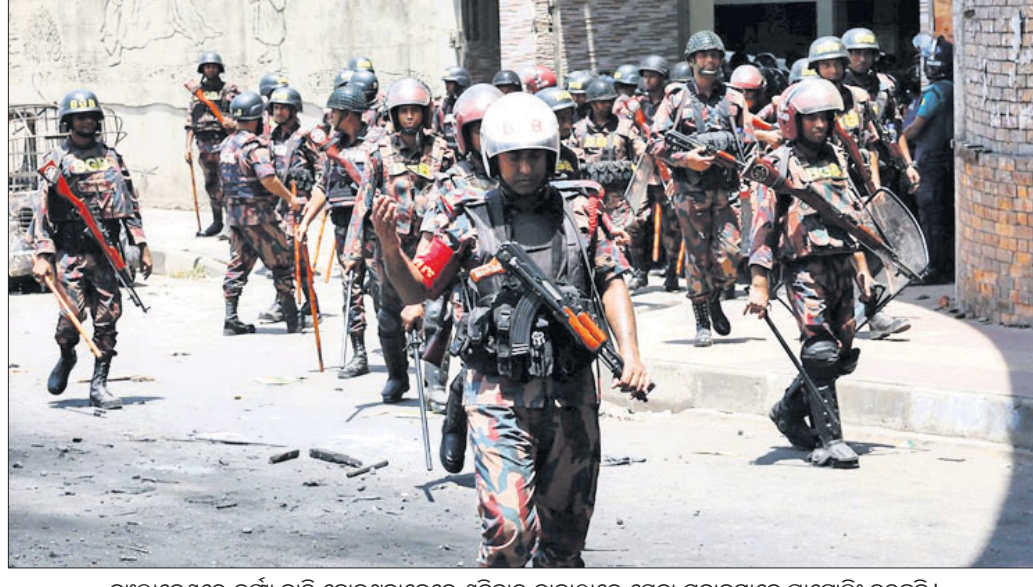
ବାଲାଦେଶରେ କର୍ମ୍ପୁ ଛାଡ଼ି ହୋଇଥିବାବେଳେ ଶନିବାର ଭାକାଠାରେ ସେନା ଯବାନମାନେ ପାଟ୍ରୋଲିଂ କରୁଛନ୍ତି।

ବାଲାଦେଶର ସରକାରୀ ନିୟନ୍ତ୍ରଣରେ ସଂରକ୍ଷଣ ବ୍ୟବସ୍ଥାରେ ସଂଘାର ଦାବିରେ ଆନ୍ଦୋଳନ ଉତ୍ତର ହେବାରେ ଲାଗିଛି। ଆନ୍ଦୋଳନକାରୀ ଓ ପୋଲିସ୍ ମଧ୍ୟରେ ସଂଘର୍ଷ ଘଟି ଇତିମଧ୍ୟରେ ୧୧୫ ଜଣଙ୍କ ଜୀବନ ଯିବା ସହ ବହୁସଂଖ୍ୟାରେ ଆହତ ହେଲେଣି। ଉତ୍ତର ଆନ୍ଦୋଳନକାରୀ