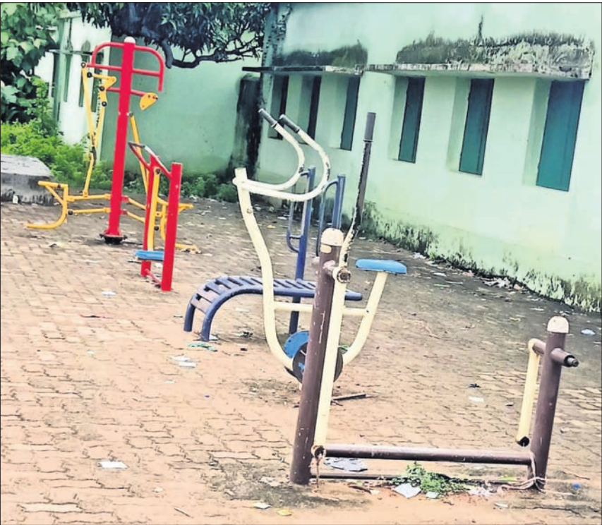
ରକ୍ଷଣାବେକ୍ଷଣ ଅଭାବରୁ ବ୍ୟାୟାମଶାଳା ଉପକରଣ ଭାଙ୍ଗିରୁଜି ଯାଇଛି।