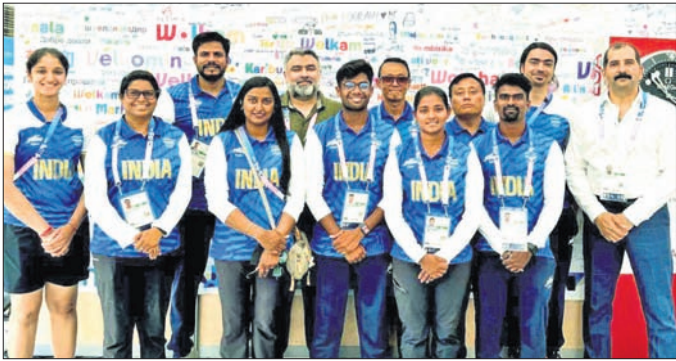
ଅଲିମ୍ପିକ୍ସ ଗେମ୍ସ ଭିଲେଜରେ ପହଞ୍ଚିବା ପରେ ଭାରତୀୟ ଆର୍ଟେରୀ ଦଳ।

ରହିଥିବା ଗ୍ରୀନ ନାରଙ୍ଗ ଏ ସମ୍ପର୍କରେ ସୂଚନା ଦେଇଛନ୍ତି। ପ୍ରଥମ ଭାରତୀୟ ଦଳ ଭାବରେ ଆର୍ଟେରୀ ଓ ରୋଲ୍ ଦଳ ପହଞ୍ଚିଥିବା ବେଳେ ଭାରତୀୟ ହକି ଦଳ ଶନିବାର ବିଳମ୍ବିତ ରାତ୍ରିରେ ପହଞ୍ଚିବେ ବୋଲି ନାରଙ୍ଗ ସୂଚନା ଦେଇଛନ୍ତି। ବର୍ତ୍ତମାନ ଭାରତୀୟ ହକି ଦଳ ନେତୃତ୍ୱାରେ ଏହାର ପ୍ରସ୍ତୁତି ଶିବିର ଜାରି ରହିଛି। ଚିତ୍ ପିଣ୍ଡନ ରହିଥିବା