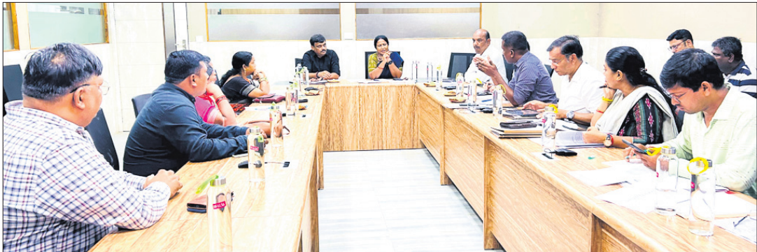
ବୈଠକରେ ଉପସ୍ଥିତ ଅଧିକାରୀ ଏବଂ ଅନ୍ୟମାନେ।

ଭୁବନେଶ୍ୱରରେ ଅଏଲ ଇଣ୍ଡିଆ ପକ୍ଷରୁ ୨୦୦ ଟନ୍ ବିଶିଷ୍ଟ ବାୟୋମିଥେନ ପ୍ଲାଣ୍ଟ ପ୍ରତିଷ୍ଠା ହେବ। ଆବଶ୍ୟକ ପଡିଲେ ଆଉ ୧୦୦ ଟନ୍ ବିଶିଷ୍ଟ ବାୟୋମିଥେନ ପ୍ଲାଣ୍ଟ ପ୍ରତିଷ୍ଠା ପାଇଁ ମଧ୍ୟ ଯୋଜନା ରହିଛି। ଖୁବ୍‌ଶୀଘ୍ର ଏନେଇ ପଦକ୍ଷେପ ଗ୍ରହଣ କରାଯିବ ବୋଲି ବିଏମ୍‌ସି ପକ୍ଷରୁ ସୂଚନା ଦିଆଯାଇଛି। ଶନିବାର ବିଏମ୍‌ସି ମୁଖ୍ୟାଳୟରେ ଅନୁଷ୍ଠିତ ସାମ୍ବନ୍ଧୀୟ ପରିମଳ ଶ୍ଯାଣ୍ଟି କମିଟି ବୈଠକରେ ଏହି ନିଷ୍ପତ୍ତି ନିଆଯାଇଛି। ସେହିପରି ସହରରେ ବୁଲୁ କୁକୁର, ବିଲେଇ ଏବଂ ସ୍ତ୍ରୀ ଗୁଡିକ ସରକାରଙ୍କ ଉପରେ ସମ୍ପର୍କିତ ଦେଇଛନ୍ତି। ମହାପ୍ରଭୁଙ୍କ ନାମାନ୍ତ୍ରୀ ବିଜେ ଶେଷ ହେବାପରେ ମୁଖ୍ୟମନ୍ତ୍ରୀ ଶ୍ରୀମନ୍ଦିର ଆସି ରତ୍ନସିଂହାସନରେ ଶ୍ରୀବିଗ୍ରହଙ୍କୁ ଦର୍ଶନ କରି ରାଜ୍ୟର ପୁଣ୍ୟସମ୍ପଦ ନିମନ୍ତେ ମହାପ୍ରଭୁଙ୍କୁ ନିକଟରେ ପ୍ରାର୍ଥନା କରିଛନ୍ତି। ଏସଂସ୍ଥା ଆଇନ ଉପାଧ୍ୟକ୍ଷଙ୍କୁ ଦର୍ଶନ କରିବା ସହ ମରାମତି କାର୍ଯ୍ୟ ଆଗାମୀ ଦିନରେ କରିବା ଚେଷ୍ଟା କରାଯିବ। ଏସଂସ୍ଥା ଆଇନ ଉପାଧ୍ୟକ୍ଷଙ୍କୁ ଦର୍ଶନ କରିବା ସହ ମରାମତି କାର୍ଯ୍ୟ ଆଗାମୀ ଦିନରେ କରିବା ଚେଷ୍ଟା କରାଯିବ।