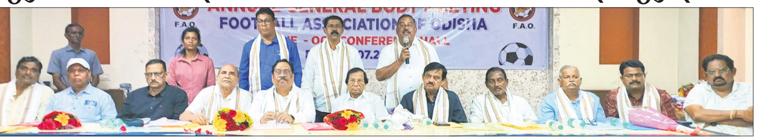
ପୁସ୍ତକ ଆସୋସିଏସନ ଅଫ୍ ଓଡ଼ିଶାର ନବନିର୍ବାଚିତ କର୍ମକର୍ତ୍ତା ଓ ଅନ୍ୟମାନେ।