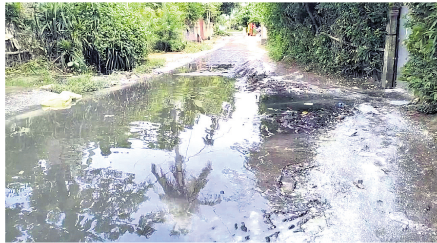
ଗାଁ ଦାଣ୍ଡରେ ବର୍ଷା ପାଣି ଜମି ରହିଛି।