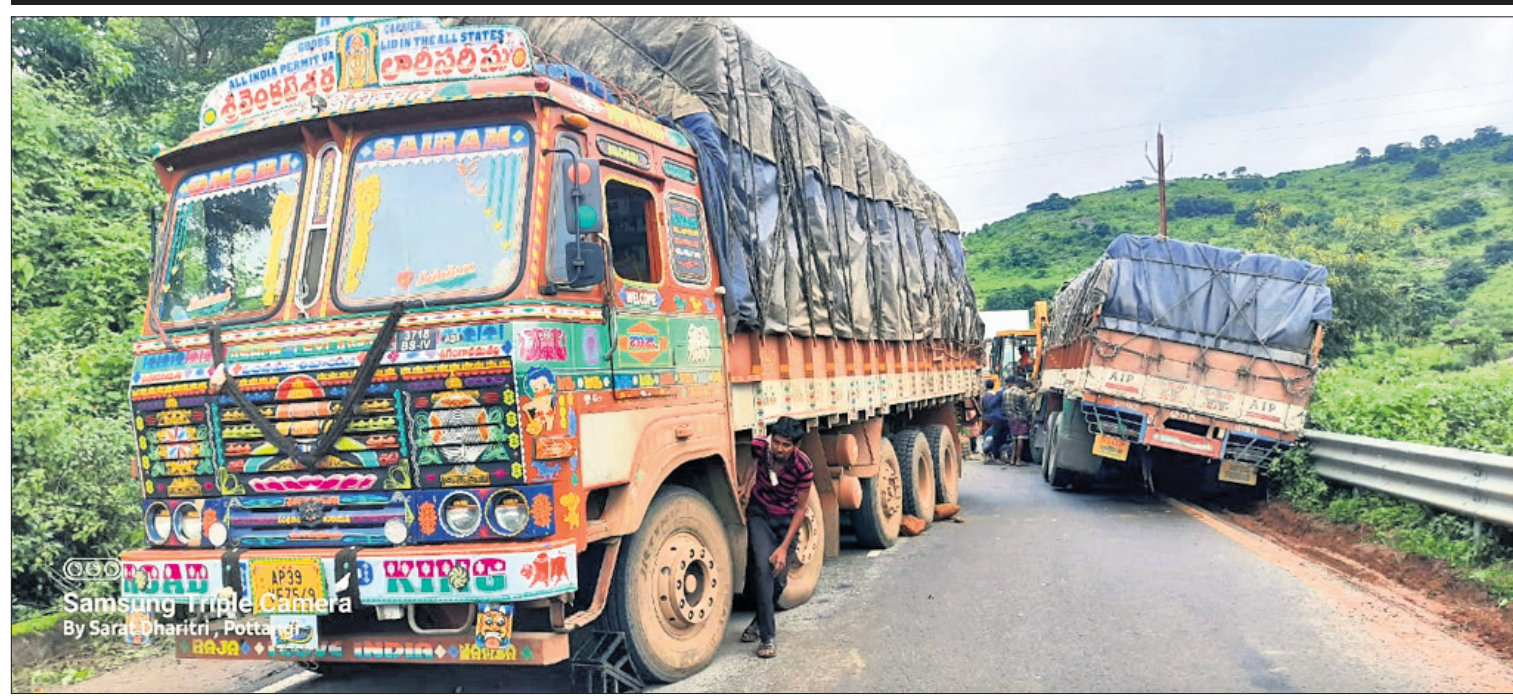
କୋରାପୁଟ ଜିଲ୍ଲା ପାଇଁ ବୁକ୍ ୨୨ ନମ୍ବର ଜାତୀୟ ରାଜପଥର କାର୍ଯ୍ୟର ଘାଟିରେ ରବିବାର ପୂର୍ବରୁ ଅତିରିକ୍ତ ଏକ ଟ୍ରକ୍ ଅନୁପାଳନ ଏକ ଟ୍ରକ୍ ଅତିକ୍ରମ କରିବାବେଳେ କାର୍ଯ୍ୟରେ ଫସିଯାଇଛି। ଫଳରେ ଦୀର୍ଘ ସମୟ ଧରି ଯାତାୟାତ ବାଧାପ୍ରାପ୍ତ ହୋଇଛି।