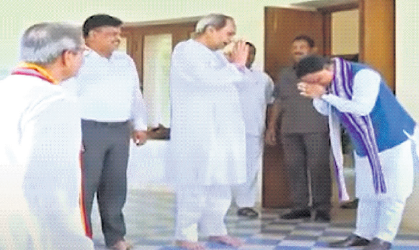
ସପ୍ତଦଶ ବିଧାନସଭାର ବଜେଟ ଅଧିବେଶନ ସୋମବାରଠାରୁ ଆରମ୍ଭ ହେବ । ଏହି ଅବସରରେ ରବିବାର ସର୍ବଦଳୀୟ ବୈଠକ ଅନୁଷ୍ଠିତ ହେବା ପୂର୍ବରୁ ମୁଖ୍ୟମନ୍ତ୍ରୀ ମୋହନ ଚରଣ ମାଝୀ ବିରୋଧୀ ଦଳ ନେତା ନବୀନ ପଟ୍ଟନାୟକଙ୍କୁ ଏଥିରେ ଯୋଗଦେବାକୁ ନିମନ୍ତ୍ରଣ କରିବା ପାଇଁ ଯାଚିଥିଲେ ।